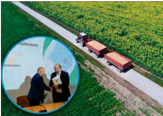
Droga będzie pokryta asfaltem i ma służyć przede wszystkim rolnikom.

Droga będzie pokryta asfaltem i ma służyć przede wszystkim rolnikom, którzy dzięki lepszemu dojazdowi łatwiej dotrą na swoje pola