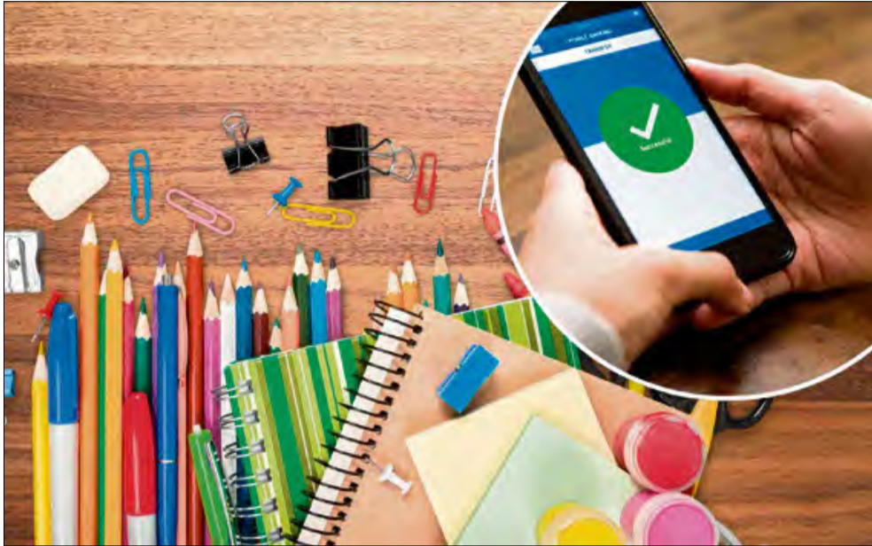
Wnioski na nowy okres świadczeniowy zainteresowani mogą wysłać od 1 lipca do końca listopada.

Od 1 lipca rodzice mogą składać wnioski o wypłatę świadczenia z programu Dobry Start na wyprawkę szkolną dla dzieci. Dodatek w wysokości 300 zł przysługuje na każde uczące się w szkole dziecko w wieku od 7 do 20 lat, a jeśli ma orzeczoną niepełnosprawność, to do ukończenia 24 lat.