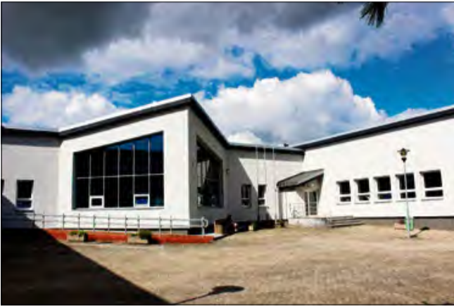
To dość istotna zmiana w systemie organizacji oświaty w gminie Strzeleccki.

Od nowego roku szkolnego Gminny Zespół Ekonomiczno-Administracyjny Szkół w Strzeleczkach będzie obsługiwać nowo powstałe placówki. To skutek wprowadzonych w życie zmian w organizacji jednostek oświatowych w gminie Strzeleccki.