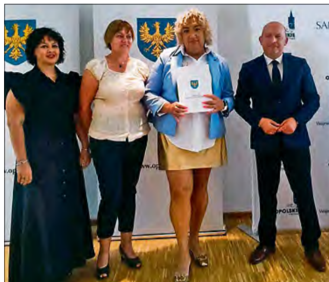
Stowarzyszenie Rozwoju Wsi Ściborowice otrzymało 8 400 zł dotacji z Urzędu Marszałkowskiego w ramach konkursu „Opolskie tradycje dożynkowe”.

Projekt zakłada nie tylko stworzenie strojów, ale też przekazanie wiedzy młodszemu pokoleniu. Wspólnie z sołectwem Ściborowice odbędzie się szkolenie z wyplatania koron żniwnych – symbolu dziękczynienia za