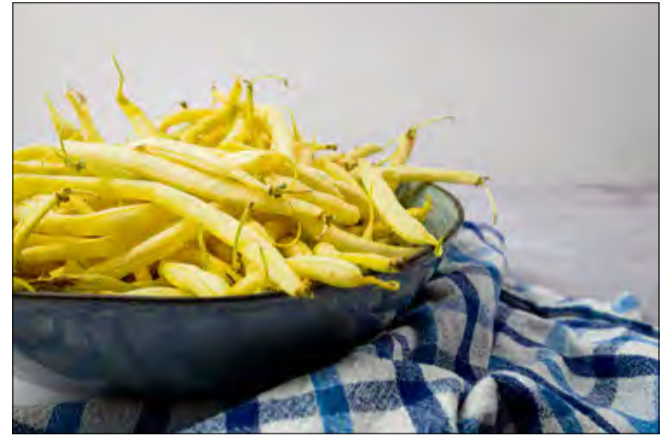
Dieta planetarna jest również nazywana dietą podwójnej wygranej.

samym odporność i ogólne samopoczucie. Korzyści środowiskowe są równie istotne – ograniczenie spożycia produktów odzwierzęcych znacząco zmniejsza emisję gazów cieplarnianych, zużycie wody oraz degradację ekosystemów. Dieta planetarna to także narzędzie w walce z głodem, niedożywieniem i tzw. „ukrytym głodem” – niedoborem witamin i składników mineralnych. Dzięki elastyczności, można ją dostosować do lokalnych tradycji kulinarnych i indywidualnych preferencji, co czyni ją uniwersalną i atrakcyjną. Niemniej, istnieją poważne wyzwania: obecne nawyki żywieniowe Polaków znacznie odbiegają od jej założeń – spożycie mięsa jest zbyt wysokie, a warzyw, owoców i roślin strączkowych zbyt niskie. Dodatkowo, brak wiedzy żywieniowej, dezinformacja w mediach i popularność diet-cud utrudniają wprowadzanie zmian. Problemem globalnym pozostaje także marnotrawstwo żywności, które odpowiada za 8–10% antropogenicznych emisji gazów cieplarnianych. Równie istotne są aspekty etyczne – ogranicze-