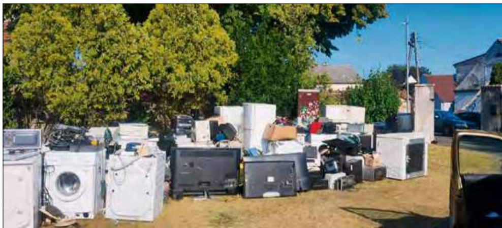
Zebrany sprzęt przekazano na szczytny cel.

W minionym tygodniu mieszkańcy sołectwa Oleszka wzięli udział w zorganizowanej zbiórce zużytego sprzętu elektrycznego i elektronicznego. Akcja spotkała się z dużym zaangażowaniem lokalnej społeczności, dzięki czemu udało się zgromadzić znaczną ilość elektrośmieci.