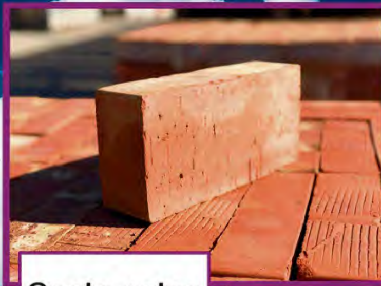
Cegła pełna klasa 25