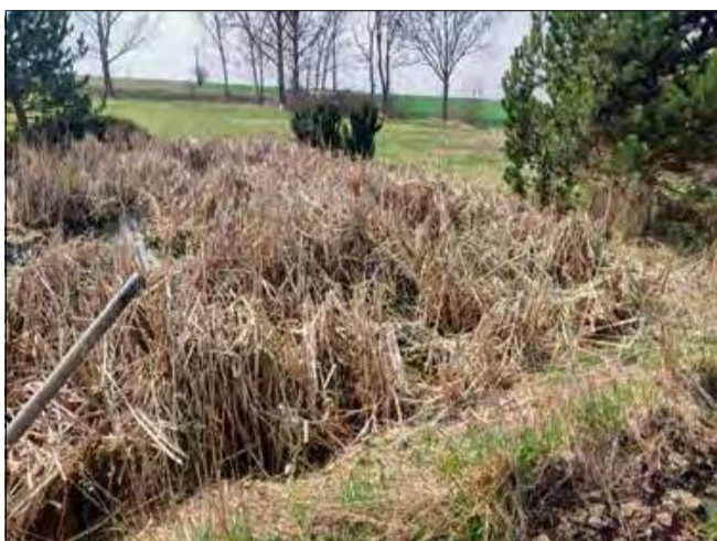
Na zagospodarowanie dwóch stawów gmina otrzymała ponad milion złotych.

o powierzchni 531 m 2 i głębokości do 1,2 metra. Większy zbiornik w Brożcu zajmuje ponad 2 300 m 2 , a jego maksymalna głębokość wyniesie 1,7 metra. Oba stawy będą zasilane wodami opadowymi i gruntowymi – bez konieczności korzystania z usług wodnych – a ich nadmiar zostanie odprowadzony istniejącą siecią melioracyjną.