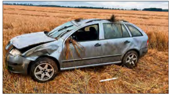
W pojeździe znajdowała się tylko jedna osoba.

Na miejsce zdarzenia zadysponowano cztery zastępy straży pożarnej – dwa z JRG Krapkowice oraz dwa z