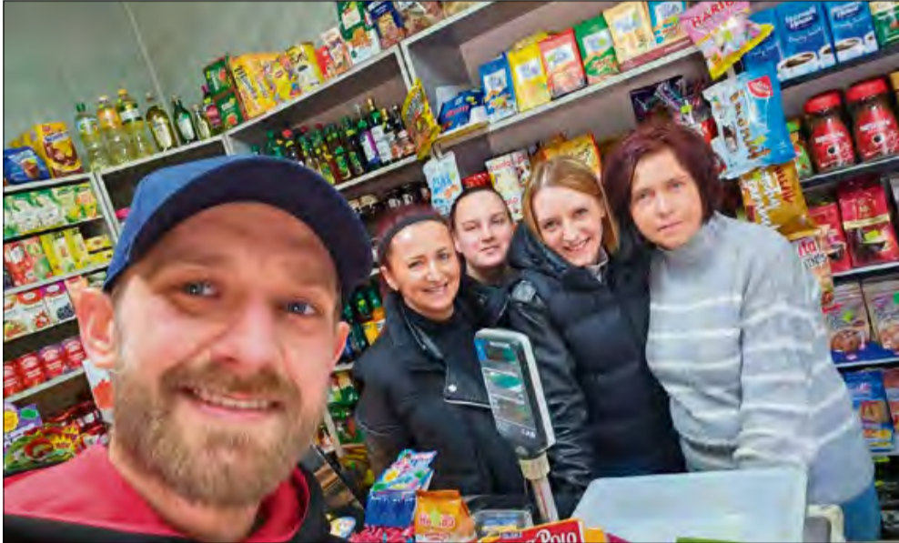
Bardzo miła i sympatyczna załoga otmęckiego warzywniaka.

W czasach, gdy codzienne zakupy coraz częściej robi się w pośpiechu, między regałami wielkopowierzchniowych marketów, są jeszcze miejsca, które działają inaczej - spokojniej i... po ludzku. Takim miejscem jest warzywniak przy ul. Damrota w Otmęcie. Według naszej czytelniczki to punkt, który zasługuje na uwagę.