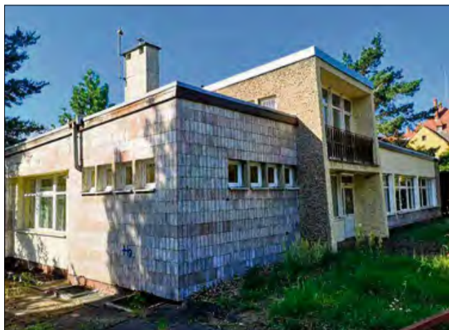
Budynek przy ul. Sądowej od dawna był brany pod uwagę jako potencjalna siedziba klubu seniora.

Długo wyczekiwana inwestycja dla seniorów w końcu nabiera realnych kształtów. W opuszczonym budynku po bibliotece przy ul. Sądowej powstanie nowoczesny klub dla osób starszych i niepełnosprawnych. 7 lipca w Urzędzie Miasta i Gminy w Krapkowicach podpisano umowę z krapkowicką firmą Budopap, która zrealizuje zadanie remontowe.