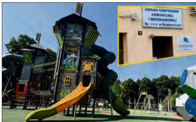
Zakład Gospodarki Komunalnej i Mieszkaniowej w Krapkowicach oficjalnie przejmie administrowanie placami zabaw, siłowniami zewnętrznymi oraz skateparkami.

Podczas ostatniej sesji Rady Miejskiej w Krapkowicach, która odbyła się 26 czerwca, radni podjęli uchwałę dotyczącą zarządzania miejską infrastrukturą rekreacyjną. Na mocy tej decyzji Zakład Gospodarki Komunalnej i Mieszkaniowej Sp. z o.o. w Krapkowicach oficjalnie przejmie administrowanie placami zabaw, siłowniami zewnętrznymi oraz skateparkami znajdującymi się na terenie gminy.