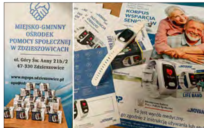
Rozdawane opaski wyposażono w zaawansowane funkcje zwiększające bezpieczeństwo użytkowników.

Inicjatywa jest odpowiedzią na zachodzące w Polsce zmiany demograficzne i ma na celu wsparcie osób starszych, które z powodu wieku lub stanu zdrowia wymagają dodatkowej opieki. Program stanowi element szerszej polityki społecznej państwa skierowanej do seniorów o ograniczonej samodzielności. Rozdawane opaski wyposażono w zaawansowane funkcje zwiększające bezpieczeństwo użytkowników. Urządzenia posiadają przycisk SOS, detektor upadku, czujnik zdjęcia opaski oraz wbudowany lokalizator GPS. Dodatkowo umożliwiają stały kontakt z centrum obsługi i opiekunami, a także monitorują podstawowe parametry życiowe,