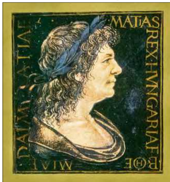
Król Maciej Korwin na portrecie z końca XV wieku. Był panem Śląska, władał nim jednak jako tytularny król Czech, a nie jako król Węgier.

z narodowością. Zdobyte przez Węgra Korwina Śląska oznaczało przejście tegoż pod władzę Węgier i kropka. I rzeczywiście, w otaczającym ich świecie po 1815 roku, miało to pełen sens. Wszak przykładowo przyjęcie przez cesarżową Wiktorię tytułu cesarżowej Indii nie oznaczało przez nią przejścia władzy w państwie indyjskim. Oznaczało