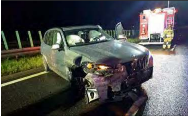
W samochodzie wystrzeliły poduszki powietrzne.

Na krapkowickim odcinku autostrady doszło do niebezpiecznego wypadku z udziałem samochodu osobowego. W wyniku zajścia dwie osoby, w tym jedno dziecko, trafiły do szpitala.