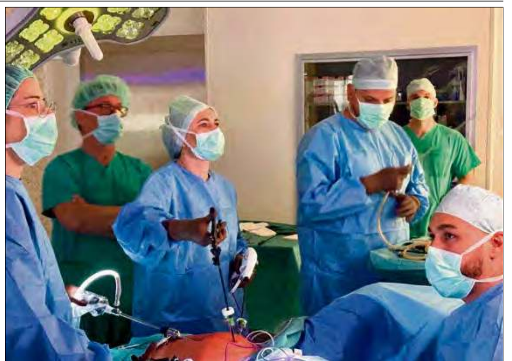
Krapkowicki szpital rozwija małoinwazyjne metody leczenia, dwa pionierskie zabiegi za nami.

Szpital w Krapkowicach nieustannie rozwija swoje możliwości i wyznacza nowe kierunki w lokalnej opiece