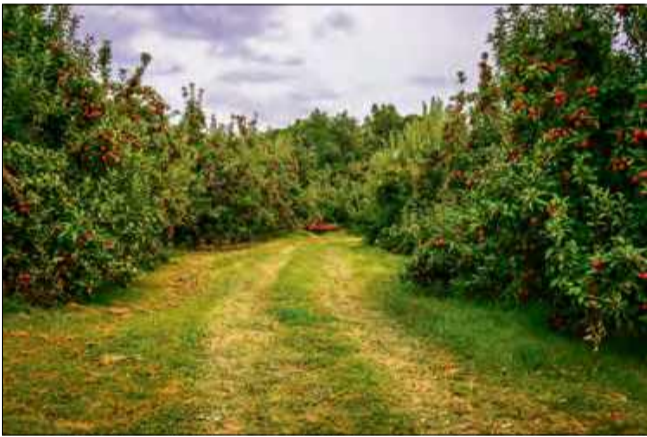
Najlepszym wyborem dla zdrowia i dla planety jest wybieranie produktów lokalnych.

Dieta planetarna promuje zwiększenie spożycia różnorodnych, niskoprzetworzonych produktów roślinnych, jednocześnie ograniczając żywność wysokoprzetworzo-