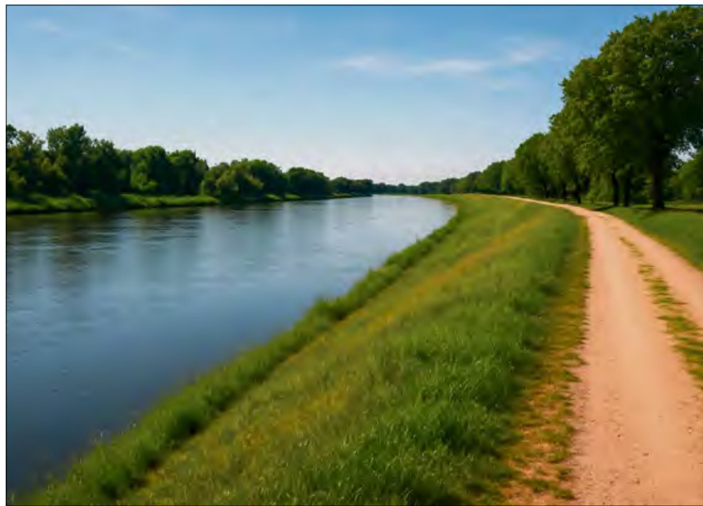
W ramach prac powstanie m.in. nowy nasyp przeciwpowodziowy.