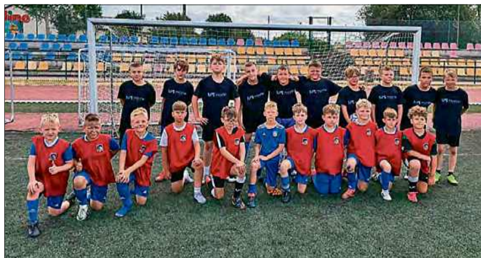
Drużyna Akademii Piłkarskiej KS Otmęt Fans odpoczywała i trenowała w Rewalu.

Pierwszy dzień obozu Akademii Piłkarskiej KS Otmęt Fans w Rewalu rozpoczął się od przyjazdu i zakwaterowania. Po śniadaniu i krótkim odpoczynku uczestnicy skorzystali z pięknej pogody i wybrali się nad Bałtyk. Po południu rozegrali pierwszy sparing, mierząc się z Akademią Orła Żąbkowice Śląskie, dziękując rywalom za sportową walkę.