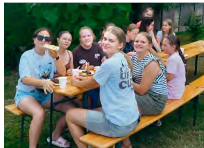
W czasie pikniku najważniejszy był duch integracji i radosnego bycia razem.