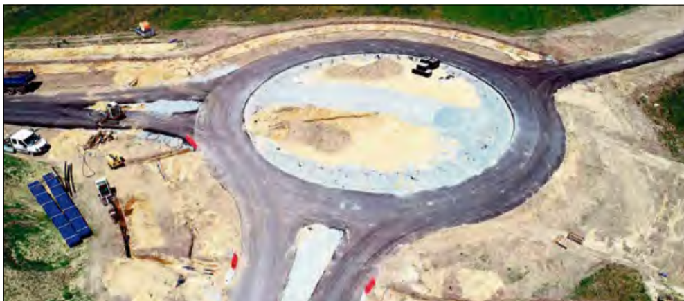
Prace postępują zgodnie z planem.

Trwają prace związane z budową nowej Strefy Aktywności Gospodarczej na gogolińskich „dziółach”. To inwestycja warta kilkadziesiąt milionów złotych.