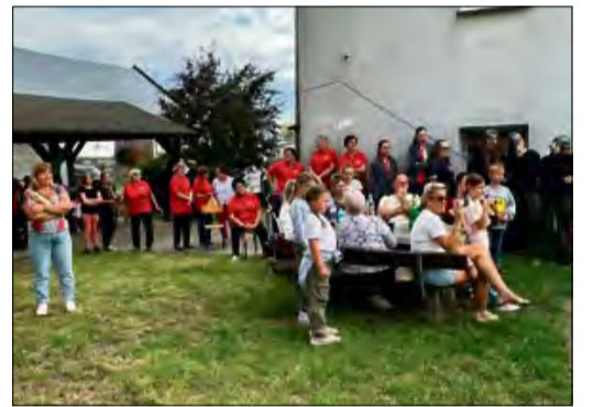
Czy warto organizować takie wydarzenia? Odpowiedź mieszkańców widać było w ich zadowolonych twarzach.

Tegoroczne „Letnie Spotkanie Mieszkańców” pokazało, że dobra atmosfera nie potrzebuje wielkiej sceny ani fleszy. Wystarczy zaangażowanie, trochę muzyki, uśmiechów – i ludzie, którzy chcą być razem.