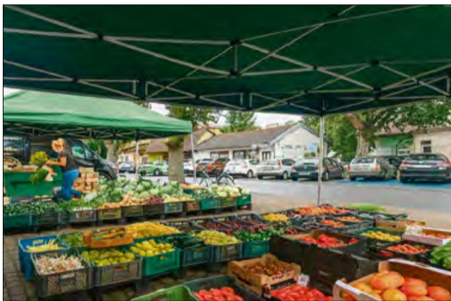
- Niepozorny, ale najlepszy - przyznaje Czytelniczka.

- Codziennie świeże warzywa i owoce, duży wybór sezonowych produktów i miła, obsługa i rodzinna atmosfera. To nie jest anonimowe miejsce. Kiedy wchodzisz, wiedzą, jak masz na imię, pamiętają, co kupowałeś wczoraj, a do tego doradzą, co dziś najlepiej smakuje – mówi z uśmiechem nasza rozmówczyni. – Tu się nie kupuje „czegośkolwiek na szybko”. Kupuje się świadomie i z przyjemnością. W czasach, gdy o lokalnym handlu mówi się najczęściej w kontekście trudności i