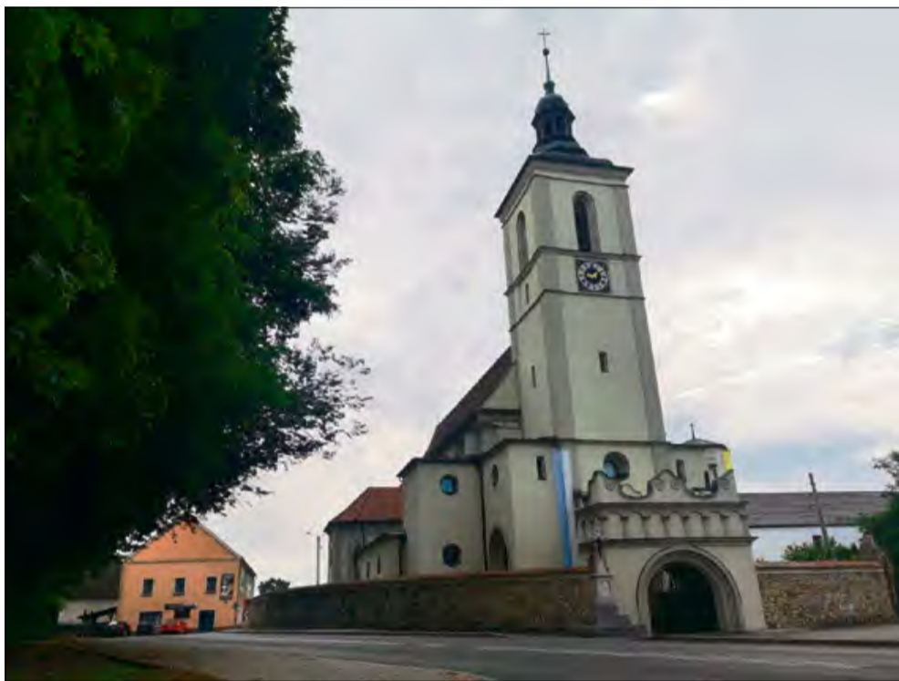
Ponad cztery wieki historii zapisane są w murach kujawskiej świątyni.