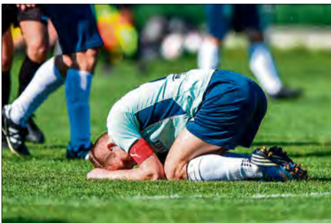
W Raclawiczkach celem na najbliższy sezon jest powrót pierwszej drużyny do klasy okręgowej.