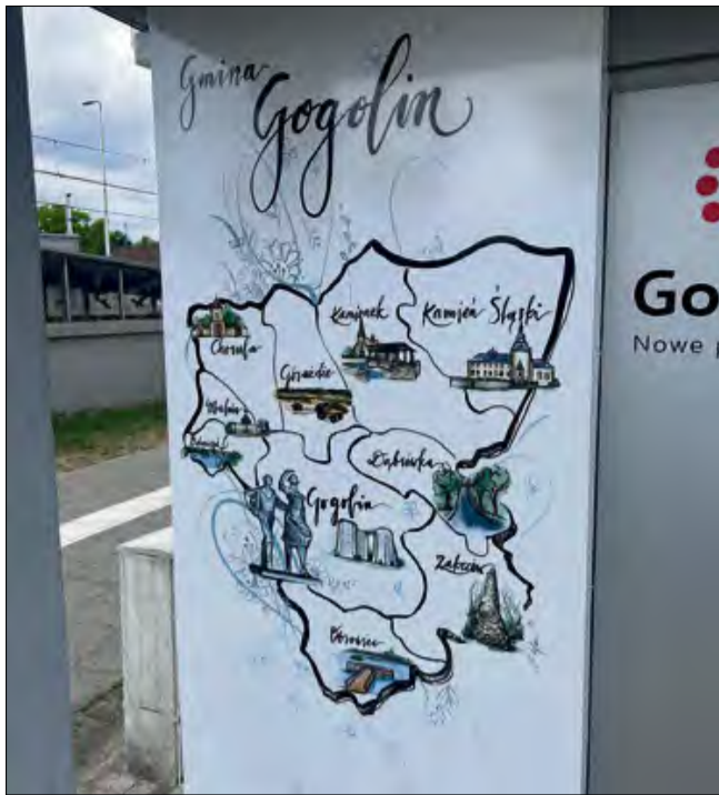
Mapa prezentuje się bardzo estetycznie.