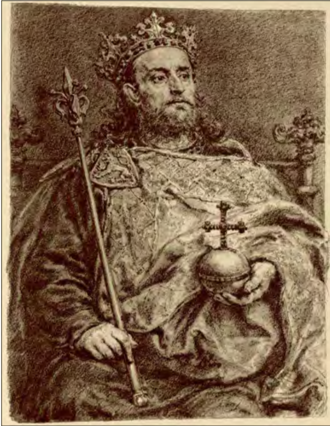
Król Wacław II na portrecie Jana Matejki. Jego panowanie rozpoczęło długotrwały okres zależności naszych terenów od Czech.

Pierwsze pytanie, które wymaga odpowiedzi, to czy wynikała z tego rzeczywista podległość polityczna. W oczach cesarzy rzeczywiście mieliśmy na pewno z taką do czynienia. Nie jest to jednak czynnikiem decydującym. W tekstach z serii „Poczet władców Krapkowic” poruszaliśmy kwestię płacenia „podarunku” dla Imperium Osmańskiego przez cesarzy Maksymiliana II i Rudolfa II. Przez 40 lat sułtan otrzymywał trybut i w związku z