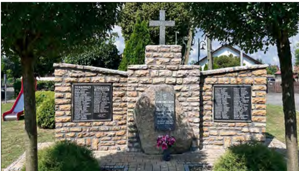
Pomnik został pięknie odnowiony.

Wyremontowano pomnik upamiętniający poległych i zamordowanych podczas I i II wojny światowej w Malni. Dodatkowo teren wokół tego miejsca został uporządkowany dzięki zaangażowaniu rady sołeckiej. Teraz jest czysto i schludnie.