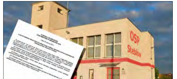
Wspieranie jednostek OSP to priorytet, mający bezpośredni wpływ na bezpieczeństwo lokalnej społeczności.

Będzie zakup nowego samochodu ratowniczo-gaśniczego dla Ochotniczej Straży Pożarnej w Steblowie. Podczas sesji Rady Miejskiej w Krapkowicach 26 czerwca radni podjęli uchwałę o udzieleniu dotacji celowej na ten cel w wysokości 700 tys. złotych.