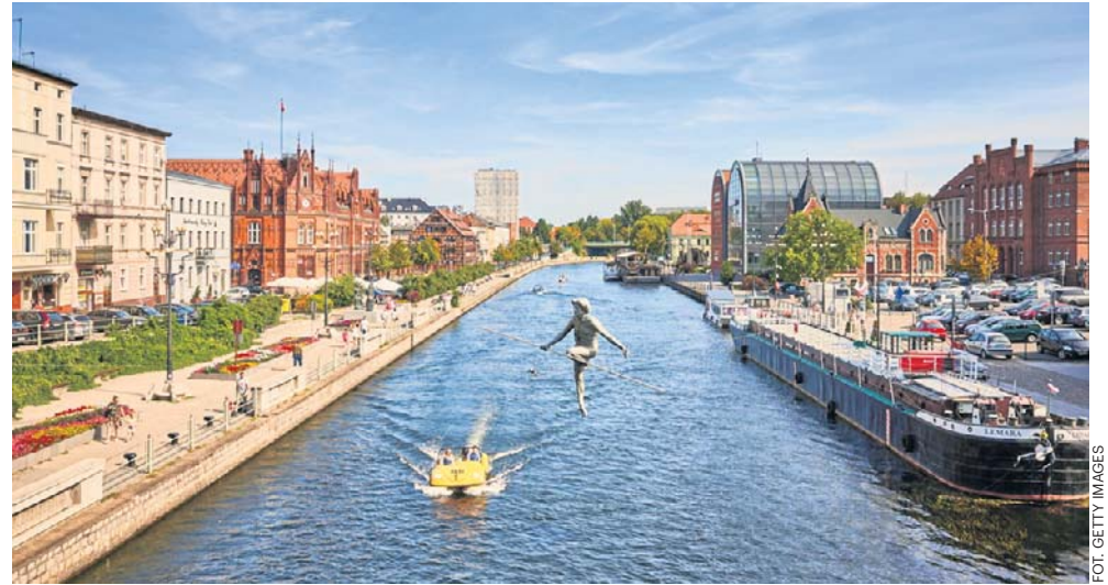
Rzeźba w pobliżu mostu Jerzego Sulimy-Kamińskiego, ukazująca młodzieńca przechodzącego nad Brdą, jest jednym z symboli Bydgoszczy

Wiele atrakcji Bydgoszczy łączy się z wodą – miasto leży w końcu nad dwiema rzekami i tu zaczyna się słynny Kanał Bydgoski. To zabytek hydrotechniki i droga wodna łącząca Wisłę i Odrę przez Brdę, Noteć i Wartę. Dziś na kanale można podziwiać nadal sprawne jazy i śluzy, a także wybrać