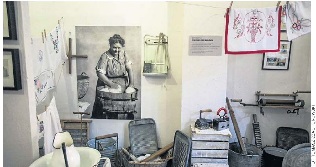
Muzeum Mydła i Historii Brudu mieści się w trzech kamienicach na Starym Mieście

się na rejs turystyczny po jego wodach. Wzdłuż Kanału Bydgoskiego ciągną się planty, czyli rozległy park długi na 3 kilometry i pełen malowniczych ścieżek spacerowych oraz tras rowerowych.