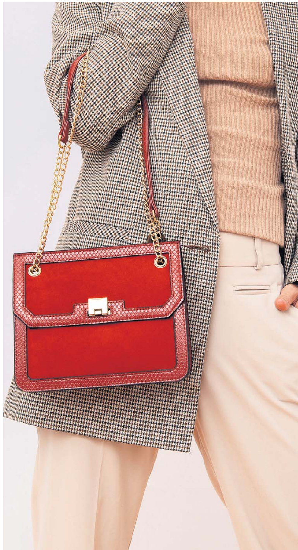
W doborze torebki obowiązuje zasada, by dopasowywać ją do całości stroju, nawiązać do stylu, kolorów oraz sytuacji