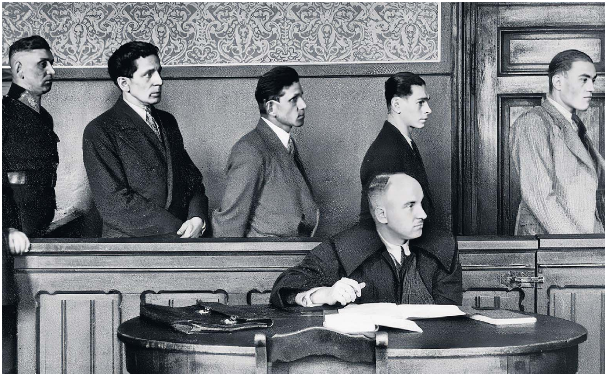
Sąd w Chorzowie. Rozpoczyna się proces sprawców napadu na Bank Ludowy w Świętochłowicach. Lata 30. XX wieku

● Plan napadu przedstawiony w filmie „Vabank” Jerzego Machulskiego powstał naprawdę ● Przedwojennych kasiarzy, lepszych od sławnego „Szpicbródki”, było zdecydowanie więcej ● Jeden ze skoków na bank w szwajcarskiej Bazylei wymagał stworzenia 80-metrowego podkopu