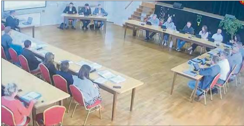
Sesje Rady Miejskiej to forum, na którym radni dyskutują i podejmują decyzje dotyczące wielu ważnych spraw dla lokalnej społeczności.

Z analizy list obecności, które zostały przesłane przez Urząd Miejski w Strzelecz-