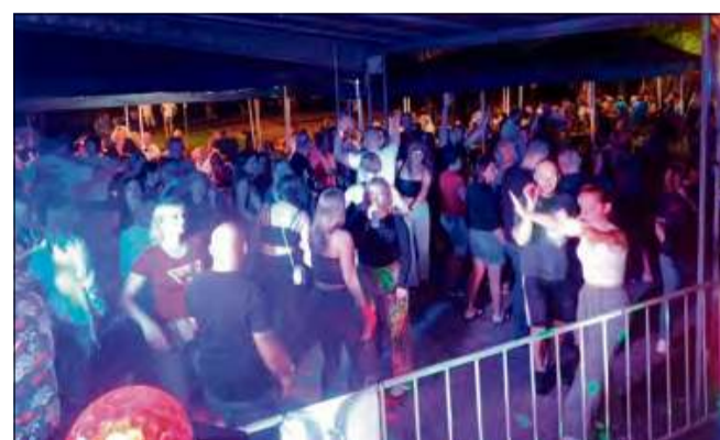
Ci, którzy zdecydowali się przyjść, mogli doświadczyć wyjątkowej atmosfery.

uczestników. Ci, którzy zdecydowali się przyjść, mogli doświadczyć wyjątkowej atmosfery, a ci, którzy opuścili to wydarzenie, z pewnością mają teraz powody do żalu.