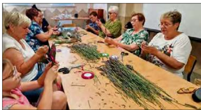
Lawendowe rękodzieło w najlepszym wydaniu.

Celem zajęć było nie tylko rozwijanie zdolności manualnych, ale także wspólne spędzenie czasu i promocja lokalnych roślin. Powstałe ozdoby uczestniczki zabrały do domów – jako pamiątkę i