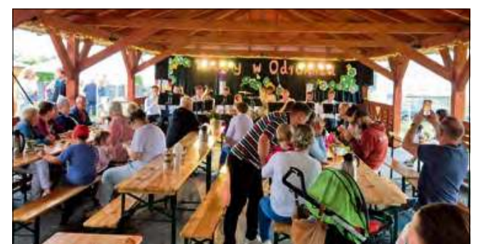
Mieszkańcy chętnie integrowali się pod wiatą na placu wiejskim.

Sporo atrakcji zapewniło również w niedzielę 27 lipca. Przed publicznością wystąpiła orkiestra dęta Glogovia Brass. Był ten emocjonujący pokaz strażacki OSP Odrowąż, zabawy z alpaki, a także walki rycerskie i