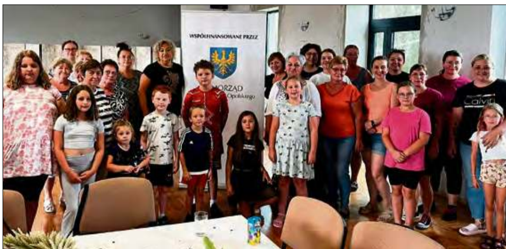
Wydarzenie cieszyło się zainteresowaniem osób w różnym wieku.

Podsumowując wydarzenie, Stowarzyszenie Rozwoju Wsi Ściborowice podziękowało wszystkim uczestnikom