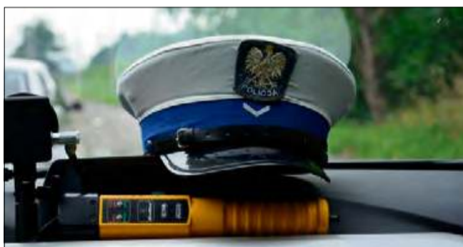
56-latek odpowie za popełnione przestępstwo przed sądem.

W związku z kierowaniem w stanie nietrzeźwości policjanci zatrzymali męż-