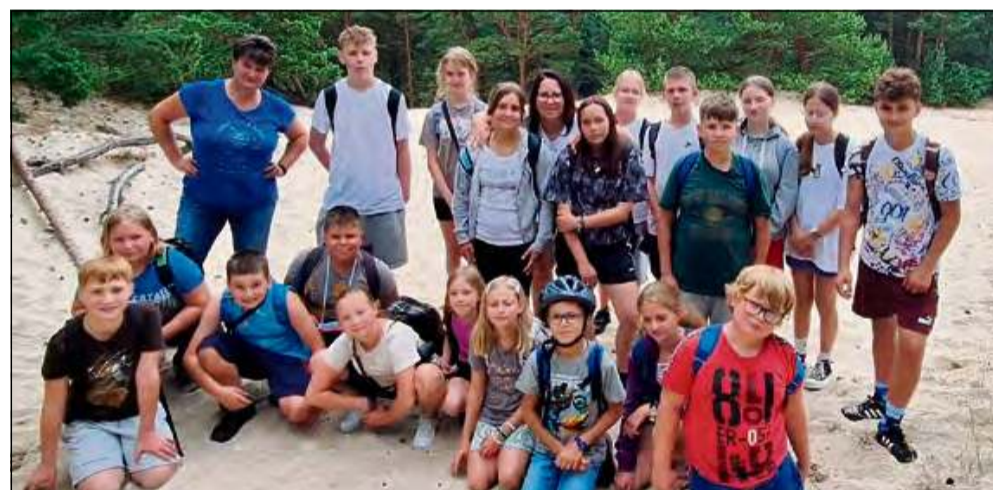
Morze, przygoda i mnóstwo radości.

W dniach 16-23 lipca dzieci z gminy Walce uczestniczyły w letniej kolonii nad morzem, zorganizowanej dzięki współpracy z gminą Kobylnica. Tygodniowy pobyt w Sycewicach wypełnił się atrakcjami kulturalnymi, sportowymi i przyrodniczymi.