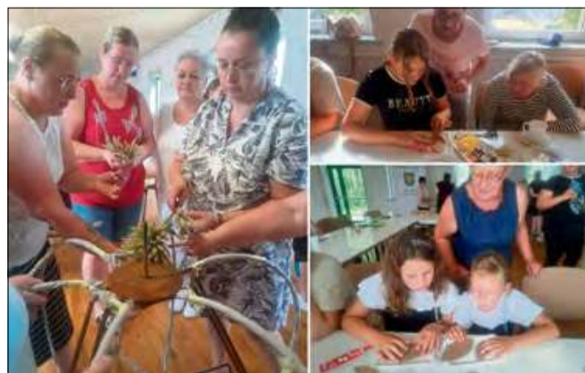
Uczestnicy wydarzenia mieli okazję zgłębić tradycyjne techniki rękodzielnicze pod okiem doświadczonych instruktorów.

(matt), fot. Fb Stowarzyszenie Rozwoju Wsi Ściborowice