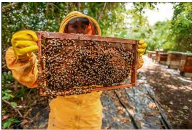
Pszczelarstwo czy apiterapia może być formą ekoterapii.

cytochromowe. Inhalacje tym powietrzem mogą wspomagać leczenie schorzeń dróg oddechowych, takich jak astma, zapalenie oskrzeli czy zwłóknienie płuc. Co ciekawe, u pszczelarzy zaobserwowano wydłużone telomery, co może być związane z czę-