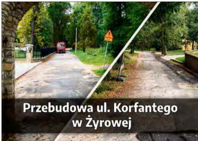
Przebudowa ul. Korfantego w Żyrowej

W związku z prowadzonymi robotami drogowymi władze apelują do kierowców i mieszkańców o zachowanie ostrożności oraz sto-