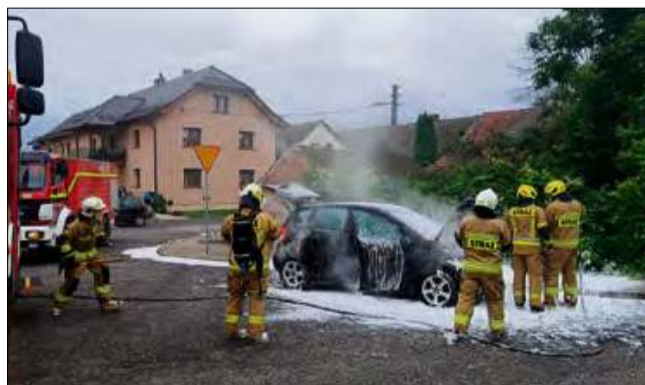
Strażacy szybko uporali się z ogniem.