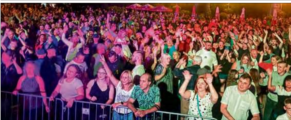
Gogolin zatańczył przy dźwiękach Radia Park.

Plac Benedyktyński w Gogolinie zamienił się w sobotę w tętniący życiem parkiet pod chmurką. Tłumy bawiły się przy hitach serwowanych przez DJ-ów Radia Park!