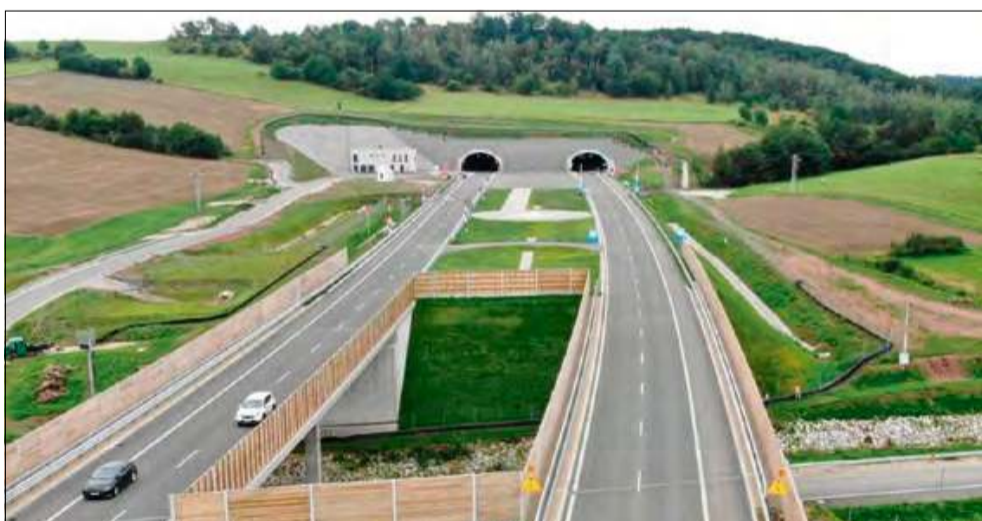
GDDKiA analizuje odważną petycję mieszkańca regionu.

W petycji nie zabrakło również argumentów użyt-