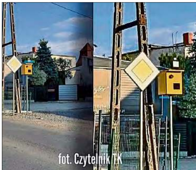
Atrapa sieje postrach...

- Już paru kierowców nagle poczuło się mniej