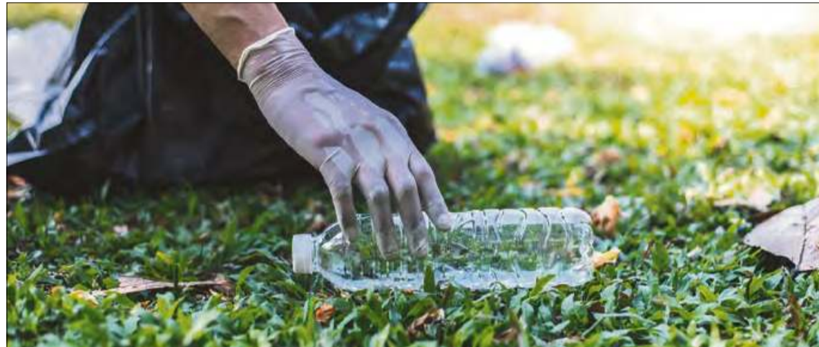
Szklana butelka zwrotna, może zastąpić około 20 butelek jednorazowych.

nas, w kasie w sklepie lub automacie. Ich wyrzucanie stanie się