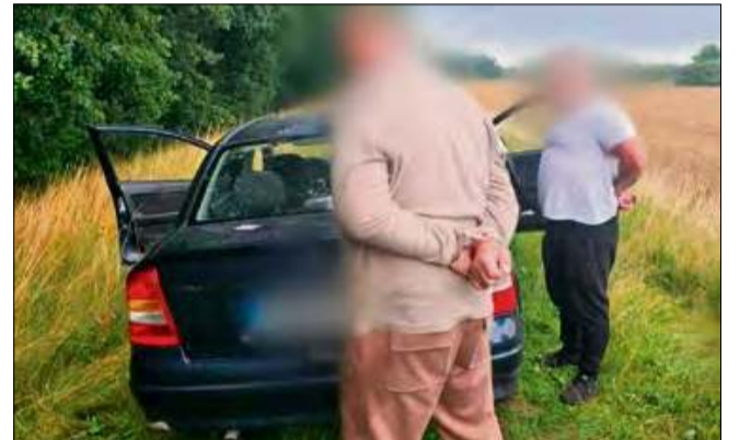
Tym razem opolscy złodzieje nie mieli szczęścia – zdradziły ich nie kamery, nie odciski palców, lecz własne przyzwyczajenia.

Choć samochód był już w rękach policji, tajemnicą pozostawały zaginione elektronarzędzia. Mundurowi wkrótce natrafili na nie w lesie, na terenie innej miejscowości w gminie Krapkowice.