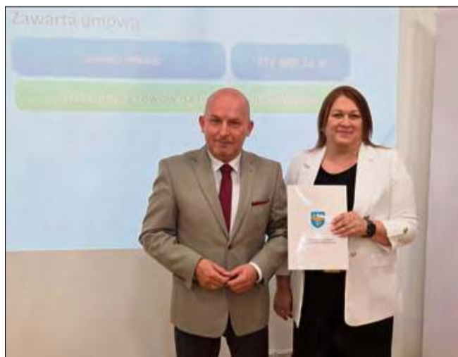
Gmina Walce działa konsekwentnie i z przekonaniem, że woda to dziś jeden z ważniejszych tematów w samorządzie.

Oprócz Walce, wsparcie otrzymały też m.in. gminy Byczyna i Wołczyn. Tam