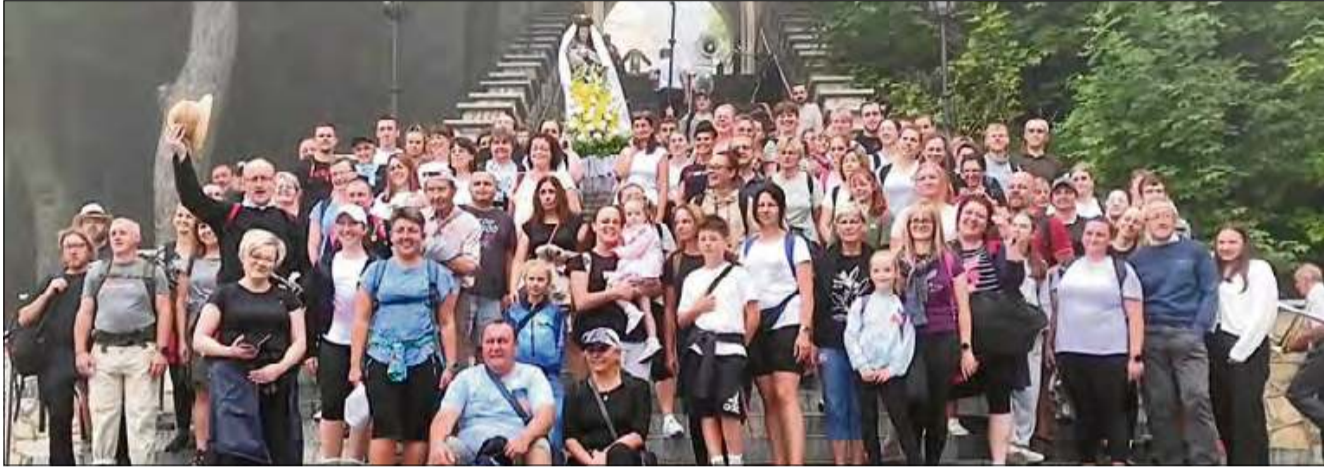
Setka pielgrzymów wzięła udział w dorocznej, już 116. a zarazem 41. parafialnej pieszej pielgrzymce na Górę Św. Anny.

Wczesnym rankiem 27 lipca ponad setka wiernych wyruszyła na doroczną pielgrzymkę na Górę Św. Anny. Tegoroczna 116. edycja wydarzenia była jednocześnie 41. pielgrzymką organizowaną przez parafię w Żywocicach.