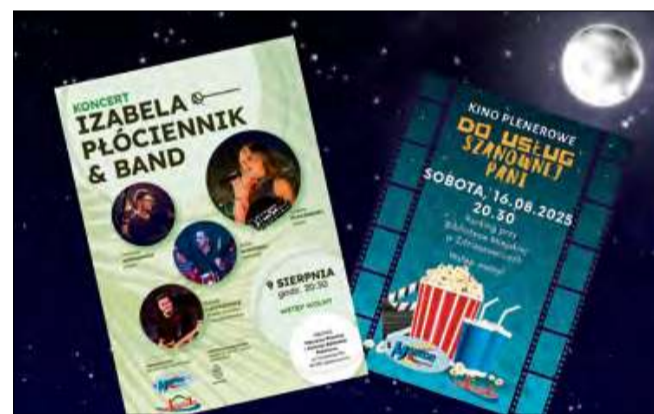
Sierpień w Zdzieszowicach zapowiada się naprawdę wyjątkowo.

Organizatorzy szczególnie podkreślają, że wstęp na wszystkie wydarzenia jest wolny, co stanowi doskonałą okazję do spędzenia letnich