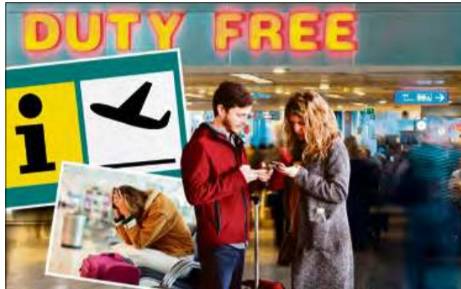
Do Powiatowego Rzecznika Konsumentów wpłynęło już w tym roku kilkanaście zapytań o pomoc w złożeniu reklamacji nienależycie wykonanej usługi turystycznej.

d. jeśli przewoźnik może dowieść, że odwołanie jest spowodowane zaistnieniem nadzwyczajnych okoliczności, których nie można było uniknąć pomimo podjęcia wszelkich racjonalnych środków