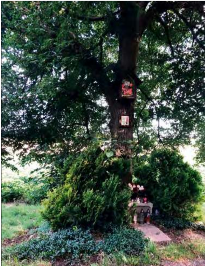
Dolina Świętej Anny to zaciszne miejsce w niemalże bukolicznej scenerii.