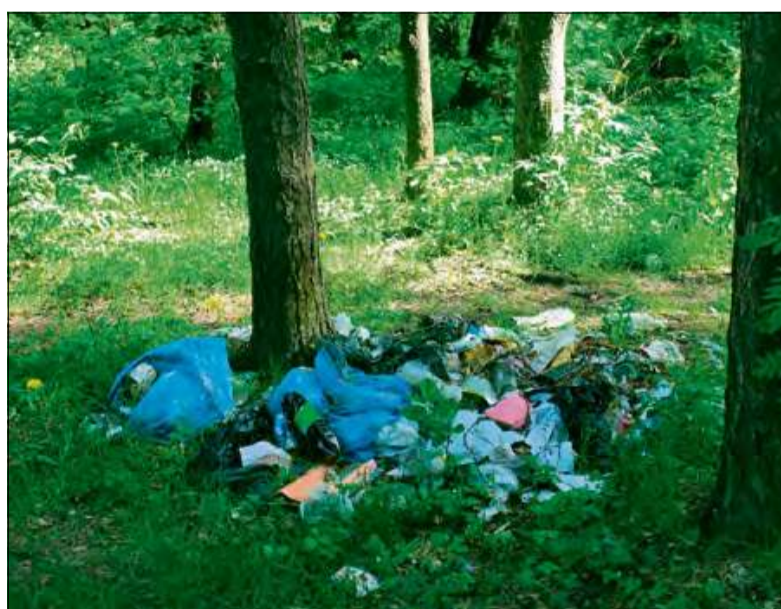
Pod koniec ubiegłego roku wciąż istniało 2 728 nielegalnych składowisk – o 500 więcej niż rok wcześniej.

Powody, dla których ludzie tworzą dzikie wysypiska, są różne. Często to zwykła wygoda – zamiast zawieźć odpady do PSZOK-u (Punktu Selektywnego Zbierania Odpadów Komunalnych), wyrzuca się je w lesie. Innym razem problemem