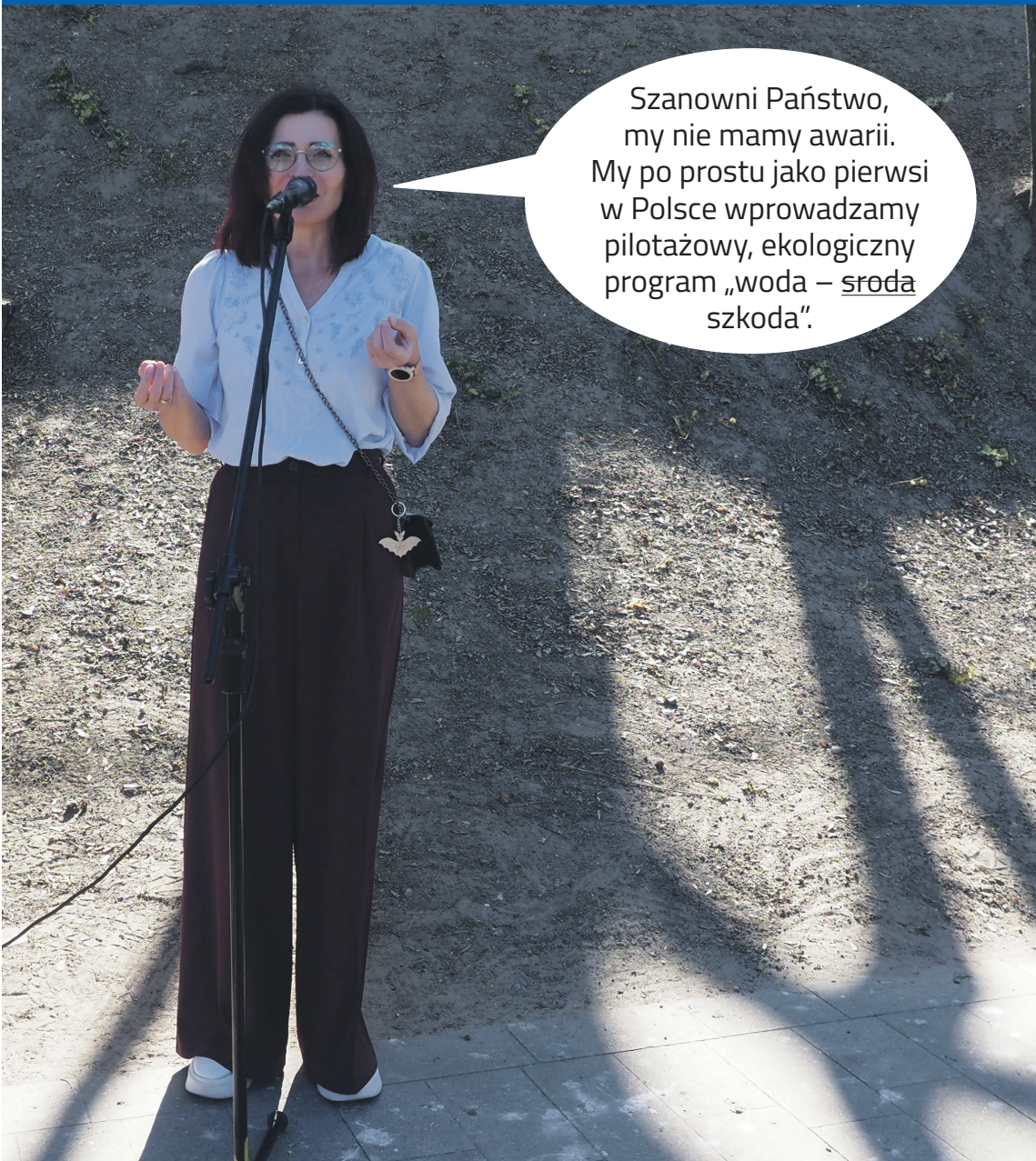
FOTO NA WESOŁO

Szanowni Państwo, my nie mamy awarii. My po prostu jako pierwsi w Polsce wprowadzamy pilotażowy, ekologiczny program „woda – środowisko”.