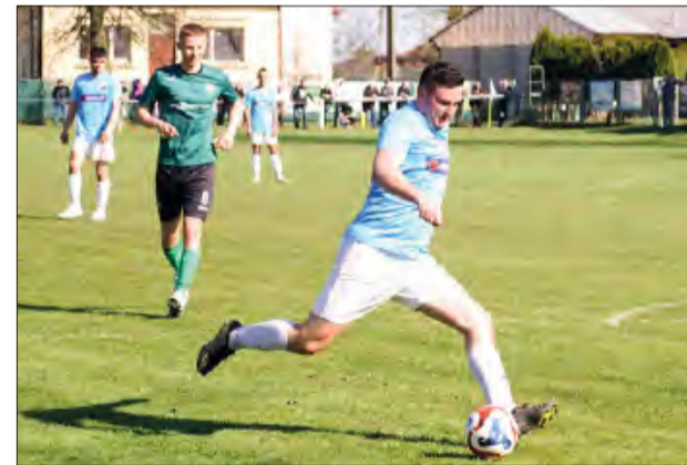
Amator jesienią w Dęblinie wygrał 2:1 z Czarnymi i w najbliższą niedzielę będzie chciał co najmniej powtórzyć ten wynik

* - Czarni Dęblin grali w B klasie ** - Czarni Dęblin grali w Klasie Okręgowej