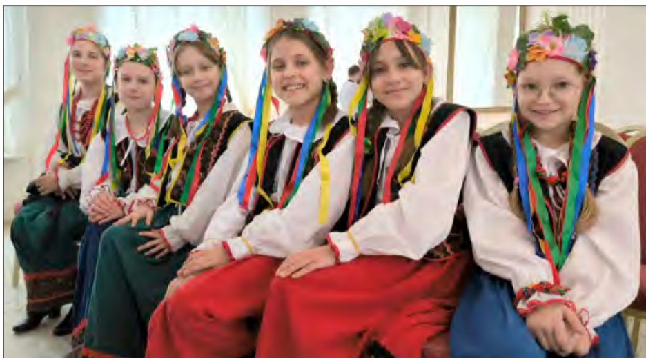
☛ Festiwal pełni funkcję artystyczną i edukacyjną. Ma popularyzować kulturę ludową wśród najmłodszych pokoleń