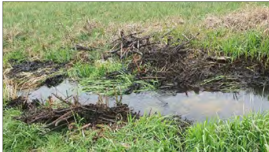
Ryccy policjanci otrzymali zgłoszenie o tym, że ktoś w jednej z miejscowości na terenie gminy Kłoczew uszkodził tamę zrobnioną na rzece przez bobry

W wtorek, 15 kwietnia, ryccy policjanci otrzymali zgłoszenie o tym, że ktoś w jednej z miejscowości na terenie gminy Kłoczew uszkodził tamę zrobnioną na rzece przez bobry. Na miejsce interwencji skierowano policjantów z ryckiej prewencji, którzy na miejscu zastali uszkodzoną zaporę zrobnioną przez bobry. W toku prowadzonych czynności funkcjonariusze ustalili sprawcę wykroczenia. Okazał się nim być 37-letni mieszkaniec powiatu ryckiego. Mężczyzna