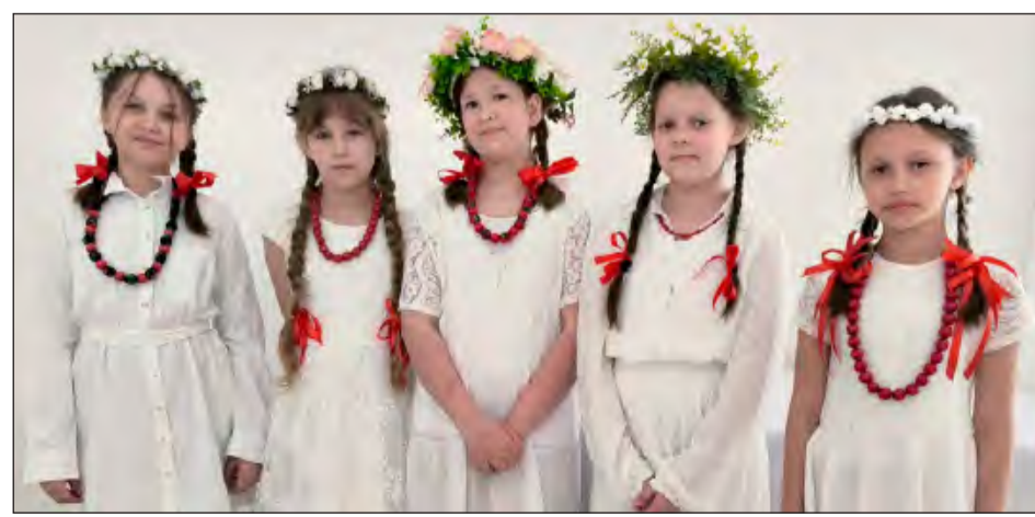
☛ Prezentacje skupiały się nie tylko na walorach muzycznych, ale również wizualnych