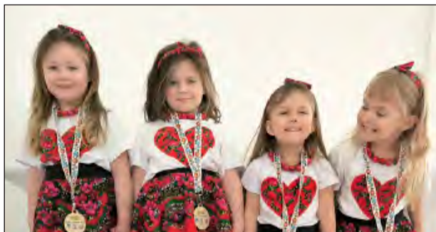
☛ Jednym z celów dęblińskiego festiwalu jest rozwijanie talentów i wrażliwości artystycznej dzieci

W tegorocznej edycji zaprezentowało się 50 uczestników - soliści i zespoły - łącznie ponad 100 dzieci z ponad 20 szkół podstawowych i przedszkoli. Każdy miał za zadanie wykonać jedną piosenkę ludową z dowolnego regionu Polski. Prezentacje zachwycały nie tylko walorami muzycznymi, ale i wizualnymi - dzieci występowały w barwnych strojach ludowych lub inspirowanych polskim folk-