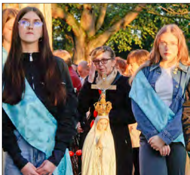
☛ Aby procesja wielkanocna wypadła uroczysto, zaangażowało się w nią wielu parafian. Nie tylko dorosłych

tydzień, do Niedzieli Bożego Miłosierdzia, ustanowionej przez św. Jana Pawła II. Ma przypominać, że zmartwychwstaniem Jezusa mamy żyć codziennie, a nie tylko jeden dzień w roku.