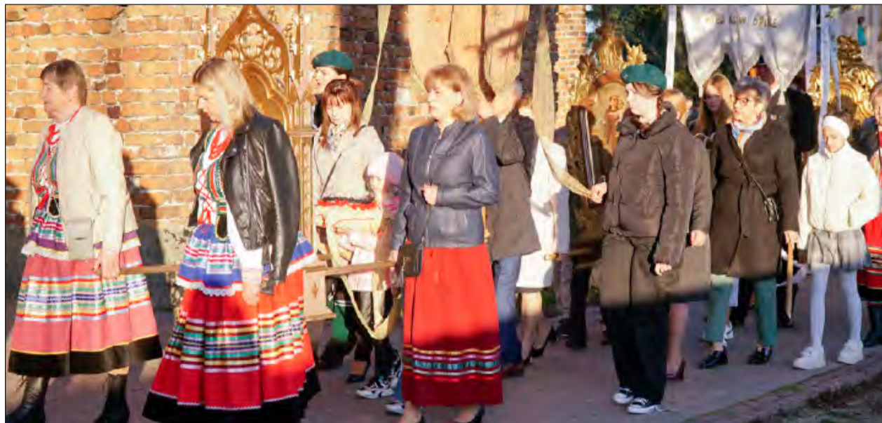
☛ Dopiero wstawał dzień, gdy wokół świątyni w Stężyicy przeszła procesja wiernych z radosną nowiną o zmartwychwstaniu Chrystusa

Jezus podczas nauczania wielokrotnie zapowiadał, że musi umrzeć, ale śmierć nie będzie końcem. „Trzeciego dnia” zmartwychwstanie. Od II wieku wierni świętują Wielkanoc w pierwszą niedzielę po pierwszej wiosennej pełni księżyca. Uroczystości rozpoczęła tra-