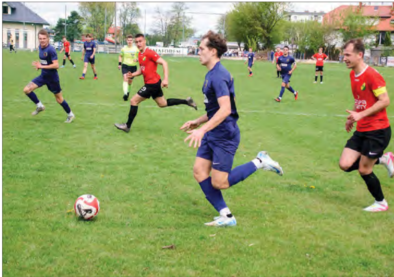
Czarni Dęblin (granatowe stroje) w Wielką Sobotę na własnym boisku pokonali Mazowsze Stężycza 4:0

Czarni Dęblin wygrali 4:0 z Mazowszem Stężycza w A-klasowych derbach powiatu ryckiego. Dzięki tej wygranej piłkarze Cezarego Adamskiego w lepszych humorach zasiedli do wielkanocnych stołów