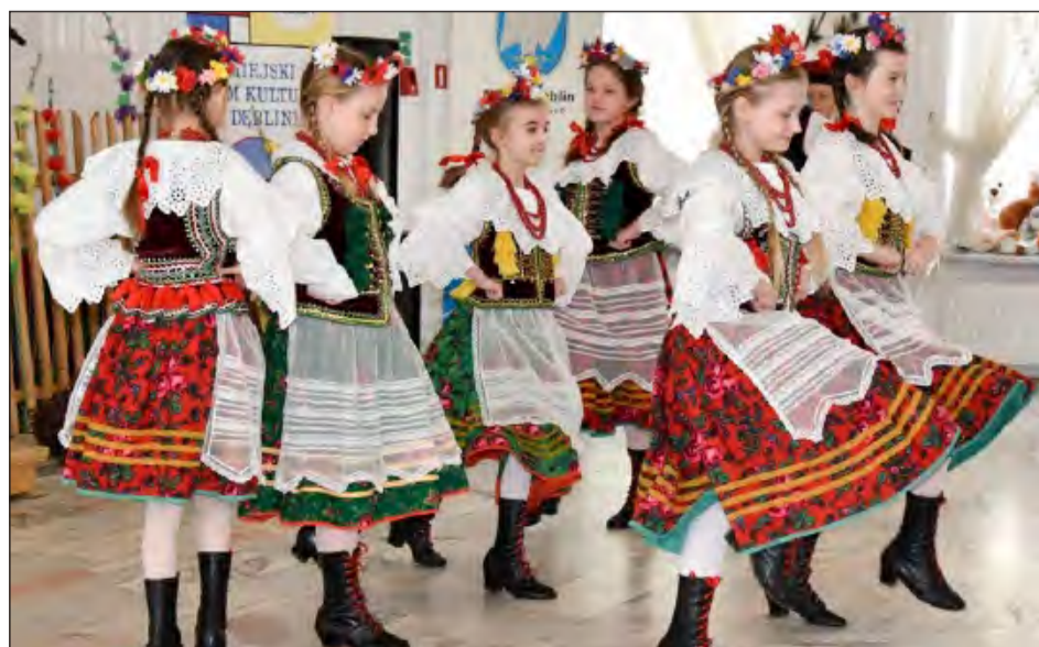
☛ GAIK to coroczna impreza organizowana od kilkunastu lat przez Miejski Dom Kultury w Dęblinie