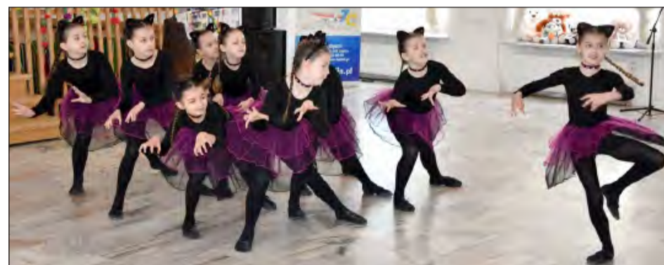
☛ Festiwalowi towarzyszyły dodatkowe atrakcje m.in. występy taneczne zespołu „Mała Rewia Taneczna”