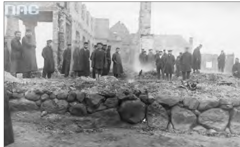
■ Stara synagoga w Rykach została zbudowana po 1819 roku. Do jej powstania w znaczący sposób przyczynił się między innymi rabin Baruch Eidels. Budynek przetrwał do okresu międzywojennego. Spłonął podczas wielkiego pożaru Ryk w 1925 roku

Odbudowana synagoga była miejscem modlitw do wybuchu drugiej wojny światowej. Pod presją okupacyjnych władz niemieckich, w 1940 roku powstała w niej Spółdzielnia Rolniczo-Handlowa „Rolnik”. Później w bóżnicy urządzono magazyn zbożowy. Dlatego zamurowane zostały otwory okienne. Po wojnie, w 1948 roku, obiekt przejęła Gmina Spółdzielnia „Samopomoc Chłopska”. W budynku wykuto wielkie drzwi. Powstał też POM (Państwowy Ośrodek Maszynowy), który przeprowadzał remonty ciągników i innego sprzętu rolniczego.