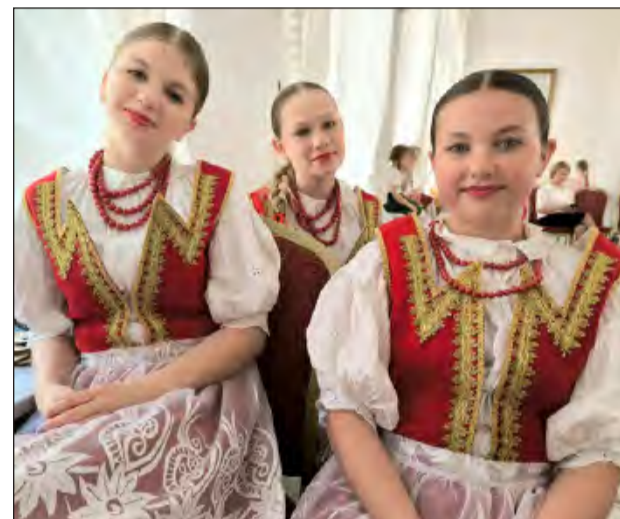
☛ Zadaniem występujących było zaprezentowanie jednej piosenki ludowej z dowolnego regionu Polski