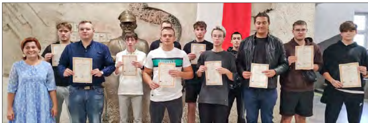
■ Nieczęsto zdarza się, żeby 100% absolwentów kończyło szkołę z dyplomem kwalifikacji zawodowych, i to w takim stylu

Nieczęsto zdarza się, żeby 100% absolwentów kończyło szkołę z dyplomem kwalifikacji zawodowych, i to w takim stylu. „Mechanicy” z Dębina pokazali klasę już w sesji letniej 2024, zaliczając ją ze średnią 79% na egzaminie pisemnym (testowym) i 98% na egzaminie praktycznym. Wykazali się nie tylko wysokim poziomem wiedzy teoretycznej, ale również wyjątkowymi umiejętnościami zastosowania