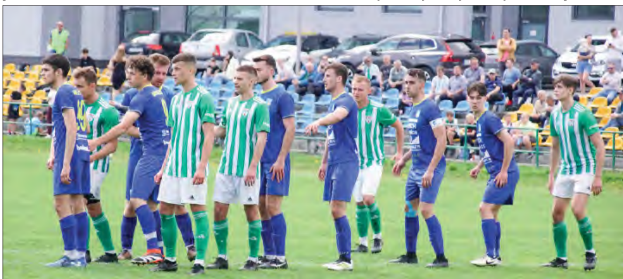
Piłkarze Ruchu Ryki (biało-zielone stroje) pod koniec meczu z Unią Bełżyce mocno przycisnęli rywali, do końca walcząc o zwycięstwo

Trawena Trawniki - Ruch Ryki (12:00), LKS Kamionka - Wisła Annapol, Wisła II Puławy - POM Iskra Piotrowice, Stal Poniatoła - LZS Wierchowiska, Cisy-Tarasola Nałęczów - Sokół Konopnica