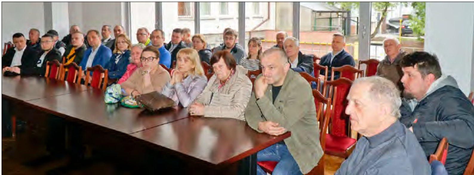
W środę 30-osobowa grupa przedstawicieli mieszkańców Leopoldowa przyjechała do Ryk na spotkanie z burmistrzem Ryk

» Część dworca PKP w Leopoldowie została rozebrana, ale mieszkańcy nie tracą nadziei na uratowanie ponad 100-letniego obiektu. W tej sprawie spotkali się z burmistrzem Ryk, który przedstawił propozycję rozwiązania