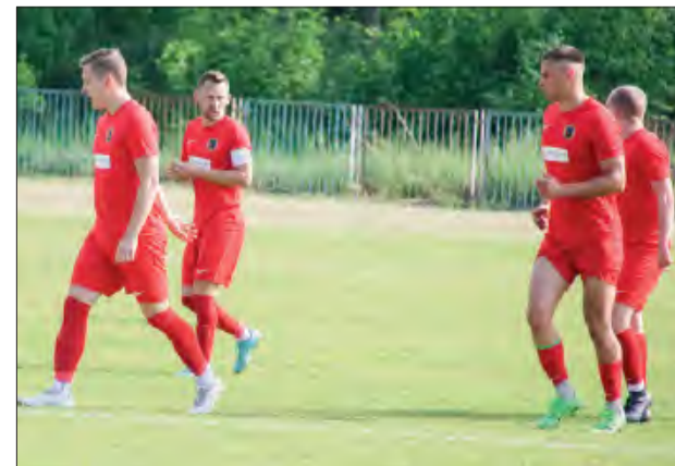
Czarni Dęblin po wygranej 4:0 z Mazowszem Stężycza w najbliższą niedzielę zagrają w kolejnych derbach powiatu ryckiego - tym razem w Rososzy zmierzą z Amatorem Leopoldów/Rososz