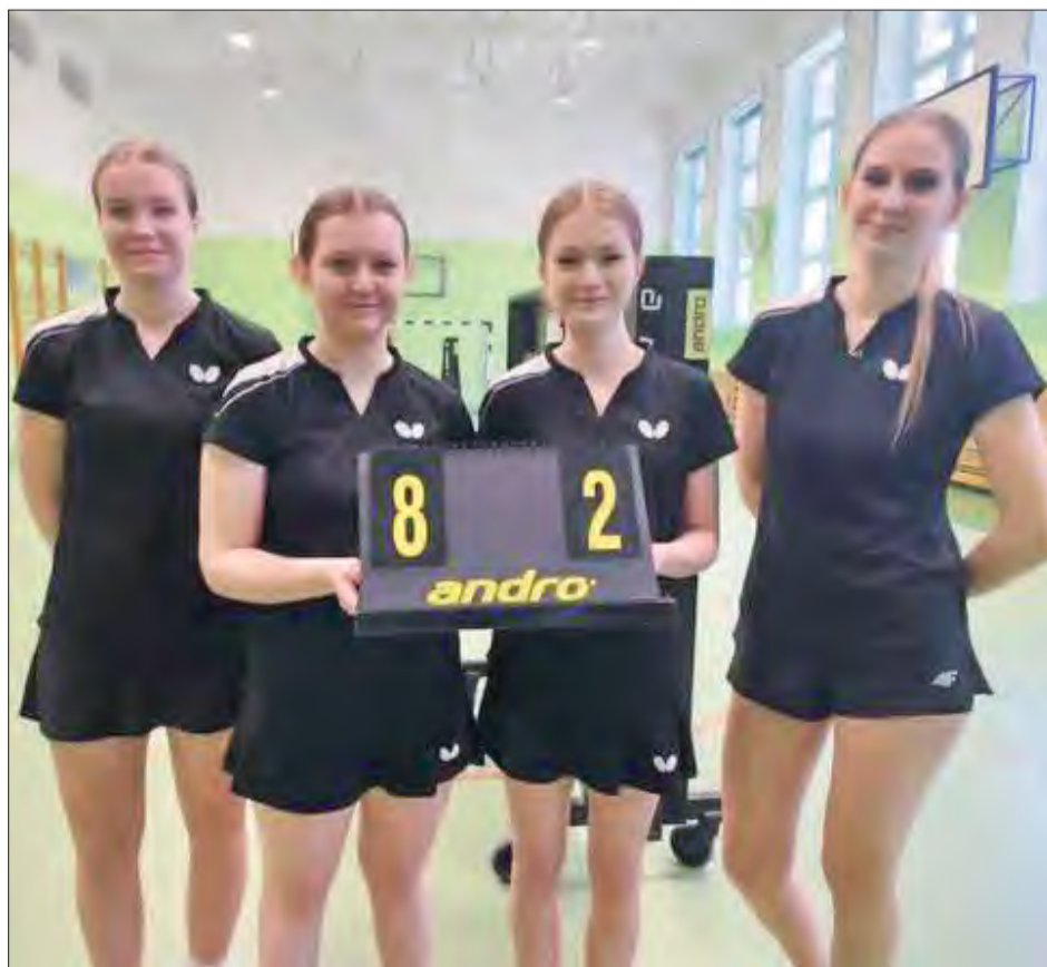
Dziewczyna z Dynama Gózd wygrała 8:2 z Żaczką Fajstławice i zajęła trzecie miejsce w końcowej tabeli II ligi tenisistek stołowych

W tym pojedynku po dwóch pierwszych setach to rywalka Kołomańskiej prowadziła 2:0. Kolejne dwie partie, to zacięta walka o każdy punkt, ale ostatecznie tenisistka stołowa Dynama wygrała je na przewagę doprowadzając do remisu. W zwycięstwie de-