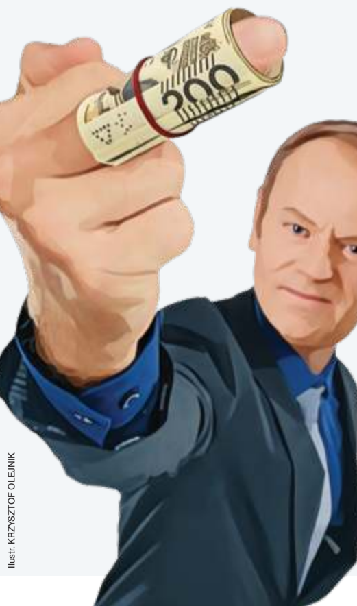
Ilustr. KRZYSZTOF OLEJNIK