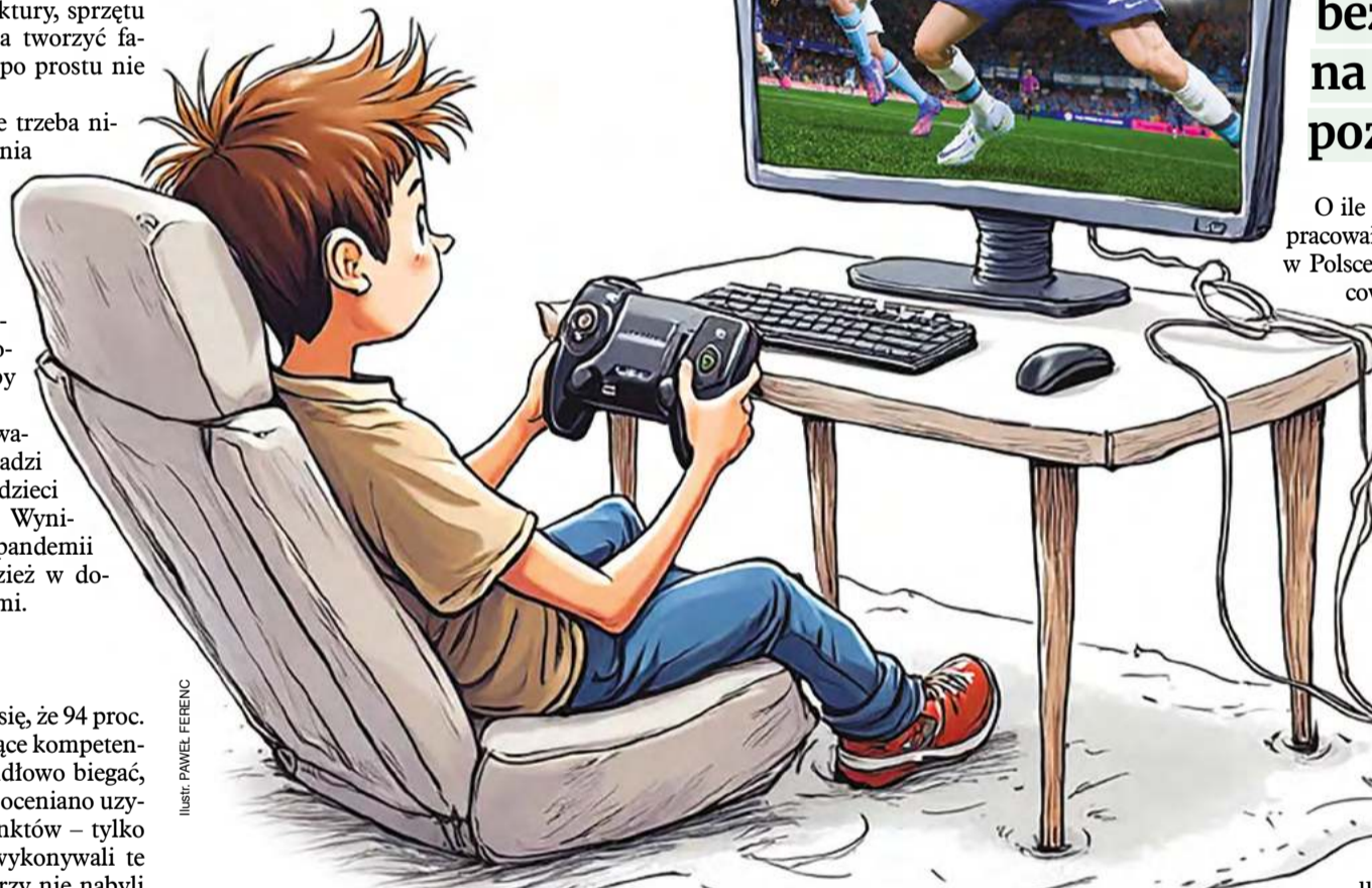
ILUSTR. PAWEŁ FERENC

WOJCIECH MITTELSTAEDT wojciech.mittelstaedt@interia.pl