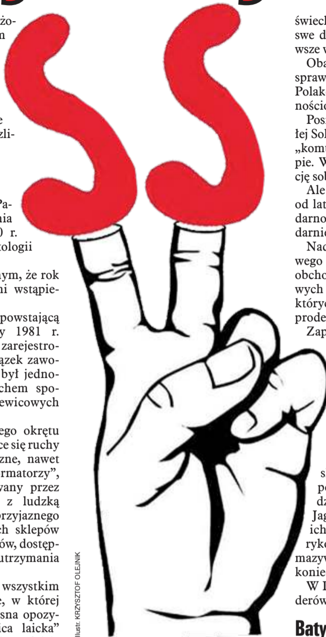
Ilustr. KRZYSZTOF OLEJNIK

Już wtedy Solidarność dzieliła się – i Polskę – na zdrową, narodową i katolicką, swojską prowincję oraz obcą, kosmopolityczną, salonową warszawkę. Obejmującą swymi zażydżonymi mackami także Gdańsk, Wrocław, Poznań, Szczecin nawet.