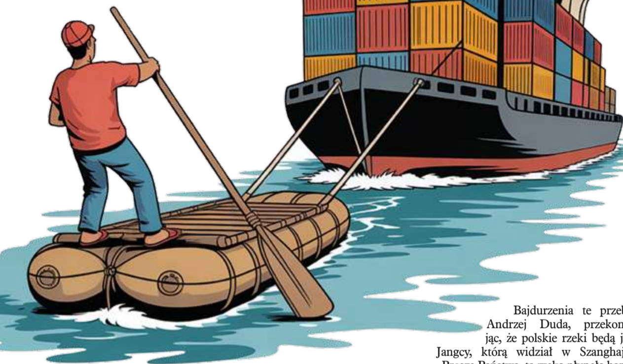
ILUSTRACJA: PAVEŁ FERENC

No i wypadaloby porobić śluzy oraz mnóstwo innych infrastruktur hydrologicznych. A potem jeszcze do tego wlać wodę. Tak – wlać. Bo tego, co w Bugu czy Wieprzu jest teraz, na szlaki wodne nie starczy. Wodę brałoby się z Wisły, tej samej, w której wody najczęściej już dziś brakuje. A ponieważ