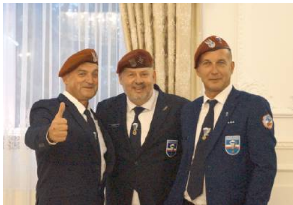
Pamiątkowe zdjęcia były obowiązkowe.

W Jubileuszu uczestniczyli: organizacje proobronne, przedstawiciele wojska i instytucji mundurowych, lokalnych władz samorządowych oraz przedstawiciele samorządów lokalnych, rodzin spadochroniarskich z różnych regionów Polski.