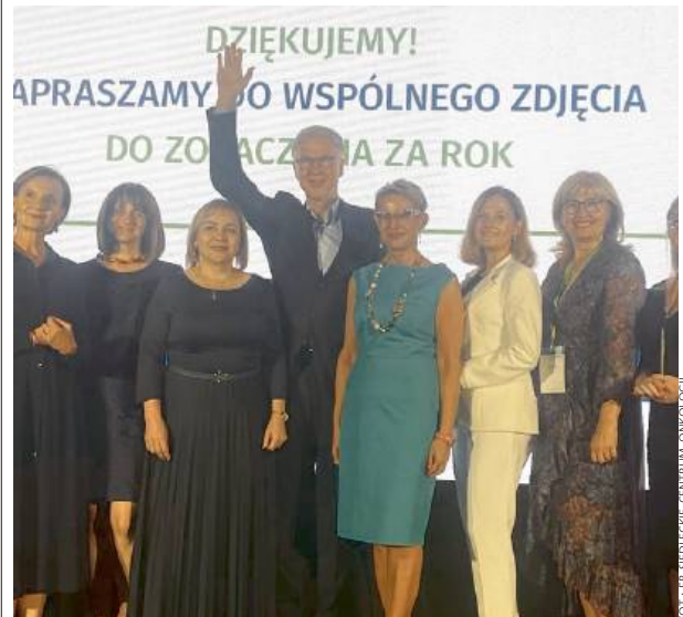
Projekt znalazł się w gronie najlepszych spośród 96 zgłoszeń.

Siedleckie Centrum Onkologii zostało nominowane w konkursie Liderzy Zmian w Ochronie Zdrowia 2024 w kategorii „Skuteczna profilaktyka i edukacja”. Wyróżniono projekt placówki pt. “Onkologiczna poradnia prehabilitacyjna – zasobem pacjenta onkologicznego”, który znalazł się w gronie najlepszych spośród 96 zgłoszonych inicjatyw. - Jest nam niezmiernie miło, że nasz projekt pod tytułem “Onkologiczna poradnia prehabilitacyjna - zasobem pacjenta onkologicznego” został doceniony i wyróżniony przez kapitułę konkursową. To ogromne wyróżnienie motywuje nas do dalszej pracy na rzecz poprawy jakości opieki nad pacjentami - czytamy na profilu fb Centrum. Gratulujemy! PA