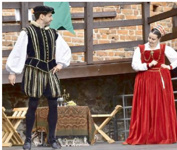
Podsumowaniem było teatrum pt. „Kto uśmiercił królową Bonę?”