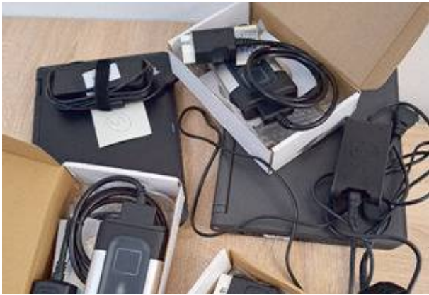
43-latek oferował sprzedaż nielegalnego testera diagnostycznego.

Policjanci Wydziału dw. z Przystępczością Gospodarczą i Korupcją Komendy Powiatowej Policji w Mińsku Mazowieckim zatrzymali mężczyznę, podejrzanego o wprowadzenie do obrotu towaru z podrobionym znakiem towarowym. Mieszkaniec gminy Mińsk Mazowiecki oferował sprzedaż nielegalnego testera diagnostycznego. Po uzyskaniu informacji dotyczącej podejrzenia wprowadzenia do obrotu towaru z podrobionym znakiem towarowym, funkcjonariusze udali się na jedną z posesji w gminie Mińsk Mazowiecki. Na miejscu zabezpieczyli podrobiony tester diagnostyczny, który został wystawiony na sprzedaż. Następnie przeszukali posesję, gdzie odnaleźli jeszcze dwa testery z podrobionym znakiem towarowym. Wartość rynkowa autentycznych urządzeń to ponad 80 tysięcy złotych. 43-latek usłyszał zarzut wprowadzenia do obrotu nielegalnego towaru z podrobionym znakiem towarowym oraz uzyskania bez zgody osoby uprawnionej cudzego programu komputerowego w celu osiągnięcia korzyści majątkowej. Policjanci na poczet przyszłej kary zabezpieczyli od mężczyzny 5 tysięcy złotych. Teraz mieszkańcy gminy Mińsk Mazowiecki grozi do 5 lat pozbawienia wolności.