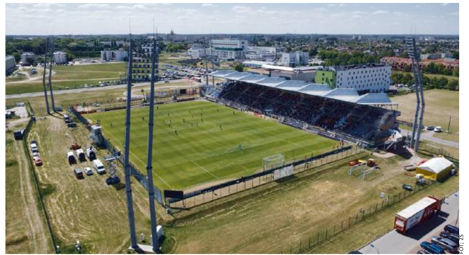
Czy z szafy siedleckiej Pogoni zaczną wypadać finansowe trupy?

Brak jasnych odpowiedzi i komunikacji z zarządem klubu potęguje tylko spekulacje wśród tych, którym los Pogoni leży na sercu. Krążą informacje o astronomicznych kwotach zadłużenia, które mogą sięgać ponad 3