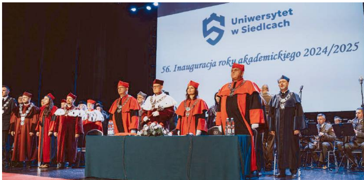
Uroczysta Inauguracja Roku Akademickiego 2024/2025.