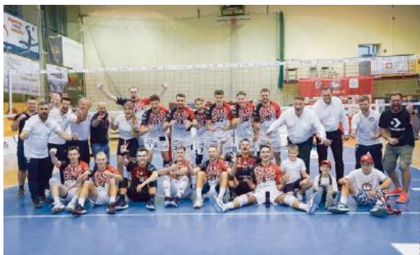
Trzecia wygrana i trzecie miejsce w tabeli siedleckiego KPS.

Było to trzecie z rzędu zwycięstwo siedlczan, którzy w tabeli zajmują obecnie trzecie miejsce.