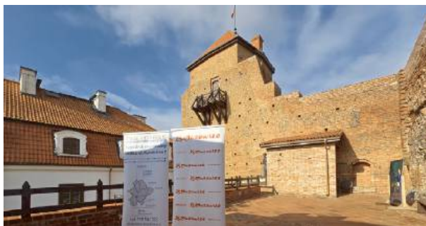
Zamek w Liwie, to miejsce, które pomimo wielu zawirowań nadal przyciąga turystów i zachęca swoją ofertą

Warsztaty medialne za nami. To kolejna udana edycja spotkania z młodzieżą, która zainteresowana tematyką social mediów chce poszerzać swoje horyzonty i ćwiczyć umiejętności praktyczne z nimi związane.