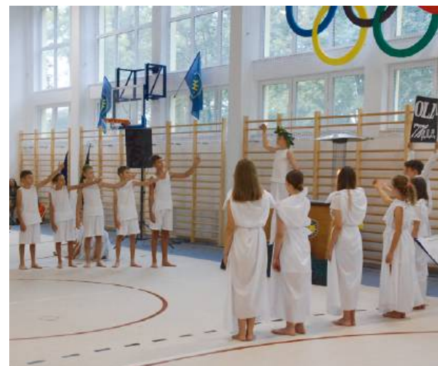
W podróż przez historię igrzysk olimpijskich.

Wójt Długosz zaznaczył w swoim wystąpieniu: - To ważna chwila, bo meldujemy wykonanie zadania. Wspólny-