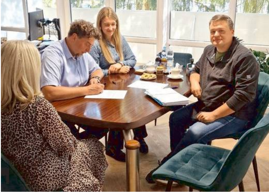
Oba przedsięwzięcia znacząco wpłyną na poprawę jakości życia mieszkańców.

Przebudowa drogi gminnej w miejscowości Dziecioły obejmie odcinek o długości 685 metrów, na którym zostanie wykonana pełna modernizacja, w tym położenie nowej nawierzchni asfaltowej, utwardzenie poboczy oraz zjazdów. Głównym celem jest poprawa komfortu jazdy oraz zwiększenie bezpieczeństwa użytkowników tej drogi. Koszt inwestycji