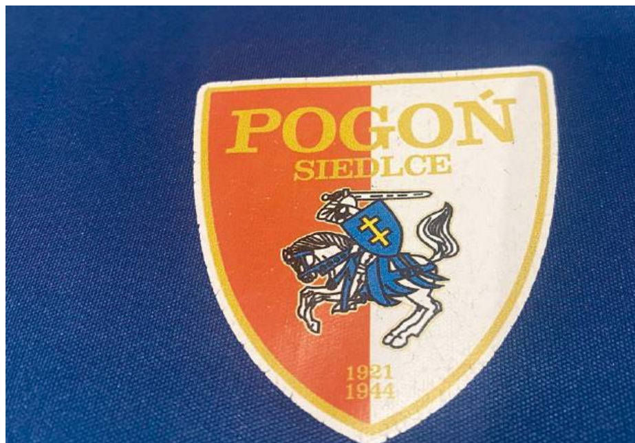
Czy siedlecki klub MKP Pogoń ma coś do ukrycia?