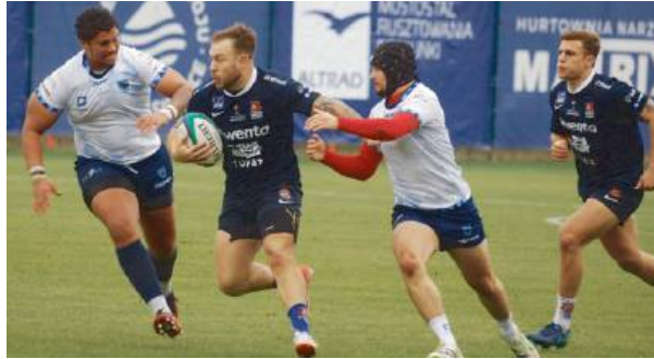
Pogoń vs. Juwenia