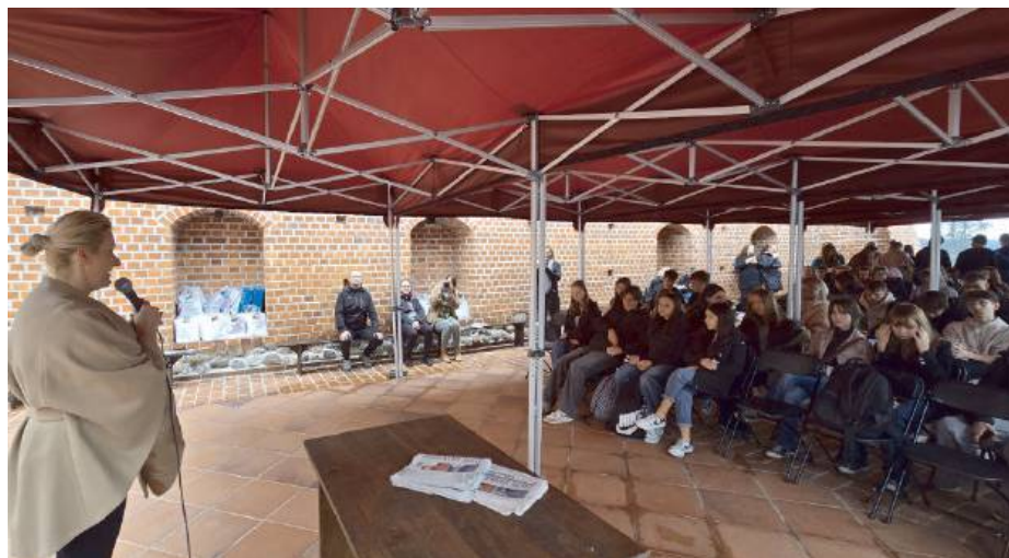
W warsztatach udział wzięło ponad stu uczniów z siedleckich i węgrowskich szkół

Storytime, vlogi, jak i różnego rodzaju wypowiedzi udostępniane w social mediach cieszą się ostatnio ogromną popularnością. Aby dobrze przygotować taki materiał, należy znać podstawowe zasady technicznego wykonania materiału, ale pamiętać przede wszystkim, aby pokazać odbiorcom szczerą i naturalność. Pamiętajcie też, że nagry-