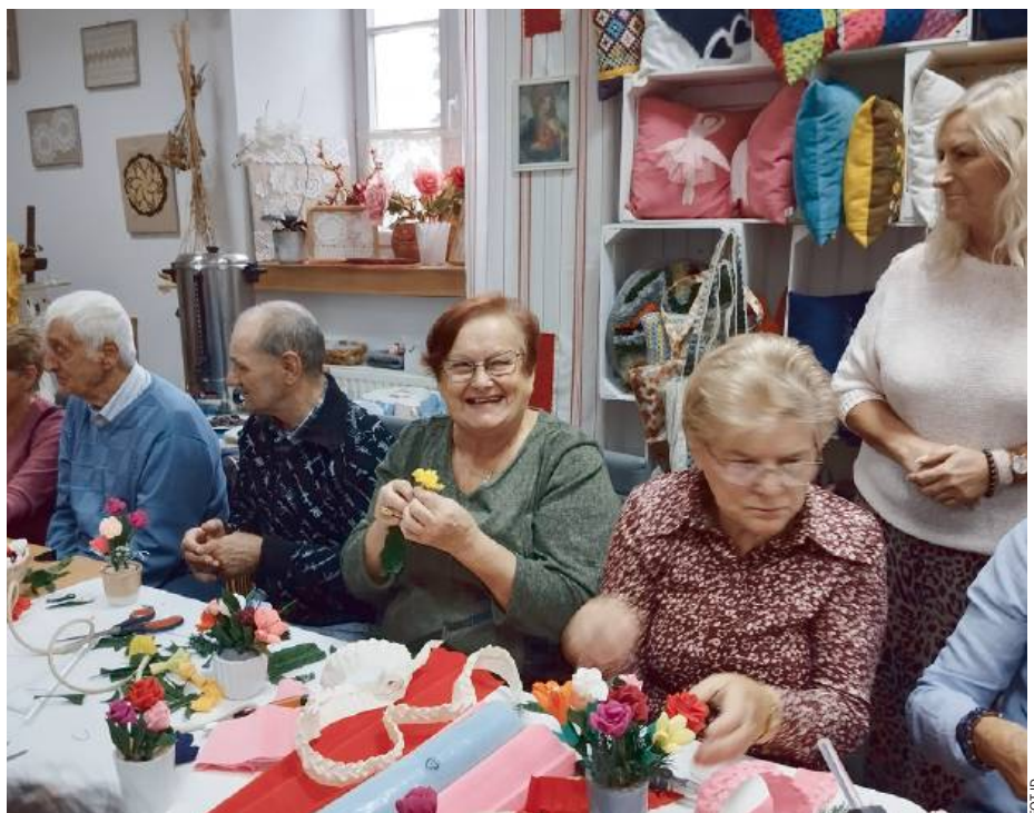
ID Warsztaty to nie tylko nauka, to także doskonała forma zabawy i okazja do spotkania.

Siedlecka Spółdzielnia Caritas w Siedlcach prowadzi szeroki zakres zajęć dla seniorów. Oprócz warsztatów florystycznych można także skorzystać z zajęć z zakresu nauki krawiectwa czy fitnessu.