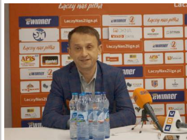
Niepełny skład zarządu budzi wiele spekulacji...

Czy huczna Gala z okazji 80-lecia Pogoni poprawi nastroje? Będziemy bacznie przyglądać się tej sprawie. RED.