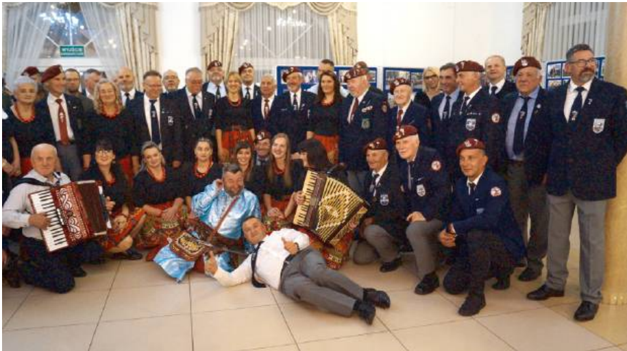
Siedleccy Spadochroniarze obchodzili swoje święto.

Jubileusz był także okazją do refleksji nad przyszłością oddziału, a także do zacieśnienia więzi między jego członkami. Wspólne świętowanie pozwoliło zbudować silną społeczność, która z dumą pielęgnuje tradycje spadochroniarskie w regionie.