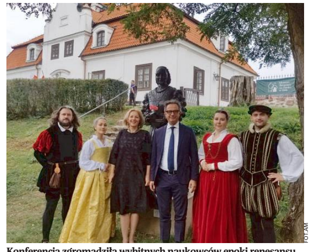
Konferencja zgromadziła wybitnych naukowców epoki renesansu.

Centralnym punktem uroczystości była konferencja naukowa „Śladami królowej Bony”. Prelekcje, które miały miejsce zarówno na żywo, jak i w formie