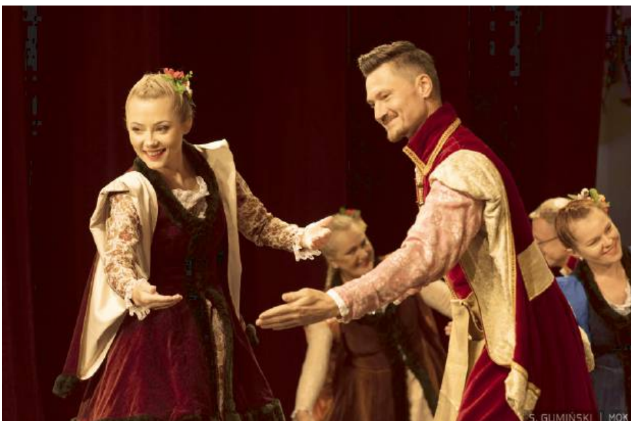
Show było pełne barwnych strojów, tradycyjnych pieśni i energicznych choreografii.

Zespół Pieśni i Tańca „Niwa” działa przy Gminnym Ośrodku Kultury w Zbuczynie. Powstał