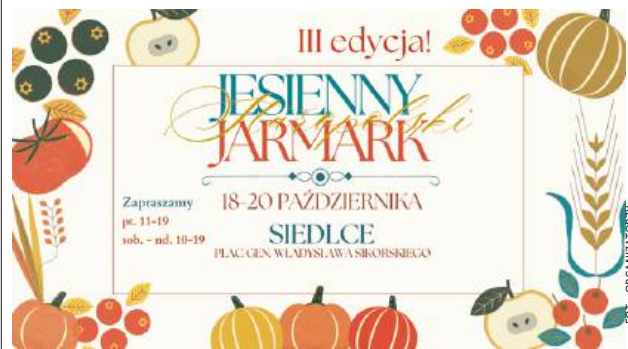
To już trzecia edycja wydarzenia.

Siedleckie Centrum Onkologii zostało nominowane w konkursie Liderzy Zmian w Ochronie Zdrowia 2024 w kategorii „Skuteczna profilaktyka i edukacja”. Wyróżniono projekt placówki pt. “Onkologiczna poradnia prehabilitacyjna – zasobem pacjenta onkologicznego”, który znalazł się w gronie najlepszych spośród 96 zgłoszonych inicjatyw. - Jest nam niezmiernie miło, że nasz projekt pod tytułem “Onkologiczna poradnia prehabilitacyjna - zasobem pacjenta onkologicznego” został doceniony i wyróżniony przez kapitułę konkursową. To ogromne wyróżnienie motywuje nas do dalszej pracy na rzecz poprawy jakości opieki nad pacjentami - czytamy na profilu fb Centrum. Gratulujemy! PA