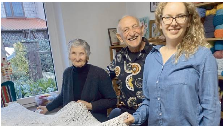
Demetrio nie krył pozytywnych emocji związanych z tą wizytą.

we, w samym Portoscuso funkcjonuje około 40 organizacji pozarządowych.