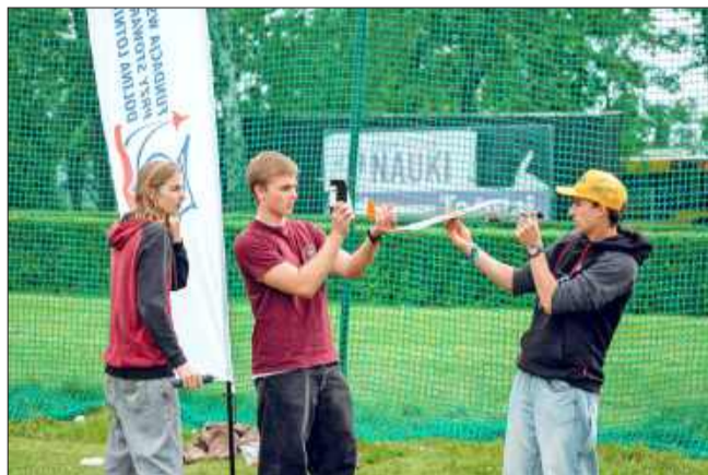
Będzie się działo!

Istotnym elementem konkursu jest rozbudowany pro-