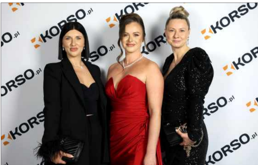
Na naszej ściance nie zabrakło igrzysk oscarowych kreacji.