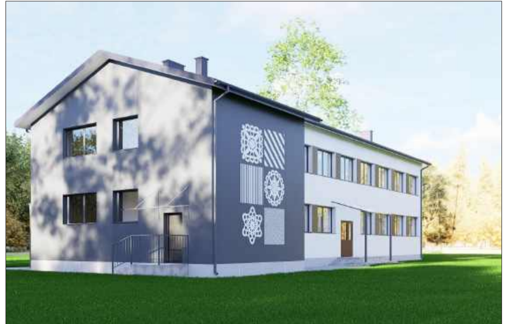
Tak ma wyglądać przybudowany dom seniora.

Gmina Wadowice Górne pozyskała środki po to, by wyremontować obiekt Klubu Seniora+ w Zabrnium. W budynku powstanie m.in. bardzo potrzebna winda.