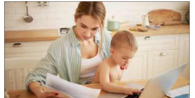
Zapowiadana reforma 800 plus może być jedną z największych zmian w systemie świadczeń rodzinnych od lat.

Resort rodziny zapowiada istotne zmiany w funkcjonowaniu świadczenia wychowawczego, znanego jako 800 plus na dziecko. Trwają prace nad projektem ustawy, którego głównym celem jest uproszczenie i usprawnienie procesu przyznawania świadczenia. Najważniejsza zapowiedź dotyczy likwidacji obowiązku corocznego składania wniosków przez rodziców i opiekunów.