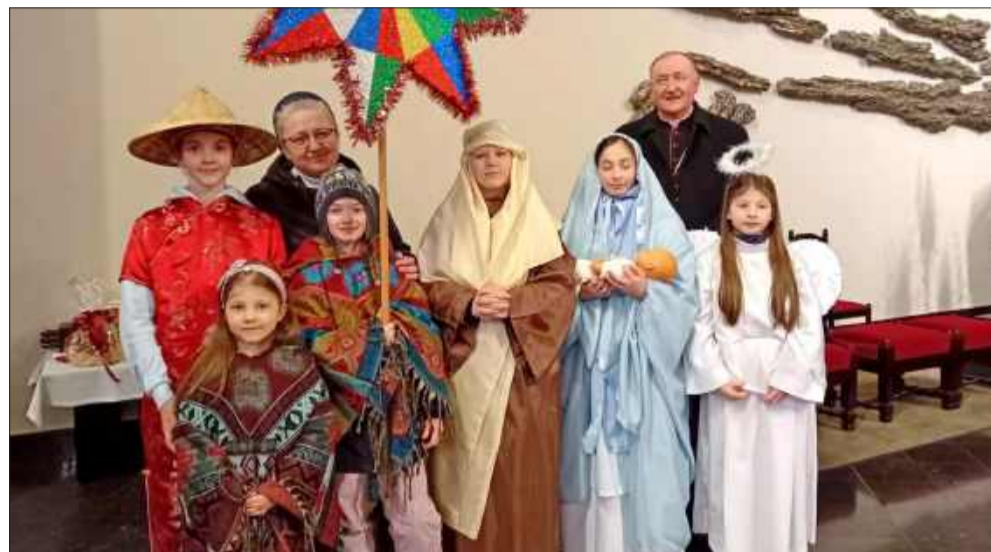
Młodzi misjonarze radości i dobra.

W czasie świąt Bożego Narodzenia modlitwa Kościoła w sposób szczególnie obejmowała Ziemię Świętą, a zwłaszcza Strefę Gazy, dotkniętą dramatem wojny i niemal całkowitym