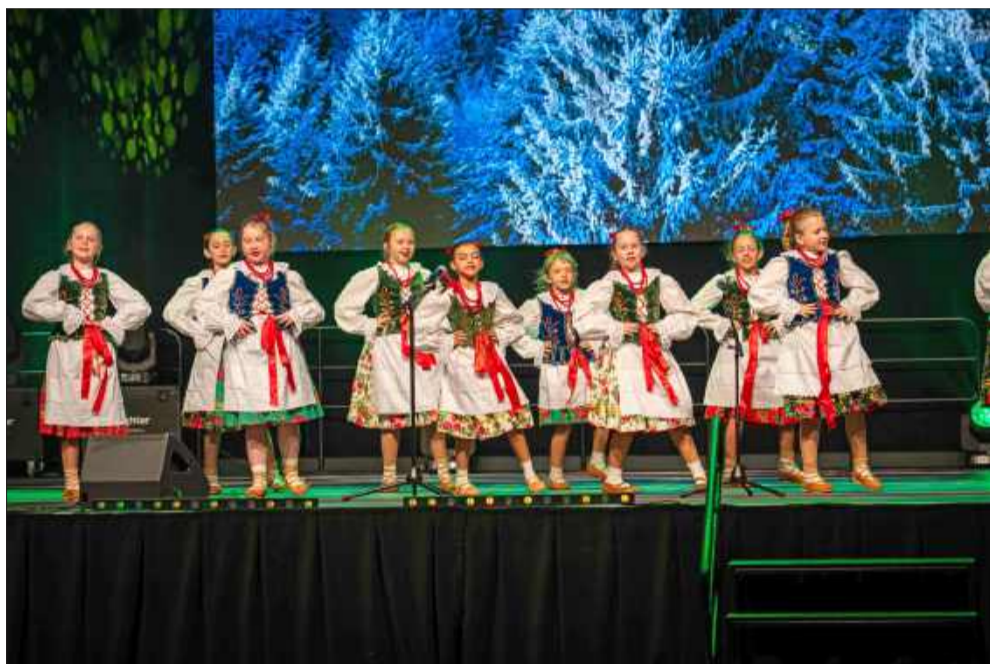
Dziewięć Zespół "Ziemia Mielecka" z Samorządowego Centrum Kultury w Mielcu.