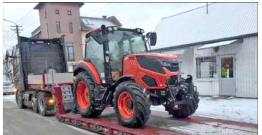
Gmina kupiła nowy ciągnik za 283 tys. zł

Urząd Miejski w Radomyślu Wielkim zakupił nowy ciągnik wraz z niezbędnym wyposażeniem, który będzie wykorzystywany do utrzymania dróg gminnych.