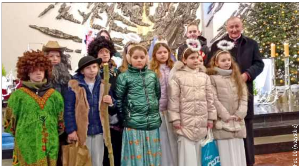
Korony, peleryny i anielskie skrzydła.

W Mielcu odbyło się spotkanie kołędników misyjnych, które zgromadziło kilkuset uczestników z blisko 30 parafii Diecezji Tarnowskiej. Wydarzenie miało radosny, dziękczynny charakter i było podsumowaniem tegorocznej akcji kołędniczej, prowadzonej na rzecz projektów misyjnych realizowanych na całym świecie.