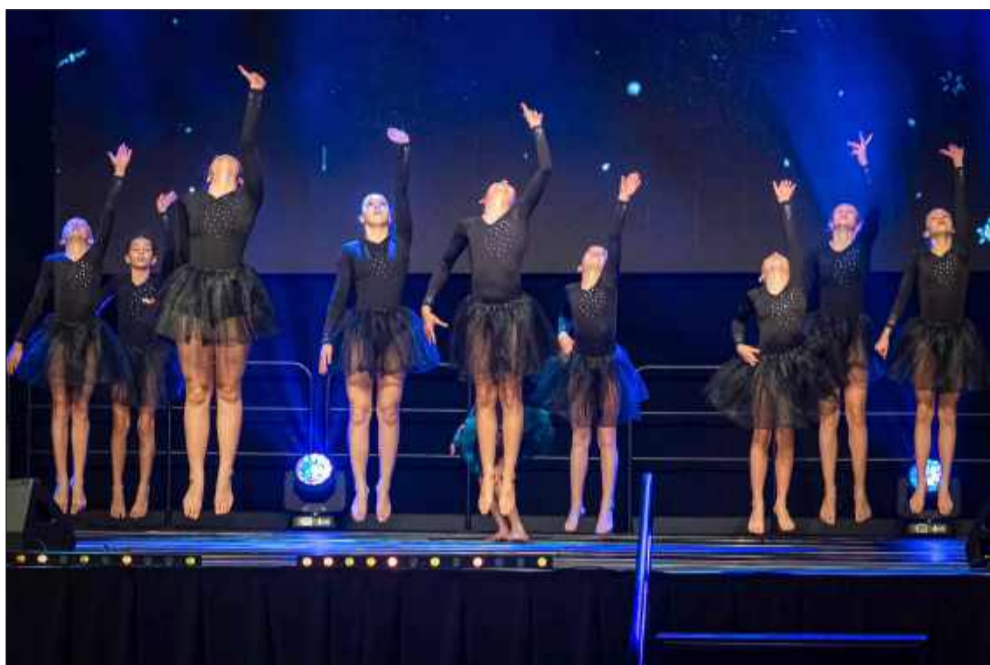
Na gali nie zabrakło cudownych popisów artystycznych.