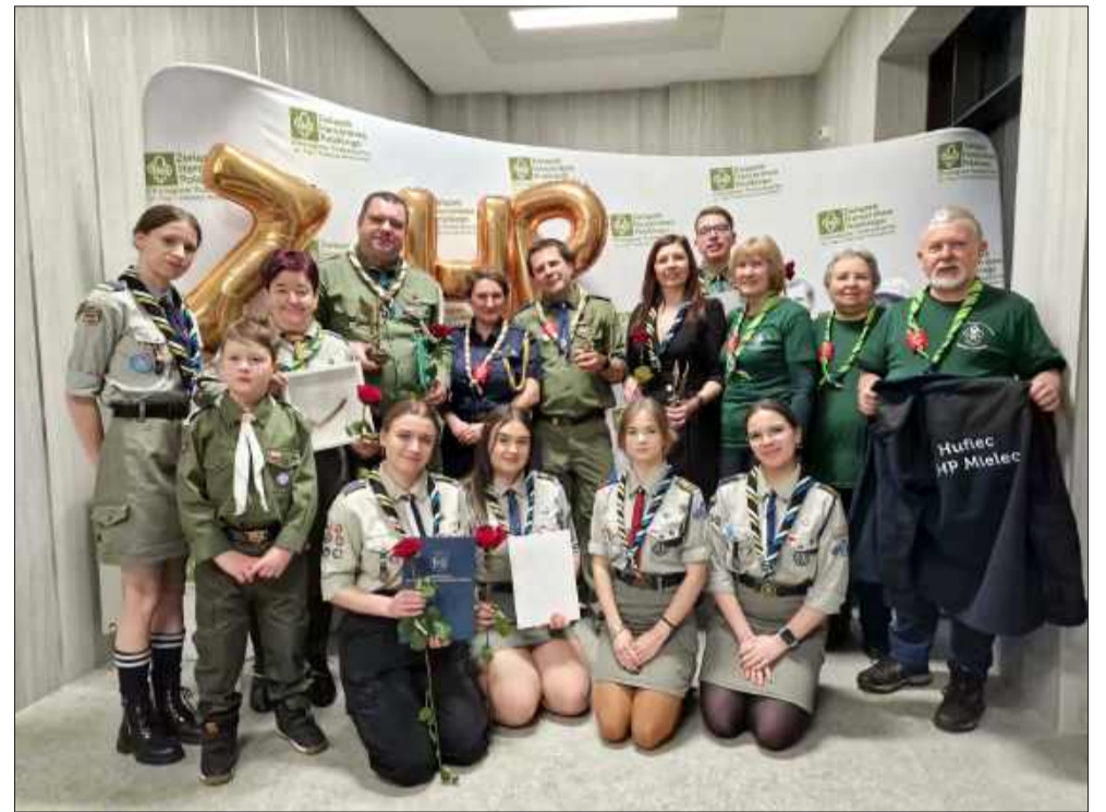
Tegoroczna edycja gali okazała się wyjątkowo pomyślna dla mieleckiego środowiska harcerskiego.

Szczególnym momentem uroczystości było także wręczenie Orła Chorągwi Podkarpackiej w kategorii „Harcerski Partner”. Wyróżnienie to otrzymała