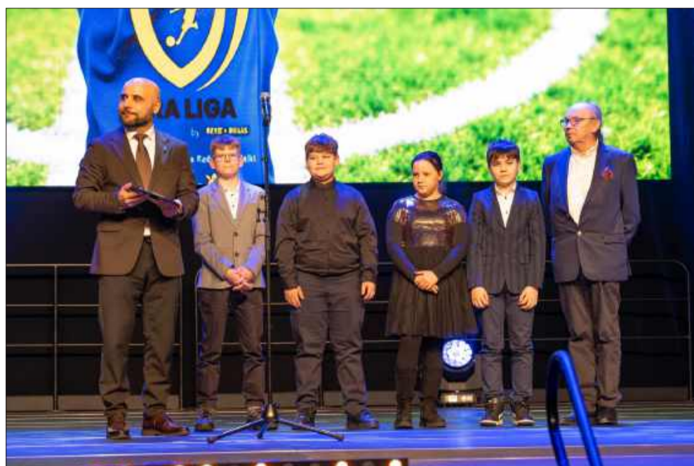
Mecenasem Sportu 2025 została firma Geyer&Hosaja.