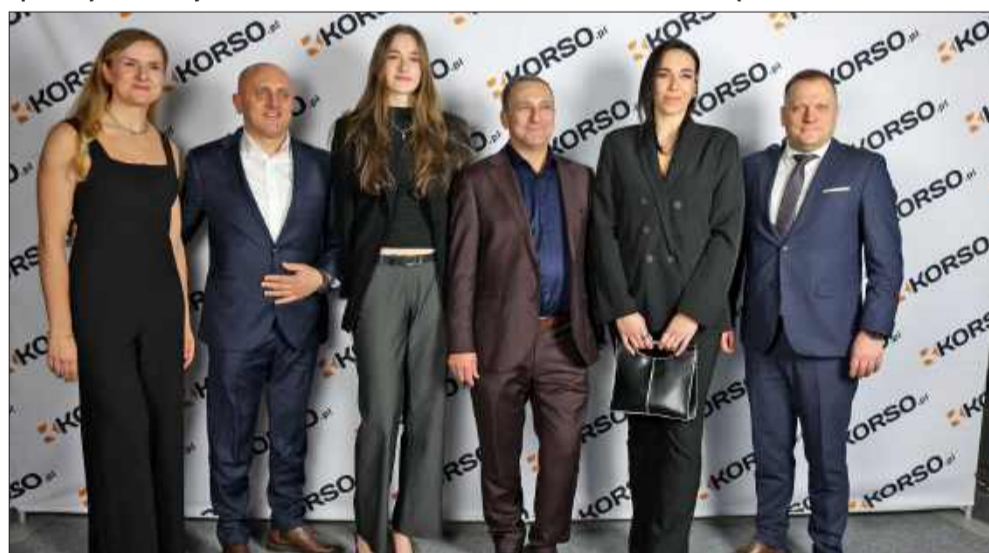
Elegancka czerń była najczęściej wybieranym kolorem.