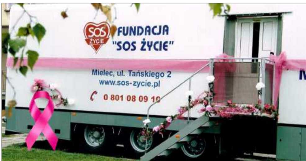
Cytomammbus odwiedzi Tuszów Narodowy