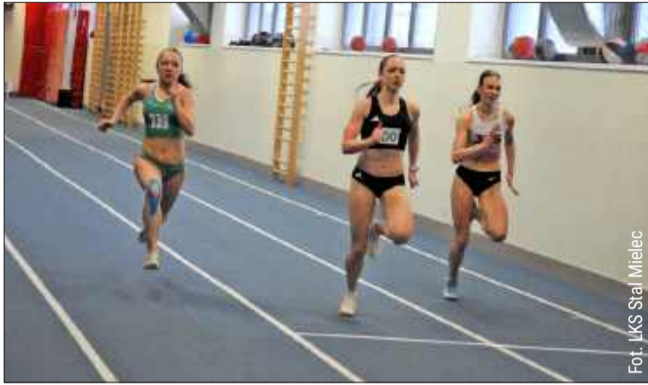
Zawody przyciągnęły sporo młodych sportowców.