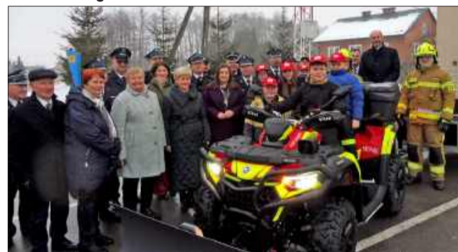
Nowy sprzęt na pewno się przyda!

Jednostka Ochotnicza Straż Pożarna w Dąbiu otrzymała znaczące wsparcie finansowe na wyposażenie swojej floty i zaplecza technicznego. Na zakup pojazdu strażacy pozyskali 46 tys. zł z Fundacja ORLEN w ramach programu grantowego „ORLEN. Razem dla bezpieczeństwa”.