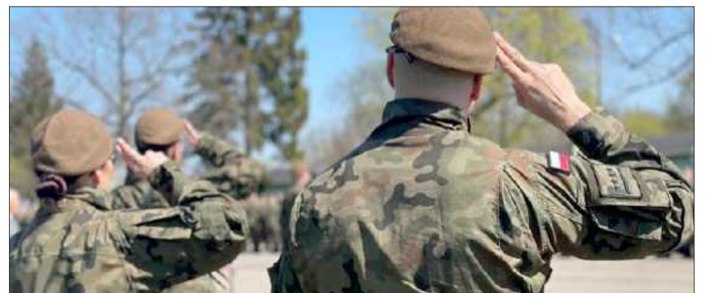
Kwalifikacja wojskowa 2026 na Podkarpaciu. Kogo dotyczy i gdzie się stawić?