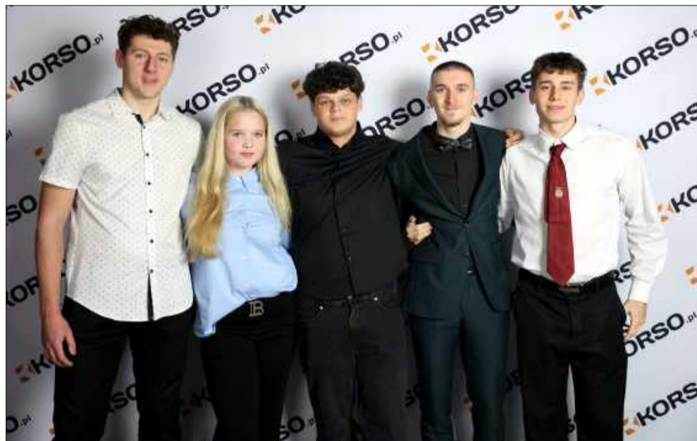
Mielecki sport jest bogaty w talenty.