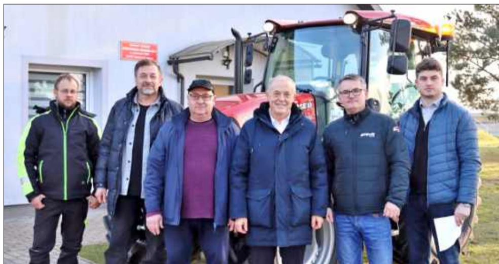
Zakupiono także ciągnik

W ramach dofinansowania wykonano projekt rozbudowy szkoły w Maliniu. Obok istniejącego obiektu powstanie drugi, którego piwnice będą stanowiły schrony w sytuacji zagrożenia. Budynki będą połączone korytarzami, dzięki czemu uczniowie i pracownicy nie będą mieli problemu z przemieszczaniem w czasie