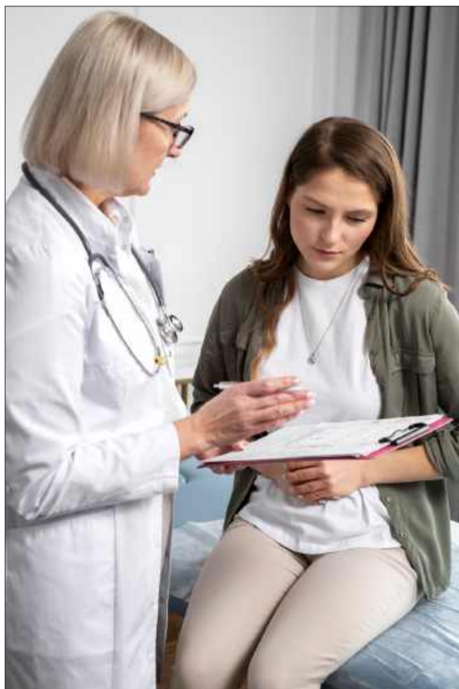
Czasami nie lubimy myśleć o sobie. Wtedy warto pomyśleć o bliskich - oni chcą byśmy żyli długo (i szczęśliwie).

Specjaliści wskazują, że kluczową rolę odgrywają: regularne badania cytologiczne oraz testy HPV, szczepienia przeciwko HPV,