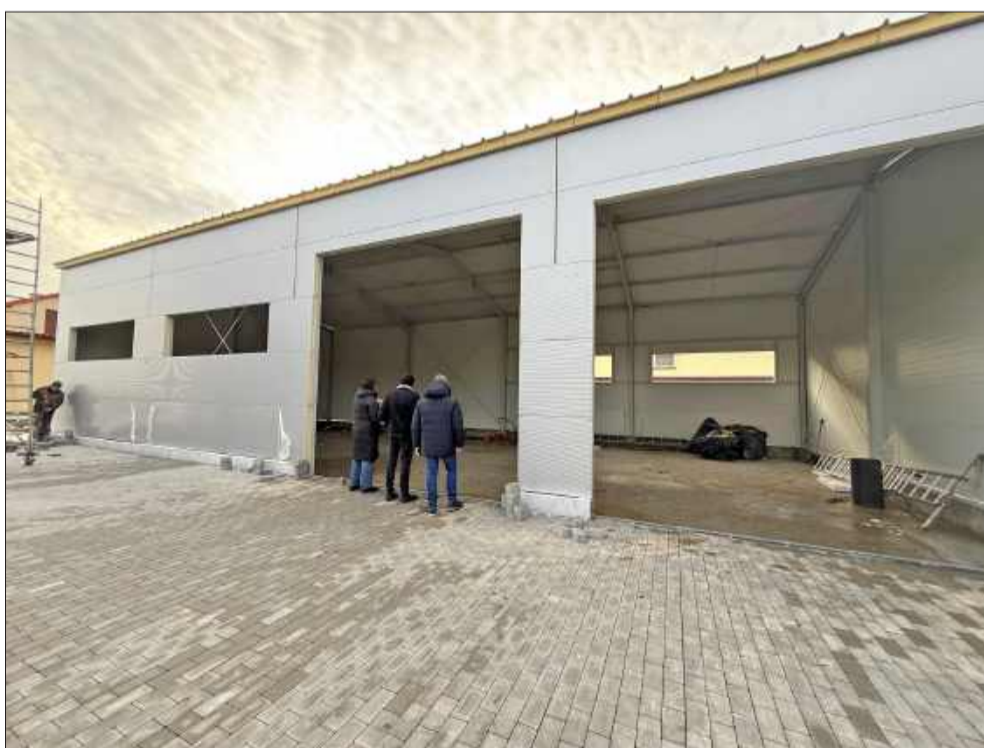
Taki magazyn może pełnić wiele funkcji.

Największym zadaniem zrealizowanym w Gminie Mielec w ramach ustawy o ochronie ludności i obronie cywilnej było wybudowanie magazynu wraz