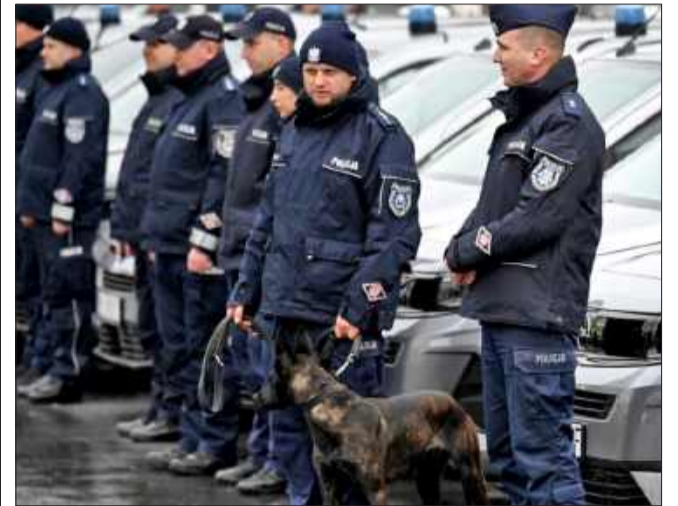
Nowy radiowóz dla mieleckiej policji. Wzmocnienie taboru i bezpieczeństwa.

Nowoczesna policja to nie tylko wyszkoleni funkcjonariusze, ale również sprzęt, który pozwala im działać szybko i skutecznie. Tabor podkarpackiej policji został właśnie wzmocniony o 28 nowych pojazdów, a jeden z nich trafił do Mielca, gdzie będzie wykorzystywany przez przewodników psów służbowych miejscowej jednostki.