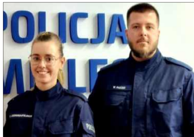
Dobre wieści dla Mielca. Do policji dołączy dwóch nowych funkcjonariuszy

„Ja jestem zmartwychwstaniem i życiem” Ewangelia wg św. Jana (J 11, 25)