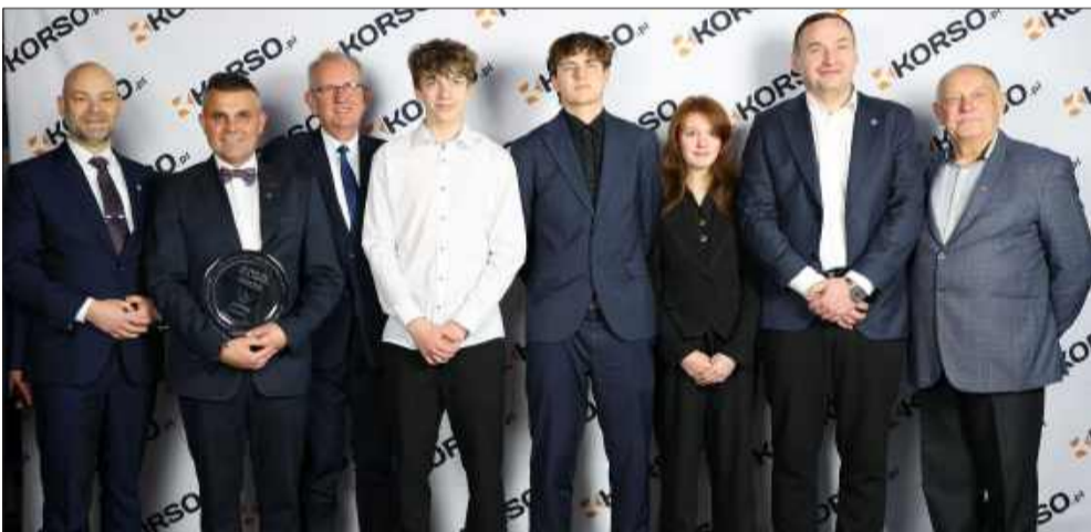
Gdy gasną światła treningów, zapalają się reflektory. Sportowcy Roku nagrodzeni