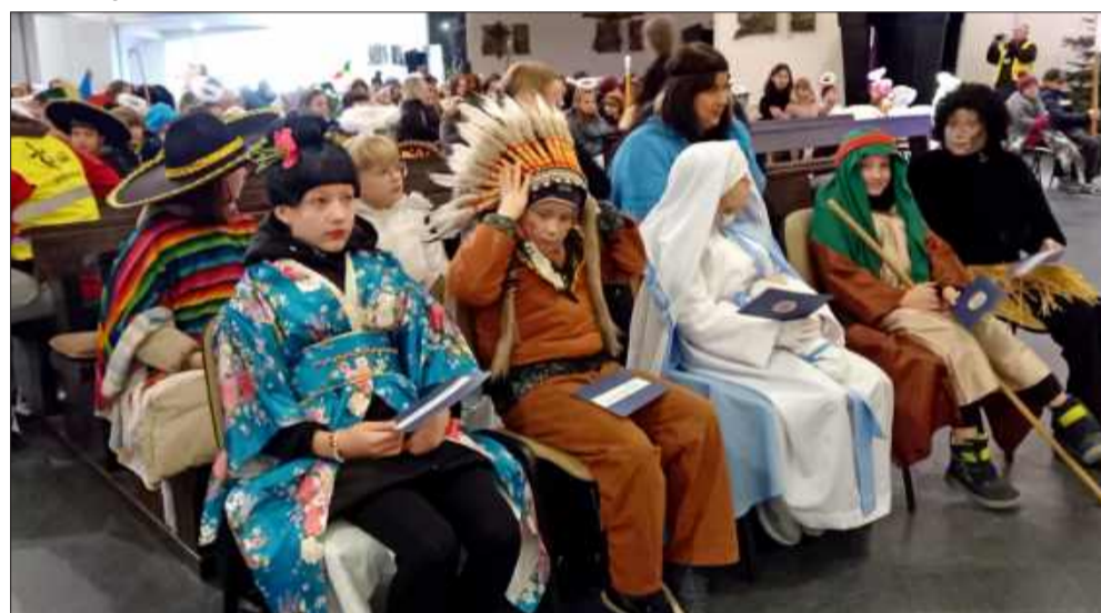
Kolorowi kołędnicy misyjni wypełnili Mielec radością i śpiewem.

zniszczeniem. Kolęda misyjna jest znakiem solidarności i nadziei, pomocą skierowaną na najbardziej podstawowe potrzeby oraz na odbudowę edukacji młodego pokolenia. To także wezwanie, by na drodze modlitwy i konkretnego dobra być misjonarzami Chrystusa, budując pokój i relacje oparte na miłości, a nie na przemocy i nienawiści.