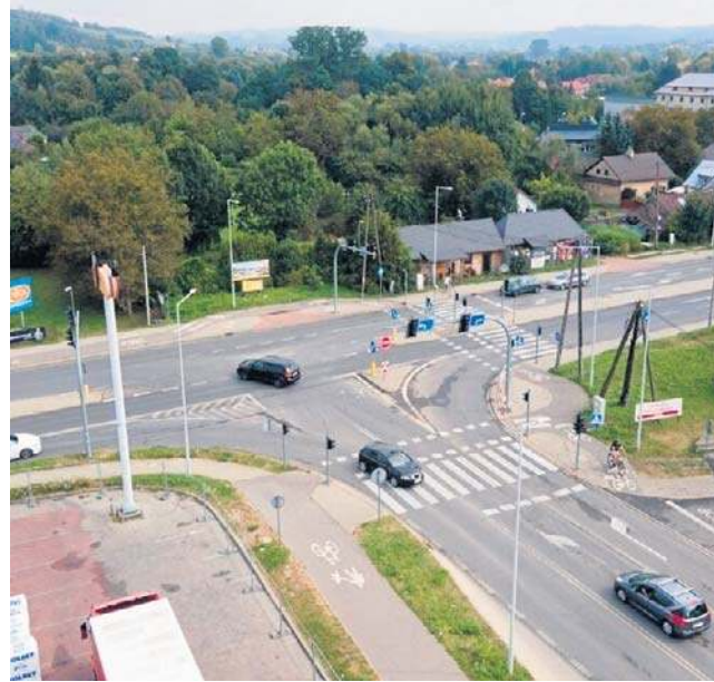
Obwodnica Tyczyna ma być gotowa w 2027 r. Według władz regionu, to „brakujące ogniwo” kluczowego szlaku komunikacyjnego na południe od Rzeszowa.

- Tyczyn bardzo potrzebuje takich inwestycji. Cieszymy się bardzo, że nasze miasto zostanie uwolnione od ruchu samo-