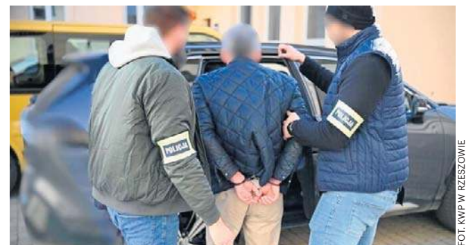
Za zarzucane przestępstwa mężczyźnie grozi do lat 10 więzienia

5 marca funkcjonariusze Wydziału do walki z Korupcją KWP w Rzeszowie zatrzymali inspek-