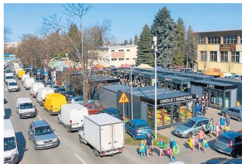
Tak miałyby wyglądać ul. Pułaskiego po przeniesieniu targowiska z pl. Balcerowicza – wizualizacja Rady Osiedla Pułaskiego

„Przedstawiane publicznie plany [zamiany działek] oraz brak konkretnych projektów sprawiają wrażenie działań prowadzonych w trybie chaotycznym i improwizowanym. Operacja zaczyna przypominać mechanizm spekulacji gruntami, w którym atrakcyjne tereny w centrum miasta trafiają w ręce prywatnego inwestora” – piszą autorzy petycji.