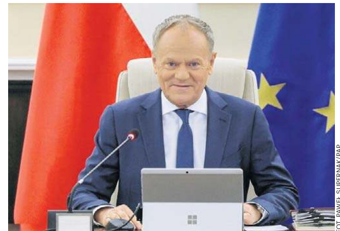
Rząd deklaruje, że po wecie prezydenta SAFE będzie realizowany w ramach programu „Polska Zbrojna”

Spłata pożyczki - jak wynika z uchwały - nastąpi ze