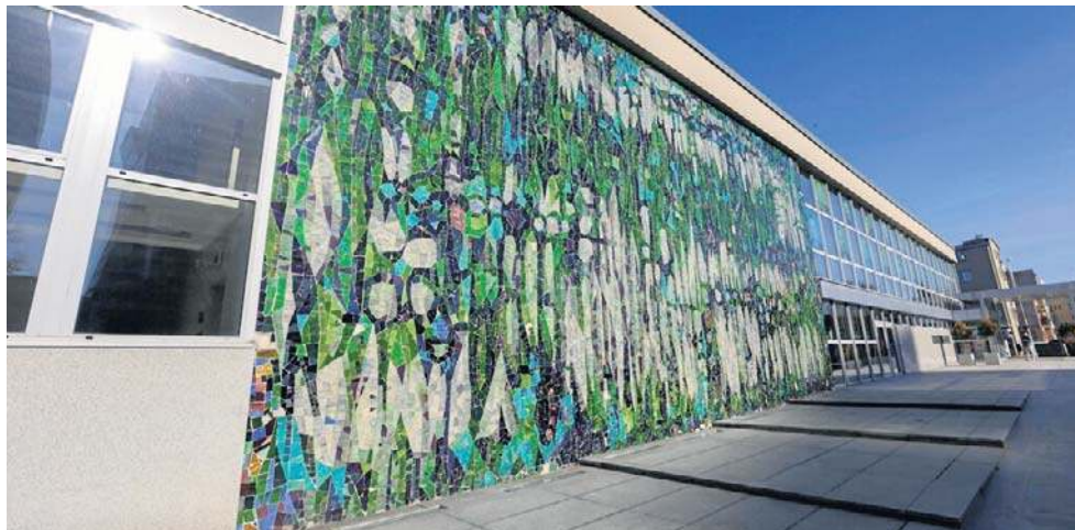
Mozaika zaprojektowana przez Zbigniewa Brodowskiego może zyskać ochronę konserwatorską

Paweł Kraus ze Strefy Działań Miejskich podkreśla, że wpis do rejestru zabytków budynku filharmonii pozwoli zachować w możliwie niezmi-