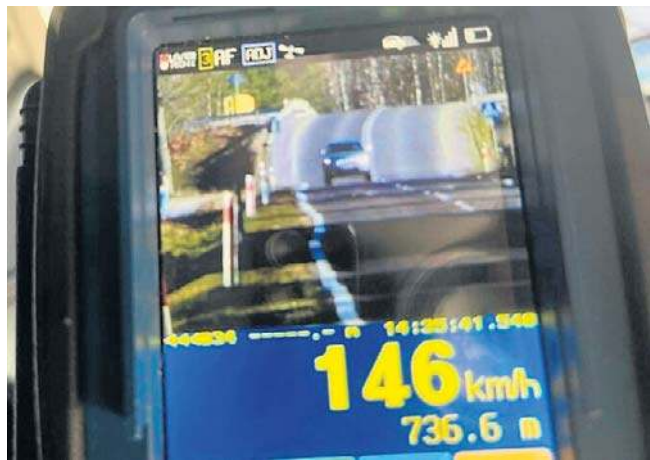
Zapis z policyjnego wideorejestratora - Jeep na drodze w m. Żabno, gm. Radomyśl nad Sanem