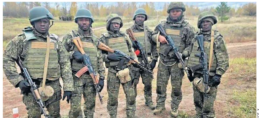
Według raportu kenijskiego wywiadu ponad 1000 Kenijczyków zostało zwerbowanych do walki przez Rosję

Z kolei Ławrow przekonywał, że obywatele Kenii dobrowolnie podpisali kontrakty na walkę u boku armii rosyjskiej.