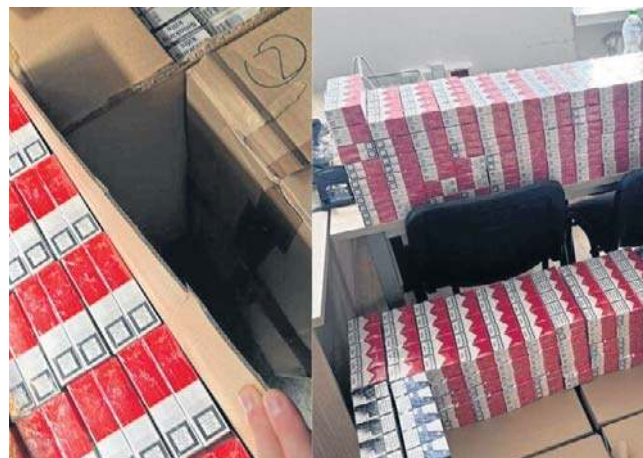
W miejscy zamieszkania oskarżonych znaleziono papierosy bez polskich znaków skarbowych akcyzy