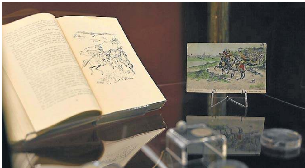
Na wystawie znalazły się XVII-wieczne eksponaty. M.in. monety, w tym szelągi Jana II Kazimierza, tzw. boraty; kaganek, elementy uzbrojenia (kule armatnie, ryngraf, nóż)