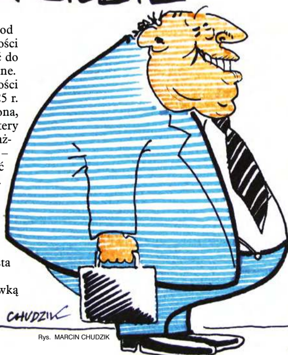
Rys. MARCIN CHUDZIK

(32,30 zł). Jeżeli ktoś jeszcze miał jakiegokolwiek wątpliwości, czyje interesy reprezentuje obecna władza sprzeciwiająca się rozsądnej propozycji związkowców – pensja minimalna na poziomie co najmniej 5200 zł brutto – to chyba je stracił.