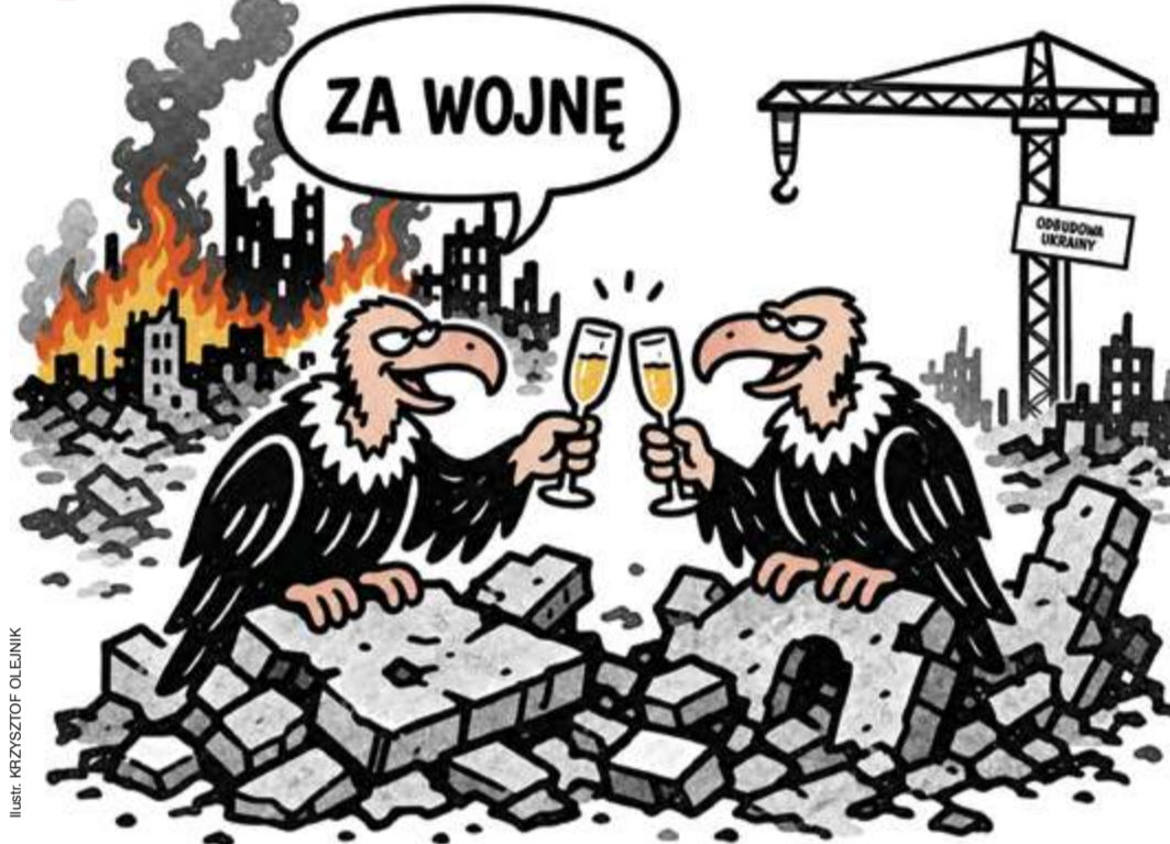
ILUSTRACJA: PRZYSZCZOF OLENIK

Wybraliśmy się do Gdańska, by sprawdzić, czy dąb imienia Lecha Wałęsy nad Motławą zaczął już owocować. Drzewko – w przeciwieństwie do swojego patrona – zachowuje na razie wstydliwą wstrzemięźliwość i żadnych żołądzi Wałęsy światu nie objawiło.