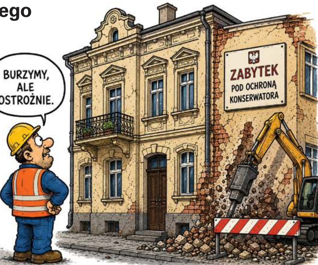
Ilustr. PAVEL FERENC

Historia zaczęła się w grudniu 2019 r., gdy Trzaskowski ogłaszał projekt Nowego Centrum Warszawy. Potem pojawiły się wizualizacje, kon-