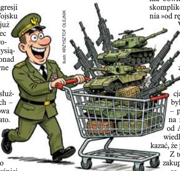
ILUSTR. KRZYSZTOF OLENIK

Dla porównania – nauka i szkolnictwo wyższe przez 365 dni tego roku zadowolili się będzie budżetem nieco powyżej 44 mld zł. Jako iż kasy jest w bród, a procedury trwają długo, armia coraz częściej sięga po zakupy z ominięciem wszelkich procedur wieloletniego