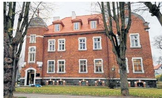
Sprawą zajęła się Prokuratura Rejonowa w Pucku

Sprawę do Prokuratury Rejonowej w Pucku zgłosił przewod-