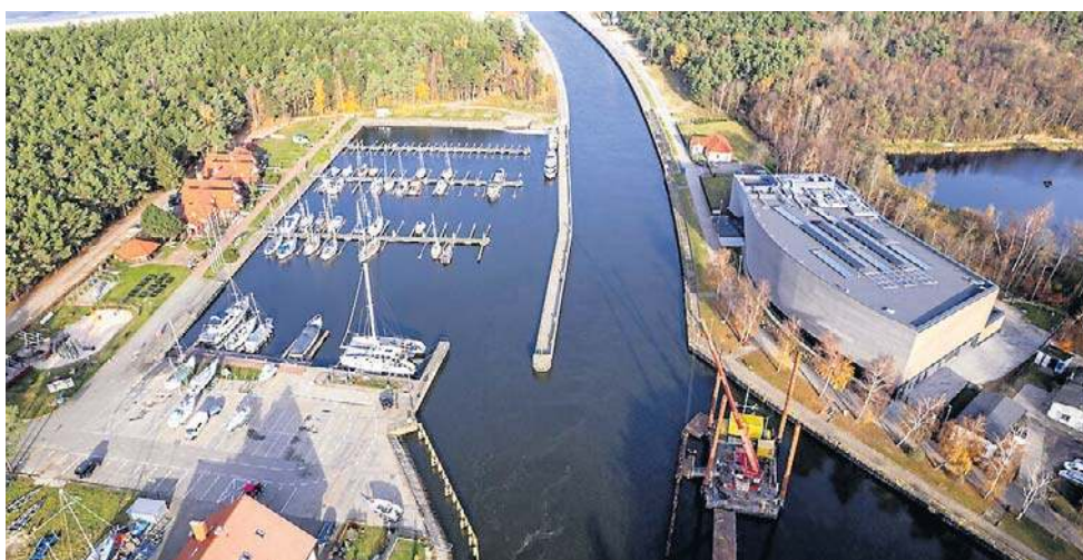
Prace na wschodniej stronie portu w Łebie nie będą prowadzone podczas sezonu

- Plaża wschodnia w całości będzie otwarta. Na plaży zachodniej będzie wykonywany falochron. Parking przy krzyżu będzie zamknięty i fragment plaży od zachodu. To jednak nie wpłynie na ruch turystyczny - mówi Agnieszka Derba, burmistrz Łeby, która podkreśla, że do kompromisu