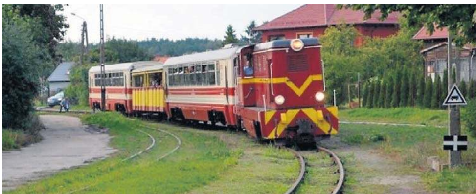
Pociąg Żuławskiej Kolei Dojazdowej wjeżdża na dworzec w nadmorskiej Steganie

Liczący około 30 km odcinek między Nowym Dworem Gdańskim a położonymi nad morzem Stegną, Sztutowem, Jantarem i Mikoszewem to pozostałość po rozbudowanej mocno w tej części Pomorza