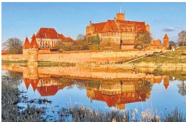
Zamek w Malborku jest chętnie odwiedzany. W ub. roku muzeum sprzedało ponad 760 tysięcy biletów

Muzeum Zamkowego w Malborku (i trzech innych) od listopada 2024 roku nie ma już w tym darmowym programie zwiedzania. MKiDN poinformowało wtedy o „powrocie do korzeni”, zapraszając do „odwiedzania czterech ico-