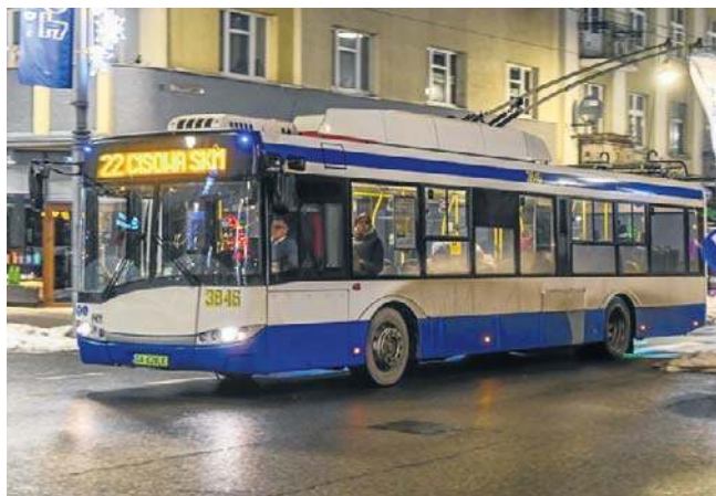
W Gdyni po przekroczeniu trzydziestego roku życia ulga znika, ale nie znika niepełnosprawność

Podobne ograniczenia wiekowe obecne są także w Gdańsku, gdzie również ze zniżek dla osób umiarkowanie niepełnosprawnych można korzystać do 30. roku życia. Osoby ze znacznym stopniem niepełno-