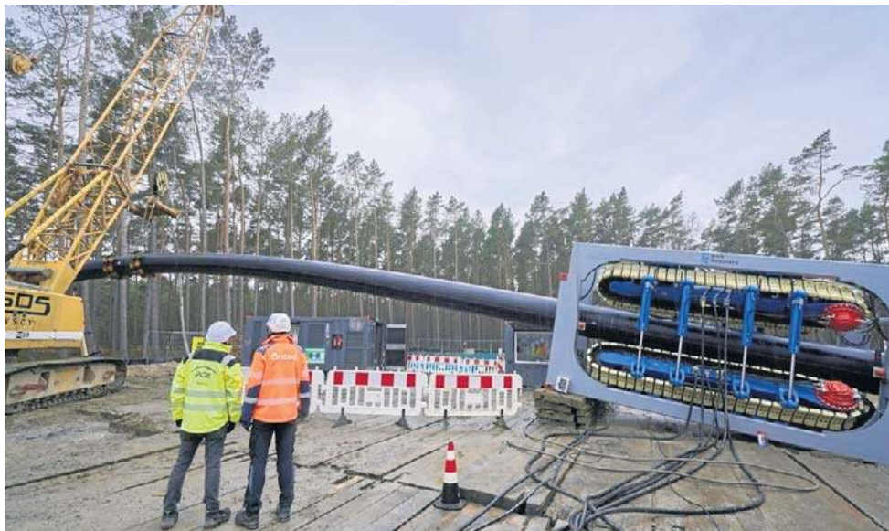
Prace przy przewiertach sterowanych morze-ład dla farmy wiatrowej Baltica 2

- Pomyślna instalacja czwartego i ostatniego odcinka kabla HDD stanowi znaczący krok naprzód w realizacji projektu i odzwierciedla doskonałą koordynację oraz zaangażowanie całego zespołu projektowego, a także współpracę z naszymi wykonawcami. Jesteśmy szczególnie dumni z wysokiej kultury bezpieczeństwa, jaką udało nam się wypracować na placu budowy podczas tej wymagającej technicznie operacji, oraz z zaangażowania wszystkich pracujących tam