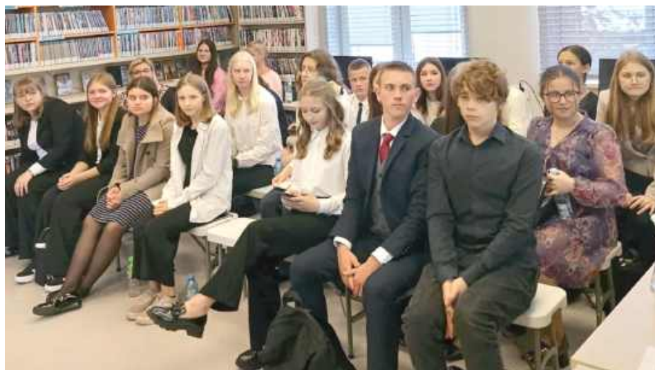
Przesłuchano 80 uczestników z gmin powiatu garwolińskiego, rywalizujących w trzech kategoriach wiekowych

27 maja 2025 r. w Miejsko-Powiatowej Bibliotece Publicznej w Garwolinie odbyły się eliminacje powiatowe XLI Konkursu Recytatorskiego im. Kornela Makuszyńskiego. Przesłuchano 80 uczestników z gmin powiatu garwolińskiego, rywalizujących w trzech kategoriach wiekowych.