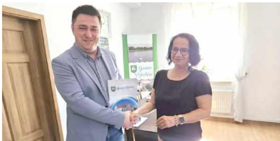
Kolejne drogi w gminie Żelechów zostaną przebudowane

30 maja podpisano umowę na część I zadania, obejmującą przebudowę dróg na terenie Gminy Żelechów. Zadanie realizować będzie firma Przedsiębiorstwo Robót Drogowych Lubartów S.A. W ramach zadania przewidziano wykonanie przebudowy dziewięć odcinków dróg w miejscowościach Nowy