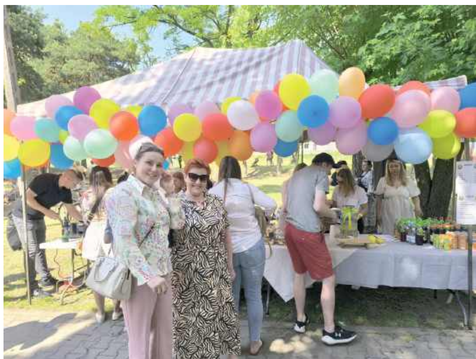
Festyn był doskonałą okazją do wspólnego spędzenia czasu na świeżym powietrzu, zabawy i integracji mieszkańców

naniu grupy Top Gun – Taekwondo oraz trening pokazywany młodym zawodnikom ŁKS „Promnik” przyciągnęły uwagę fanów aktywności fizycznej.