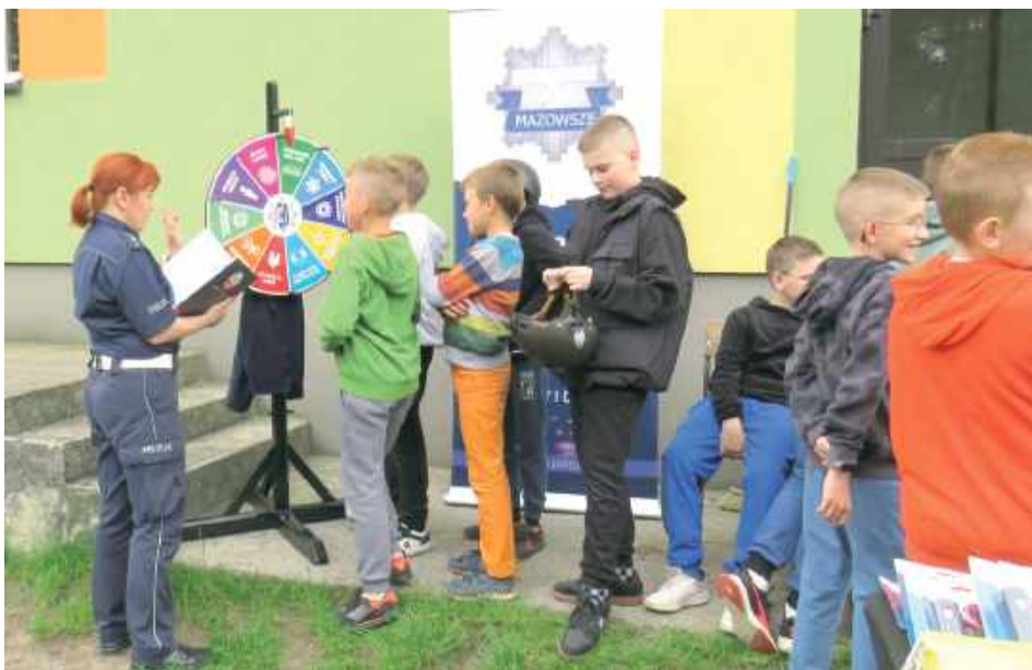
Cel inicjatywy jest zawsze ten sam – kształtowanie bezpiecznych postaw wśród najmłodszych uczestników ruchu drogowego

22 maja Publiczna Szkoła Podstawowa im. Szarych Szezegów w Zgórzu stała się miejscem wyjątkowego spotkania. Funkcjonariusze Policji, przy wsparciu Gminnej Komisji Rozwiązywania Problemów Alkoholowych w Miastkowie Kościelnym oraz Wojewódzkiego Ośrodka Ruchu Drogowego w Siedlcach, przeprowadzili kolejną odsłonę działań profilaktycznych pod nazwą „Bezpieczny Junior”.