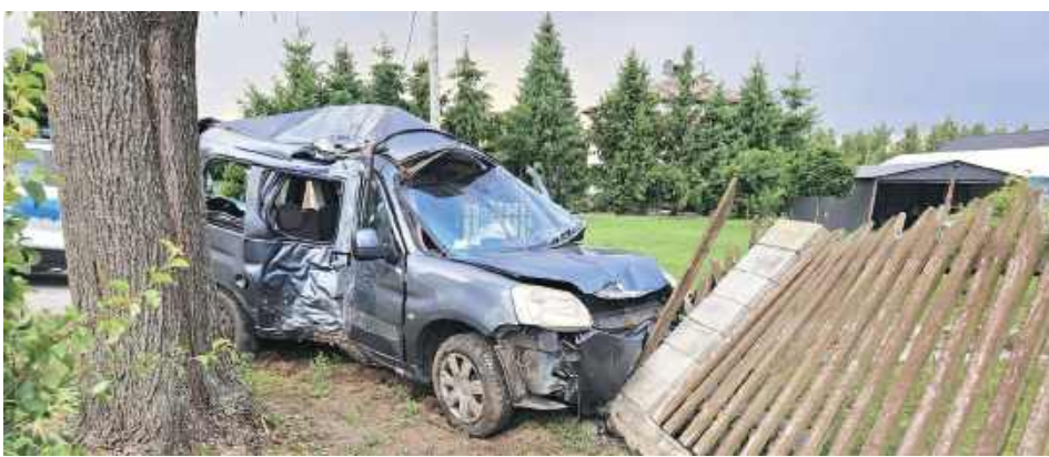
Kierowca trafił do szpitala

Na miejscu wstępnie ustalili, co się stało. 36-letni mieszkaniec powiatu ryckiego na łuku drogi stracił panowanie nad pojazdem, wypadł z drogi i uderzył najpierw w drzewo, a następnie w ogrodzenie