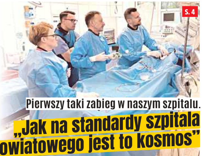
Pierwszy taki zabieg w naszym szpitalu.

NR 23 (93) WTOREK 10 CZERWCA 2025 R. CENA 3,90 ZŁ (W TYM VAT 5%)