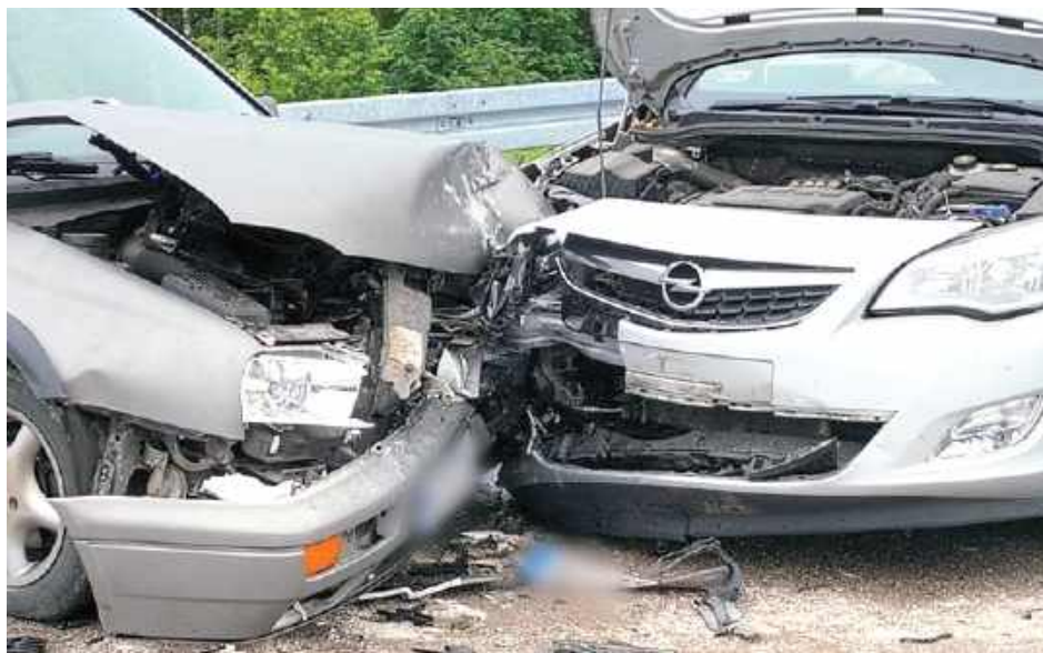
ok 18-latek stracił panowanie nad samochodem i doprowadził do czołowego zderzenia

8 czerwca w Gocławiu (gm. Pilawa) o godzinie 16 doszło do czołowego zderzenia volkswagena z oplem. Ze wstępnych ustaleń policjantów wynika, że 18-letni kierowca volkswagena, na mokrej nawierzchni i łuku drogi, zjechał na przeciwny pas, uderzając w pojazd kierowany przez 21-latkę. Kobieta z obrażeniami ciała została przewieziona do szpitala.