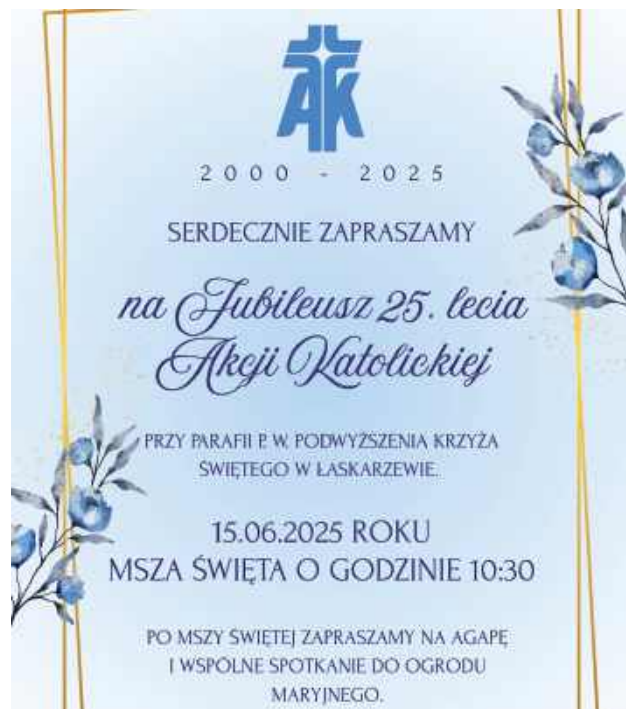
Centralnym punktem obchodów będzie msza święta sprawowana w kościele parafialnym Podwyższenia Krzyża Świętego o godzinie 10.30 (Parafia pw. Podwyższenia Krzyża Świętego w Łaskarzewie)

W niedzielę, 15 czerwca przy parafii pw. Podwyższenia Krzyża Świętego w Łaskarzewie odbędą się uroczystości związane z 25. rocznicą istnienia miejscowej Akcji Katolickiej.