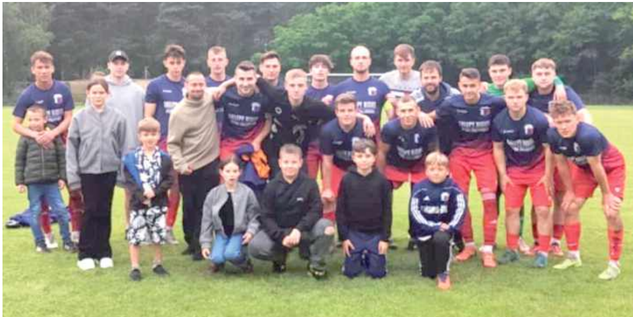
Zespół Promnika odrobił straty i pokonał AKS Zły 3:2