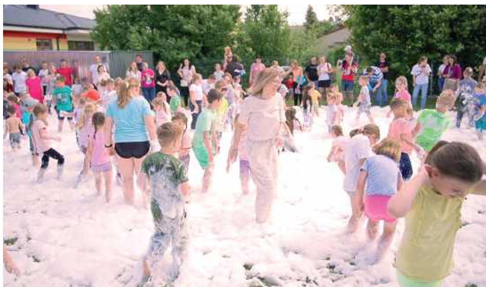
Dzieci bawiły się doskonale!

31 maja w Publicznym Przedszkolu im. Jasia i Małgosi w Sobolewie odbył się po raz pierwszy Dzień Rodziny. Wydarzenie miało na celu integrację środowiska przedszkolnego, w tym dzieci, rodziców i pracowników placówki.