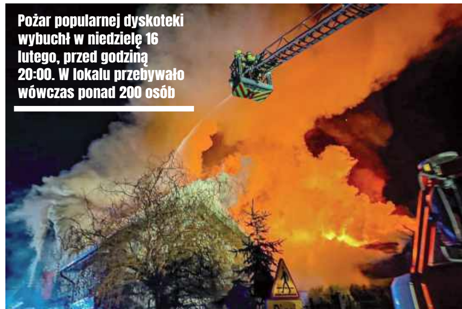
Pożar popularnej dyskoteki wybuchł w niedzielę 16 lutego, przed godziną 20:00. W lokalu przebywało wówczas ponad 200 osób

- To śledztwo było prowadzone w kierunku art. 163 §2 kodeksu karnego, czyli nieumyślnego spowodowania pożaru dyskoteki w Wildze i tym samym spowodowania zagrożenia dla osób, które w niej wówczas przebywały oraz dla mienia o znacznej wartości. Prokurator w dniu 29 maja wydał postanowienie o umorzeniu postępowania