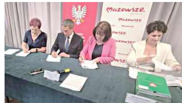
Miastków Kościelny z kolejnym zastrzykiem środków z Mazowsza

150 tys. zł to dofinansowanie na budowę nowej drogi, która połączy Zasiadały z Ryczyskami. Szacunkowy koszt całego zadania to ponad 300 tys. zł. Pieniądze z budżetu województwa mazowieckiego trafią także do pięciu sołectw z programu MIAS. Kwoty po 15 tys. zł wsparcia będą przeznaczone na remonty trzech świetlic (Stary Miastków, Kruszówka, Glinki) oraz na zakup wyposażenia do dwóch