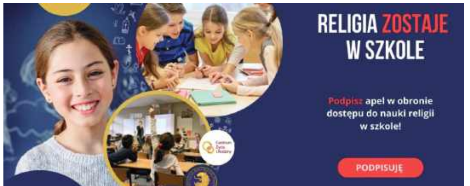
Aby złożyć podpis, należy być pełnoletnim obywatelem Polski i podać: imię, nazwisko, adres zamieszkania oraz numer PESEL (Parafia pw. Zwiastowania Najświętszej Maryi Panny w Żelechowie)

W przyszłą niedzielę, 15 czerwca po każdej mszy świętej przed kościołem parafialnym pw. Zwiastowania Najświętszej Maryi Panny w Żelechowie oraz przy parafialnych kaplicach będzie prowadzona zbiórka podpisów pod obywatelskim projektem ustawy dotyczącym nauczania religii