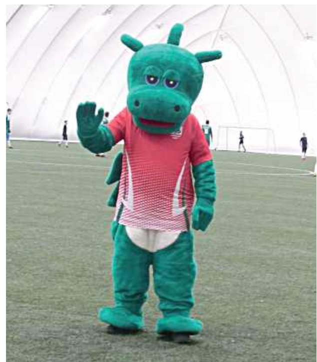
Nowoczesna hala pneumatyczna pochłonęła blisko 2,24 mln zł

-Hotel Miętne i sam powiat muszą dokładać do interesu. Nasuwają się zatem dwa pytania: czy wdrożenie tego projektu zostało poprzedzone gruntowną analizą i kolejne,