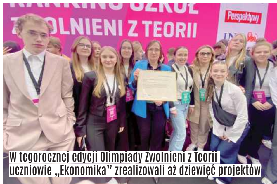
W tegorocznej edycji Olimpiady Zwolnieni z Teorii uczniowie „Ekonomika” zrealizowali aż dziewięć projektów

W tegorocznej edycji Olimpiady Zwolnieni z Teorii uczniowie „Ekonomika” zrealizowali aż dziewięć projektów. W działania zaangażowało się 60 uczniów, wspieranych przez