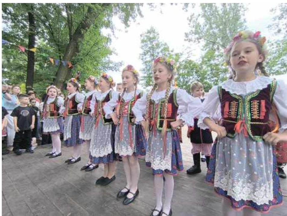
Na scenie swoje talenty zaprezentowali uczniowie z ZS nr 1 oraz ZS nr 2 w Łaskarzewie

W niedzielę, 1 czerwca 2025 r., Park Alejki w Łaskarzewie zamienił się w miejsce pełne dziecięcego śmiechu, muzyki i kolorowych atrakcji. Pod patronatem Burmistrza Łaskarzewa odbył się Festyn Rodzinny z okazji Dnia Dziecka, który zgromadził licznych mieszkańców miasta, szczególnie tych najmniejszych.