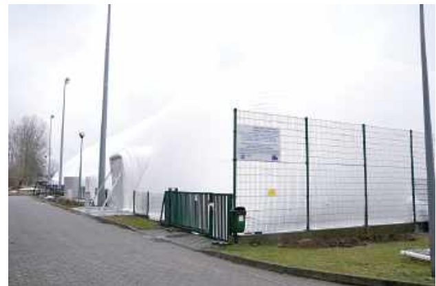
Dzięki hali pneumatycznej w okresie zimowym zawodnicy mieli gdzie trenować, bez względu na pogodę

Podsumowując - balon, który kosztował 2,5 mln zł i miał przynosić zyski, generuje tylko straty, brakuje chętnych do korzystania, a Powiatowy Ośrodek Sportu