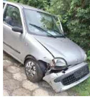
Kobieta podróżowała sama. Przekazano ją pod opiekę zespołu ratownictwa medycznego