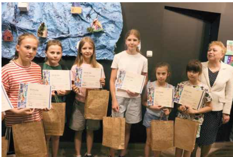
Prace prezentowane na wystawie to nie tylko rysunki, ale także kompozycje przestrzenne, projekty domów i wnętrz