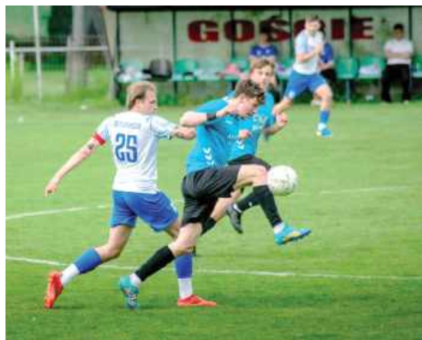
Po голу straconym w końcówce zespół Orła tylko zremisował z Józefowią II Józefów