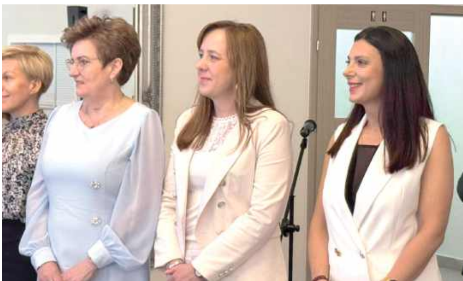
Była to doskonała okazja do uhonorowania zgromadzonych z okazji 35. rocznicy odrodzenia samorządu gminnego