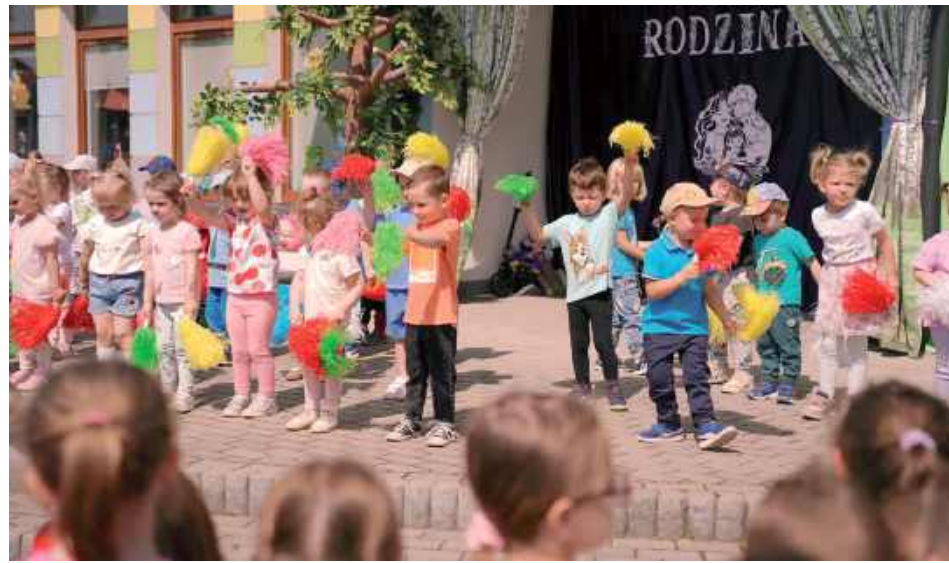
Całość wydarzenia została przygotowana przez pracowników przedszkola we współpracy z rodzicami i lokalnymi partnerami