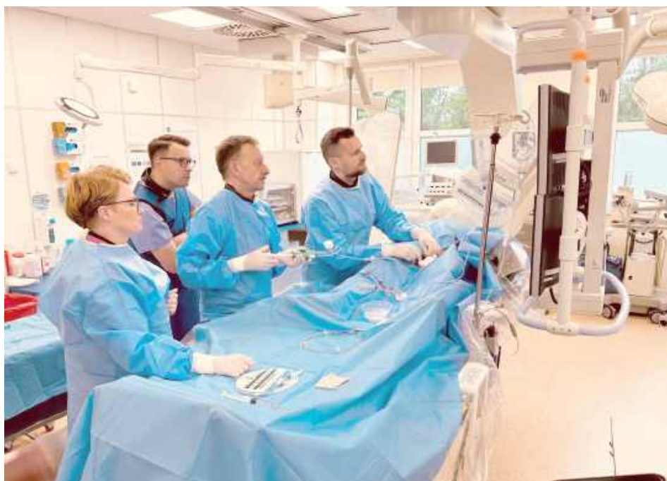
To nowoczesna, mało inwazyjna metoda leczenia ciężko zwapniałych zmian w tętnicach wieńcowych, które utrudniają prawidłowy przepływ krwi do serca

- Z dumą informujemy, że w naszym szpitalu wykonano pierwszy zabieg IVL (Intravascular Lithotripsy – wewnątrznaczyniowa litotrypsja). To nowoczesna, mało inwazyjna metoda leczenia ciężko zwapniałych zmian w tętnicach wieńcowych, które utrudniają prawidłowy przepływ krwi do serca - czytamy w mediach społeczno-