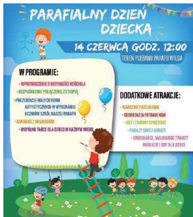
W programie znajdują się m.in. wprowadzenie o misyjności kościoła, bezpośrednie połączenie z Etiopią oraz prezentacje małych form artystycznych w wykonaniu uczniów parafii Wilga (Parafia WNMP w Wildzie)