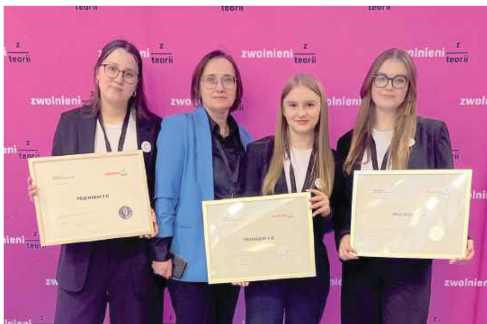
Uczniowie Zespołu Szkół nr 1 w Garwolinie wzięli udział w ogólnopolskiej Olimpiadzie Zwolnieni z Teorii