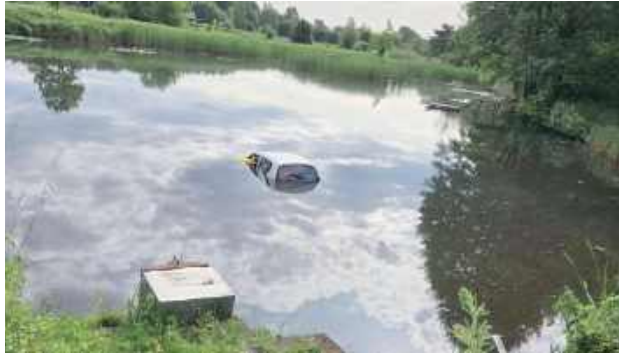
Na szczęście 76-latce udało się samodzielnie wydostać z auta jeszcze przed przybyciem służb

– 76-letnia kobieta źle się poczuła za kierownicą samochodu osobowego i zjechała z drogi do stawu. Na szczę-