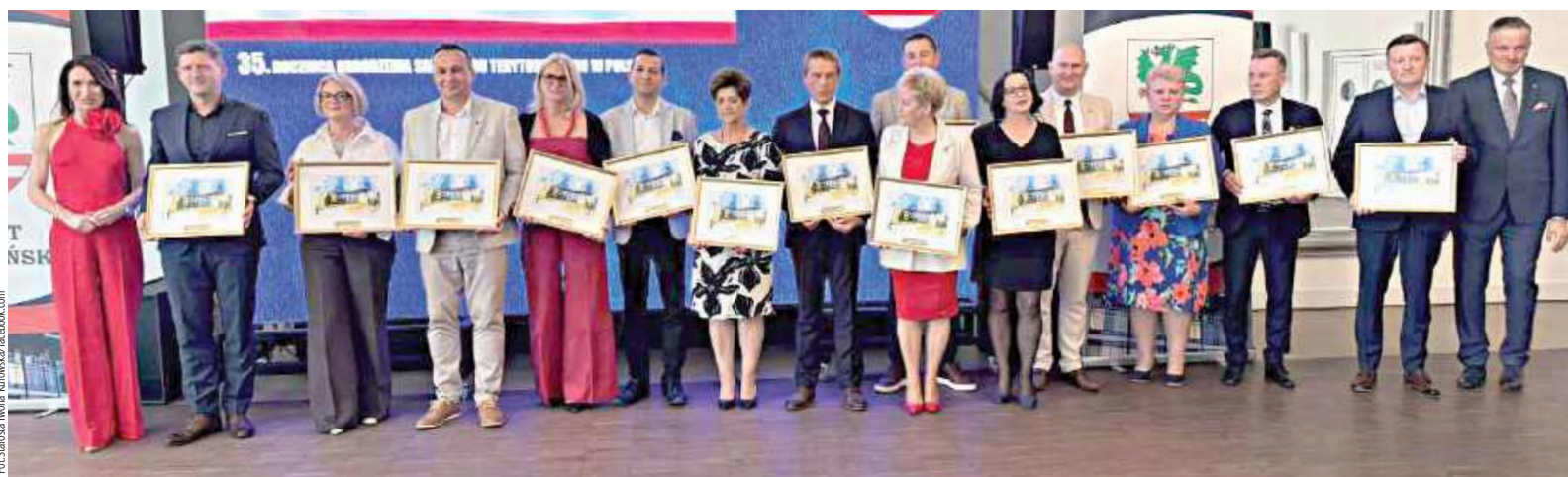
Uroczyste, jubileuszowe spotkanie z okazji Dnia Samorządu Terytorialnego odbyło się 30 maja

Była to doskonała okazja do uhonorowania zgromadzonych z okazji 35. rocznicy odrodzenia samorządu gminnego. Włodarze powiatu przekazali samorządowcom listy gratulacyjne i okolicznościowe obrazki.