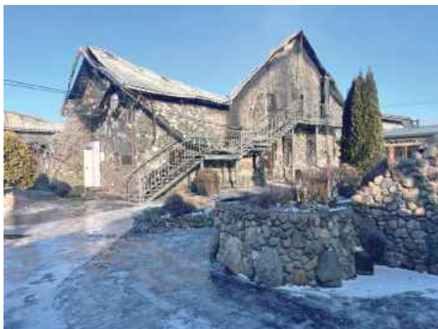
Straty oszacowano na 10 milionów złotych

„Prokuratura Rejonowa w Garwolinie zawiadamia, że postanowieniem z dnia 29 maja 2025r. zostało umorzono śledztwo w sprawie zaistniałego w dniu 16 lutego 2025r.