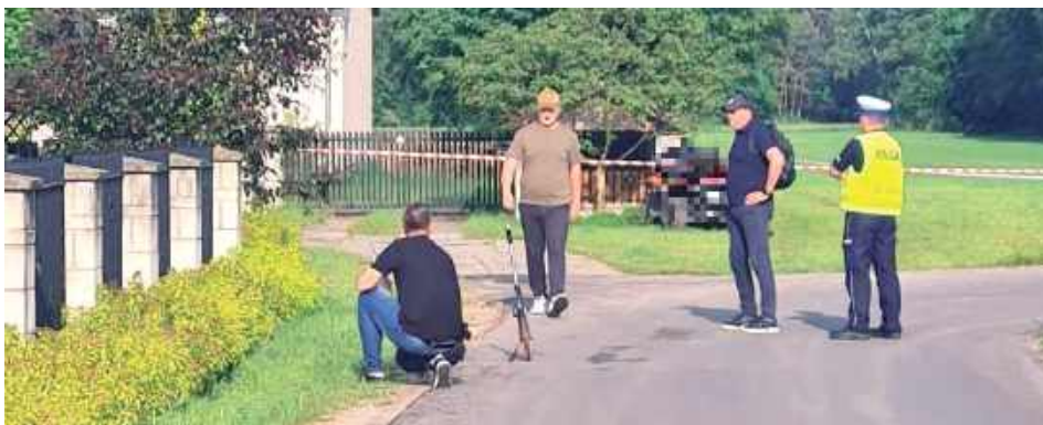
Policja i prokuratura przez wiele godzin prowadziły działania polegające na zbieraniu i zabezpieczeniu śladów

W piątek, 6 czerwca w miejscowości Uścieniec-Kolonia (gm. Wilga) doszło o tragicznego wypadku. 32-letni mężczyzna wjechał quadem w ogrodzenie posesji. Zginął na miejscu.