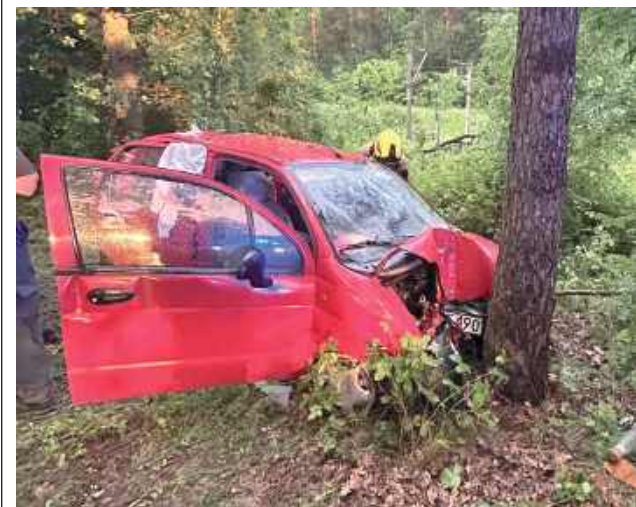
7 czerwca w Jażwinach (gm. Borowie) 21-letni kierowca daewoo zjechał z drogi i uderzył w drzewo. W wyniku wypadku ranne zostały trzy osoby: kierowca, 20-letnia pasażerka oraz półtoraroczne dziecko. Wszyscy trafili do szpitala.