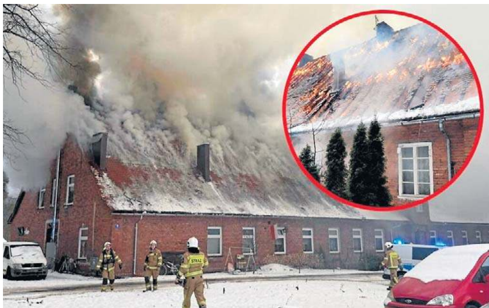
Budynek przy ul. Leśnej w Kluczborku spłonął w styczniu bieżącego roku. Trzymiesięczne śledztwo jak dotąd nie przyniosło wyjaśnienia przyczyn pożaru.

Ogień pojawił się w środę 14 stycznia około godziny 14.00 na poddaszu i bardzo szybko objął kolejne części obiektu. Ze względu na konstrukcję budynku oraz jego znaczną powierzchnię – około 2000 metrów kwadratowych – żywioł rozprzestrzenił się dynamicznie, co znacząco utrudniało działania ratowników. Akcja gaśnicza była długotrwała i wymagająca – zakończyła się dopiero tuż przed 6.00 następnego dnia. W działaniach