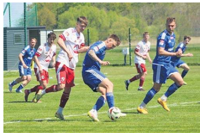
Ostatni mecz kompletnie nie wyszedł LZS-owi Starowice Dolne. Pozwolił on sobie wbić aż sześć bramek

Nie poprawiły natomiast swojego położenia ekipy z Opolszczyzny znajdujące się w dolnej części tabeli. Zryw Polonii Nysa w końcówce, zakończony zdobyciem dwóch goli, nie pozwolił jej zapunktować w domowym starciu ze Skrą Częstochowa, ponieważ wcześniej straciła aż trzy bramki.