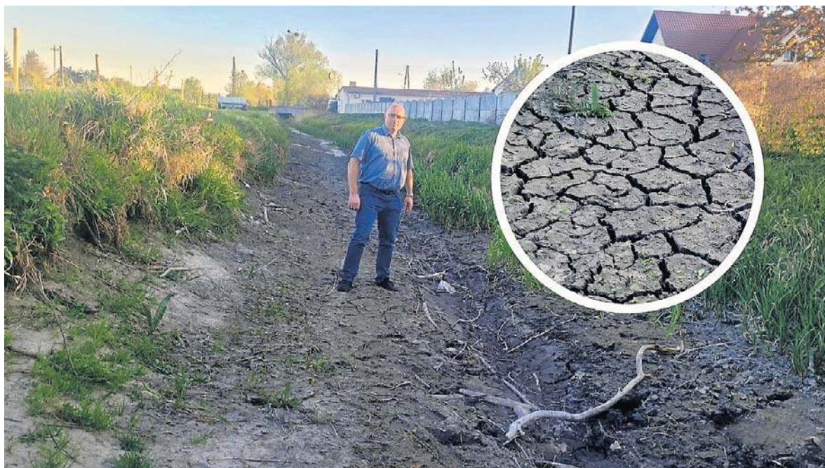
Jeśli szybko nie nadejdą obfite opady, sytuacja stanie się po prostu katastrofalna - mówi wójt Jemielnicy.

Hołd i kwiaty dla powstańców. Uroczystości w 105. rocznicę wybuchu III Powstania Śląskiego str. 4