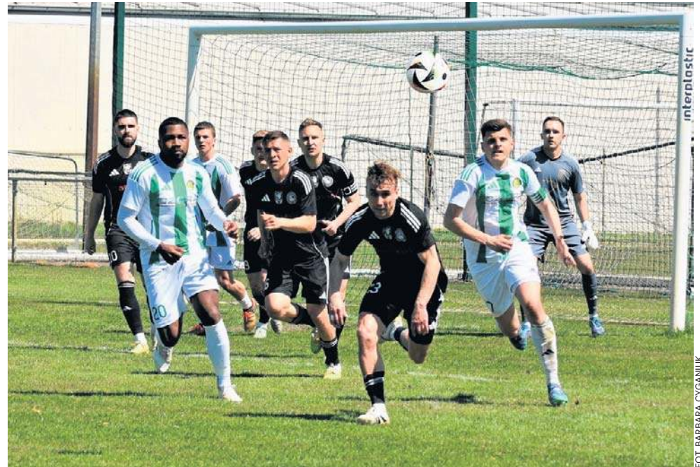
Sześć bramek oglądaliśmy w meczu Śląsk Łubniani - Corotop Małapanew Ozimek

Ponadto, ze zwycięstwa w majówkę cieszyły się również drużyny Fortuny Głogów-