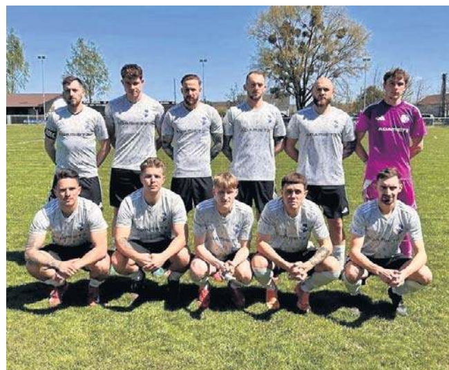
Adamietz Kadłub w rundzie wiosennej nie obniżył lotów i dalej zdecydowanie prowadzi w tabeli grupy 1