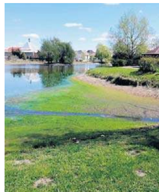
Woda przestała zasilać staw w Jemielnicy.

Leśnicy przypominają jednocześnie, że aż 99% wszystkich pożarów lasów wybucha z winy człowieka, z czego prawie połowa to celowe, złośliwe podpalenia. W związku z tym, od stycznia 2026 roku drastycznie zaostrzono przepisy karne, co ma stanowić sku-