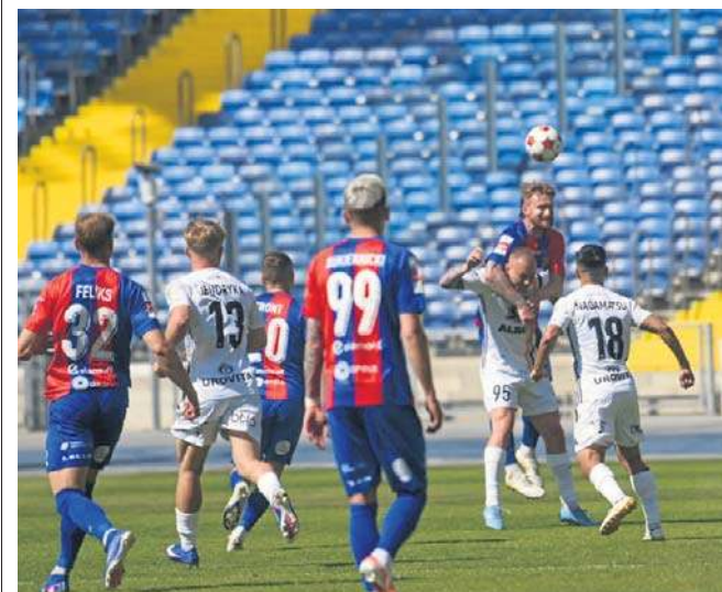
Odra Opole miała swoje szanse bramkowe, lecz ogólnie spotkanie w Chorzowie toczyło się na warunkach Ruchu