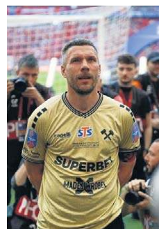
Łukasz Podolski na razie ma 8 procent akcji Górnika

Cieszymy się dzisiaj, jutro z Pucharu, a potem znów liga, przygotowania na te ostatnie cztery mecze, po to, żeby to miejsce, jakie teraz mamy, utrzymać. Może uda się jeszcze trochę więcej? I potem na spokojnie usiądź sobie i zobacz, jak to pójdzie dalej.