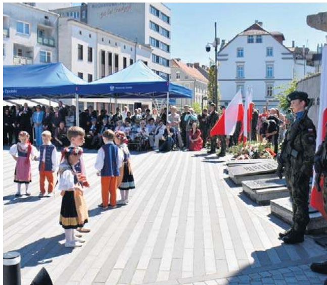
W trakcie obchodów zaprezentowały się także dzieci w przygotowanym programie artystycznym.

- Stajemy dziś pod białoczerwoną flagą z poczuciem dumy i odpowiedzialności, aby uczcić rocznicę uchwalenia Konstytucji 3 Maja, czyli jed-