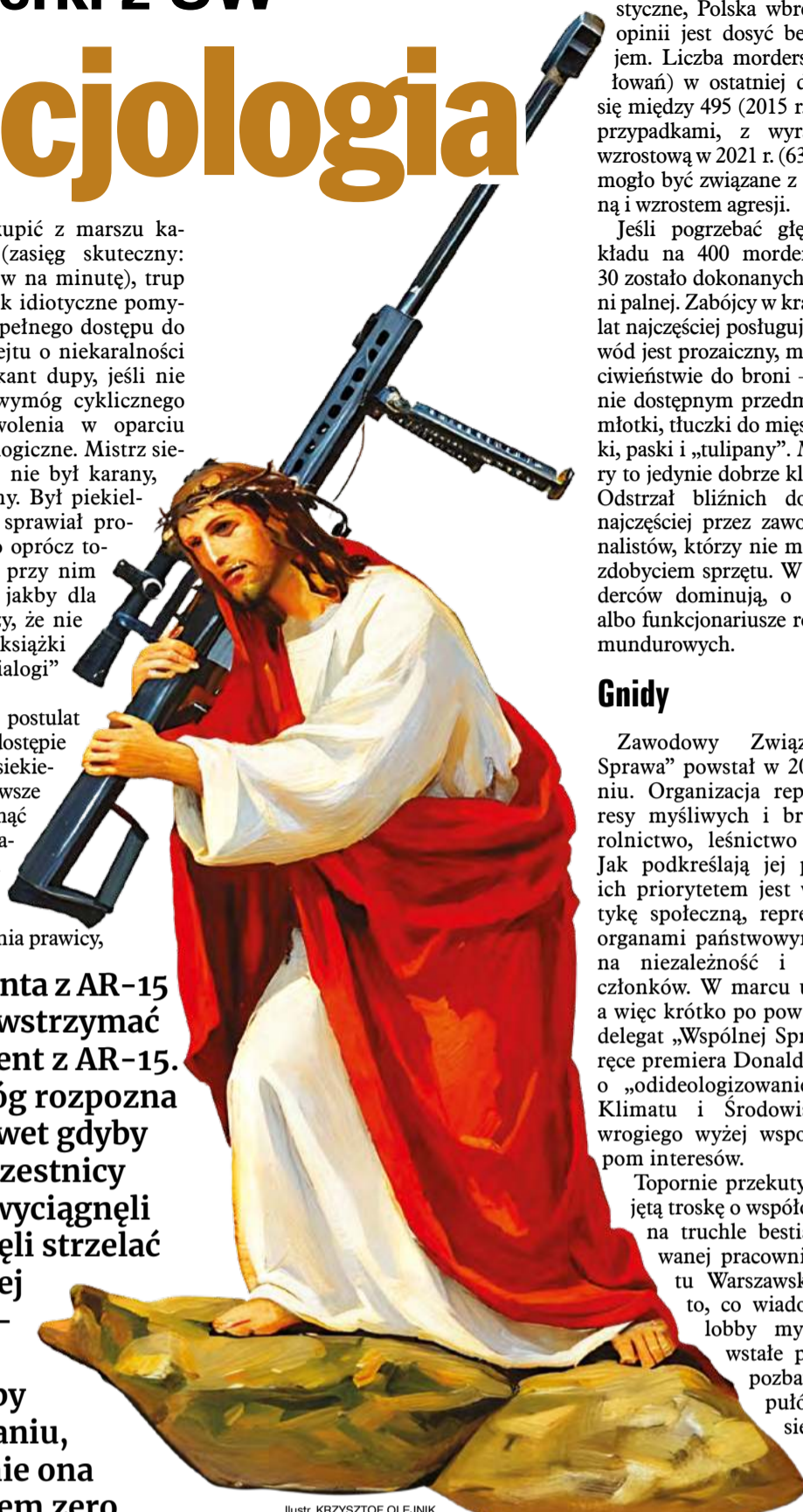
Ilustr. KRZYSZTOF OLEJNIK

złego studenta z AR-15 mógłby powstrzymać dobry student z AR-15. Przecież Bóg rozpozna swoich, nawet gdyby wszyscy uczestnicy wydarzeń wyciągnęli broń i zaczęli strzelać do pierwszej przypadkowej osoby w przekonaniu, że to właśnie ona jest strzelcem zero.