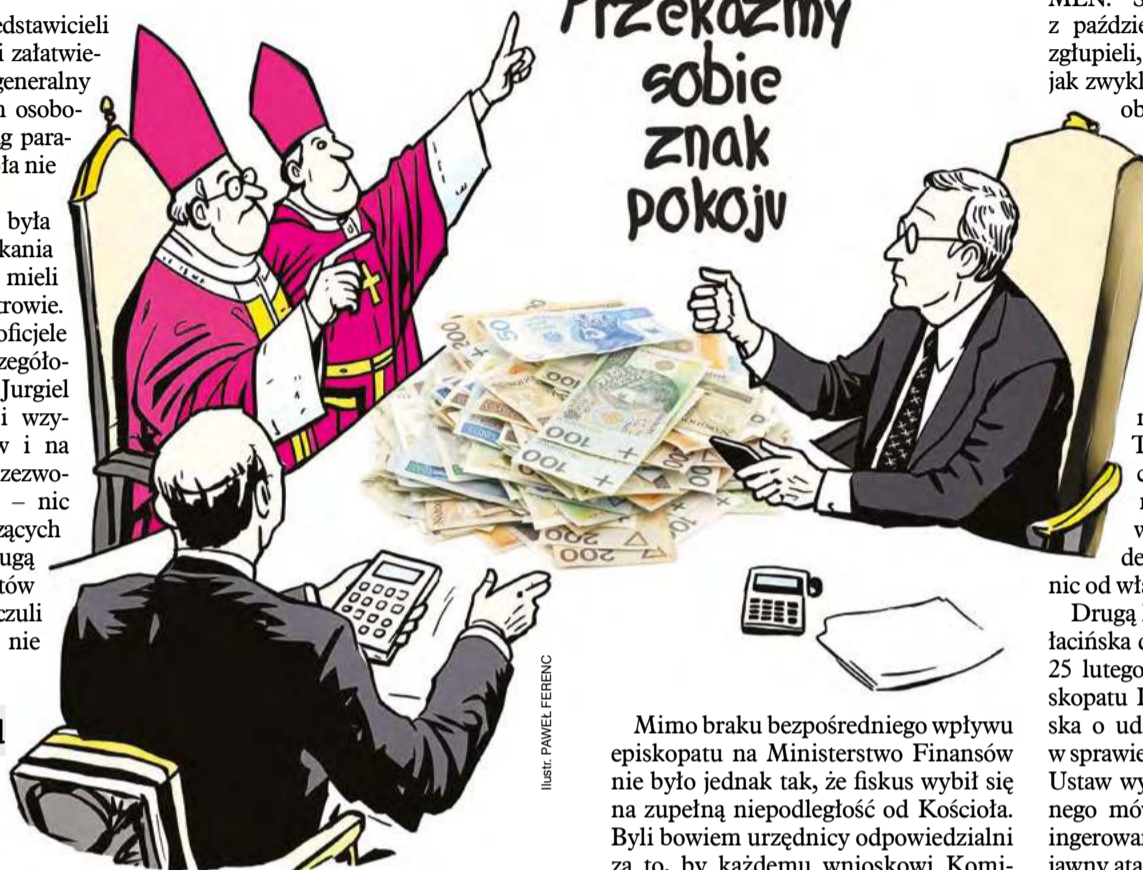
ILUSTR. PAVEL FERENC

Co ciekawe, episkopat nie przydzielił swoich opiekunów tylko w kilku resortach. Wybronił się jakimś cudem: