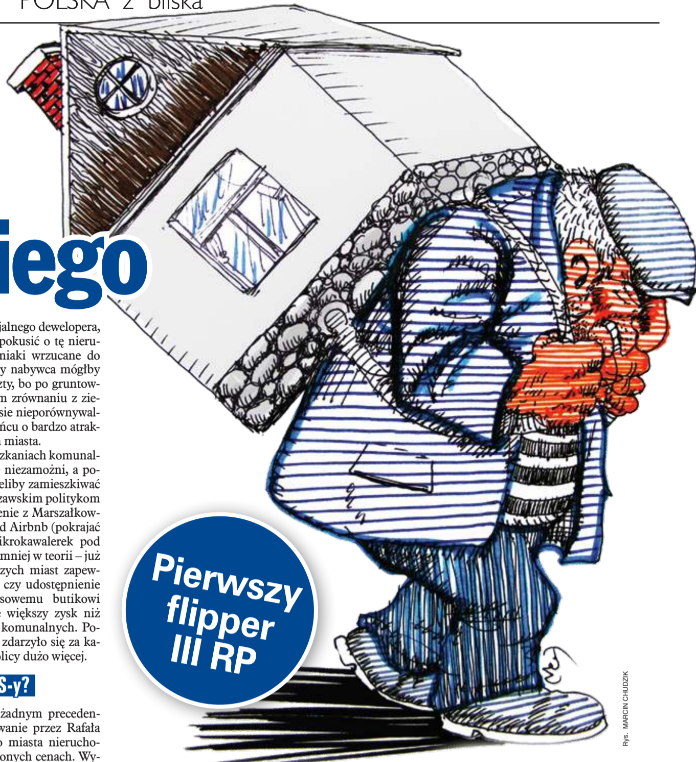
Rys. MARCIN CHUDZIK

W latach 2018–2024 do użytku w Warszawie zostało oddanych niecałe 1400 mieszkań komunalnych lub lokali TBS-owskich, a więc mniej niż deklarowana wcześniej roczna liczba. Czy miasto stołeczne Warszawa rozpaczliwie potrze-