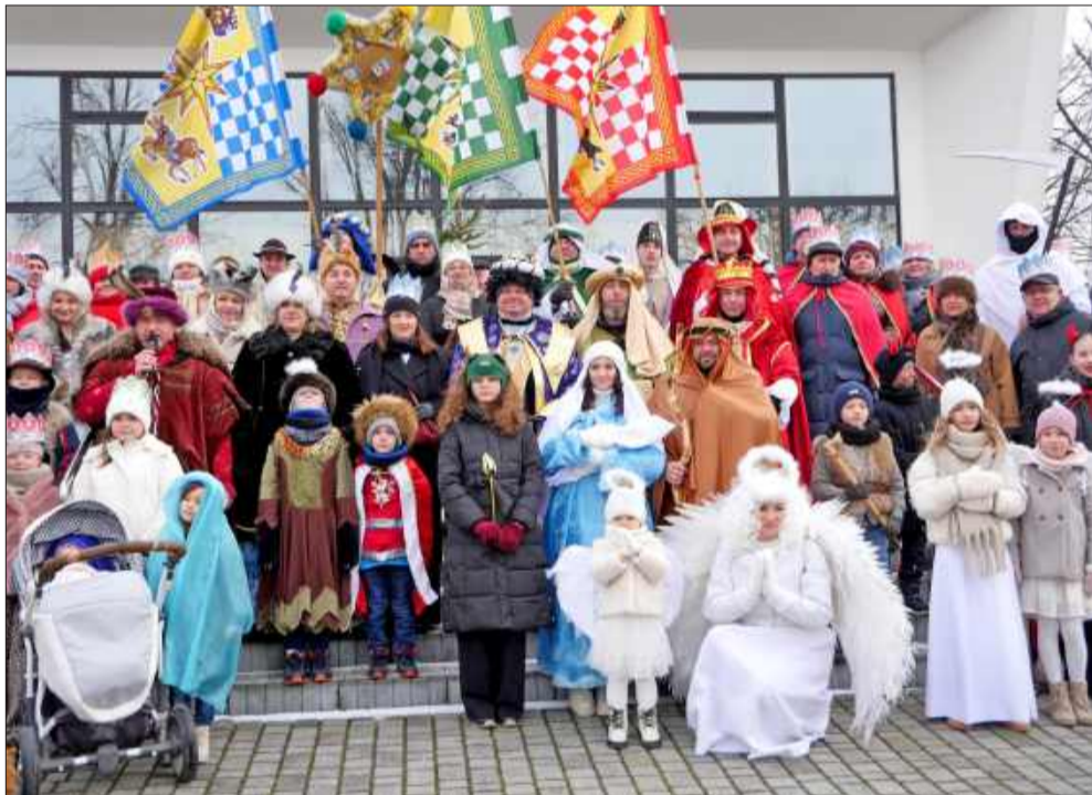
Mieszkańcy Partyni licznie włączyli się we wspólne świętowanie.