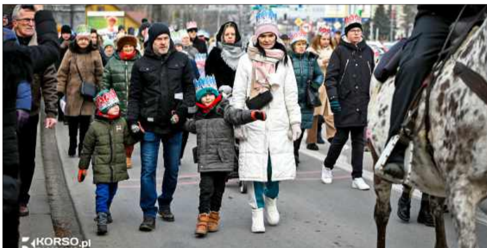
Tradycja, która łączy mieszkańców.