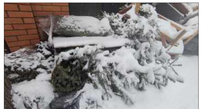
Choinki już od początku stycznia zalegają obok altan śmietnikowych