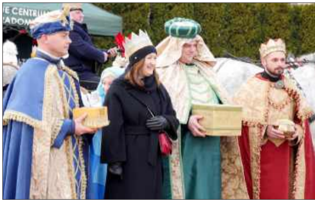
Trzech króli... i burmistrz Radomyśla!