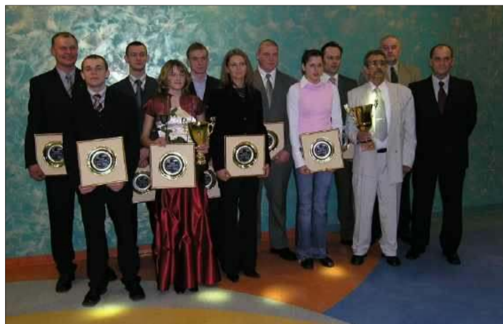
Najlepsi sportowcy w 2005 roku.