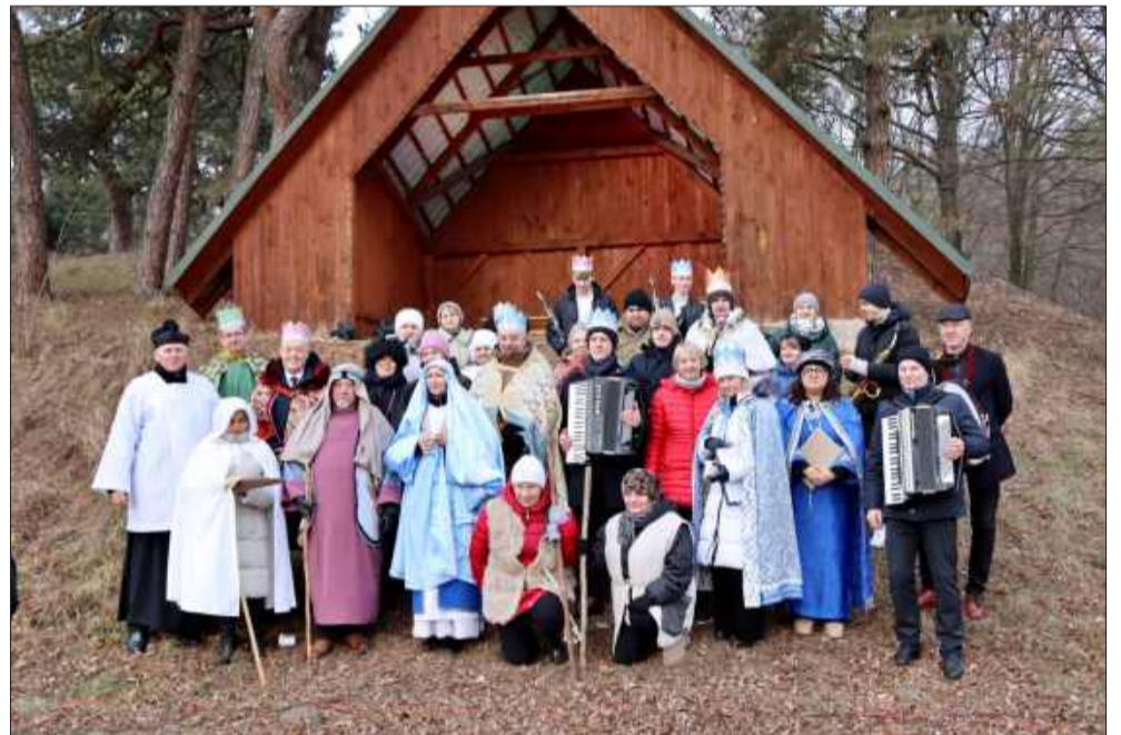
Pokolenia razem w świątecznym kolędowaniu w gm. Tuszów Narodowy.