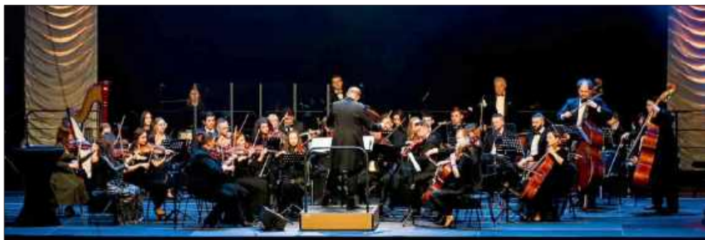
Tak Orkiestra powitała nowy rok!