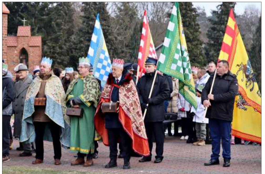
Symboliczne korony i barwne stroje trzech Króli w Jaślanach.