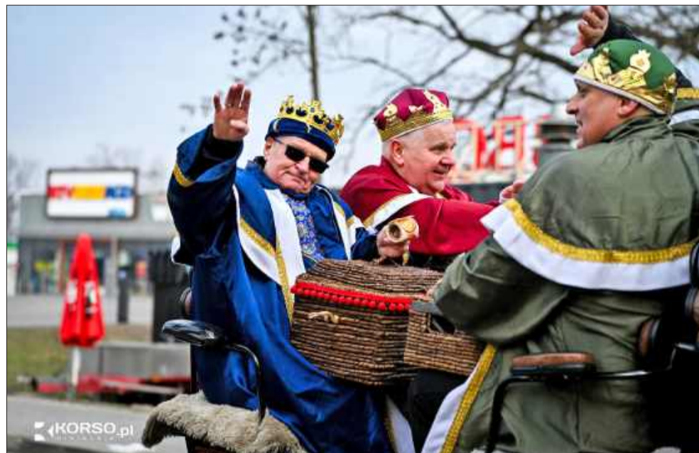
Trzej Królowie, pasterze i aniołowie w miejskim pochodzie.

Kulminacją obchodów miała miejsce na mieleckim rynku, gdzie uczestnicy wspólnie koleđowali i oddali hołd Dzieciątku Jezus. Orszak zakończył się około godziny 13:30, pozostawiając po sobie poczucie wspólnoty i radości płynącej z kultywowania wieloletniej tradycji. jb