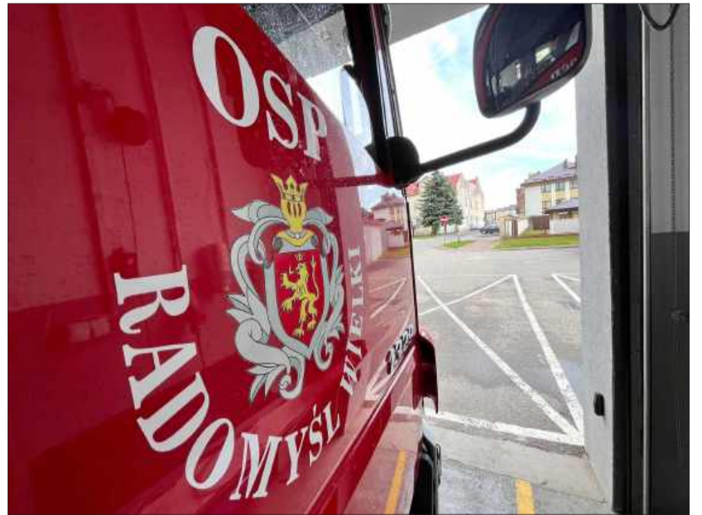
OSP Radomyśl Wielki miała w tym roku ręce pełne roboty.

W 2025 roku podkarpacki strażacy podejmowali działania w niemal 29 tysiącach przypadków. W 2025 roku, wśród jednostek OSP z terenu województwa, zdecydowanym liderem, jeśli chodzi o liczbę wyjazdów, była OSP Radomyśl Wielki.