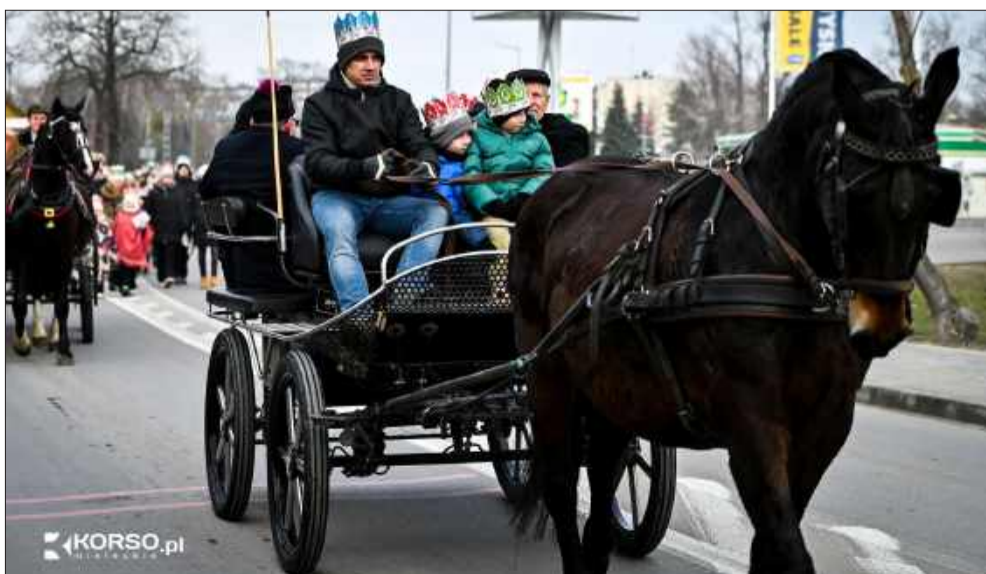
Kolory, korony i koleđy na ulicach Mielca.