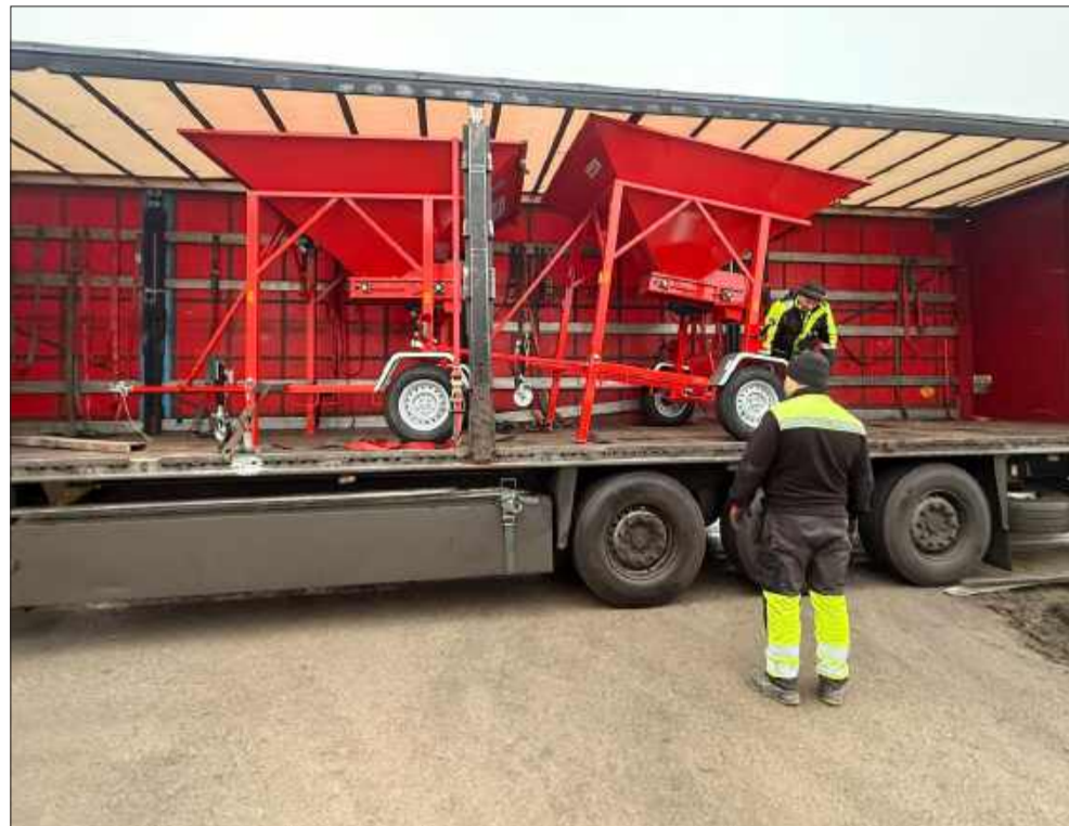
Gmina Wadowice Górne zainwestowała także w sprzęt dla jednostek OSP.

Wśród innych zakupionych urządzeń znalazły się m.in. defibrylator AED, który ma na celu zwiększenie szans na przeżycie w nagłych wypadkach, oraz przenośna stacja filtracji wody, niezbędna w przypadku klęsk żywiołowych, gdy dostęp do czystej wody może zostać ograniczony. Dodatkowo, gmina zakupiła beczkowóz do przewozu wody pitnej, co może okazać się nieocenione w przypadku sytuacji kryzysowych, które wymagają dostarczenia wody do osób potrzebujących.