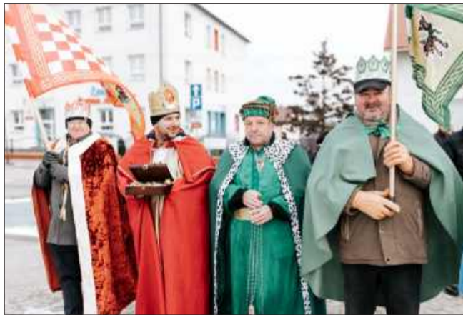
Orszak Trzech Króli na ulicach Przecławia.