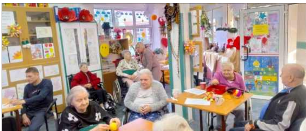
Seniorzy otrzymali miły prezent

Akcja przyniosła wiele radości zarówno dzieciom, jak i seniorom. Z pewnością była to niezapomniana lekcja życzliwości, współdziałania i szacunku, która pozostanie w sercach uczestników na długo. To także doskonały przykład tego, jak współpraca między pokoleniami może być źródłem ciepła, wzajemnego zrozumienia i poczucia przynależności do wspólnoty. Zarówno dzieci jak osoby starsze mają potrzebę wykorzystania pokładów ciepła, które w nich drzemią. Nietrudno zgadnąć, że wiele osób korzystających z pomocy DPS-u zmaga się z samotnością. Dzięki inicjatywie przedszkolaków jest jej trochę mniej. Oby tak dalej! gj