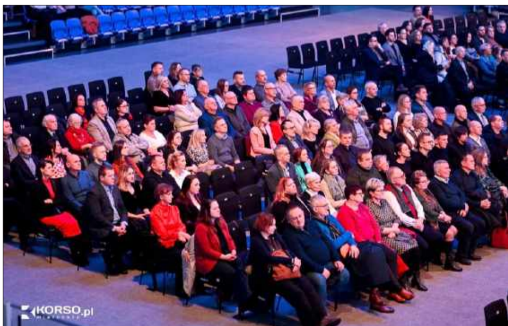
Hala sportowa zapełniła się melomanami.