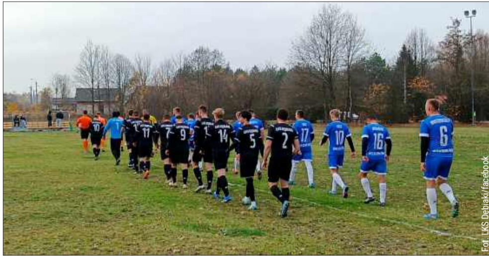
LKS Dębiaki minioną rundę mogą zaliczyć do udanych

Solidne rezerwy Victorii, Grunwald i Wiśnia