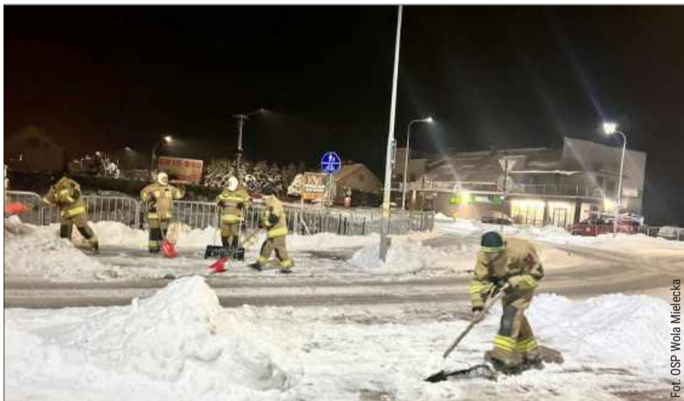
Dzięki nim jest bezpieczniej. Strażacy pomagają zimą

Zimowa aura potrafi dać się we znaki – opady śniegu, mróz i oblodzenia sprawiają, że codzienne funkcjonowanie staje się trudniejsze, a poruszanie się po chodnikach i drogach bywa niebezpieczne. To właśnie w takich momentach szczególnie widać, jak ważną rolę odgrywają strażacy ochotnicy, gotowi do działania nie tylko podczas pożarów czy wypadków, ale także w codziennych, zimowych sytuacjach.