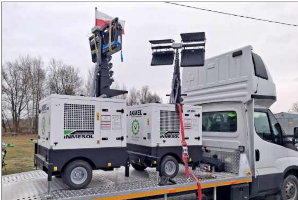
Agregaty przybyły do Radomyśla.

To nie tylko gotowość na wojnę. Samorządy w całej Polsce budują odporność na wypadek klęsk żywiołowych, blackoutów czy wyjątkowych warunków pogodowych.