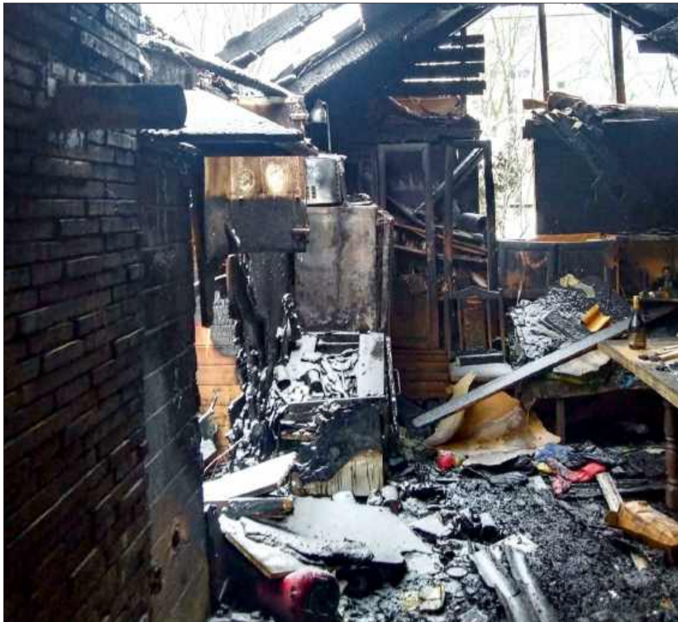
Pożar zabrał pasję i rodzinne chwile. Ruszyła zbiórka.

Osoby, które chcą wesprzeć odbudowę altany, mogą to zrobić poprzez trwającą zbiórkę na portalu „Zrzutka.pl”. Dla rodziny to nie tylko pomoc materialna, ale także ogromne wsparcie emocjonalne i dowód solidarności w trudnym momencie.