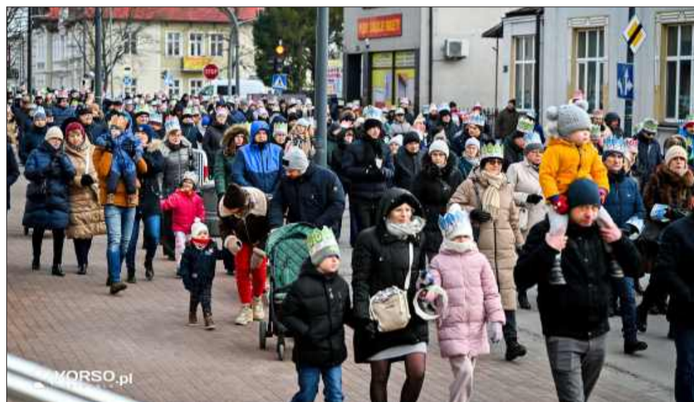
Barwny orszak przeszedł ulicami Mielca.