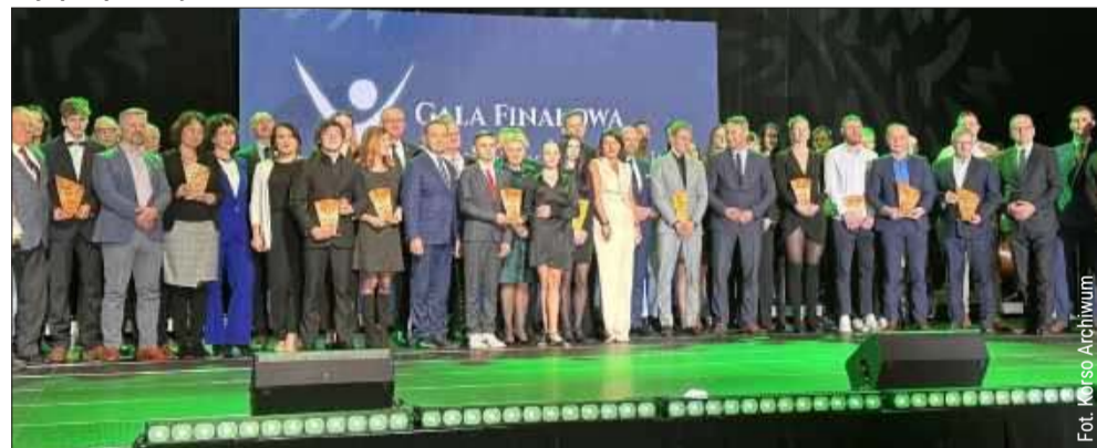
Na zdjęciu laureaci z 2023 roku.