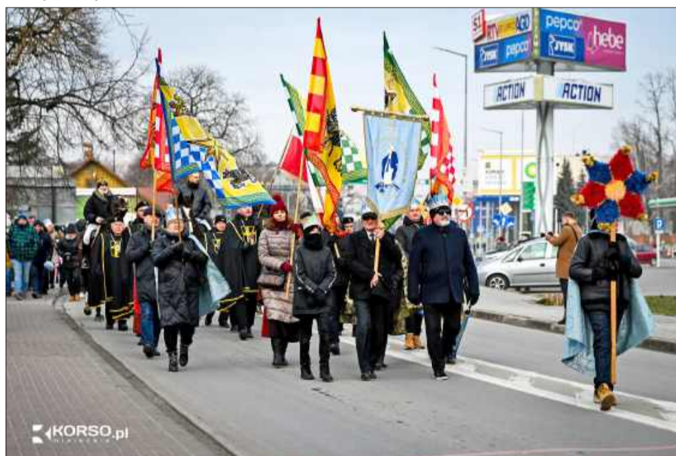
Rodziny, wspólnoty i barwne stroje – czas wyruszyć.