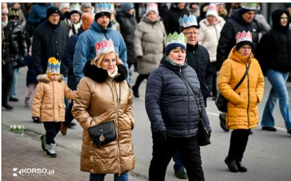
Wspólne koleđowanie w drodze na rynek.