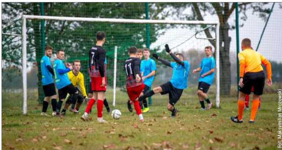
Na boiskach klasy B6 nie brakuje emocji i goli.

Na czwartym miejscu zmagania po jesieni zakończył zespół Radomyślanki II Radomyśl Wielki. Drużyna ta miała najlepszą defensywę w lidze, która pozwoliła w całej rundzie na stratę tylko ośmiu bramek.