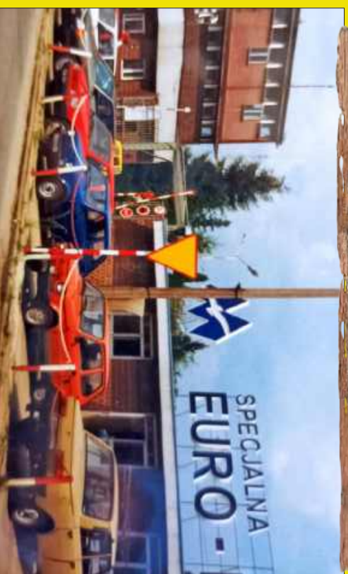
Lata 90. w Mielcu. Samochody były kolorowe...