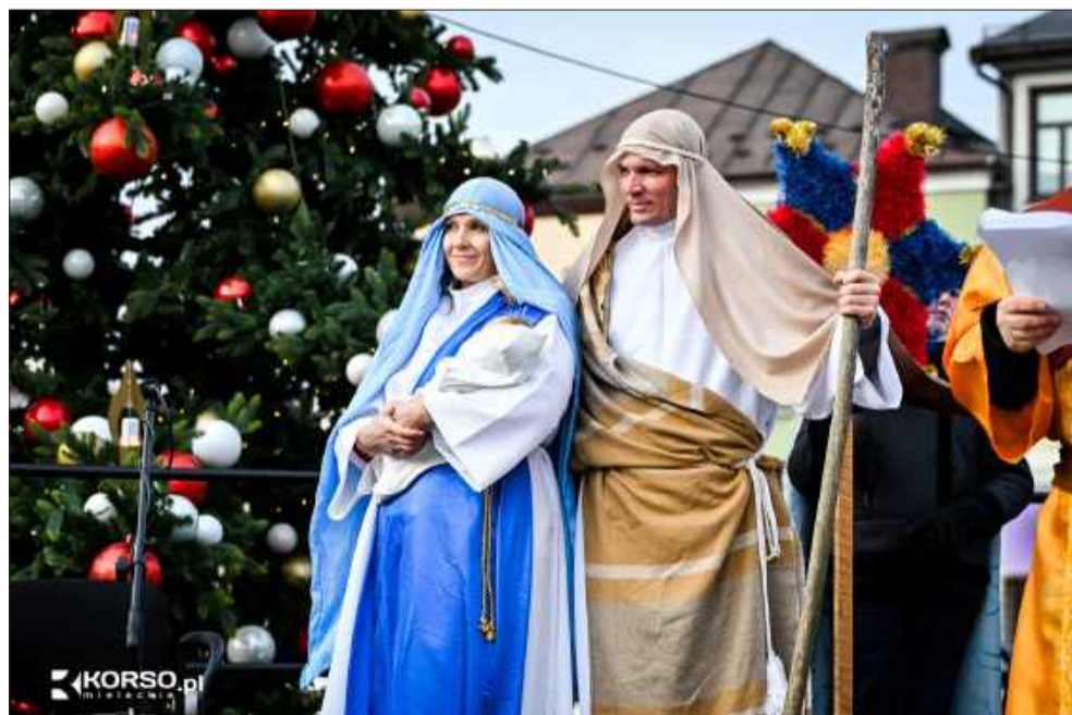
Wspólne koleđowanie i hołd Dzieciątku Jezus.