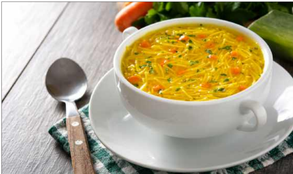
W ramach akcji można kupić też posiłek.

Zawieszona kawa czy posiłek to inicjatywy dobrze już znane na świecie. Mielec podąża za trendami w dobroczynności.