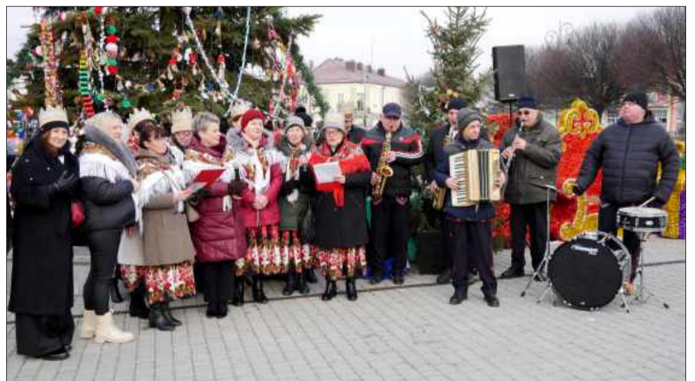
Kapela Żarówianie z paniami z KGW Żarówka.