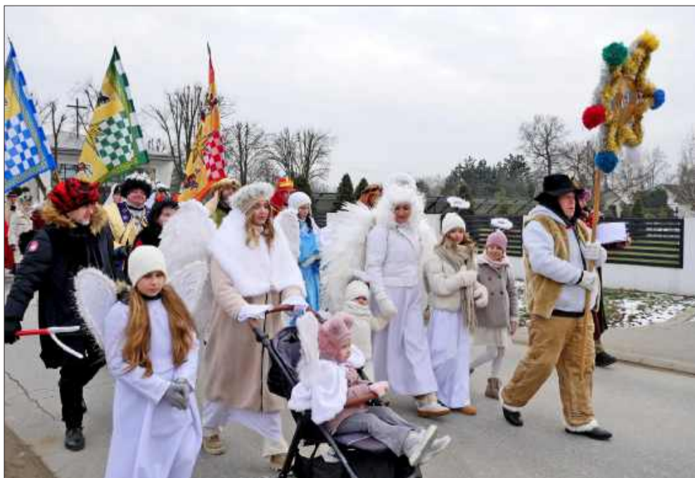
Kolędowanie w trakcie przemarszu w Partyni.