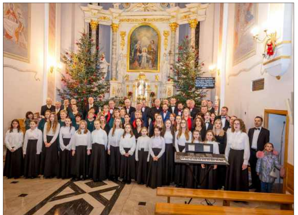
Muzyczne spotkanie chórów w Radomyślu Wielkim.