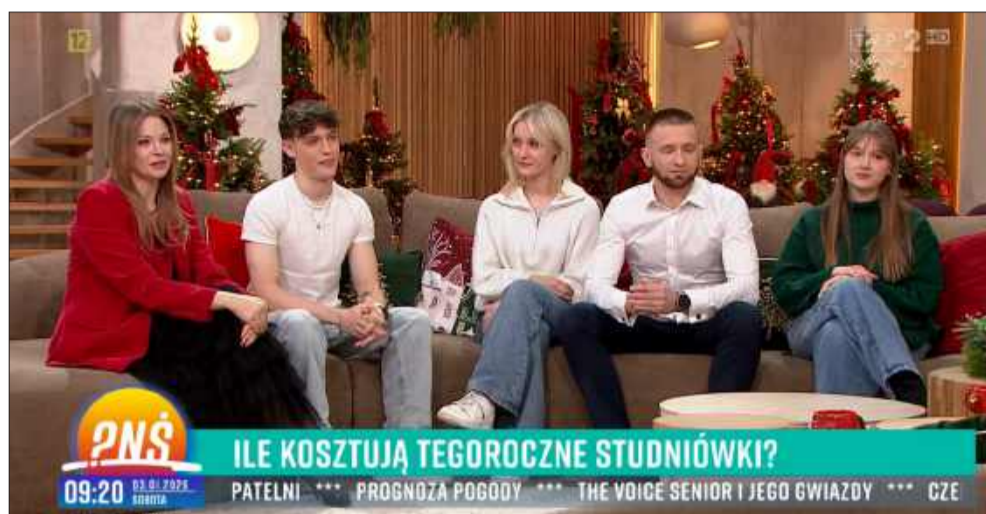
Ile kosztuje studniówka 2026? Głos zabrali maturzyści i eksperci.