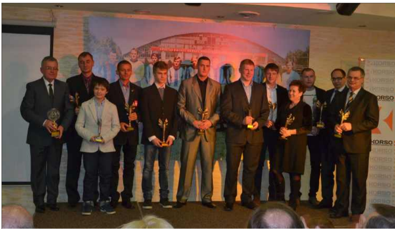
Gale Sportu zawsze obfitowały we wzruszające momenty.