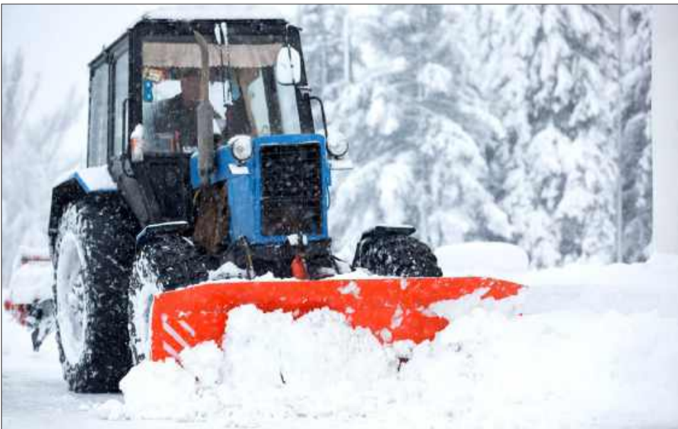
Odsiślał parking pod galerią po alkoholu.

Policja przypomina, że zimowe prace porządkowe, choć konieczne, muszą być wykonywane zgodnie z przepisami. Każdy pojazd mechaniczny – niezależnie od tego, czy porusza się po drodze publicznej, parkingu czy terenie prywatnym dostępnym dla innych – wymaga od kierującego odpowiednich uprawnień i trzeźwości. Brak odpowiedzialności w takich sytuacjach może prowadzić do poważnych zagrożeń dla bezpieczeństwa innych osób. MW