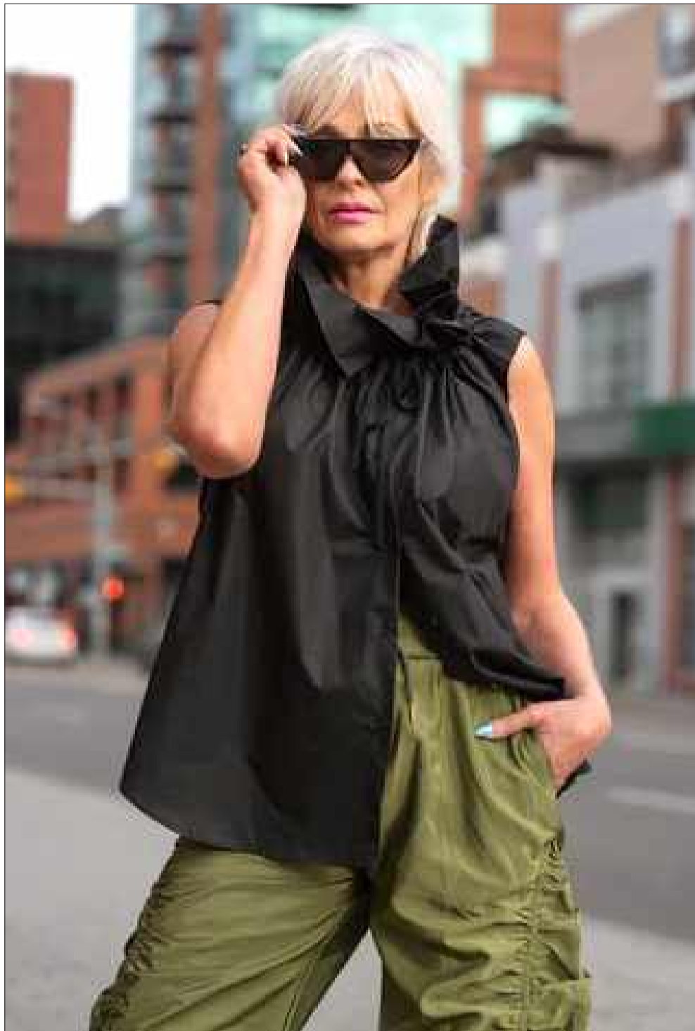
Wcale nie wyszczupla, a jednak przyciąga wzrok

Niestety nie. Mówię: niestety, ponieważ życie byłoby wtedy znacznie prostsze. Czarny to kolor intensywny, poważny, który skupia wzrok. Jeśli dbamy o to, jak wyglądamy całościowo, koniecznie trzeba wiedzieć, że to także kolor, który na pewno zgasi każdą delikatną, wiosenną czy barwną stylizację. Nie ubiera się czerni do kolorów. Oznacza to, że jeśli mamy na sobie piękną, kwiecistą spódnicę w barwne kwiaty, ubieranie do niej czarnej góry to błąd, wcale nie teoretyczny. Czerń skupi na sobie uwagę i skutecznie „stłamsi” żywy dół, odbierając całej stylizacji efekt WOW. A tego przecież nie chcemy. Najczęstszym błędem, który popełniamy, zwłaszcza latem, to czarne buty do letnich, zwiewnych sukienek. Czerń zadziała podobnie jak wyżej, a dodatkowo sprawi, że wzrok patrzącego skupi się na butach – będzie jak czarna kropka. Do stylizacji, których zasadą kompozycyjną jest lekkość, pastele, żywe kolo-