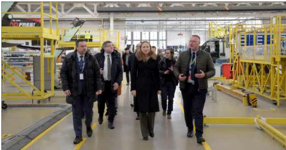
Wizyta w PZL Mielec.

Podkarpacie to region szczególnie. W ostatnich latach jego znaczenie wzrosło, co nie uszło uwadze polityków.