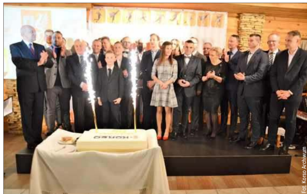
Nasze gale to jedno z najważniejszych wydarzeń sportowych w regionie.