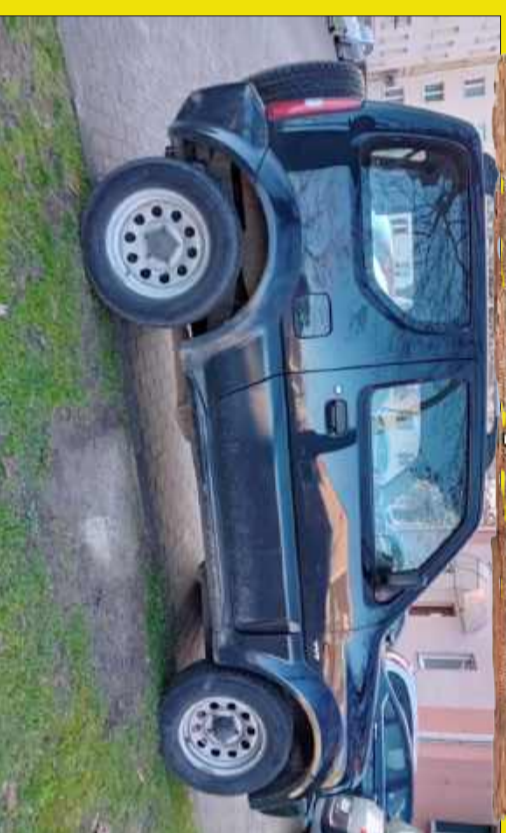
Na kra Wysoki, to i z krawężnikiem sobie poradzi. wędzi.