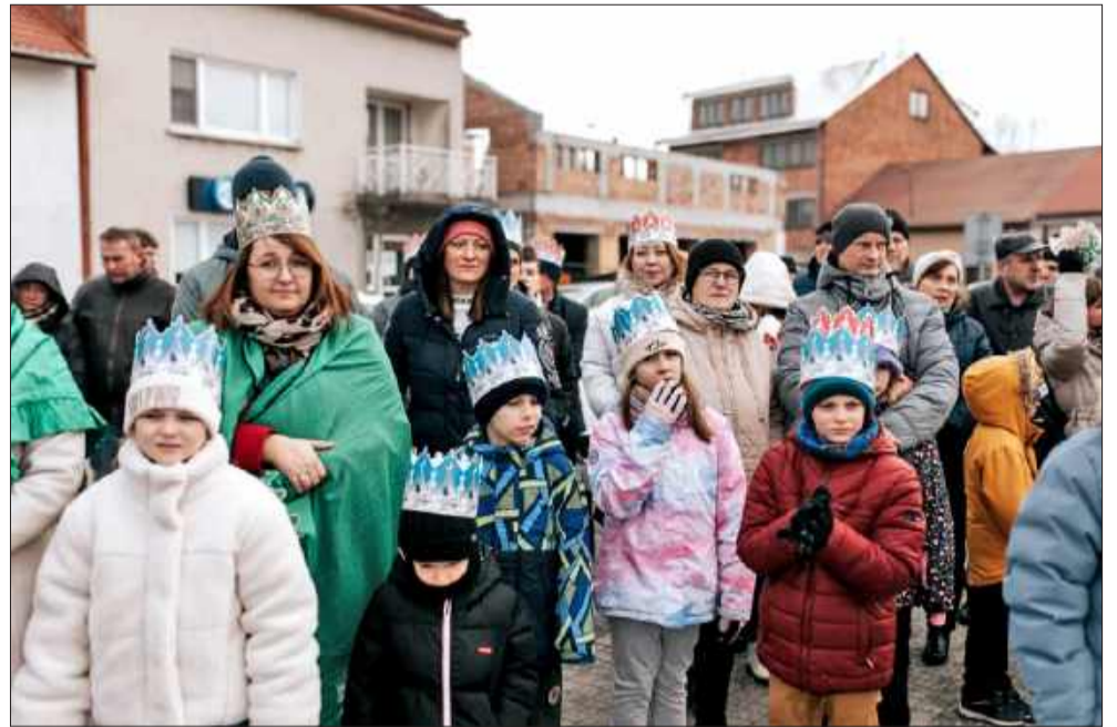
Rodziny z dziećmi w barwnym pochodzie w Przecławiu.