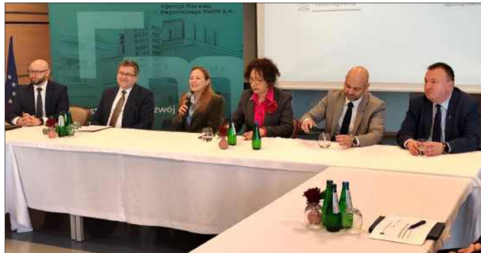
Na spotkaniu z minister obecni byli samorządowcy

Po briefingu minister oraz pani poseł, wraz z prezydentem