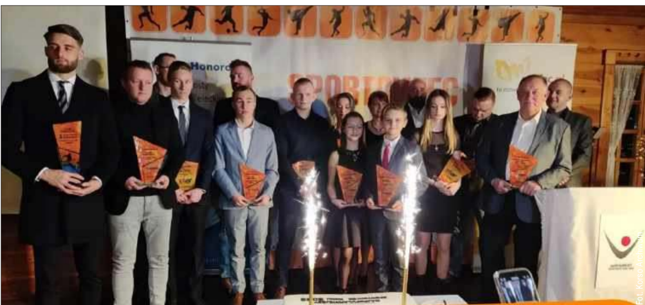
Nasz plebiscyt organizujemy po raz trzydziesty pierwszy.