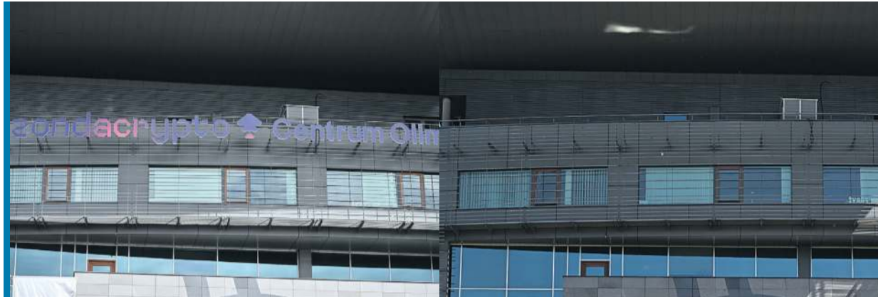
Wyteż wzrok i znajdź jedną zasadniczą różnicę na tych zdjęciach!

Rzecznika PKOl-u potwierdziła, że transza od Zondacrypto, z której miały zostać wypłacone premie dla medalistów, nie wpłynęła. Podkreśliła, że po uregulowaniu zaległości przez Polkomtel pierwszą decyzją będzie przesłanie zaległych