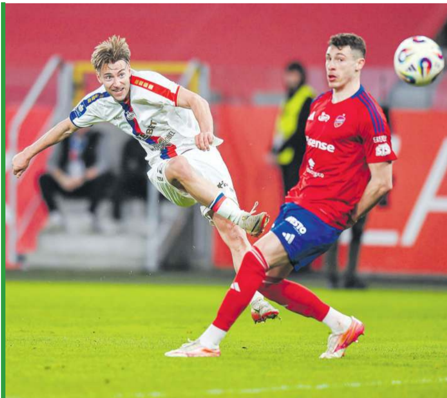
Komu trofeum, komu?

Górnik chce i może, i nie ma nic do stracenia, ale doświadczenie jest po stronie Rakowa. Czy mu to wystarczy do sukcesu? Nie wiem, ale zmierzył się już z 50 tysiącami widzów