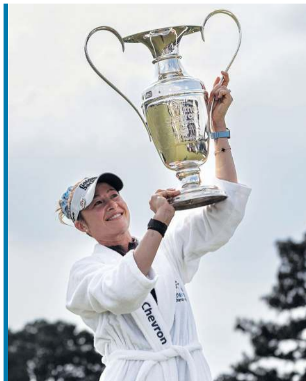
Nelly w gustownym szlafrocisku, który również zapewnia organizator.

Nelly, 17-krotna triumfatorka na LPGA Tour ma sport i rywalizację na najwyższym poziomie w genach. Tata - Petr to choć dawno, ale tenisowy numer dwa na świecie, mistrz Australian Open z 1996 roku. Mama - Regina była świetną tenisistką, uczestniczką igrzysk olimpijskich w Seulu. Starsza siostra - Jessica ma na koncie sześć zwycięstw w LPGA, w swoim najlepszym występie wielkoszlemowym zajmując drugie miejsce w The Chevron 2022, a młodszy brat Sebastian próbuje iść w ślady ojca, którego jest niemal lustrzanym odbiciem. Relacja sióstr to wspólny przypadek, gdzie rywalizacja na szczycie idzie w parze z autentycznym, bezwarunkowym wsparciem. Ich wspólna droga ewoluowała w fascynujący sposób. Przez lata to starsza o pięć lat Jessica była przecierającą szlaki. To ona jako pierwsza