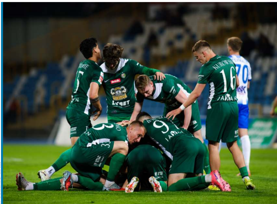
Śląsk Wrocław to najlepszy przykład klubu, który z kasą się nie liczy.

Skuteczność oceny jakości zarządzania klubem w panelu administracyjno-organizacyjnym posiada pewną charakterystyczną, wyróżniającą cechę, mianowicie prawidłowe postępowanie (wedle sztuki) jest powszechnie uznane (zwłaszcza wobec klubu piłkarskiego) za normę obowiązującą i powinność zarządzających, a nie uzyskanie czegoś ekstra. Błędne decyzje, gdy następuje ich kumulacja, przekraczając