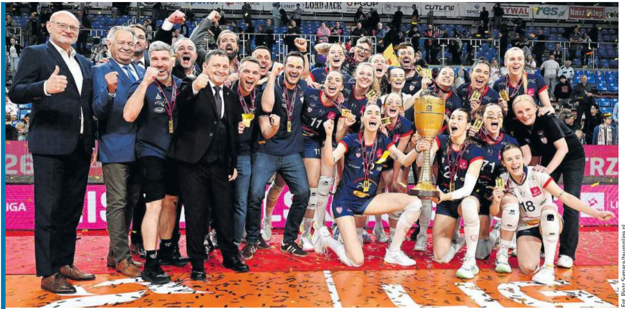
Łódzka, złota ekipa w komplecie.