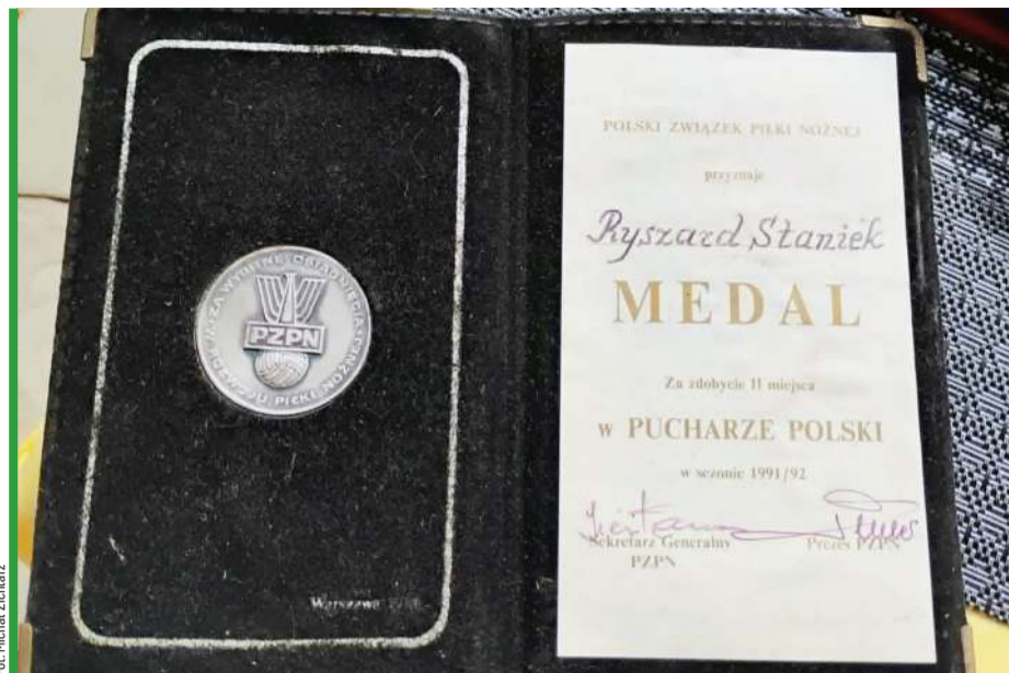
Medal za finał Pucharu Polski w 1992 roku to pamiątka Ryszarda Stańki.

grywała też pięć razy, ale w edycji 2013/14 poległa w 1/8 finału w... Zabrze z Górnikiem 1:3 (po tym meczu pracę w warszawskim zespole stracił trener Jan Urban).