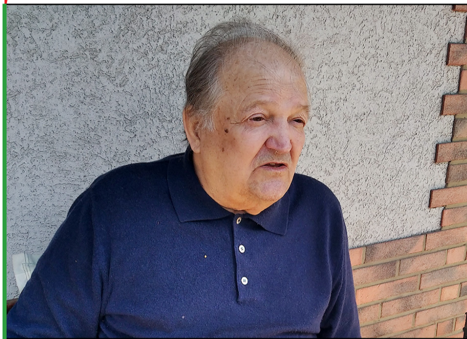
Hubert Kostka to prawdziwa legenda polskiej piłki.

Rozmowa z Hubertem Kostką , 32-krotnym reprezentantem Polski, złotym medalistą olimpijskim z Monachium z 1972 roku, najbardziej utytułowaną osobą w polskiej piłce, z 11 mistrzostwami jako zawodnik i trener oraz z 6 Pucharami Polski