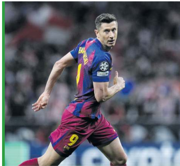
Czy to ostatni sezon Roberta Lewandowskiego w Dumie Katalonii?

Julian Alvarez ma być numerem jeden na liście życzeń Barcelony. Czy to oznacza, że Robert Lewandowski zmieni klub?