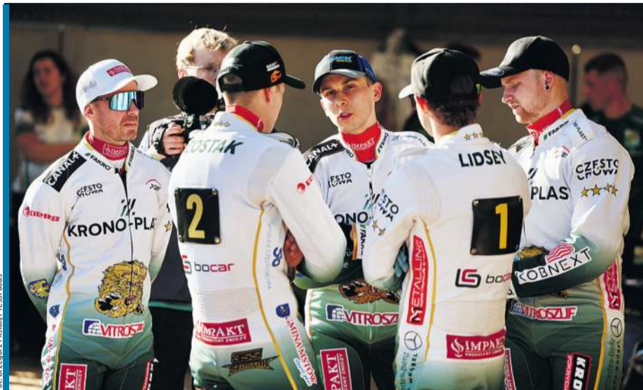
Lwy na razie przegrywają „zgodnie z planem”.