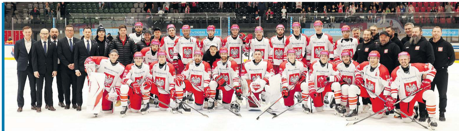
Reprezentacja Polski i jej sztab w pełnej krasie po zwycięskim meczu ze Słowenią 5:2 w Tychach.

Nic to, czeka nas prawie tydzień niesłychanych emocji i wierzymy w dobre zakończenie!