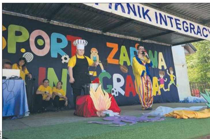
Piknik rozpoczęły występy artystyczne dzieci z ZSS w Goślicach