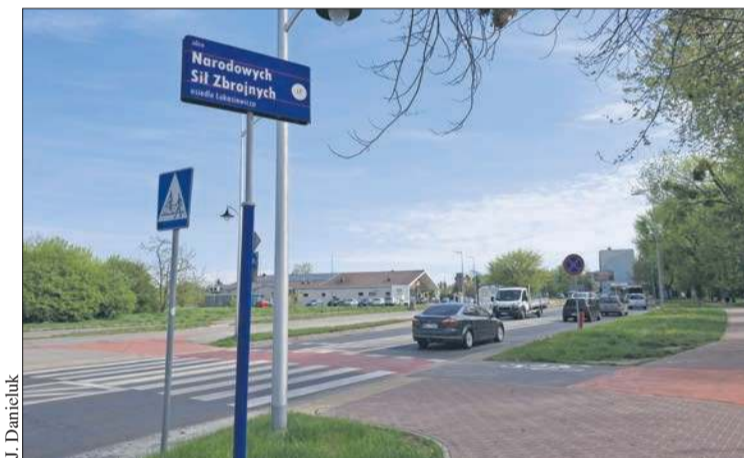
Ulica Narodowych Sił Zbrojnych wymaga remontu

67-letnia mieszkanka powiatu gostynińskiego została oszukana po tym, jak umieściła na jednej z popularnych platform aukcyjno-zakupowych ogłoszenie dotyczące sprzedaży mebli ogrodowych. Straciła w ten sposób 26 tys. zł. Policja ostrzega przed oszustami grasującymi w internecie oraz apeluje do korzystających z portali aukcyjnych o większą ostrożność!