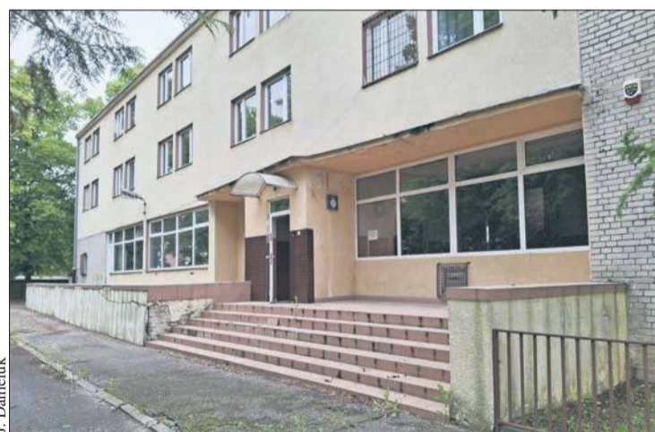
W budynku przy ul. Mościckiego 27 powstanie dedykowane seniorom Centrum Wsparcia Społecznego

Cały budynek będzie dostosowany do potrzeb osób z niepełnosprawnościami – będzie platforma zapewniająca dostępność parteru oraz winda zapewniająca dostępność do pierwszego i drugiego piętra.