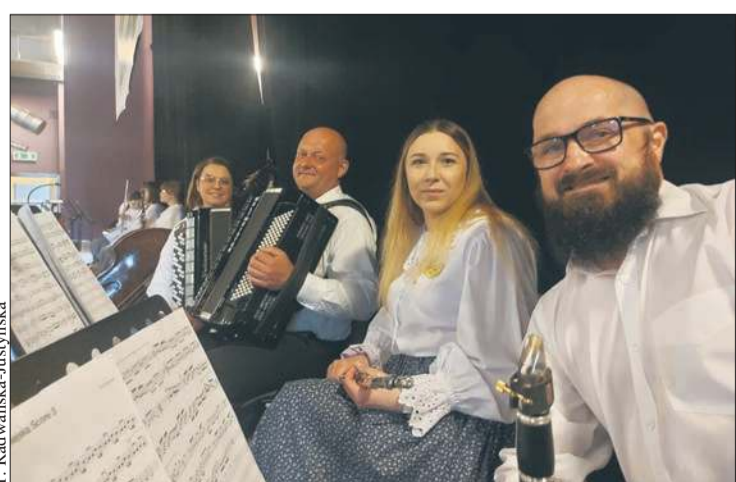
Część muzycznej rodziny Kasztelanki - kapela, która dba o oprawę muzyczną wszystkich programów zespołu