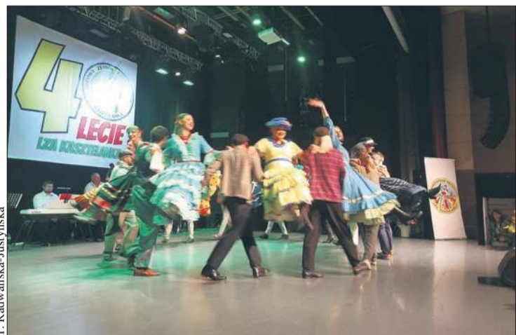
Polka miejska, to jeden z tańców w którym zaprezentowała się Kasztelanka podczas jubileuszowego koncertu