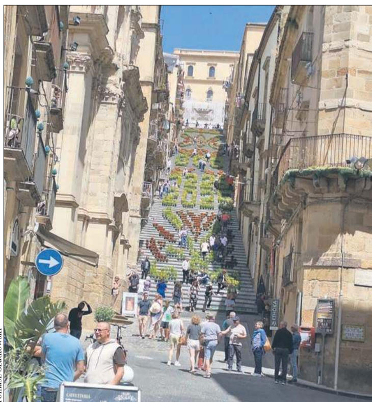
Tomasz Szatkowski Caltegrone. Ponad 140 schodów ozdobionych ręcznie malowanymi płytkami ceramicznymi