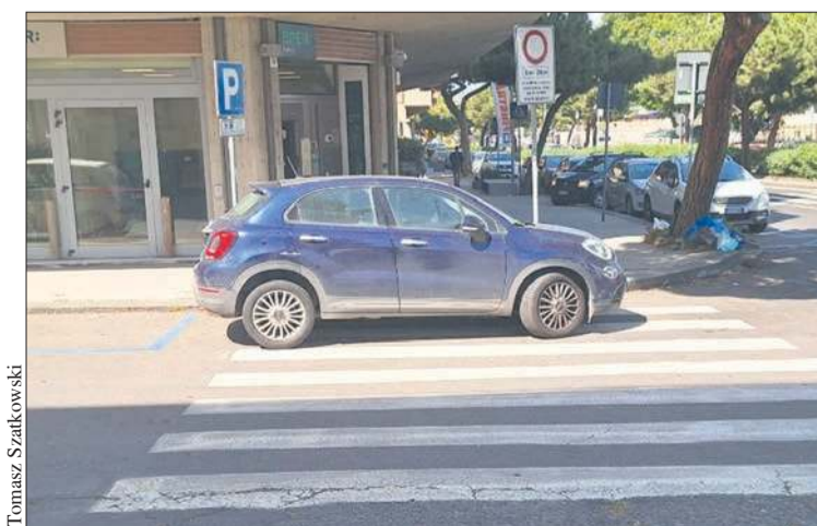
Kto powiedział, że samochodu nie można zaparkować na przejściu dla pieszych... Typowa Sycylia!