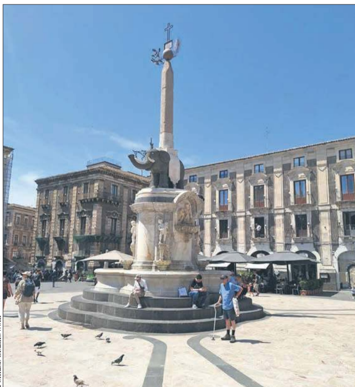
Tomasz Szatkowski To charakterystyczny znak Katanii – figurka słonia