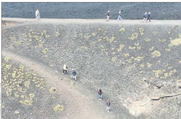
Tomasz Szatkowski Tysiące turystów z całego świata przylatują na Sycylię, żeby móc pospacerować po ścieżkach między kraterami Etny