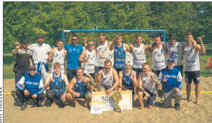
BHT Petra Płock

Rozpoczęły się zapisy na X Edycję Biegu Obrońców Płocka 1920 r.