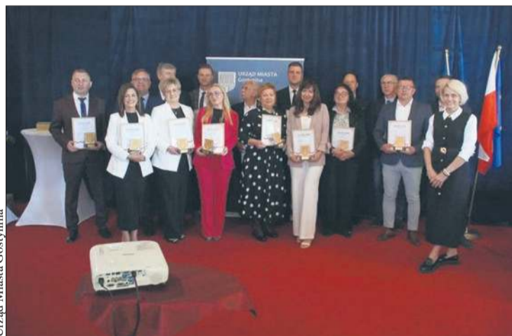
Podczas uroczystej sesji Rady Miejskiej uhonorowano radnych I kadencji