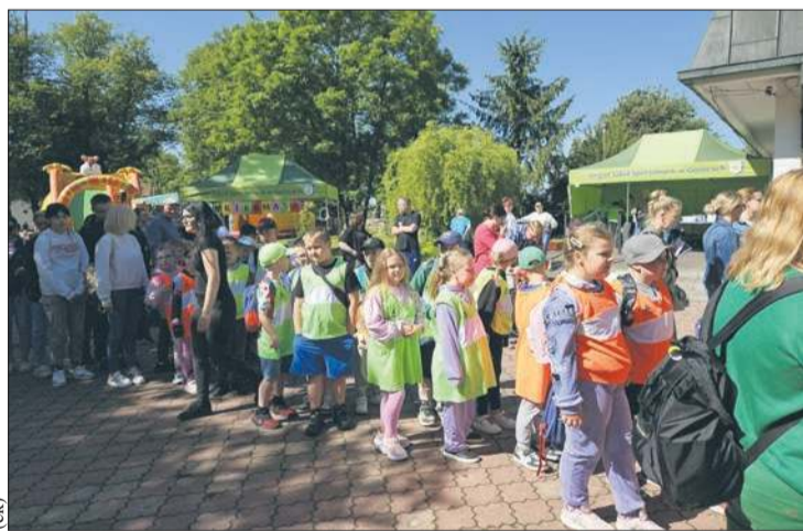
Do Goślic przybyły prawdziwe tłumy