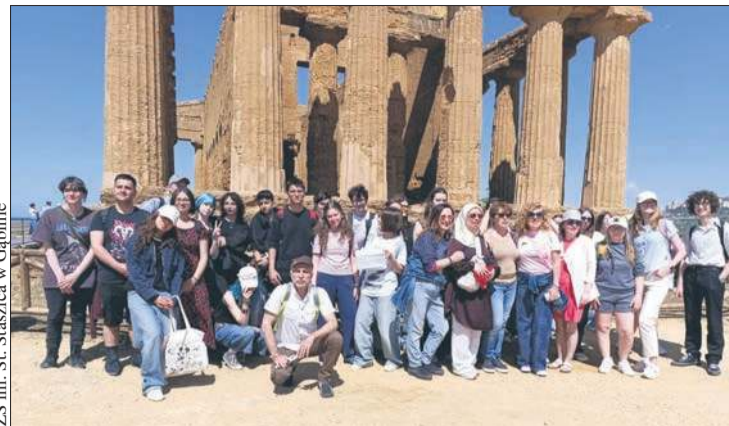
ZS im. St. Staszica w Gąbinie