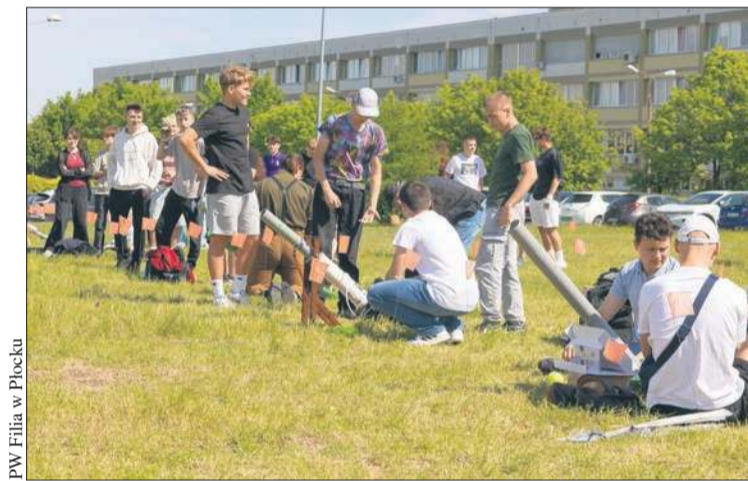
W I edycji konkursu Pacyfikator 2025, organizowanego przez Filię Politechniki Warszawskiej w Płocku, uczniowie zaprezentowali swoje konstrukcyjne rozwiązania na maszyny miotające