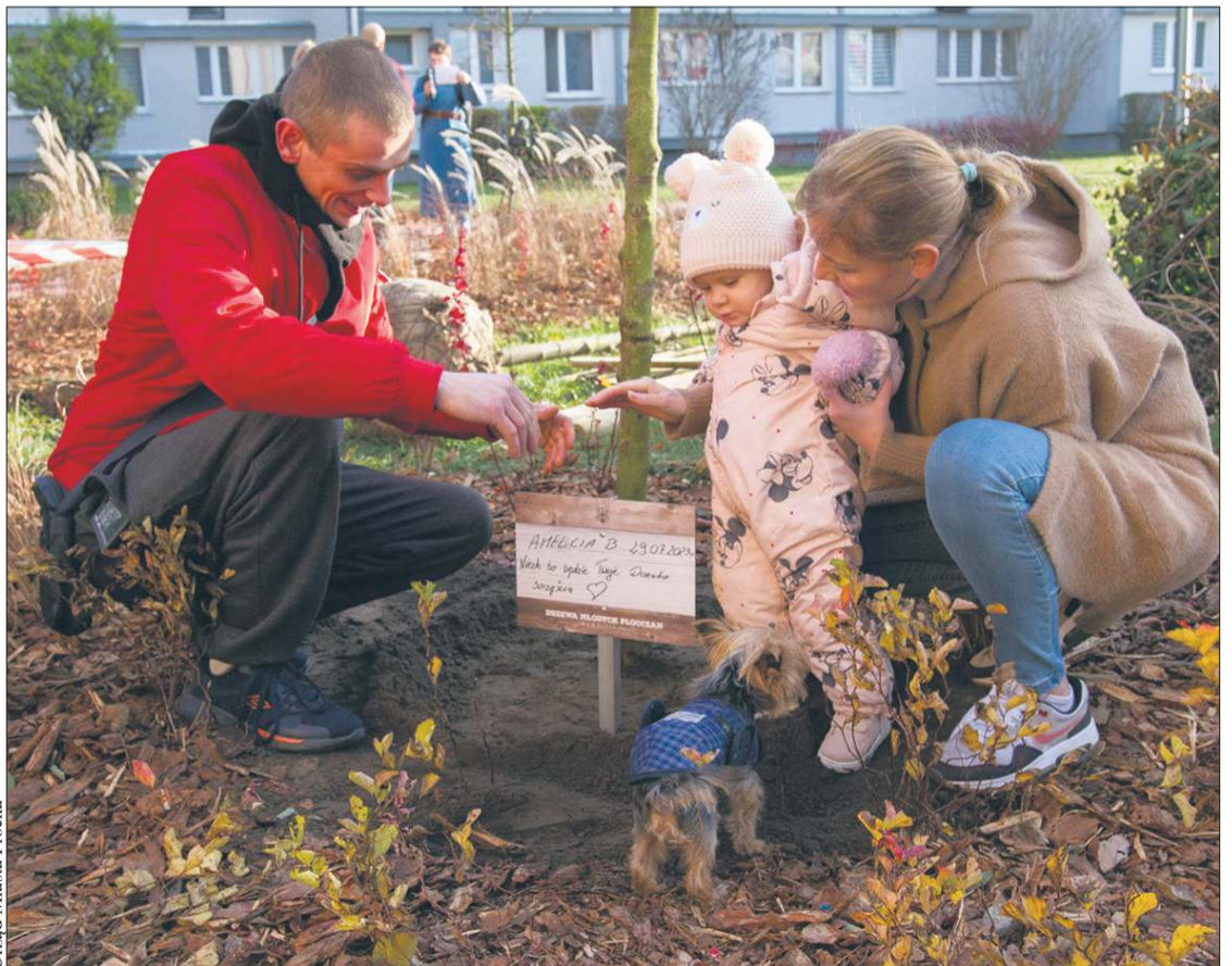
Urząd Miasta Płocka

Rozpoczyna się dziewiąta edycja programu „Drzewa Młodych Płocczan”