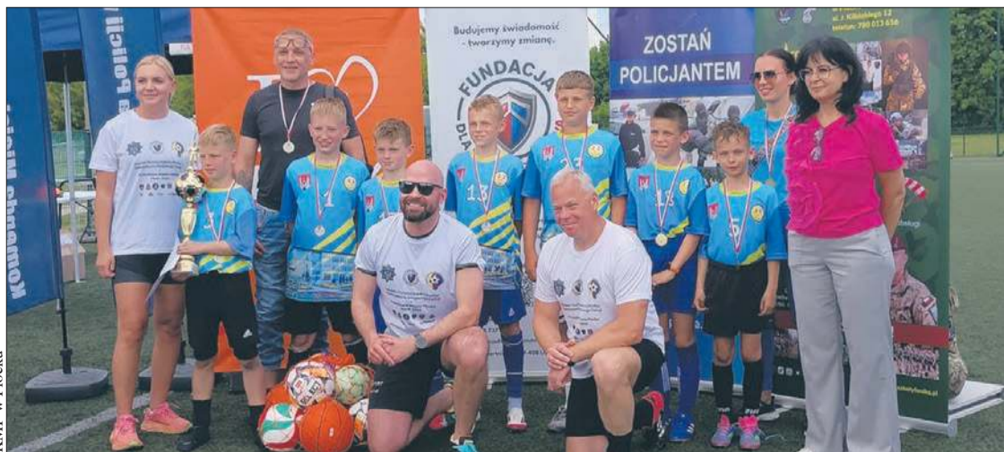
Uczniowie Szkoły Podstawowej nr 22 w Płocku wygrali V turniej piłki nożnej o puchar Komendanta Miejskiego Policji oraz Prezydenta Miasta Płocka