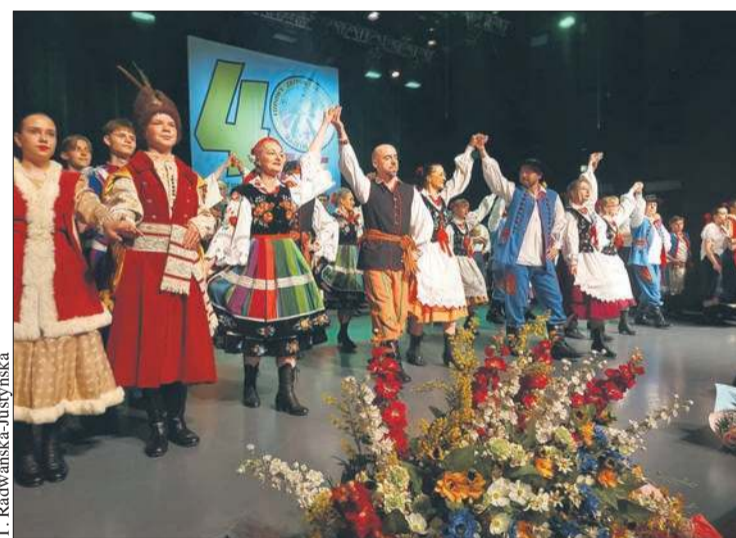
Jubileuszowy koncert „40 polek na 40-lecie” odbywał się w CKiSz

Wójt poinformowała, że w związku z powtarzającymi się incydentami umieszczania spróchniałych gałęzi drzew na środku drogi gminnej prowadzącej od drogi krajowej DK60 w stronę Nowych Rumunek policja wszczęła czynności sprawdzające w celu identyfikacji sprawcy. Osoby posiadające jakąkolwiek wiedzę na temat tych zdarzeń proszone są o kontakt z policją lub Urzędem Gminy.