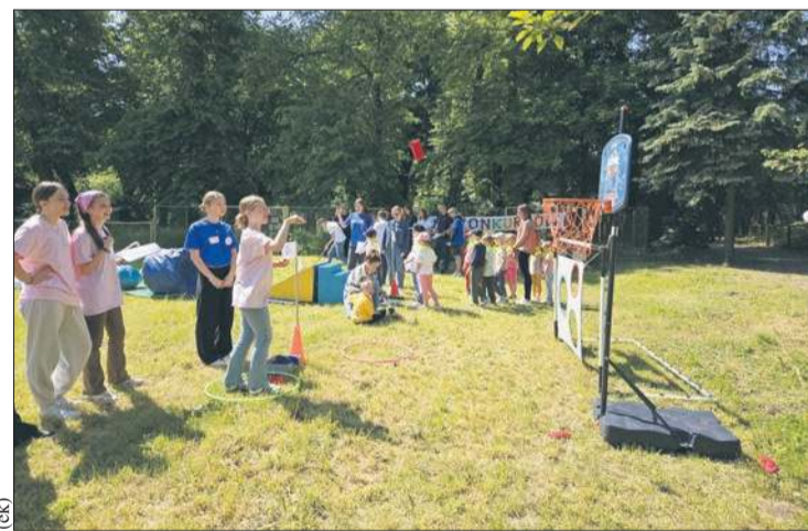
Uczestnicy mogli wziąć udział w grach i zabawach sportowych