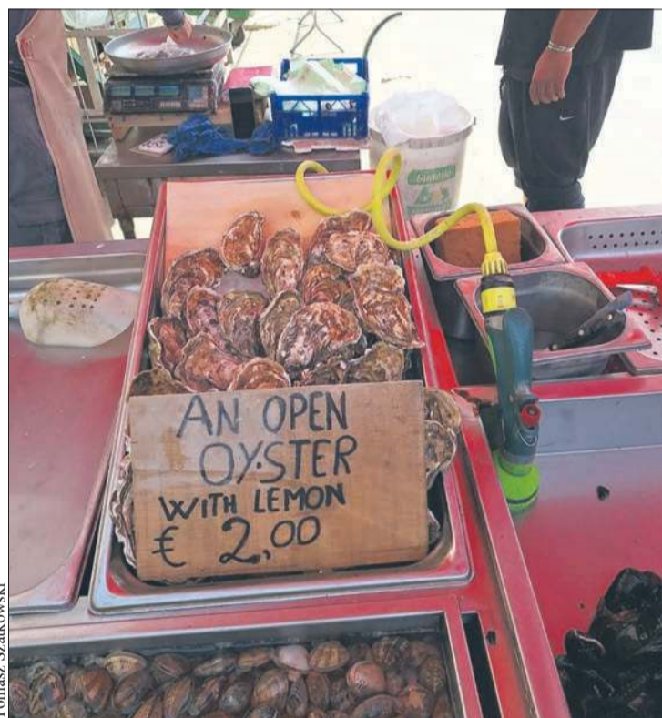
Targowisko rybne La Pescheria. Macie ochotę na ostrągi?