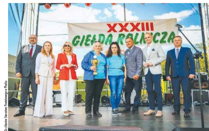
Puchar Starosty za najciekawsze stoisko wystawowe trafił do KGW w Leszczynie Szlacheckim

Podczas Giełdy nie zabrakło stoisk handlowych i usługowych firm działających dla rolnictwa, można było zasięgnąć porady w punktach