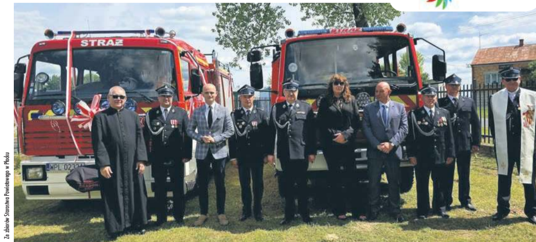
Uroczyste przekazanie nowych aut dla jednostek OSP ze Święciana i Miszewka Strzałkowskiego