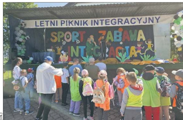
Jedną z atrakcji wydarzenia był pokaz iluzji