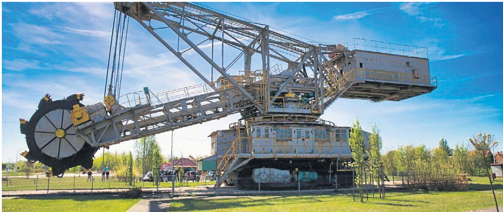
Koparka SchRs - 315, to filigranowa kuzynka Dolores - waży jedynie 340 ton i jest wysoka na 15 metrów. Również ona cieszy oko przejezdnych, lecz ma w tym znacznie większe doświadczenie, bo od 2011 roku

roku, w 2009 koparki były już w Polsce. Podczas składania zostały zmodernizowane, dostały wiele nowych elementów - w tym nowoczesne systemy i elektronikę. Do pracy Carmen ruszyła w 2010 roku, a Dolores w 2011.