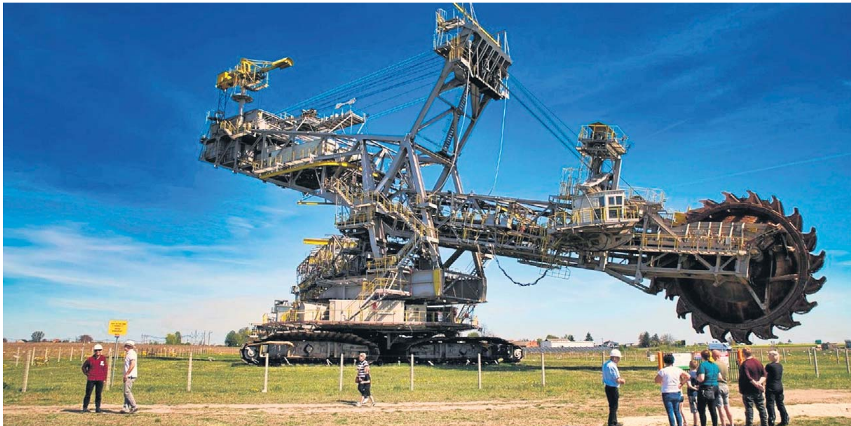
Waga Dolores to prawie 2700 ton, długość to 118 metrów, a wysokość to 38 metrów. Jest wyższa od 11-piętrowego wieżowca mieszkalnego

Koparki najpierw trzeba było rozłożyć, części załadować na ciężarówki, a następnie na miejscu złożyć - ten ostatni etap trwał 2 lata. Do przetransportowania Dolores i Carmen potrzebnych było 400 ciężarówek i dwa statki. Całe przedsięwzięcie rozpoczęto w 2008