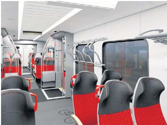
Pierwsze nowe składy mają wyjechać na wielkopolskie tory na początku 2028 roku

- Przetarg na nowe pociągi opierał się na trzech podstawowych kryteriach: to cena, termin realizacji i masa pociągów. Wszystkie te elementy są ogromnie ważne. Oferta Stadler Polska okazała się najlep-