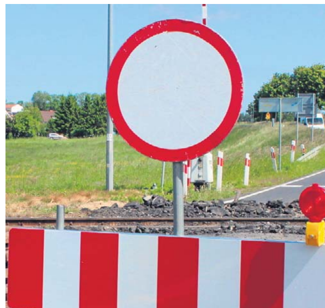
Wytyczone będą objazdy (zdj. ilustracyjne)

- Za wszelkie niedogodności związane z prowadzonymi pracami przepraszamy i prosimy mieszkańców oraz kierowców o wyrozumiałość - podkreślają przedstawiciele gminy.