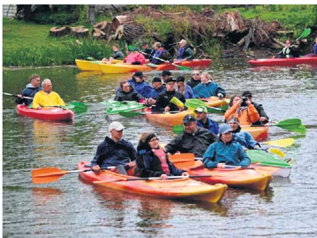
Uczestnicy 21. Spływu Kajakowego Rzeką Obrą ponownie pokazali, że pasja do kajakarstwa łączy pokolenia

Tegoroczna edycja dobiegła końca, ale jedno jest pewne – uczestnicy już teraz z niecierpliwością czekają na kolejne spotkanie na Obrze. Wszystko wskazuje na to, że za rok kajak ponownie wypełni rzekę, a tradycja będzie kontynuowana.