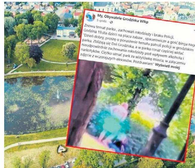
Informacja o nagim incydencie w grodzkim parku błyskawicznie obiegła sieć

Policja apeluje do mieszkańców, aby w przypadku jakichkolwiek niepokojących zdarzeń od razu korzystali z numeru alarmowego lub Krajowej Mapy Zagrożeń Bezpieczeństwa. ©@