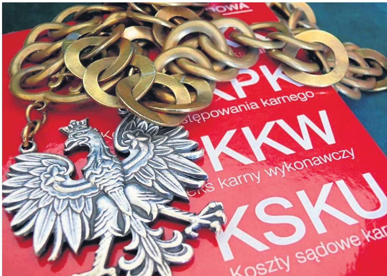
Zarzuty dotyczą fizycznego i psychicznego znęcania się nad małoletnią

POWIAT GRODZISKI MATKA I JEJ PARTNER USŁYSZELI ZARZUTY