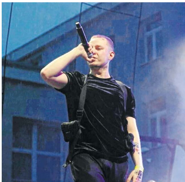
Jedną z gwiazd jubileuszowego święta gminy Przemęt będzie Tymeck - artysta rapowy młodego pokolenia

Następnie, o godzinie 21, na scenie pojawi się Łukasz Drapała wraz z projektem związanym z legendarnym zespołem Perfect. Muzyczną kulminacją sobotniego wieczoru będzie koncert Gromee, który rozpocznie się o 23. Oficjalne za-