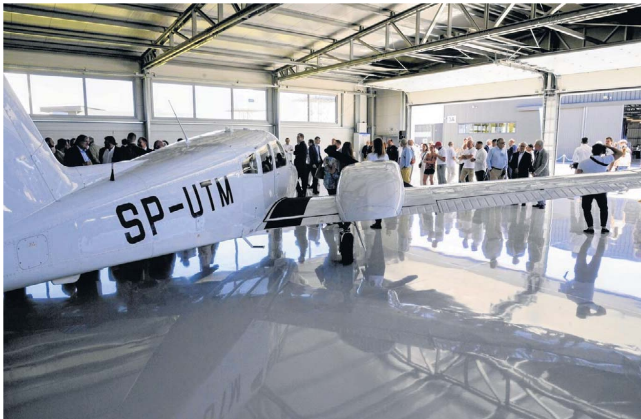
W nowym hangarze mechanicy będą mieli znacznie lepsze warunki pracy niż dotychczas