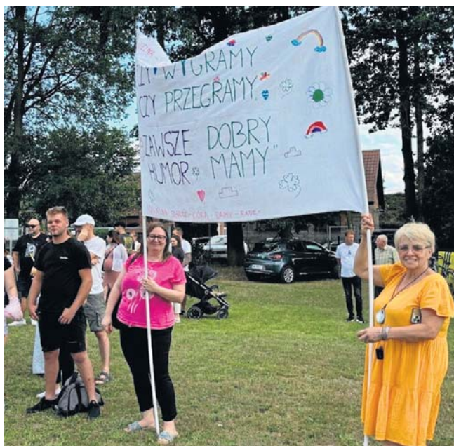
Turniej sąsiedzki po raz pierwszy odbył się w 2024 roku i od początku wzbudził pozytywne emocje

Organizatorzy zachęcają, by mieszkańcy zebrali 6-osobowe drużyny reprezentujące poszczególne ulice Bukowca. Stawką będzie nie tylko zwycięstwo w turnieju, ale również prestiżowy tytuł najbardziej zgranego sąsiedztwa w miejscowości. Skład drużyn nie jest przypadkowy. Każdy zespół musi składać się z: dwójki dzieci do 10. roku życia, dwóch seniorów w wieku 60+