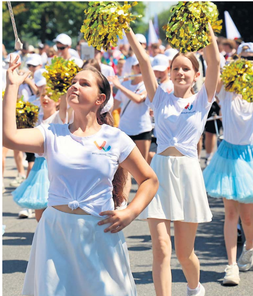
Na czele korowodu stanęła niezawodna Grodziska Orkiestra Dęta im. Stanisława Słowińskiego

Od godziny 15 scena należała już w całości do lokalnych artystów, uczniów grodziskich szkół oraz członków sekcji działających przy Centrum Kultury „Rondo”. ©