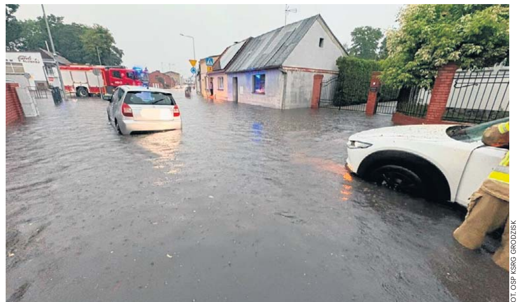
Działania strażaków na ul. Żwirki i Wigury w Grodzisku