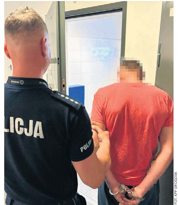
Mieszkańcowi powiatu grodzkiego grozi kara do trzech lat pozbawienia wolności