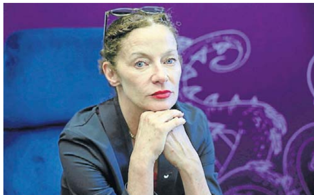
Aktorka pochodząca ze Szkocji jest znana przede wszystkim jako Missy z „Doctora Who”

- To, co inni o mnie myślą, nie jest moją sprawą, ponieważ wtedy nie jest się uzależnionym od czyjejś opinii - odpowiedziała.