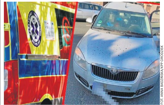
Poszkodowana została przetransportowana do szpitala. Na szczęście nie odniosła żadnych poważnych obrażeń

Zdarzenie zakwalifikowano jako kolizję, a sprawcy zatrzymano prawo jazdy. Całość zgromadzonej dokumentacji zostanie przekazana do sądu, który zadecyduje o karze.