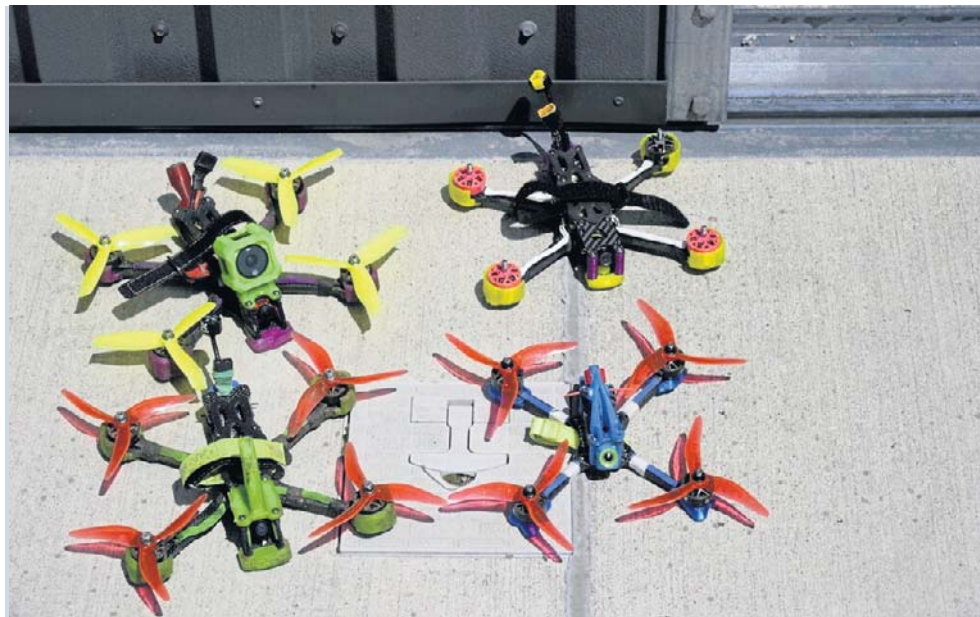
Najmniejsze i najszybsze drony ważą raptem kilkadziesiąt gram.