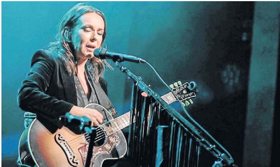
W niedzielę, 19 lipca o godzinie 19 na scenie pojawi się Kasia Kowalska, jedna z najbardziej rozpoznawalnych polskich wokalistek