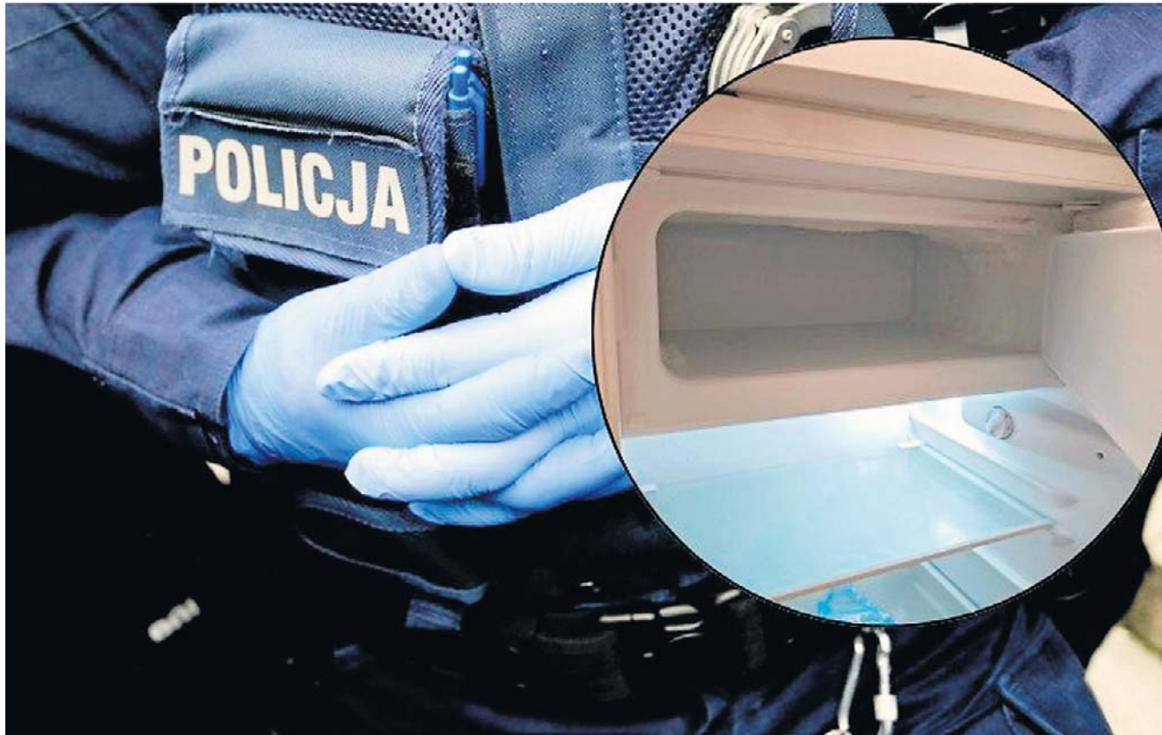
Policjanci w Wąbrzeźnie odkryli w mieszkaniu 33-letniej matki zamrożony płód dziecka. Prokuratura wszczęła śledztwo w kierunku nielegalnej aborcji

Zajrzeli i faktycznie dokonali dość makabrycznego odkrycia. W lodówce znajdował się zamrożony płód dziecka, około pięciomiesięczny, zawinięty w ręcznik. Jak potem