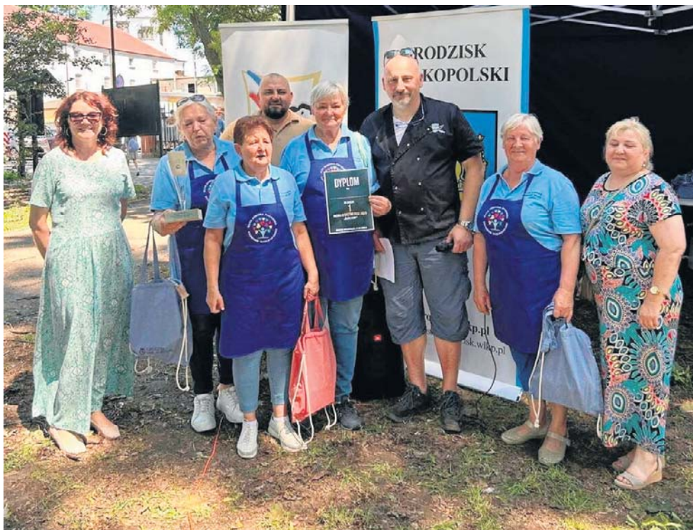
W konkursie kulinarnym Gastro Fest 2026 „Ślepe Ryby” I miejsce zajęł Klub Seniora Promessa