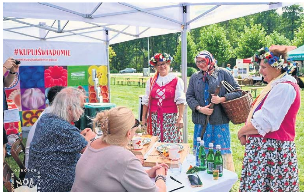
Koło Gospodyń Wiejskich w Cichej Górze od lat należy do najbardziej aktywnych organizacji społecznych w regionie