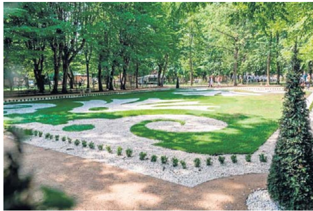
Park po rewitalizacji wymaga szczególnej ochrony

W przyjętym regulaminie podkreślono, że park jest terenem ogólnodostępnym przeznaczonym do wypoczynku oraz aktywnej rekreacji. Osoby