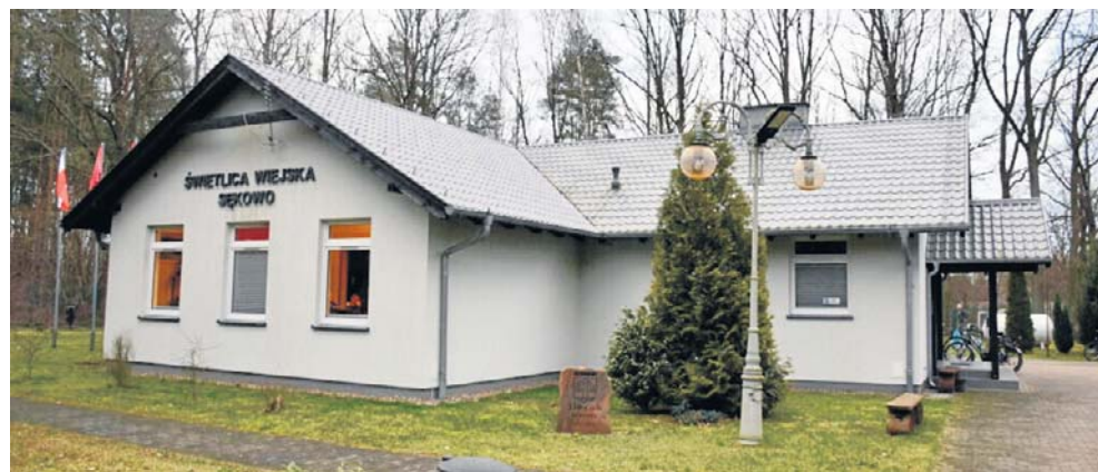
Festyn odbędzie się na terenie przy sali wiejskiej w Sękowie. Udział jest bezpłatny

Dominika Kapalka dominika.kapalka@polskapress.pl