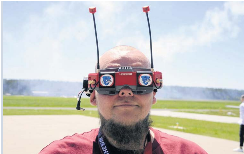
Okulary rozszerzonej rzeczywistości służące do sterowania dronem