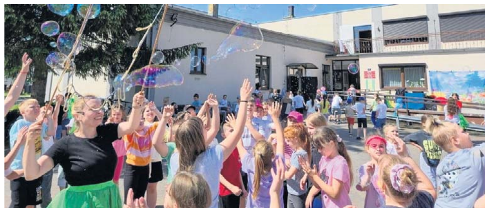
Tego lata atrakcji dla najmłodszych w Kuślinie nie zabraknie (na zdj. Dzień Dziecka w Kuślinie)

Dominika Kapalka dominika.kapalka@polskapress.pl