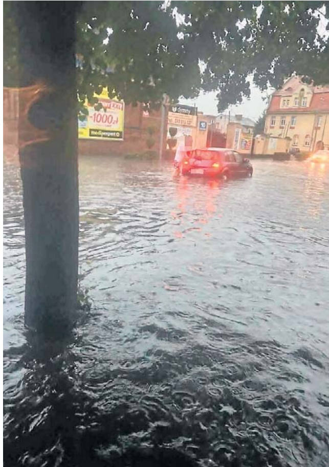
Ulica Kolejowa w Grodzisku Wielkopolskim

- Jedno z poważniejszych zdarzeń dotyczyło wypompowania wody z piwnicy grodziskiego szpitala. W miejscowości Reńsko samochód uderzył w powalone drzewo. W kilku