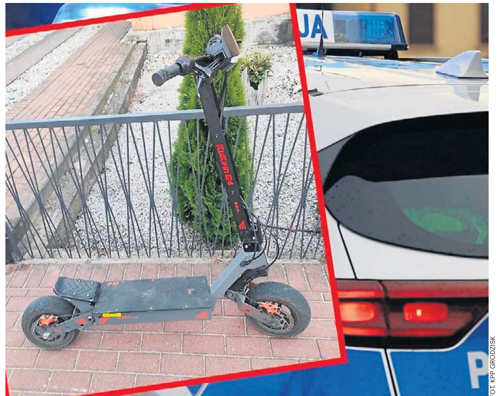
Dwie nastolatki, jadąc niezgodnie z przepisami na jednej hulajnodze elektrycznej, straciły równowagę i uderzyły w zaparkowany samochód

- W wyniku niedostosowania prędkości oraz utraty równowagi, nastolatki uderzyły w zaparkowany samochód marki Renault. 14-latką została przetransportowana do szpitala z podejrzeniem wstrząśnienia mózgu i złamania obojczyka. Jej 13-letnia koleżanka miała więcej szczęścia - po badaniach w szpitalu okazało się, że skończyło się jed-