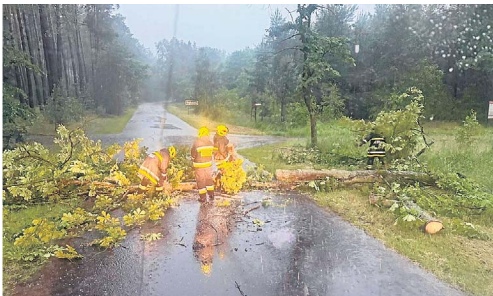
Powalone drzewo na terenie gminy Kuślin