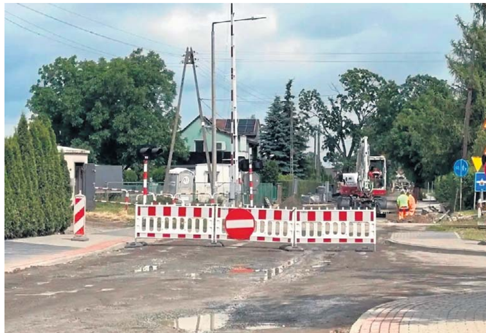
Kierowcy, którzy 13 czerwca próbowali pokonać przejazd kolejowy w Granowie (droga prowadząca m.in. w kierunku Strzępinia i Niemierzyc), odbijali się od barier

- Nigdzie informacji o zamknięciu drogi, nigdzie infor-