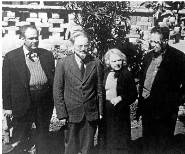
Ramón Mercader (pierwszy z prawej) z Lwem Trockim (drugi z lewej) w Meksyku. 1940 r.

65 lat temu, w czerwcu 1961 roku tow. Ramón Mercader otrzymał Moskiewie tytuł Bohatera Związku Radzieckiego oraz Order Lenina, oficjalnie za wkład w budowę Ojczyzny Światowego Proletariatu. Jednak wiadomo było powszechnie, że Mercadera uhonorowano za krwawy mord na Lwie Trockim.