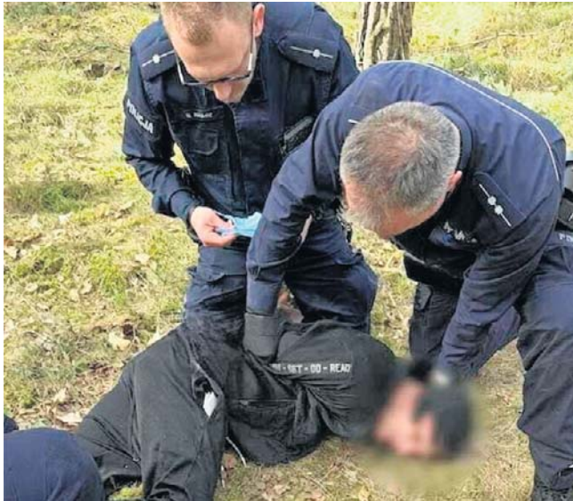
33-latek próbował jeszcze uciekać. Podczas zatrzymania był agresywny

Do zdarzenia, które właśnie zakończyło się skierowaniem aktu oskarżenia, doszło 14 marca. Wówczas to na autostradzie A2 kierowca Mazdy stracił panowanie nad pojazdem i uderzył w ba-