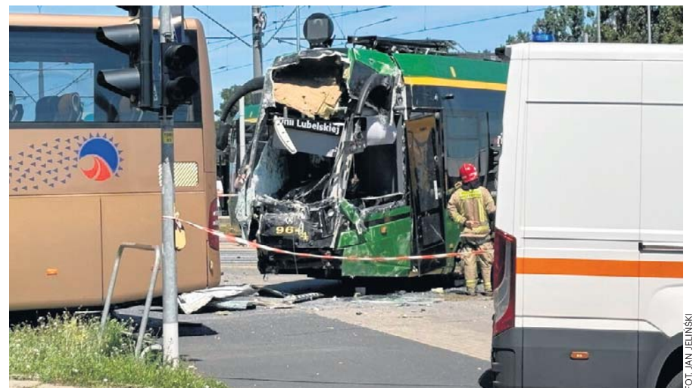
Fotorelację z miejsca wypadku można zobaczyć w serwisie gloswielkopolski.pl

Tramwaje linii 3 i 10 zostały skrócone do pętli Wilczak. Natomiast na odcinku Wilczak - Błażeja uruchomiona została komunikacja „za tramwaj”. Autobusy kursujące ulicą Serbską kierowane były objazdami.