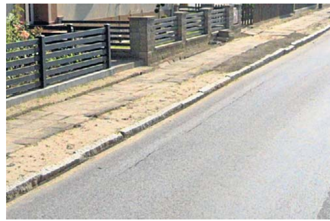
To właśnie ten chodnik zostanie zmodernizowany