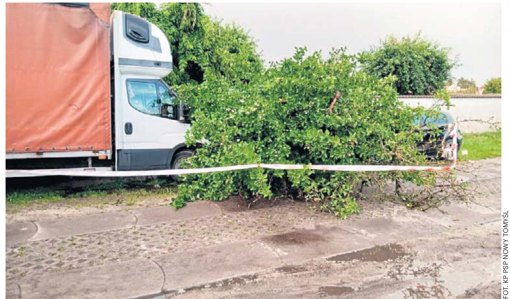
Działania strażaków na terenie powiatu nowotomyskiego

- Nasze działania dotyczyły głównie zalanych posesji, piwnic w budynkach, powalonych drzew, które blokowały drogi. Największy problem polegał na tym, że wszystkie te wydarzenia działy się tak naprawdę jednocześnie. Było też kilka poważniejszych interwencji, doty-