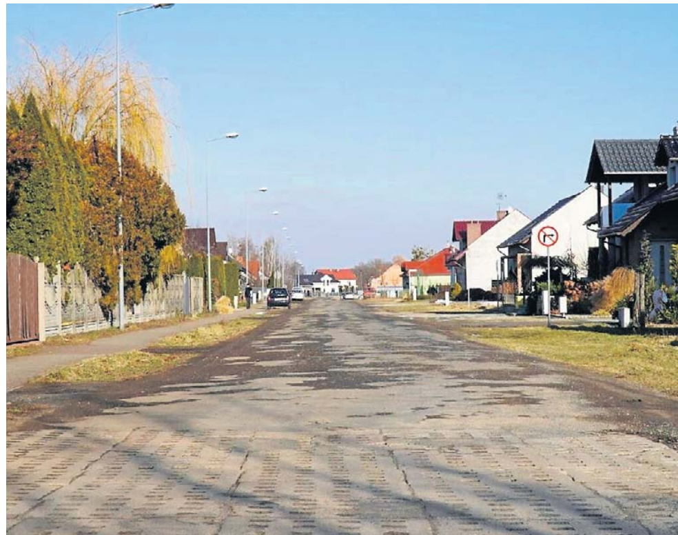
Nowe nawierzchnie, chodniki i niezbędna infrastruktura mają docelowo poprawić komfort życia wielu mieszkańców tej części Grodziska

Kierowców prosimy o zachowanie szczególnej ostrożności, zwracanie uwagi na nowe oznakowanie, a także, w miarę możliwości, wybieranie alternatywnych tras. ©