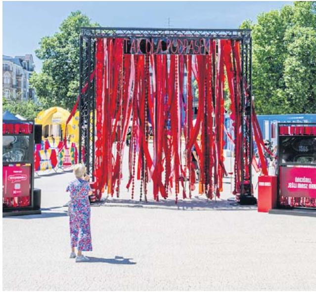
Przez najbliższe dni festiwal będzie obecny nie tylko w teatrach i salach koncertowych, ale także na ulicach