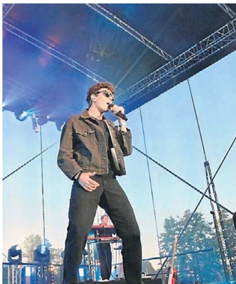
Organizatorzy liczą na wysoką frekwencję i już dziś zapraszają wszystkich do udziału w tym wyjątkowym wydarzeniu

Trzeci dzień obchodów rozpocznie się wyjątkowo uroczy-