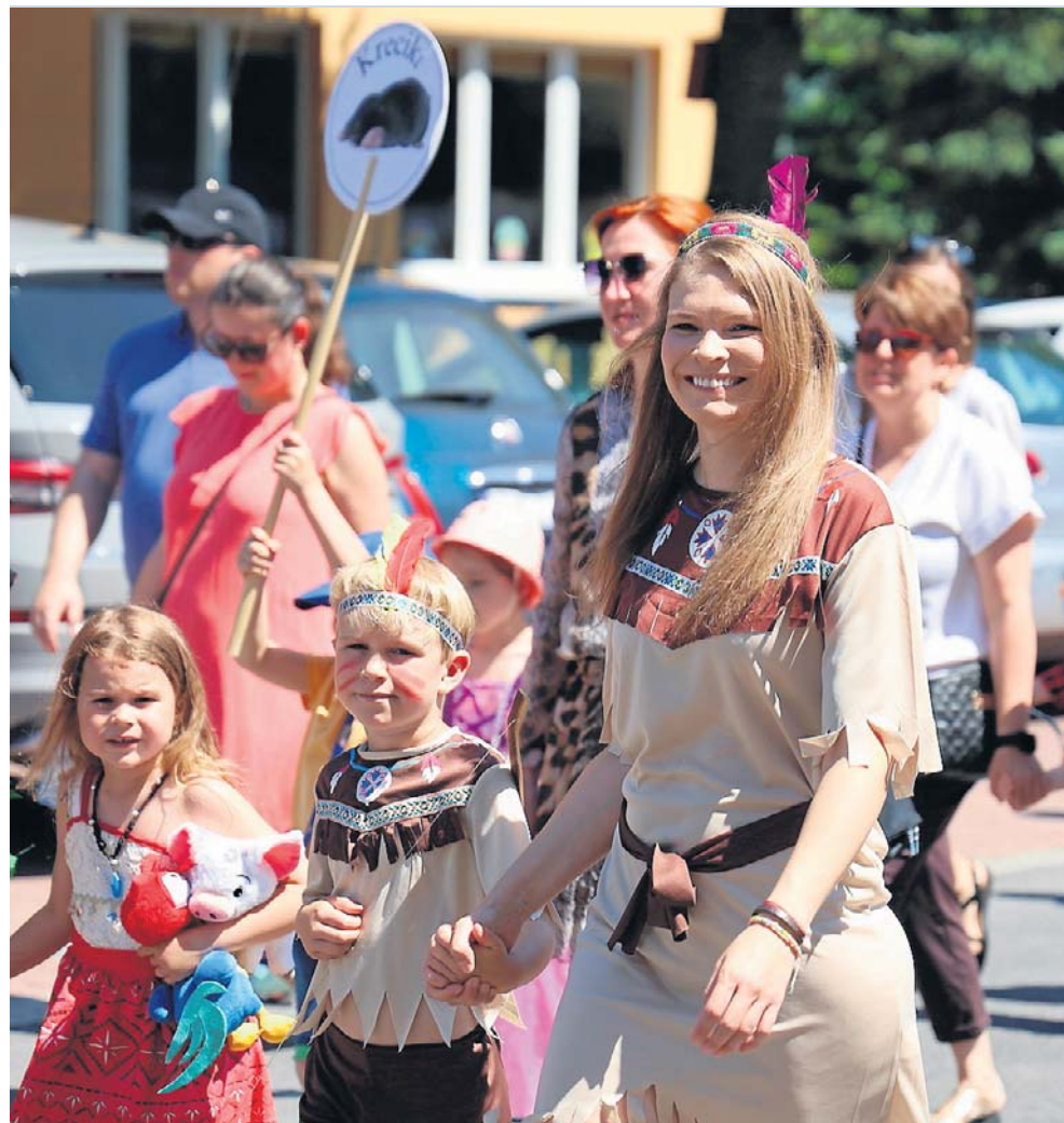
W zakinadzie maszerowali uczniowie gminnych szkół, reprezentanci lokalnych klubów sportowych, członkowie kół zainteresowań oraz mnóstwo innych grup