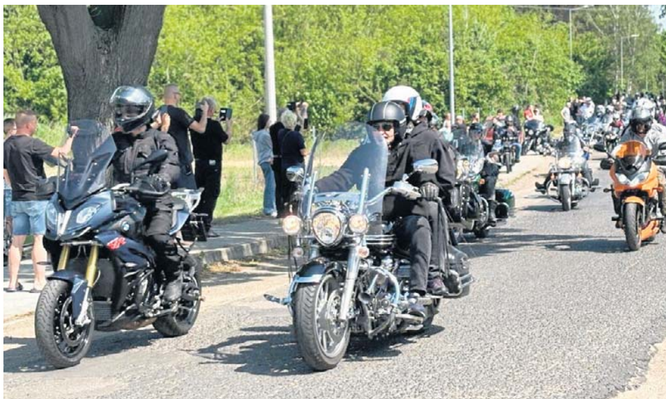
Sobota upłynie pod znakiem jubileuszu 10-lecia Klubu Motocyklowego Waleczne Wilki. Motocykliści zjadą do nowotomyskiego parku z Sękowa (zdz. z jednego z poprzednich zlotów)

Główne wydarzenia odbędą się natomiast w sobotę, 27 czerwca. O godzinie 13 moto-