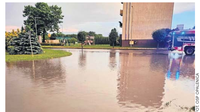
Działania strażaków prowadzone na terenie Opalenicy

zawirowań. W sobotę, 13 czerwca, we znaki dały się im silne wiatry. Zgłoszenia o wiatrołomach blokujących drogi w powiecie grodziskim wpływały synchronicznie z wielu gmin, a silne podmuchy wiatru znacznie utrudniały prowadzenie działań. Groźny incydent odnotowano w Białej Wsi, gdzie konar spadł na auto osobowe. Bilans całego poprzedniego weekendu zamknął się w liczbie 18 interwencji. ©P