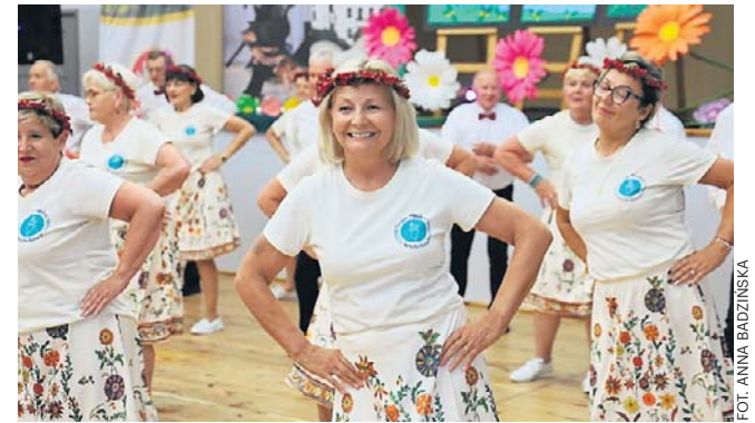
FOT. ANNA BADZIŃSKA

jednak przede wszystkim dowód na to, jak piękny i wymagający jest to sport - niezależnie od tego, czy trenuje się go od dziecka, czy pasję do niego odkrywa się dopiero na emeryturze. ©©