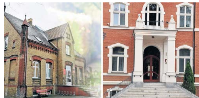
Jeden ze schodolazów trafi do Urzędu Miejskiego w Opalenicy, natomiast drugi do Ośrodka Pomocy Społecznej

Szczególną uwagę zwrócono na potrzeby osób z niepełnosprawnością ruchową, dla których schody często stanowią poważną przeszkodę w załatwianiu codziennych spraw urzędowych. Zakup schodolazów ma poprawić komfort korzystania z budynków publicznych.