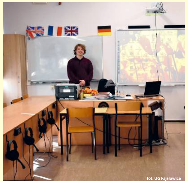
fol. UG Fajslawice

● GM. FAJSŁAWICE W szkołach podstawowych rozpoczęły się zajęcia z native speakerem. Uczniowie starszych klas mają dzięki temu wyjątkową okazję, aby doskonalić swoje umiejętności językowe, przełamać bariery i poprawić wymowę.