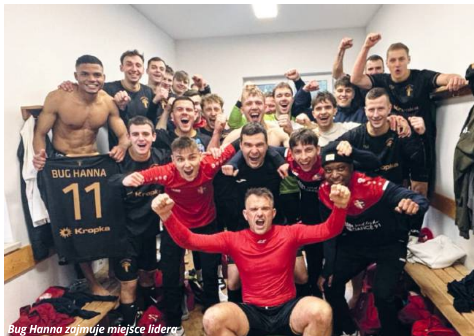
Bug Hanna zajmuje miejsce lidera

W następnym spotkaniu otwierającym okręgową wiosną Brat Siennica Nadolna po-