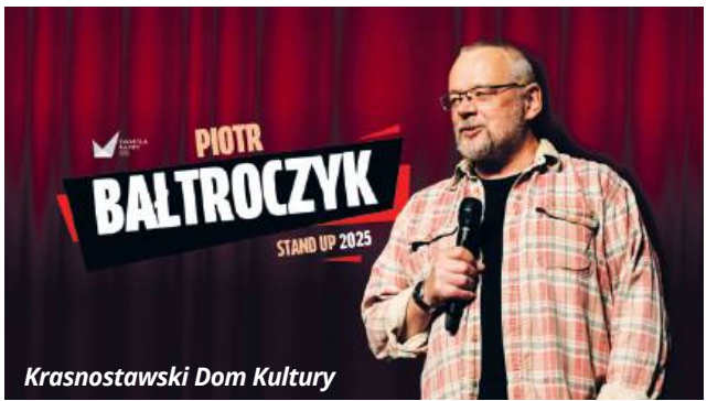
Krasnostawski Dom Kultury

● KRASNYSTAW 29 marca o godzinie 19:00 w Krasnostawskim Domu Kultury zabrzmi śmiech. Na scenie pojawi się Piotr Bałtroczyk, znany i lubiany komik, który od lat bawi publiczność swoim niepowtarzalnym poczuciem humoru.