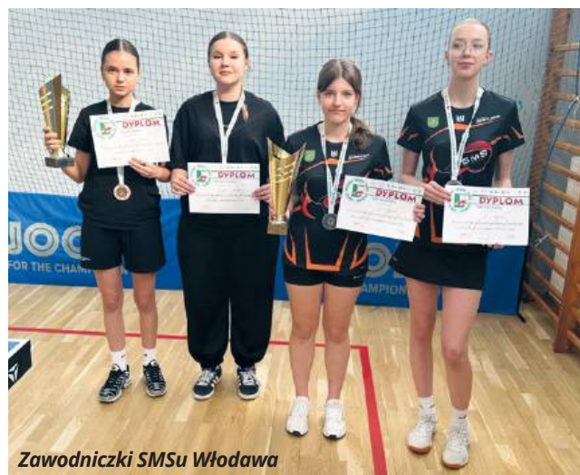
Zawodniczki SMSu Włodawa

Udział w Mistrzostwach Województwa Lubelskiego w Niedźwiadzie do udanych za-