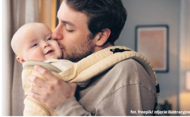
fol. freepik / zdjęcie ilustracyjne

Zasiłek na 9-tygodniowej części urlopu to 70 proc. średniego wynagrodzenia rodzica z ostatniego roku. W 2024 roku przeciętna wysokość zasiłku za czas