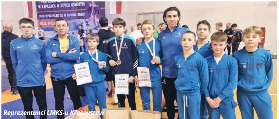
Reprezentanci LMKS-u Krasnystaw