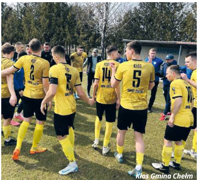
Kłos Gmina Chełm

● PIŁKA NOŻNA Druga kolejka rundy wiosennej nie przyniosła zwycięstwa ani Kłosowi Gmina Chełm, ani Startowi Krasnystaw. Dla drużyn z tych IV-ligowych zespołów był to zarazem pierwszy mecz w etapie rewanżowym.