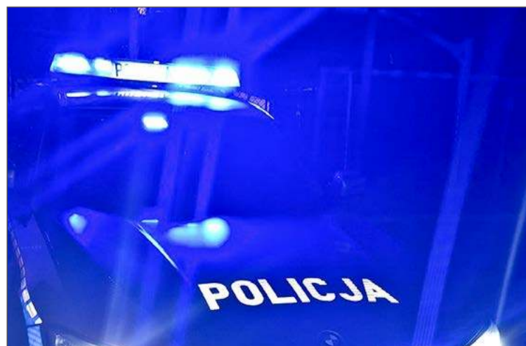
Policjanci na miejscu zdarzenia.