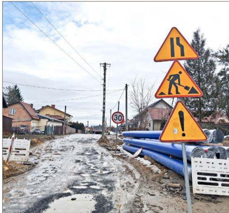
Prace przy ul. Macha w Dębicy ruszyły w ubiegłym roku.

- A kogo wykonawca bierze, jako podwykonawców odnosił się nie