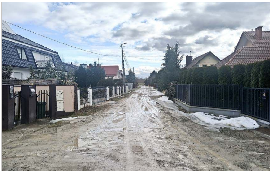
Remontu doczeka się między innymi ten odcinek drogi w Zawierzbiu.