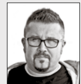
ratuszniak@ol.com.pl tel. 14 670 27 80