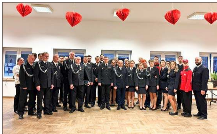
Druhowie z Parkosza podczas zebrania sprawozdawczo-wyborczego.