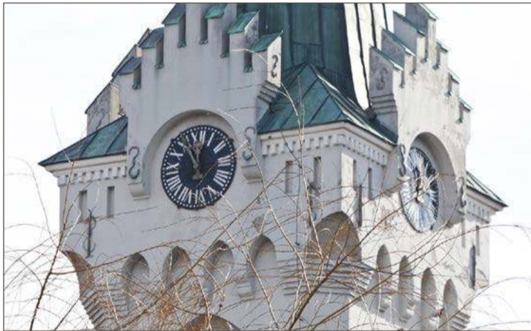
Zegar na kościele św. Jadwigi jest obecnie jedynym takim w Dębicy.

Na zegarze na wieży kościoła św. Jadwigi też była godzina 11:56. Zastanawia się więc, dlaczego dzwony zaczęły bić, skoro na Aniół Pański powinny o 12:00.