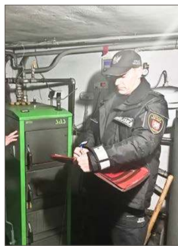
Strażnicy mają prawo do kontroli pieców.

Strażnicy przypominają, że zgodnie z przepisami w indywidual-