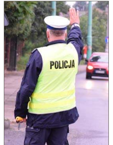
Funkcjonariusze mają co robić, nie tylko na drogach.

W województwie podkarpackim gorzej jest tylko w powiecie jasielskim i Rzeszowie.