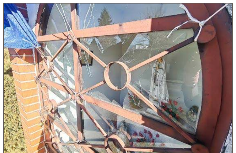
Rozbita została szyba w drzwiach. Ktoś wrzucił przez nią butelkę.

- Ja nie wiem, co to komu przeszkadza? Jeden dba, pali świeczki,