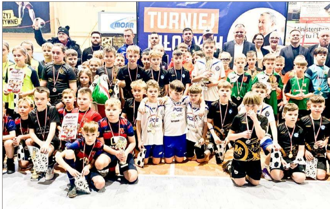
Wszyscy byli zwycięzcami zawodów, medalu nie zabrakło dla żadnego z zawodników.

Wyniki: Chemik - Czarnovia 4:1, DAP - Diament 2:0, Legion - Stasiówka 0:1, Straszęcin - Igloopol 1:3, Chemik - DAP 0:0, Czarnovia - Legion 5:1, Diament - Straszęcin 3:0, Stasiówka - Igloopol 1:1, Chemik - Legion 1:1, DAP - Straszęcin 0:0, Czarnovia - Igloopol 1:4, Diament - Stasiówka 1:1, DAP - Legion 4:1, Chemik - Straszęcin 1:2, Czarnovia - Stasiówka 0:1, Diament - Igloopol 1:5, Legion - Straszęcin 1:0, DAP - Stasiówka 0:1, Chemik - Igloopol 2:1, Czarnovia - Diament 4:0, Stasiówka - Straszęcin 5:0,