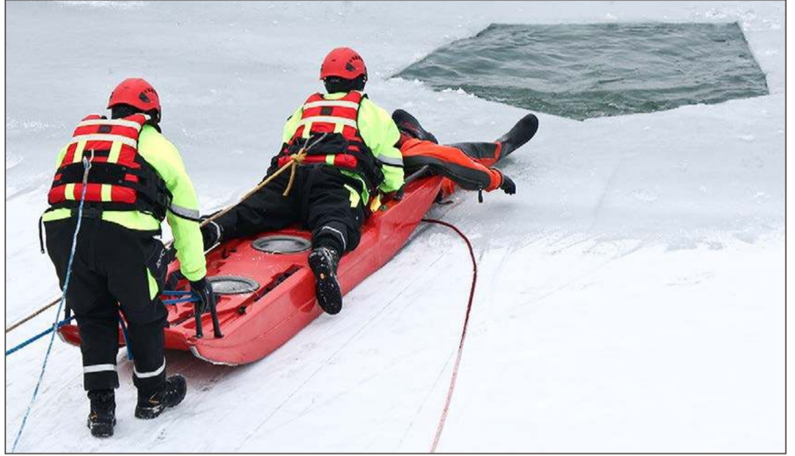
Ćwiczenia odbywały się na stawach w pobliżu Wisłoki.

Policjanci przypominają podstawowe zasady zachowania się na lodzie podczas sytuacji kryzysowej: należy natychmiast powiadomić służby ratownicze. Jednocześnie ocenić sytuację, czy jesteśmy w stanie tej osobie pomóc, czy czekać na ratowników. Nie wbiegać na лёд, najlepiej się czołgać. Osobie, która wpadła do wody, można rzucić szalik, bluzę, gałąź lub coś, co mógłby chwycić i podciągnąć się na brzeg: linki holownicze, elementy o większej powierzchni, np. odwrócone sanki, deski, a nawet kurtki i swetry. Najważniejsze, żeby jak najszybciej dotrzeć do poszkodowanego i wyciągnąć go z wody, zachowując ostrożność i dbając o własne bezpieczeństwo. (nan)