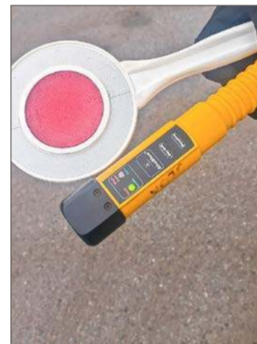
45-latek został zbadany alkomatem, wydmuchał 0,8 promila.

45-latek przyznał się, że wcześniej spożywał alkohol, ale funkcjonariusze i tak zabezpieczyli nagrania ze sklepowego monitoringu. Zatrzymany wyjaśnił, że do Korzeniowa przyjechał na zakupy. W sklepie kupił alkohol. Po sprawdzeniu w systemie wyszło na jaw, że męż-