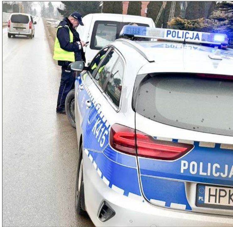
Policjanci na drogach powiatu systematycznie prowadzą kontrole prędkości.

Tego samego dnia patrol policji zatrzymał pirata drogowego w Brzostku. Mieszkaniec Krakowa za kierownicą Toyoty pędził przez