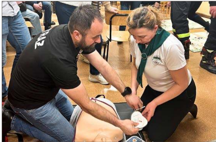
Panie z KGW Aktywna Chotowa też uczyły się obsługi defibrylatora.

KGW Aktywna Chotowa mieszkańców zaprasza natomiast na czwartek 12 lutego, na wydarzenie organizowane wspólnie z OSP Chotowa i sołtysem Waldemarem Czapiewskim. W trakcie jego trwania został przeprowadzony pokaz użycia defibrylatora.