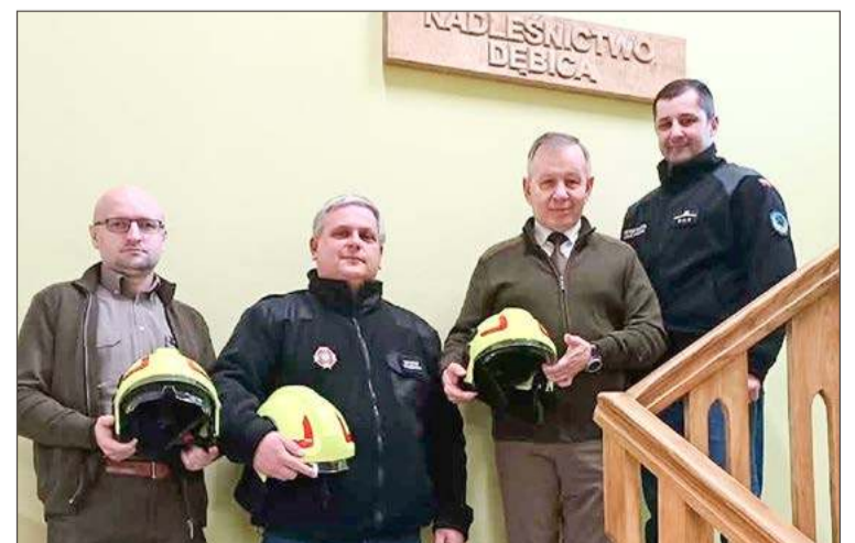
Szefowie nadleśnictwa z kierownictwem jednostki z Chotowej.

Uroczystość w Podkarpackim Urzędzie Marszałkowskim