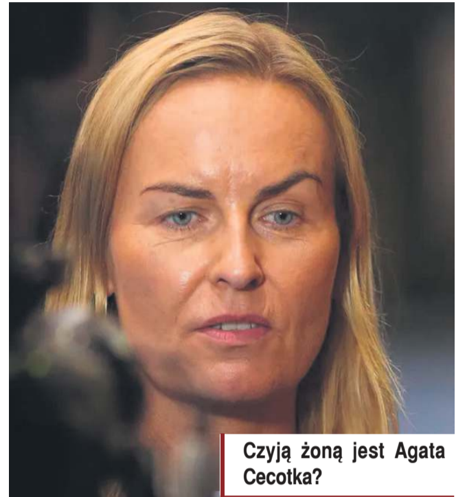
Czyją żoną jest Agata Cecotka?