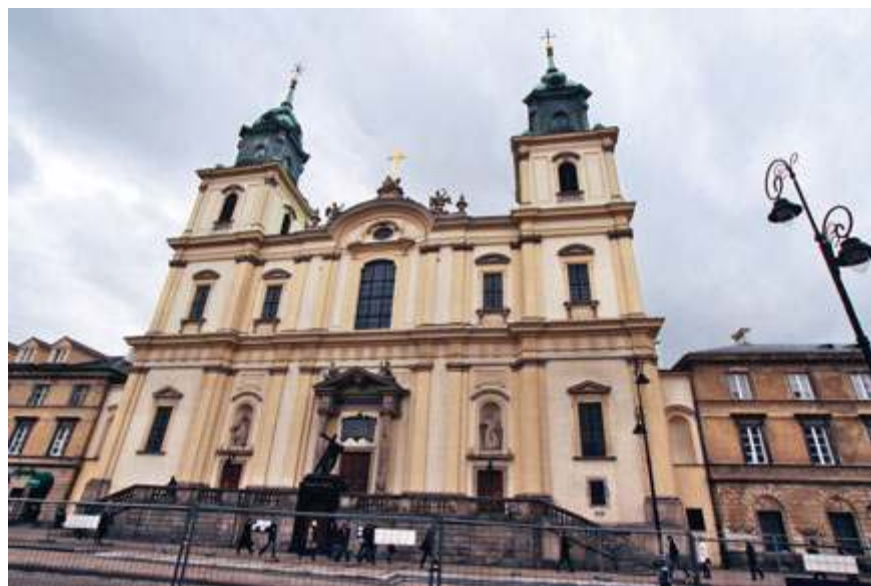
Kościół Świętego Krzyża w Warszawie – kolebka Zgromadzenia Księża Misjonarzy w Polsce

Niezmiennie od czasów św. Wincentego, aby być misjonarzem, trzeba naśladować Chrystusa głoszącego Ewangelię ubogim.