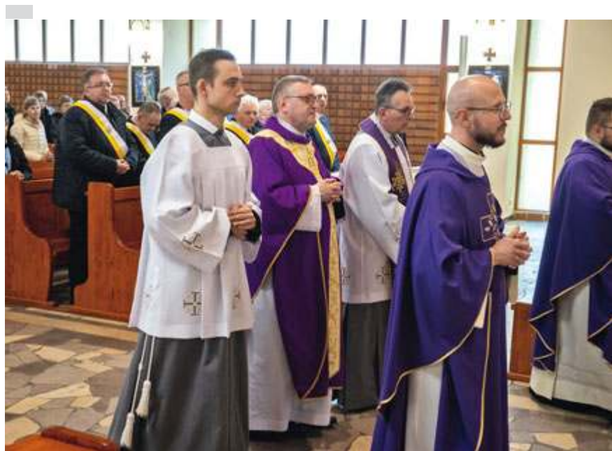
fot. ks. Paweł Kłys

kościół i stworzyli własną parafię. Dziś chcemy podziękować Panu Bogu za to, że to miejsce stało się miejscem ważnym dla chrześcijan – mówił ks. Wiesław Kamiński. Liturgia jubileuszowa miała charakter ekumeniczny./ks. Paweł Kłys