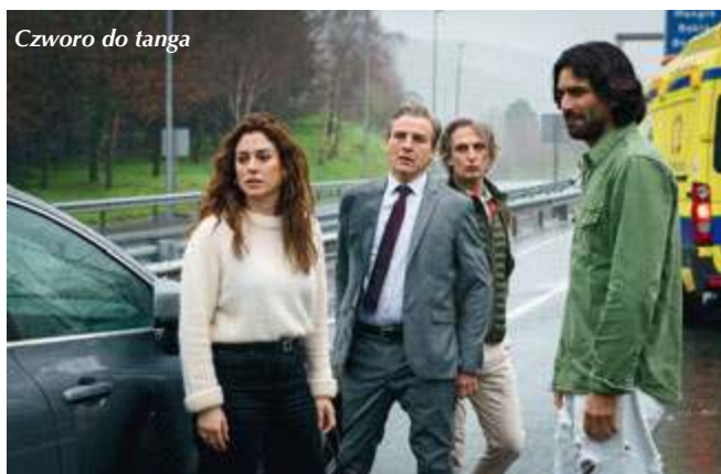
Czworo do tanga

K inematografia hiszpańska ma w Polsce wielu miłośników. Dlatego wiosenny Tydzień Kina Hiszpańskiego w Warszawie cieszy się corocznie wielkim powodzeniem. Podczas festiwalu sale kin Muranów i Luna pękały w szwach. W imprezie uczestniczyli, jak zawsze, widzowie bywający w Hiszpanii, znający ten kraj i interesujący się tamtejszą kulturą – widać to po kularowych rozmowach. W tym roku program festiwalu składał się z filmów różnych gatunków, głównie dramatów obyczajowych, komedii i utworów sensacyjnych. Na przykładzie kilku wybranych filmów postaram się scharakteryzować ważne tendencje w kinie hiszpańskim. Twórcy z tego kraju starają się kontynuować najważniejsze tradycje tamtejszego kina. Na ekranie widzieliśmy więc typową dla tamtej kultury mieszankę filmowego realizmu, surrealizmu i czarnego humoru. Zaprezentowane produkcje cechowały się doskonale napisanymi scenariuszami i dialogami i świetnie skonstruowaną dramaturgią.