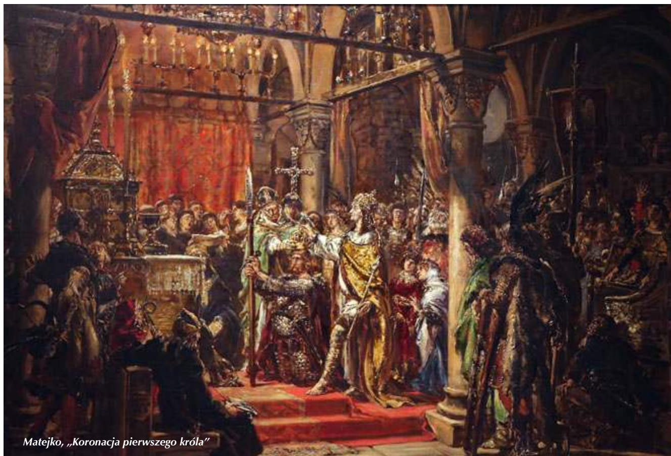
Matejko, „Koronacja pierwszego króla”