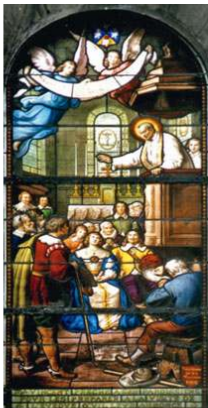
Święty Wincenty głoszący Ewangelię

Początki zgromadzenia są we Francji – tam w XVII w. ks. Wincenty à Paulo został wezwany do umierającego mieszkańca wsi Gannes. Zachęcił go do spowiedzi z całego życia. Po jej odprawieniu umierający wyznał publicznie, że bez niej byłby