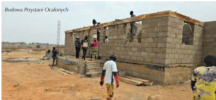
Budowa Przystani Ocalonych