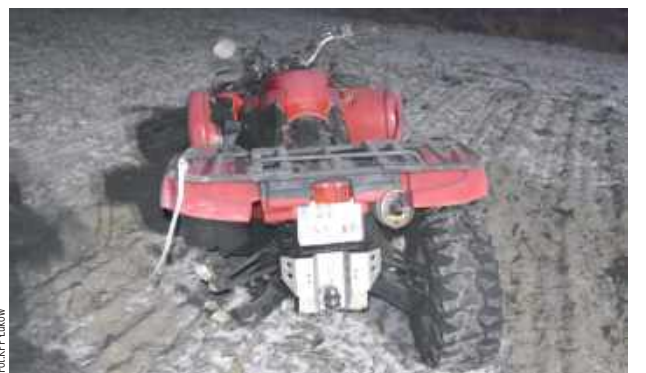
For KPP Łuków

Z ustaleń funkcjonariuszy wynika, że 22-letni mieszka-