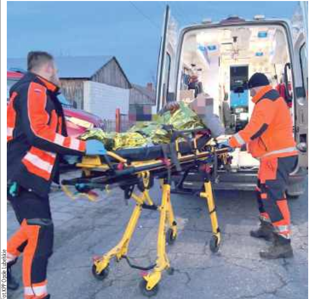
Policjanci opiekowali się 71-latkim aż do przyjazdu ratowników medycznych. Bardzo osłabionego mężczyznę policjanci przekazali załodze karetki pogotowia

Gmina Józefów nad Wisłą: Tylko dzięki sprawnej i szybkiej interwencji policjantów z Opolu Lubelskiego udało się uniknąć tragedii. Tym razem pomoc przyszła na czas.