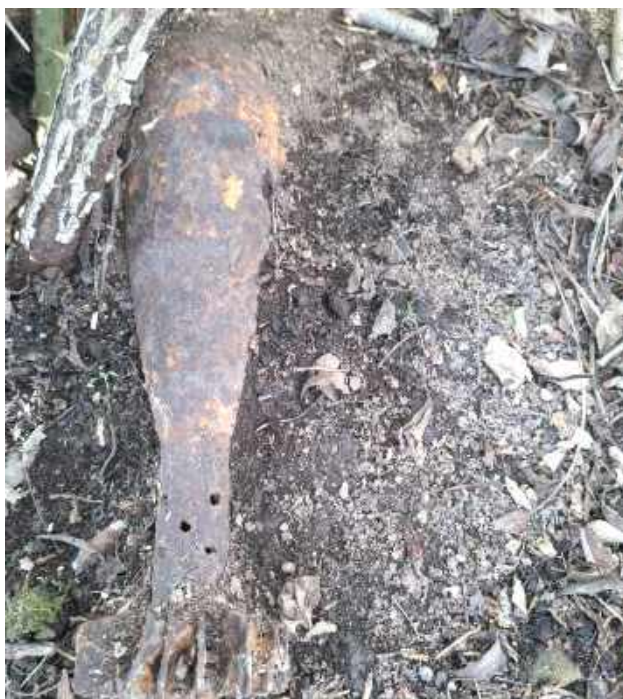
To pocisk moździerzowy pochodzący z czasów II wojny światowej

W czwartek, 20 lutego koło południa mieszkaniec gminy Józefów nad Wisłą poinformował policjantów, że w czasie prac polowych na swojej działce znalazł pocisk, który wystaje z ziemi. - Skierowani na miejsce policjanci ustalili, że jest to pocisk moździerzowy pochodzący z czasów II wojny światowej. Niewybuch miał