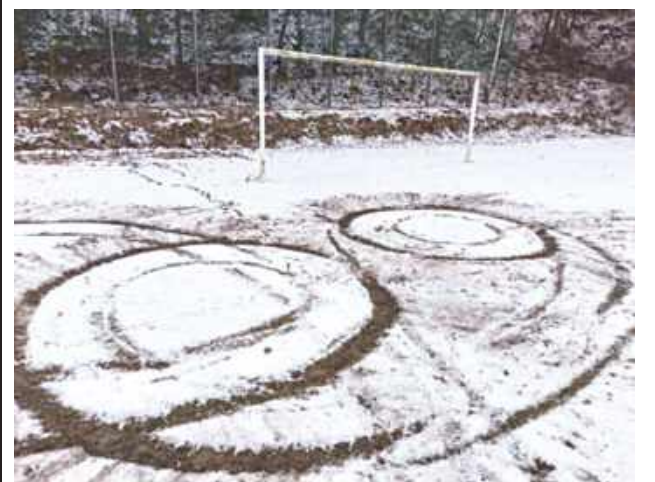
Chwila uciechy jednego jest zmartwieniem wielu

Boisko w Ciecierzynie. Komuś najwyraźniej mocno się nudziło.