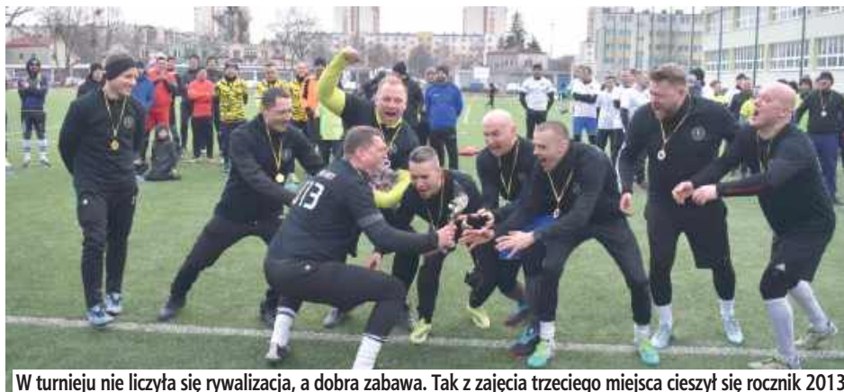
W turnieju nie liczyła się rywalizacja, a dobra zabawa. Tak z zajęcia trzeciego miejsca cieszył się rocznik 2013

W młodym wieku grali w piłkę nożną, a teraz ich dzieci uczą się tej dyscypliny pod okiem świetnych fachowców. Na boisku przy ZSO nr 1 po raz pierwszy rozegrano turniej międzyrocznikowy dla rodziców, których pociechy uczęszczają do Akademii Piłkarskiej Perełki Puławy.