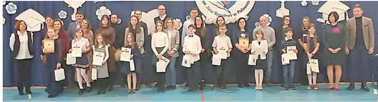
Gala w „Trójce” odbyła się przed feriami zimowymi. Wyróżniono 97 uczniów

Przed feriami zimowymi w Szkole Podstawowej nr 3 im. Jana Brzechwy odbyła się gala „Nasi Najlepsi”, podczas której nagrodzono zdolnych uczniów.