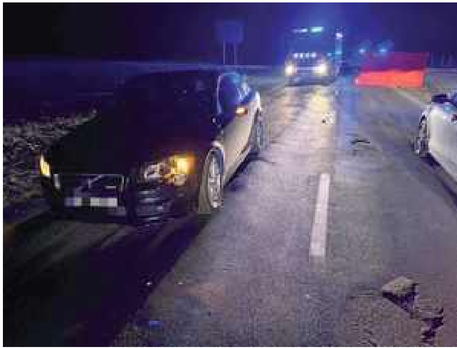
Do wypadku doszło poza obszarem zabudowanym, na prostym i nieoświetlonym odcinku drogi

- Kierujący samochodem Volvo, 61-letni mieszkaniec gminy Opole Lubelskie, jechał w kierunku Puław. W trakcie wymijania z innym pojazdem najechał na idącego jeźdźcą pieszego, który nie miał żadnych elementów odblaskowych. W wyniku zdarzenia pieszy poniósł śmierć na miejscu. Kierujący Volvo był trzeź-