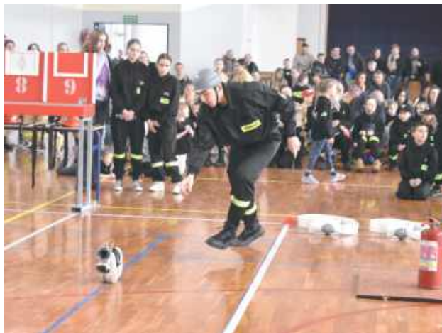
W II Halowych Młodzieżowych Zawodach Sportowo-Pożarniczych uczestniczyły trzy gminy: Kurów, Markuszów i Janowiec