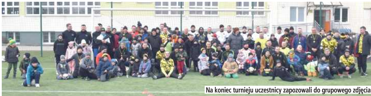
Na koniec turnieju uczestnicy zapoznawali się do grupowego zdjęcia

W młodym wieku grali w piłkę nożną, a teraz ich dzieci uczą się tej dyscypliny pod okiem świetnych fachowców. Na boisku przy ZSO nr 1 po raz pierwszy rozegrano turniej międzyrocznikowy dla rodziców, których pociechy uczęszczają do Akademii Piłkarskiej Perełki Puławy.