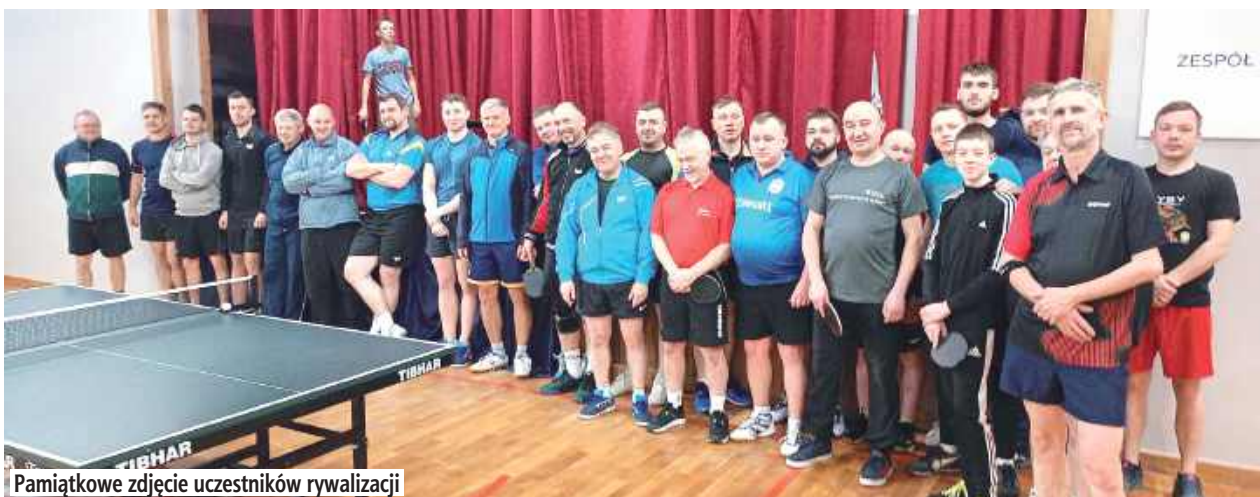
Pamiątkowe zdjęcie uczestników rywalizacji