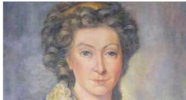
Księżna Izabela Czartoryska była twórczynią pierwszego w Polsce muzeum pamiątek narodowych, utworzonego w Świątyni Sybilli w Puławach

Obchody Roku Księżnej Izabeli Czartoryskiej stanowią okazję do refleksji nad jej dokonaniami oraz do promocji wartości, które przyswiecały jej działalności.