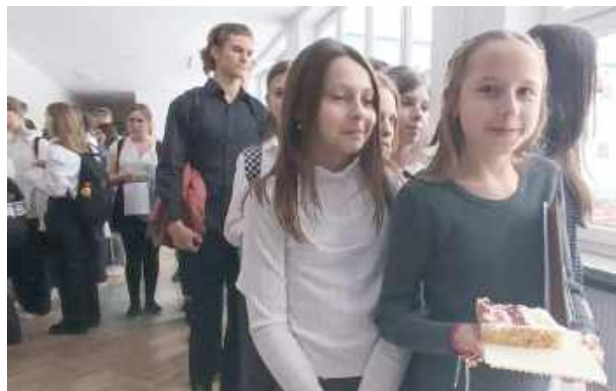
W uroczystości wzięli udział uczniowie z klas IV-VIII

Nagrody za wysokie wyniki w nauce oraz w sporcie nie omi-