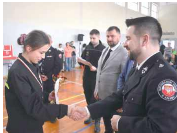
Najlepsze drużyny zostały wyróżnione i wystąpią podczas etapu powiatowego, który został zaplanowany 2 marca