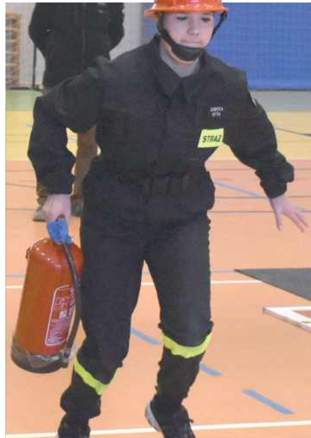
W młodzieżowych zawodach strażackich dla gmin Baranów i Żyrzyn wystartowały cztery drużyny