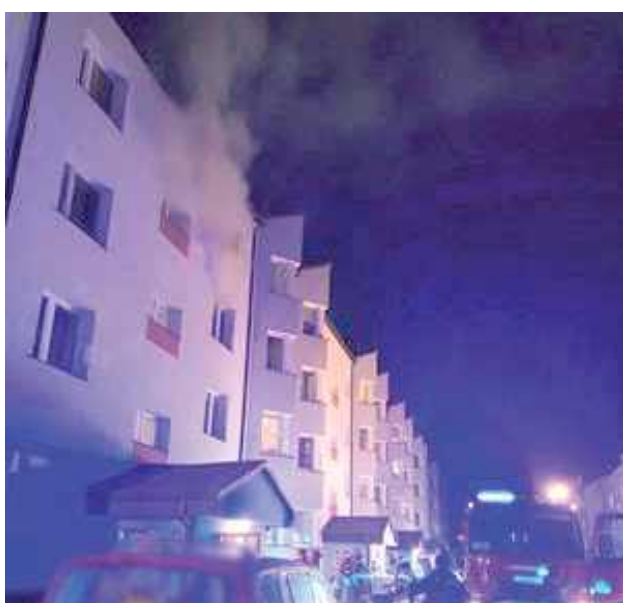
Dym unosił się z jednego z okien na drugim piętrze

- Na miejsce udały się zastępy straży pożarnej, których dowód-