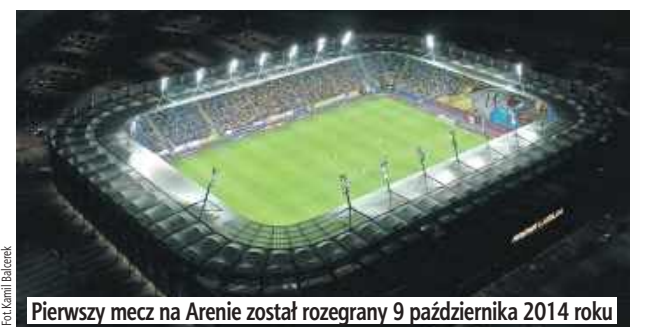
Pierwszy mecz na Arenie został rozegrany 9 października 2014 roku

Na co dzień ze stadionu korzystają właśnie piłkarze lubelskiego Motoru, ale w przeszłości organizowano na nim także mecze mistrzostw Europy U21, mistrzostw