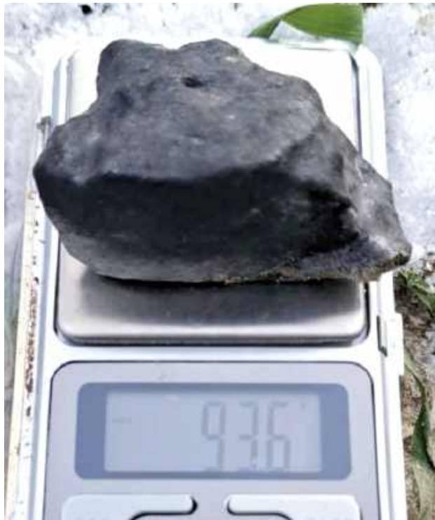
Pod koniec lotu, na wysokości 20 km, skała rozpadła się na wiele drobnych fragmentów o średnicy kilku centymetrów, które mogły spaść na Ziemię w postaci meteorytów

Bolid, czyli jasny meteor, rozpadł się we wtorek, 18