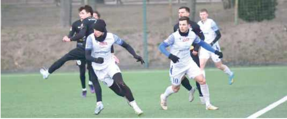
Koniec testowania. Gracze Lewartu już w weekend wrócą do rywalizacji o punkty. W sobotę podejmą Siarkę Tarnobrzeg

Zespół z Lubartowa zakończył serię gier kontrolnych. Ostatni występ nie napawa optymizmem.