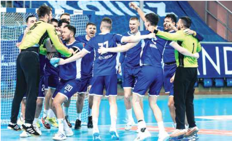
Paławianie świętowali wygraną w Kaliszu. Piękne chwile!

Emocje do ostatnich sekund, zwroty akcji i dramatyczna końcówka. Starcie Energa MKS-u Kalisz z Azotami Puławki trzymało w napięciu aż do serii rzutów karnych. Choć gospodarze byli o krok od zwycięstwa, to goście pokazali charakter, doprowadzili do remisu, a następnie przechyliili szalę na swoją korzyść w rzutach karnych.