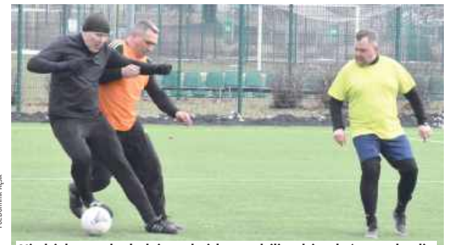
Niedziele przedpołudnie na boisku spędzili rodzice, którzy walczyli w drużynach o puchar tej najlepszej