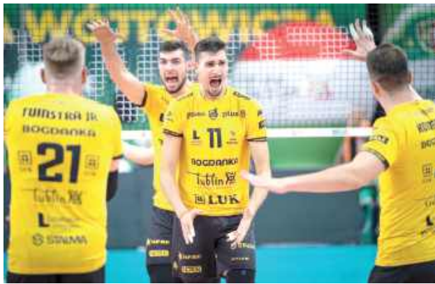
Bodanka LUK Lublin wygrała dwa mecze z tym samym rywalem

W minionym tygodniu dwa mecze ze Steam Hemarpol Norwidem Częstochowa rozegrali siatkarze Bogdanki LUK Lublin. W obu okazali się lepsi od rywali, a efektem były punkty w tabeli PlusLigi i awans do półfinału Pucharu Polski.