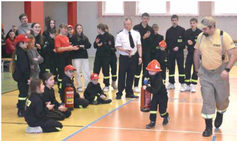
Swoich sił próbowali także kilkulatek, dla niektórych był to pierwszy udział w imprezie