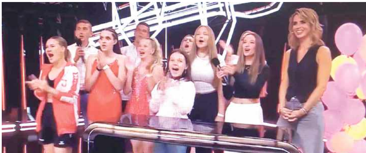
Za kulisami Asię wspierali nie tylko rodzice, ale też przyjaciele ze Szkoły Tańca i Gimnastyki Diament z Radzyna Podlaskiego