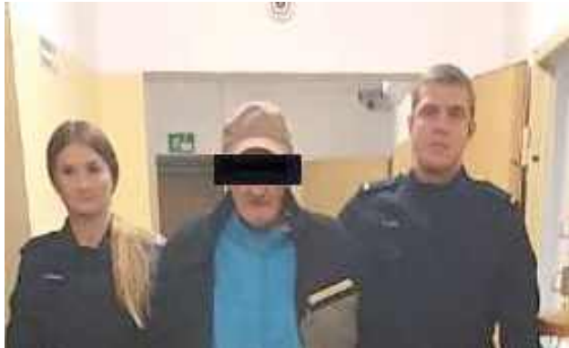
Sprawca rozboju został skazany na 3,5 roku pozbawienia wolności

Do zdarzenia doszło 1 października. Jak informuje Biuro Prasowe Sądu Okręgowego w Lublinie, mężczyzna zaatakował swoją partnerkę nożem, żądając, żeby wydała mu pieniądze - 20 złotych. Groził jej pozbawieniem życia. Kobieta sprzeciwiła się jego żądaniu, uciekła do sąsiadki.