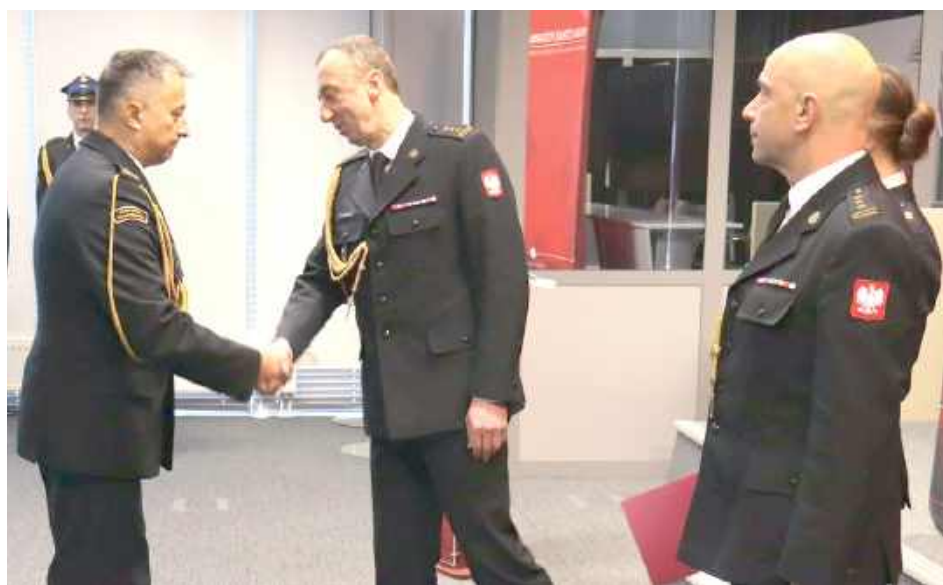
W czwartek, 20 lutego odbyło się uroczyste pożegnanie odchodzącego komendanta

W 2007 roku przeniesiono go do wydziału operacyjnego, a w kwietniu 2009 roku - do Komendy Wojewódzkiej Państwowej Straży Pożarnej w Lublinie do wydziału kontrolno-rozpoznawczego, w którym od września tego samego roku zajął