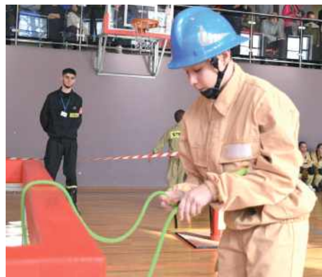
Podczas konkurencji młodzież musiała się uporać m.in. z zawiązaniem linki strażackiej