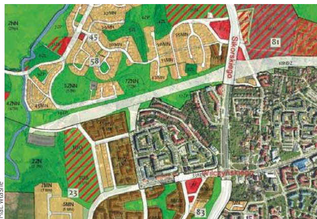
Trasa NDP w założeniu ma połączyć ul. Krasickiego z al. Warszawską

Jego zdaniem obecnie proponowane zapisy projektu planu ogólnego niosą ze sobą poważne konsekwencje. – Zachodzi sytuacja, w której to podtrzymanie rozwiązania w planie ogólnym bloku-