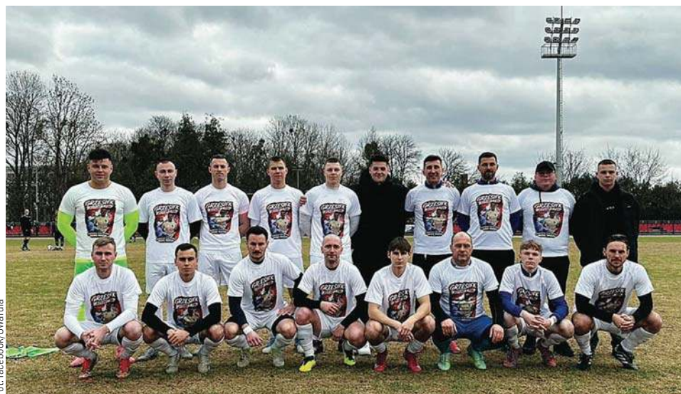
Gwardia Szczytno przed wyjazdowym meczem z Orłętami Reszel

Po niespełna godzinie gry gospodarze sensacyjnie wygrali 2:1, ale ich radość trwała bardzo krótko, bo po zaledwie trzech minutach było już 3:2 dla Naki! Aw końcówce goście jeszcze dwa razy trafili do siatki, robiąc kolejny krok w stronę w IV ligi.