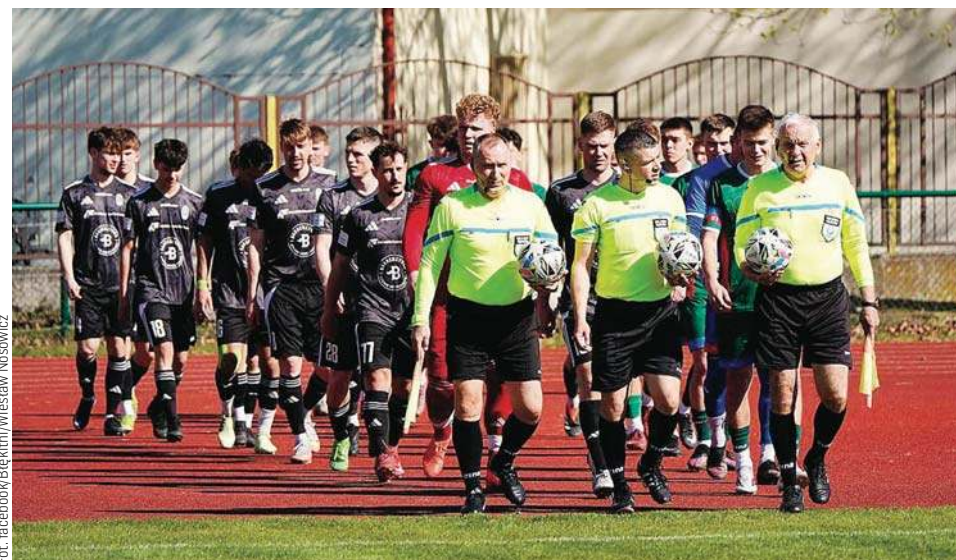
Mazur Pisz - Błękitni Pasym 3:1