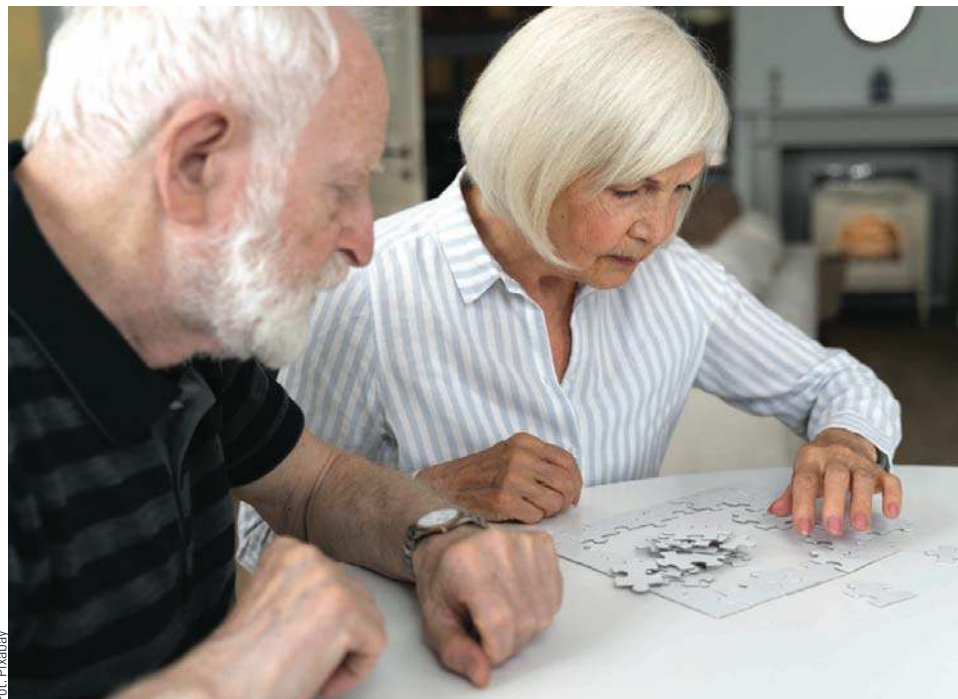
Choroby wieku starczego zaczynają pojawiać się najczęściej u osób między 60, a 65. rokiem życia.

1. Choroba Alzheimera – objawiająca się utratą pamięci, zdolnością rozumowania i orientacji, to najczęstszych chorób wieku podeszłego. Wg raportu