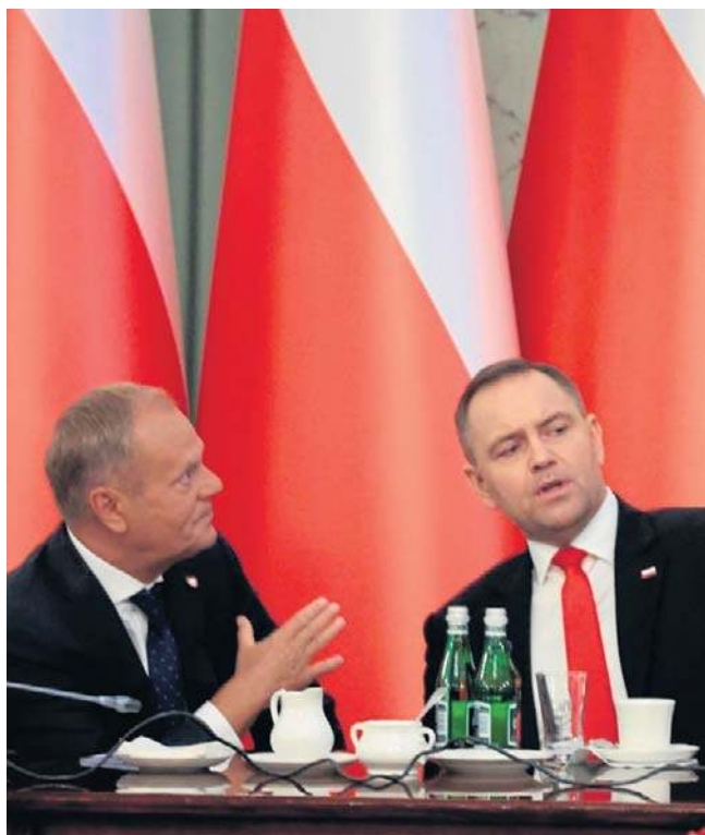
Niektórzy komentatorzy sceny politycznej zauważają, że prezydent Nawrocki zachowuje się jak „nadpremier”

- Na pewno sytuacja robi się niebezpieczna. Nie jestem psychoanalitykiem, nie będę bawił się w recenzowanie osobowości prezydenta czy innych moich oponentów. To sprawa drugorzędna, natomiast to, co dzieje się w polityce za sprawą prezydenta Nawrockiego i panów z opozycji, to to jest bardzo niebezpieczna sytuacja - stwierdził premier Tusk w TVP Info. - Niczego tak się nie boją, prezydent, prezes, drugi prezes, jak odbudowy naprawdę praworządne państwo. Bo gdybyśmy byli w stanie odbudować, na razie nie, bo blokuje ustawy, w pełni praworządne instytucje, niezależny system prawa, niezależne sądownictwo, trybunały, to ci, którzy nabroili tak bardzo