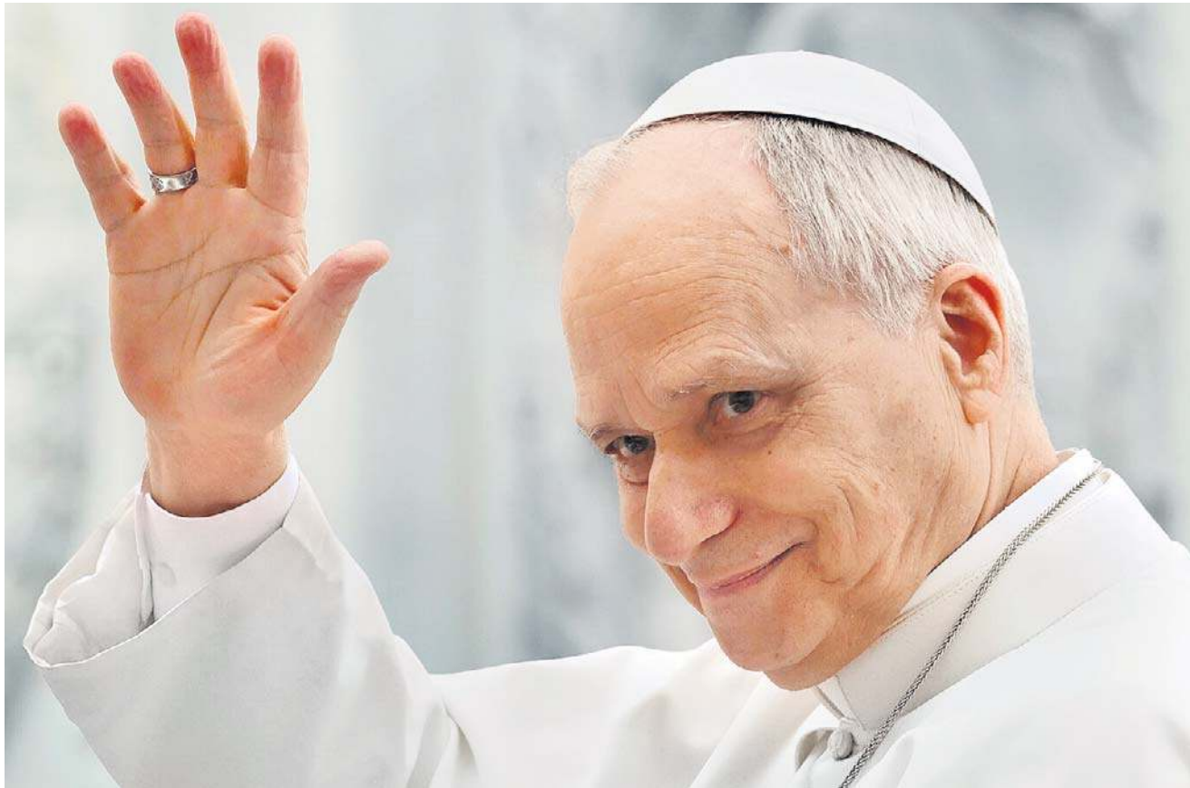
Watykańscy zauważają, że papież odwiedzi zarówno kraje o silnej dominacji islamu, jak i dynamicznie rozwijające się wspólnoty chrześcijańskie w Afryce