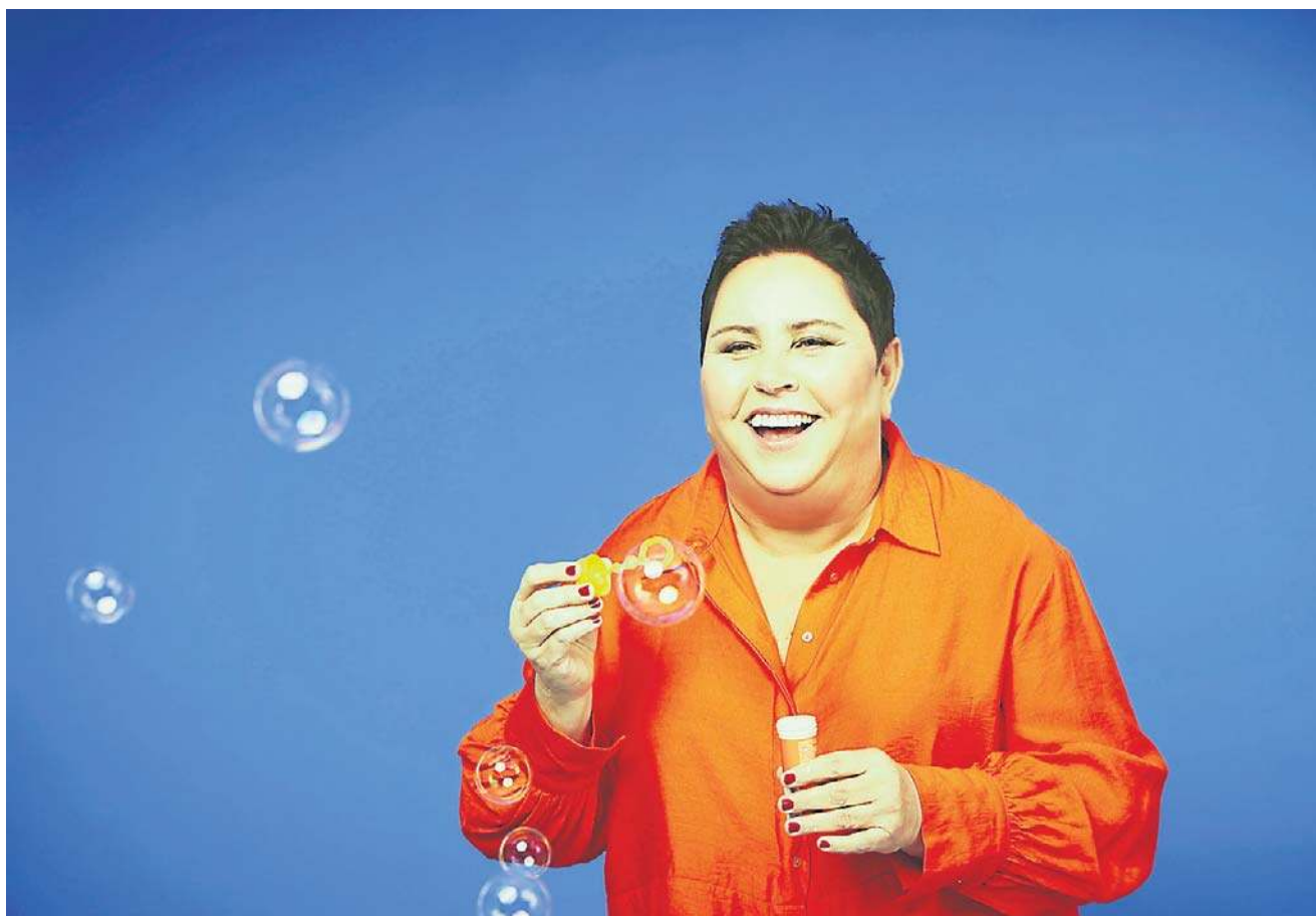
Dorota Wellman: Dojrzałość dała mi mądrość, doświadczenie, duży spokój i konsekwencję w tym, co robię