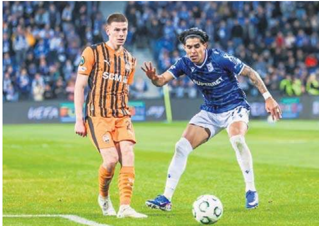
- Brazylijczycy zrobili różnicę, wygrała jakość Szachtara. Lech znajduje się w trudnym położeniu - ocenia Kapica

Mogę to oceniać z perspektywy kibica, nie je dobiaram piłkarzy do składu. Nie da się jednak ukryć, że Lech traci za dużo goli i ma problemy także w ekstraklasie, a już odpadł z Pucharu Polski. Rywal w 1/8 finału, Szachtar, ze znakomitymi Brazylijczykami, to drużyna ograna w Europie, poważny kandydat do triumfu w Lidze Konferencji. Na rewanż „Kolejorz” powinien wyjść, żeby pokazać się jak najlepszej strony i próbować - można wiele zyskać.