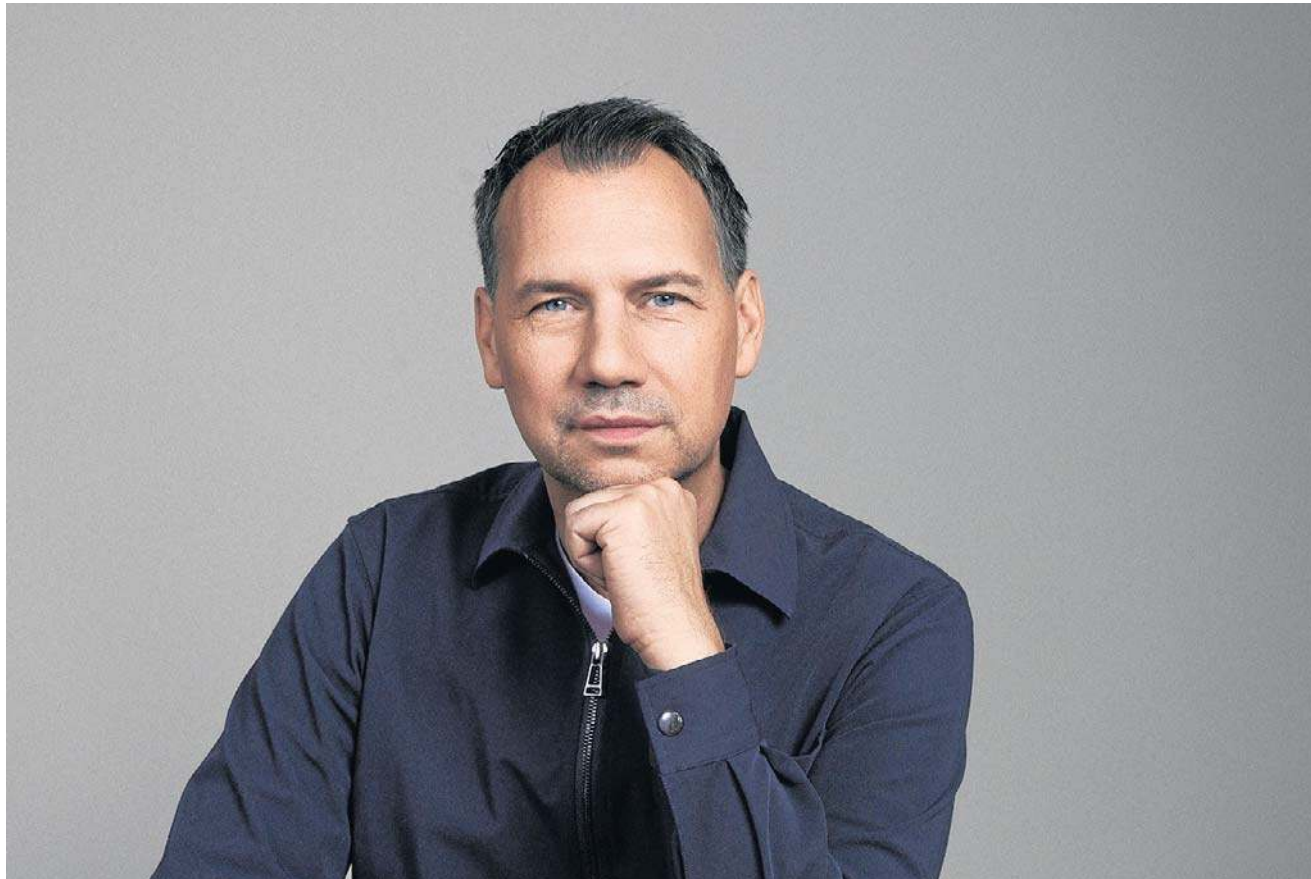
Sebastian Fitzek: Kiedy oglądam dokumenty true crime, zawsze zadaję sobie pytanie: dlaczego to oglądam? Czy naprawdę potrzebuję tego do researchu? Dlatego oglądam bardzo mało tego typu programów. Szczerze mówiąc, w dzisiejszych czasach samo czytanie wiadomości w gazecie czasem przypomina true crime