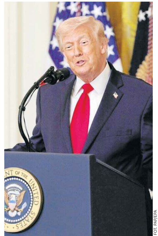
Donald Trump wyraził też wątpliwość, czy nowy przywódca Iranu, Modżtaba Chamenei, żyje i sprawuje władzę

Może to być związane z tym, że Moskwa ograniczyła ilość informacji przekazywanych Teheranowi, aby nie drażnić Waszyngtonu.