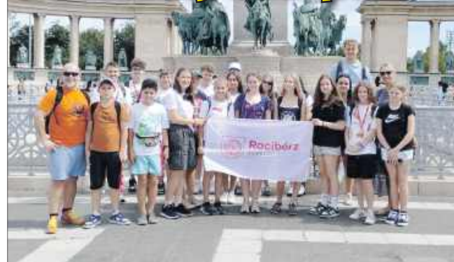
■ Młodzież miała okazję zwiedzić wraz z przewodnikami najciekawsze miejsca Zugló

W dniach 15-20 lipca 2025 roku, na zaproszenie burmistrza partnerskiej gminy Zugló (XIV dzielnica Budapesztu), 20-osobowa grupa uczniów z Raciborza wzięła udział w międzynarodowym obozie młodzieżowym na Węgrzech.