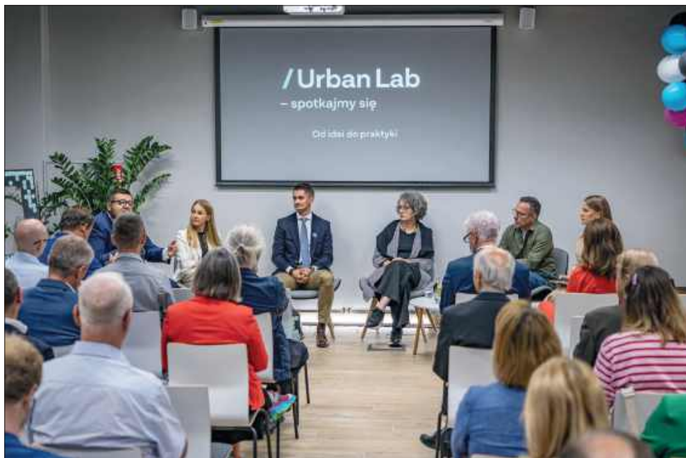
■ Pierwszym wydarzeniem w nowej placówce miejskiej w Raciborzu – Urban Labie była debata ekspercka poświęcona idei laboratorium miejskiego

rozwoju, jak zaczęło się zainteresowanie Raciborza Urban Labem? – To jest długa historia, ale do opowiedzenia krótko. W 2020 roku rozpoczęto ten projekt. Trwały prace nad nowym