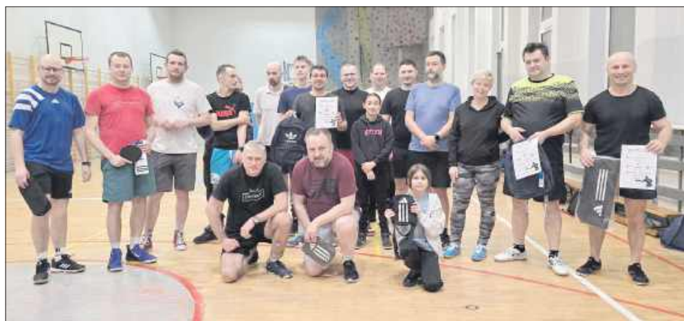
■ Najlepsi w Lidze Tenisa Stołowego w PCS w Raciborzu