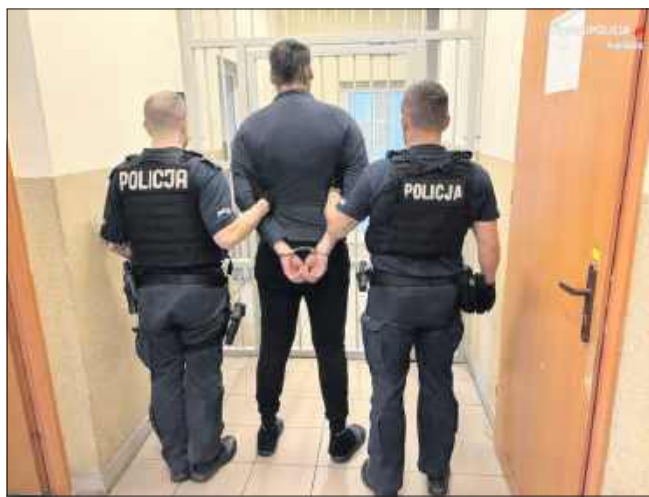
■ Policjanci zatrzymali podejrzanych