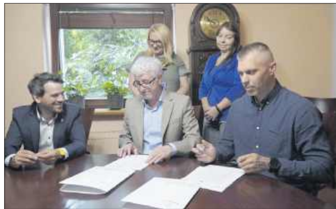
■ Prezydent Jacek Wojciechowicz podpisał umowę z raciborską firmą Instal-Tech na zmianę systemów grzewczych w lokalach komunalnych

W piątek (25 lipca) w Urzędzie Miasta podpisano umowę na realizację zadania pn.: „Zmiana systemu grzewczego z piecowego węglowego na ekologiczne niskoemisyjne w budynkach i lokalach komunalnych Gminy Racibórz”.