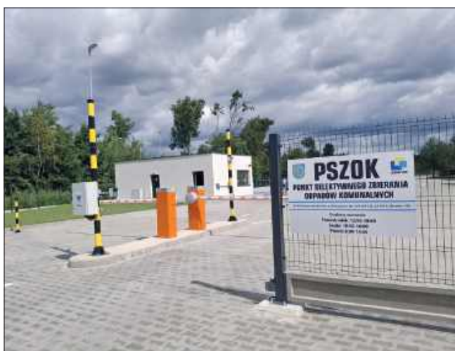
■ Nowy Punkt Selektywnej Zbiórki Odpadów Komunalnych w Kuźni Raciborskiej zlokalizowany jest przy ul. Kolejowej 6

Investycja kosztowała 7,4 mln zł – z czego 1,7 mln zł pochodziło z budżetu gminy, a pozostała część z Polskiego Ładu. W tej kwocie zawiera się nie tylko budowa obiektu, ale również zakup sprzętu, który – jak podkreśla dyrektor – ma ułatwić codzienne funkcjonowanie punktu: ciągniki, ładowarka z osprzętem, zamiatarka, kruszarka do betonu i szkła, przesiewacz do ziemi, rozdrabniacz do styropianu oraz stanowisko