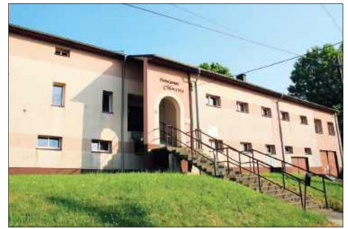
■ Zakres prac przy pensjonacie Moravia obejmuje m.in. budowę nowych schodów zewnętrznych z podnośnikiem dla osób z niepełnosprawnościami

Zakres prac przy pensjonacie Moravia obejmuje m.in. budowę nowych schodów zewnętrznych z podnośnikiem dla osób z niepełnosprawnościami, utwardzenie dojścia od strony boiska, przebudowę wejścia i szatni, remont głównej sali i sanitariatów, modernizację strefy wejściowej, prace przy instalacji centralnego ogrzewania, obudowę pionów oraz wykończenie wnętrza. Początkowo realizacją miała się zająć firma Kambud ze Starogardu Gdańskiego, która zaoferowała kwotę 1 000 000 zł, jednak ostatecznie odstąpiła od umowy. Nowym wykonawcą została firma Budmed z Zawady Książęcej, która złożyła najkorzystniejszą ofertę spośród pozostałych – jej koszt to 1 273 626,87 zł.