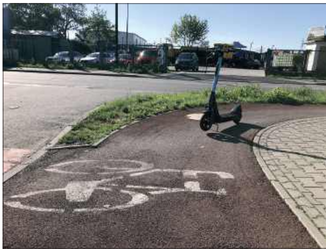
■ W Raciborzu hulajnogi elektryczne parkują na środku ścieżki rowerowej

Zgodnie z prawem o ruchu drogowym, hulajnogę