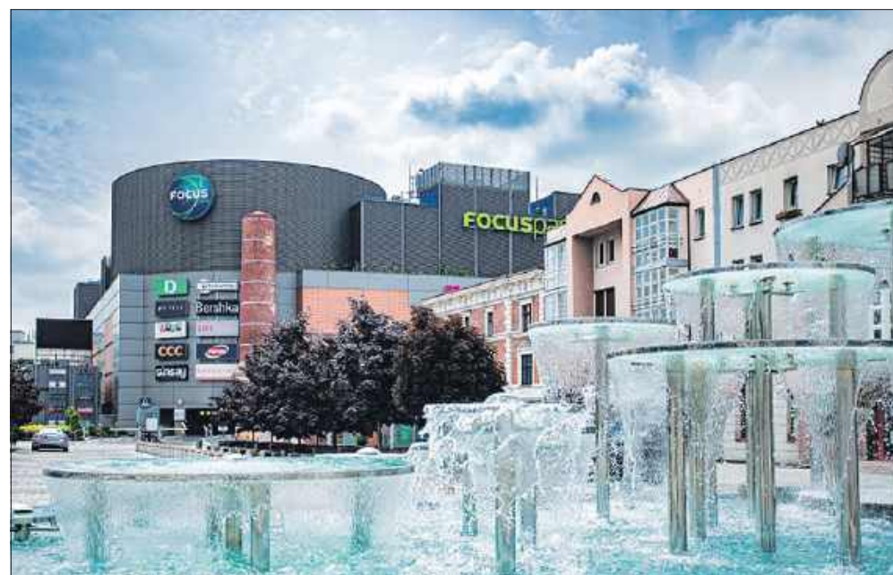
■ W Centrum Handlowym Focus Park w Rybniku trwa wyprzedaż do -70%!

zania, jak ogrody deszczowe , kompostowniki czy oczka wodne z naturalną filtracją.