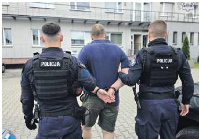
■ Policjanci zatrzymali sprawcę, 34-letniego mieszkańca powiatu prudnickiego