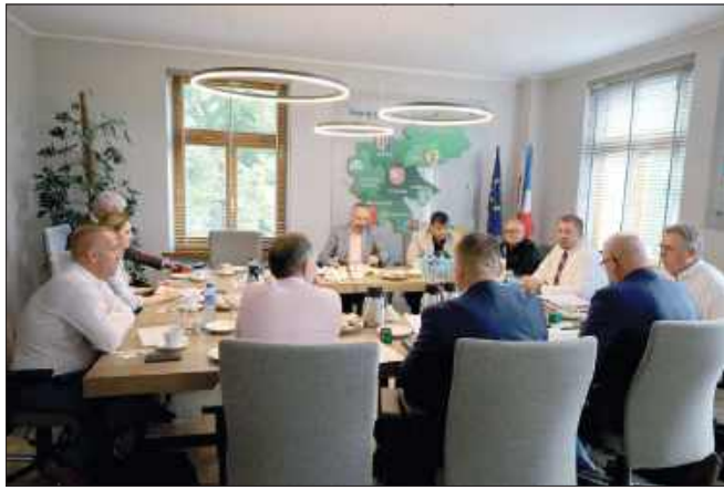
■ Konwent samorządowy to okazja do dyskusji nad tematami dotyczącymi całego regionu. Ostatni odbył się w starostwie, w sali posiedzeń zarządu