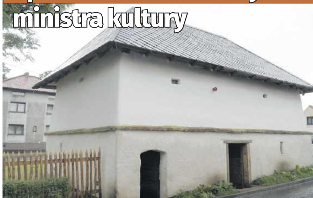
■ Zakończony remont przywrócił spichlerzowi trwałość konstrukcyjną

Zabytkowy spichlerz chłopski w Sudole został wyróżniony w prestiżowym, ogólnopolskim konkursie „Zabytek Zadbany 2025”.