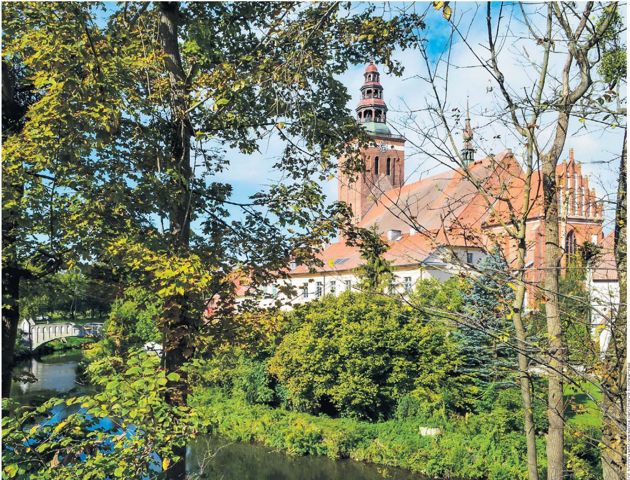
Lidzbark Warmiński to jedno z najmłodszych uzdrowisk w Polsce – zobacz jego zamek, starówkę i nowoczesne atrakcje