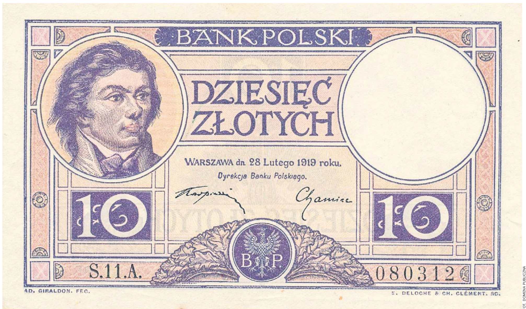
Dziesięć złotych polskich. Banknot został dopuszczony do obiegu 28 lutego 1919 roku

● Tuż po odzyskaniu niepodległości w 1918 roku niepodzielną władzę w kraju sprawował Józef Piłsudski ● Miał on głos decydujący w kwestiach politycznych i wojskowych, ale chciał on także podejmować najważniejsze decyzje w zakresie reformy walutowej