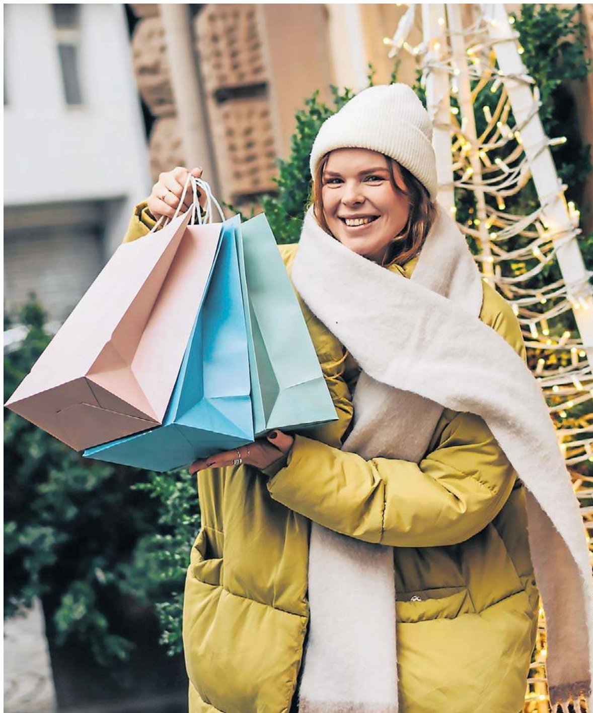
Podczas zimowych wyprzedaży łatwo stracić głowę, przeceny kuszą, a sklepy bombardują nas informacjami o „ostatnich sztukach”. Warto jednak zachować chłodny umysł

Zimowe wyprzedaże to świetna okazja, by skompletować garderobę na lata. Wszyscy znamy ból pięknych butów, które rozpadły się po pierwszym spacerze w śniegu. Dzięki promocjom na Black Friday pozwól sobie na droższe, ale bardziej wytrzymałe warianty! Niech będzie ciepło, stylowo i z rozsądkiem, bo w końcu najlepsze ubranie to takie, które nosisz z przyjemnością, a nie dlatego, że było w promocji.