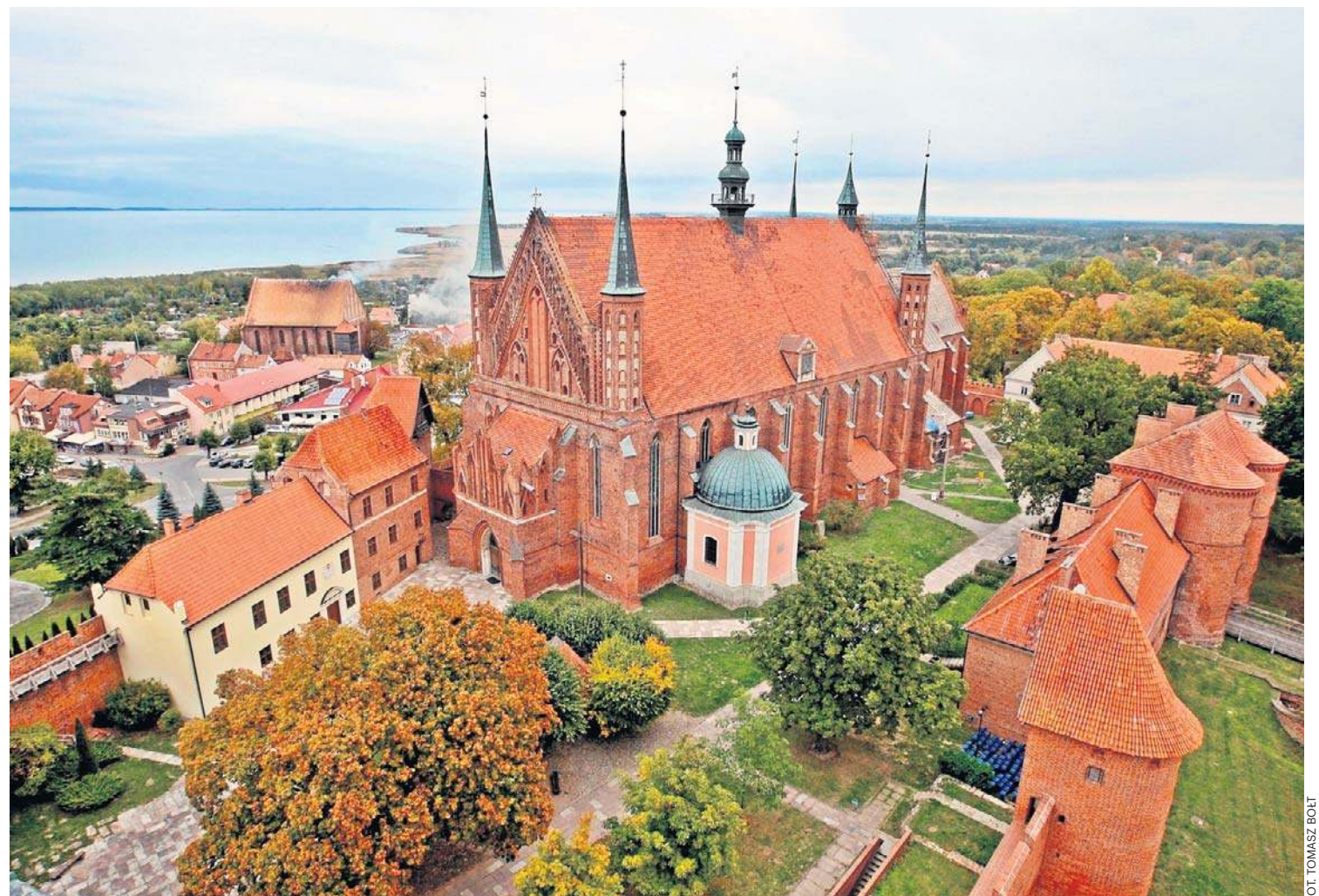
Frombork to miejsce pełne historii i unikatowych atrakcji, które warto odwiedzić o każdej porze roku. Odkryj urok miasta i pozwól się oczarować zabytkami

Oprócz zabytków, Lidzbark Warmiński ma do zaoferowania także atrakcje o zupełnie innym charakterze – sprzyjające relaksowi i zdrowiu. Najważniejszym punktem są Termy Warmińskie