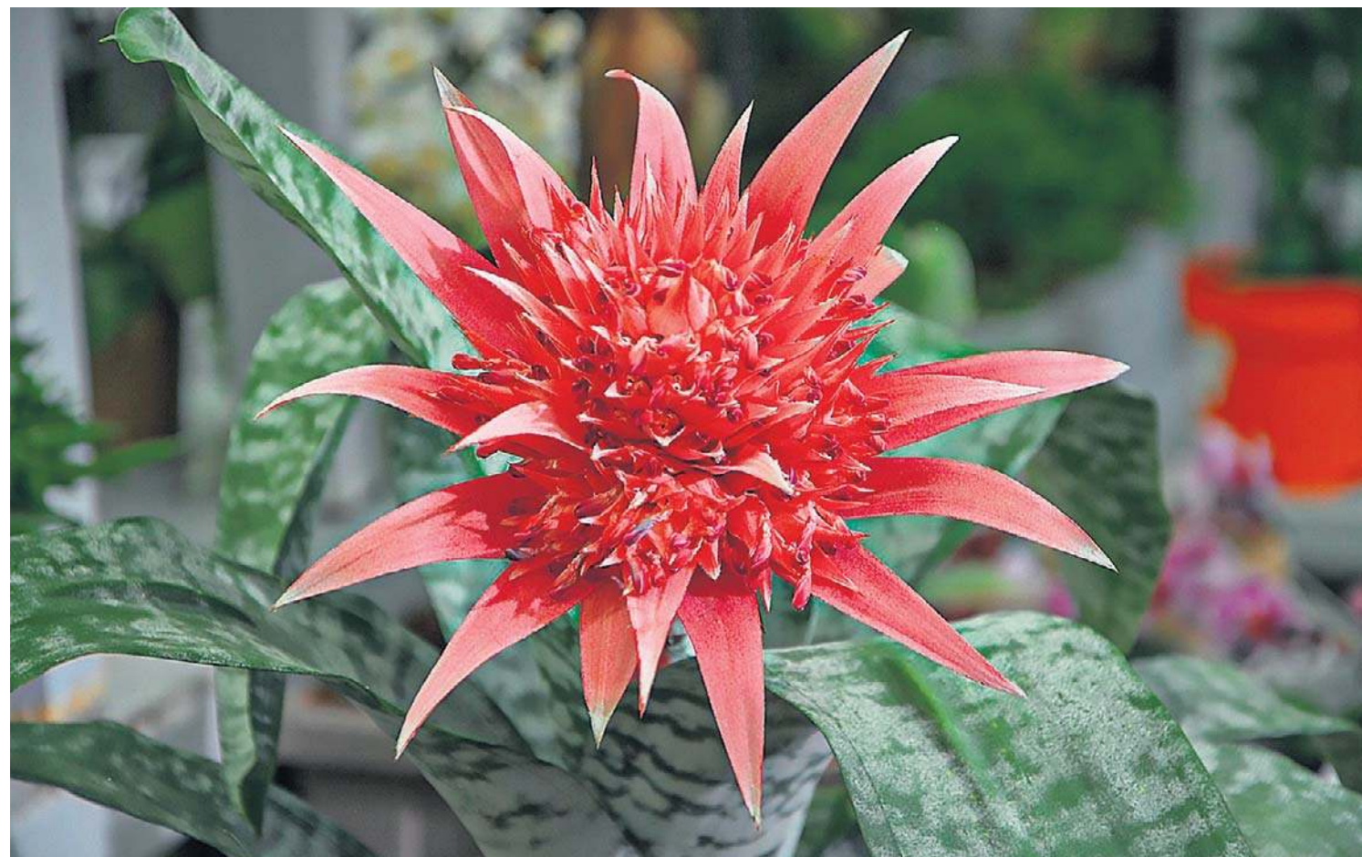
Najpopularniejszą echmeą jest echmea wstęgowata ( Aechmea fasciata ), ceniona za piękne, popielato-pasiaste liście i okazały, długo utrzymujący się różowy (a czasem fioletowy) kwiatostan

W naturalnym środowisku żyje w jasnym, rozproszonym świetle i – jak podpowiadają specjaliści – takie też najlepiej zapewnić tej roślinie. Dobrze toleruje ona również półcień. Idealnym miejscem będzie dla niej parapet wschodniego lub zachodniego