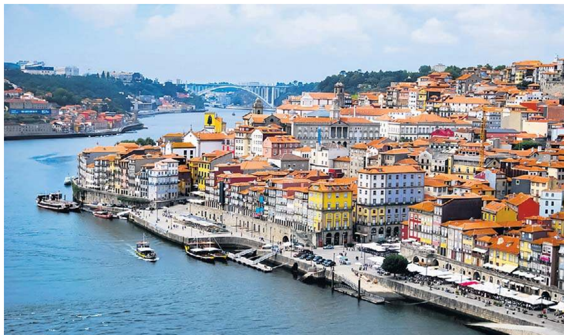
Porto – miasto położone w północnej części Portugalii, nad Oceanem Atlantyckim, u ujścia rzeki Duero. Druga co do wielkości metropolia w państwie, po Lizbonie

gdzie wynajmuje niewielki domek w strzeżonym rezerwacie. Wciąż blisko mają do natury, ale jednocześnie korzystają z komfortu i bezpieczeństwa europejskiego standardu życia.