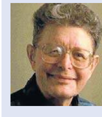
POUL ANDERSON (1926-2001)

– Nie wiem, co to jest! – wrzasnął, przekrzykując ogólne zamieszanie. – Może to jakaś francuska sztuczka, może też coś przyjaznego, a wtedy nasz zrach wypadłby głupio. Chodźcie ze