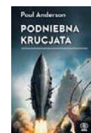
Poul Anderson, „Podniebna Krucjata”, wyd. Rebis, Poznań 2026, cena 49,90 zł

Gdyby demon po prostu tam stał, szybko byśmy się załamali i uciekli. On jednakże podniósł tubę trzymaną w dłoni i wystrzelił białym płomieniem. Usłyszałem trask i zobaczyłem, jak razi stojącego opodal łucznika (...).