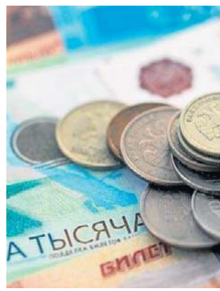
Fatalna sytuacja budżetu Rosji na początku 2026 r.

Dochody z ropy i gazu spadły o połowę (do 826 mld rubli) po spadku cen rosyjskiej ropy i wymuszonym ograniczeniu wydobycia przez koncerny naftowe. W rezultacie budżet wydał prawie dwa razy więcej niż zebrał w postaci podatków.