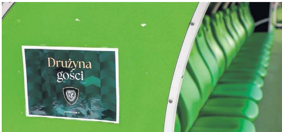
W sobotę ławka rezerwowych gości pozostała we Wrocławiu pusta. Teraz meczem Śląska z Wisłą zajmą się komisje PZPN i można spodziewać się nałożenia kar na oba kluby

Zacznijmy od tego, że Komisja Dyscyplinarna zajmie się przede wszystkim tematem niewpuszczenia przez Śląsk zorganizowanej grupy kibiców Wisły. Natomiast kwestią kar dla Wisły za niestawienie się na meczu zajmie się Komisja ds. Rozgrywek PZPN. I ona orzeknie jak rozwiązać kwestię wyniku tego meczu. Tyle droga formalna, o werdyktach - proszę mi wybaczyć, spekulować nie będę. Dodam może tylko, że Komisja ds. Rozgrywek PZPN będzie oczywiście