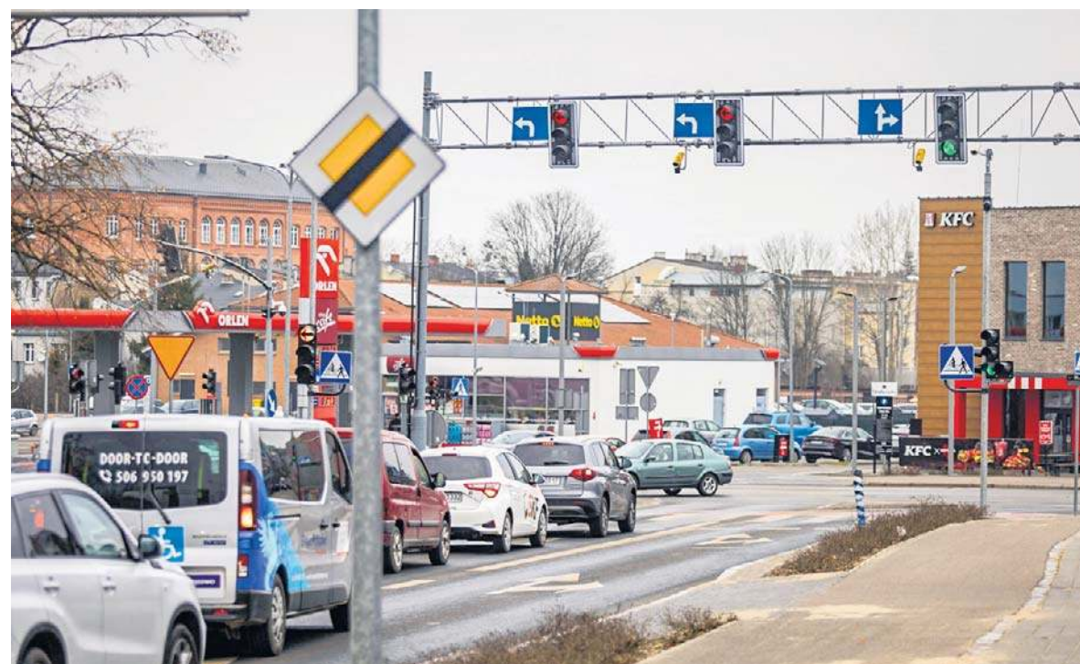
Skrzyżowanie Gdańska-Garncarska-Wiejska-Sierpinka w Słupsku