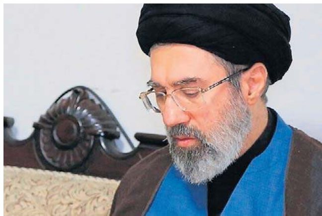
Modżtaba Chamenei objął stanowisko najwyższego przywódcy Iranu w niedzielę, zastępując swojego ojca

Według cytowanych rozmówców polityk „został ranny, szczególnie w nogi, ale jest przytomny i bezpieczny w ściśle strzeżonym miejscu o ograniczonych możliwościach komunikacji”. Jak podała AFP, nowy przywódca miał zostać ranny podczas tego samego nalotu, w którym zginął jego ojciec. Izraelski wywiad miał wiedzieć o tym jeszcze przed jego oficjalnym mianowaniem. PAP