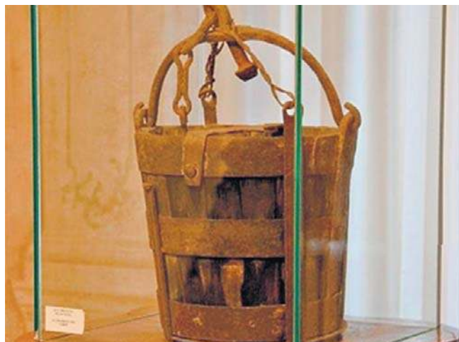
Zabezpieczone plastikiem wiadro można obecnie podziwiać w ratuszu w Modenie. Za darmo

Na premierze była cesarzowa Maria Teresa Walburga Amalia Christina von Habsburg, ale ponoć wyszła w połowie. Nic dziwnego - zastanawiała się pewnie, co zrobić z 84 tys. km kwadratów, które właśnie ukradła Polsce w czasie I rozbioru.