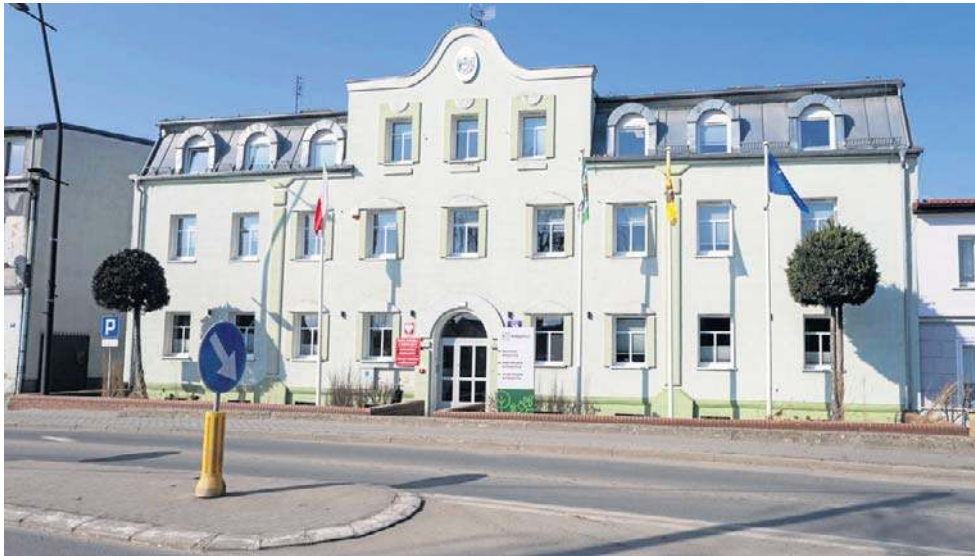
Na zdjęciu: Urząd Miejski w Kobylnicy