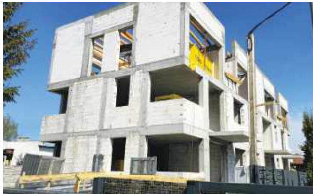
Blok przy ul. Sowińskiego, działka za numerem 36

Szanowna Redakcjo, Zwracam się z prośbą o pilną interwencję w sprawie inwestycji w miejscowości Legionowo przy ul. Sowińskiego, działka za numerem 36.