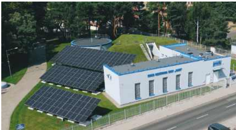
Instalacje fotowoltaiczne na SUW Piaski

Spółki przy ul. Kościuszki 16A, Stacji Uzdatniania Wody „Łajski”, Punktu Zlewnego „Łajski” oraz Stacji Uzdatniania Wody „Piaski”. Dzięki temu przedsiębiorstwo produkuje własną, czystą energię elektryczną,