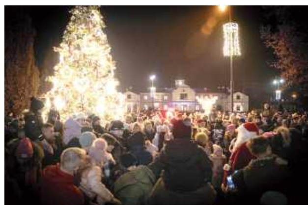
Tłumy na rynku w Łęcznej przyszły spotkać się ze św. Mikołajem i zobaczyć nową choinkę