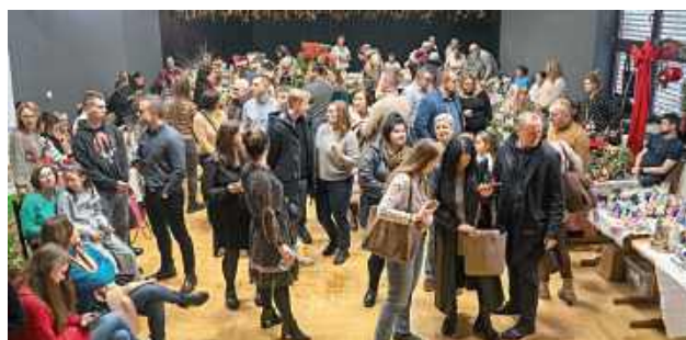
Jarmark Bożonarodzeniowy w Centrum Kultury w Łęcznej