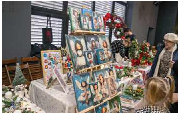
Jarmark Bożonarodzeniowy w Centrum Kultury w Łęcznej

Jarmark nie ograniczał się wyłącznie do handlu. W programie wydarzenia znalazły się także wy-