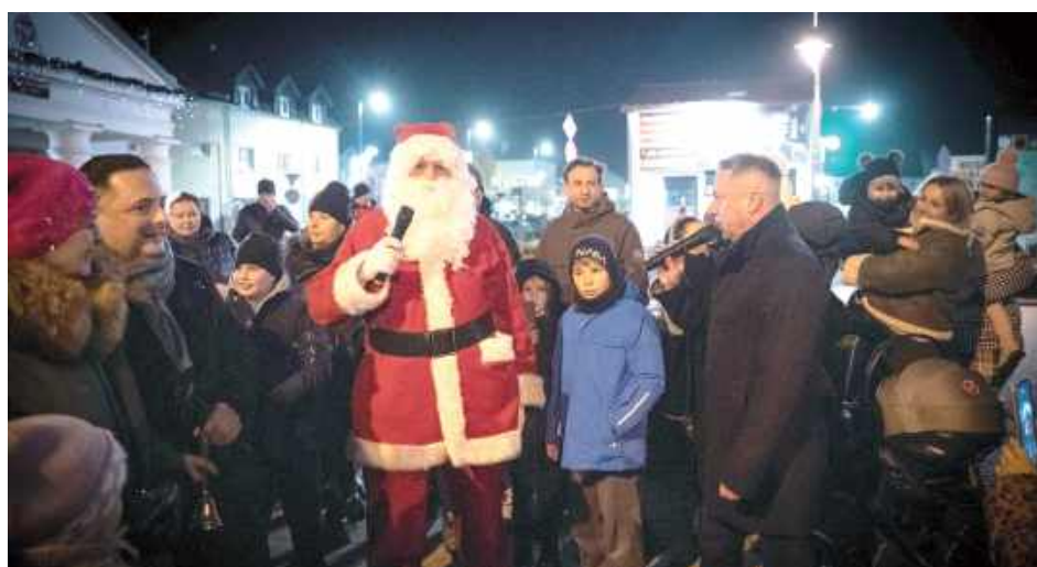
Tłumy na rynku w Łęcznej przyszły spotkać się ze św. Mikołajem i zobaczyć nową choinkę

Tłum głośno odliczał wraz z Mikołajem od 10 do 0, po czym nowa choinka rozświet-