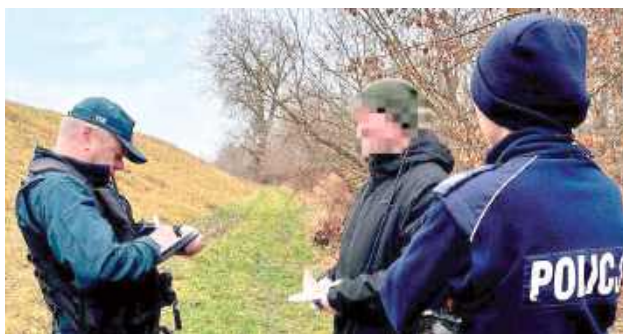
Oprócz czynności kontrolnych funkcjonariusze prowadzili rozmowy z osobami przebywającymi nad Wisłą, przypominając o zasadach bezpieczeństwa nad akwenami oraz o konieczności dbania o środowisko naturalne

POWIAT OPOLSKI: Akcja miała na celu sprawdzenie, czy osoby przebywające nad rzeką - w szczególności wędkarze - przestrzegają przepisów dotyczących parkowania pojazdów, ochrony terenów zielonych oraz zasad legalnego połowu ryb.