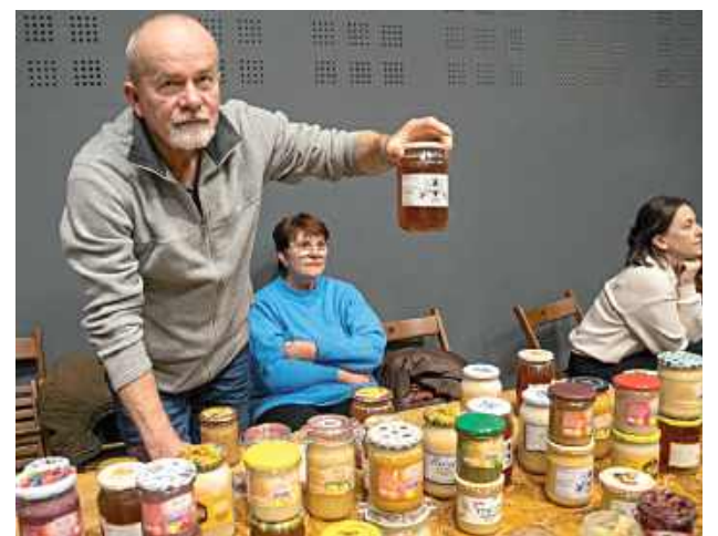
Jarmark Bożonarodzeniowy w Centrum Kultury w Łęcznej