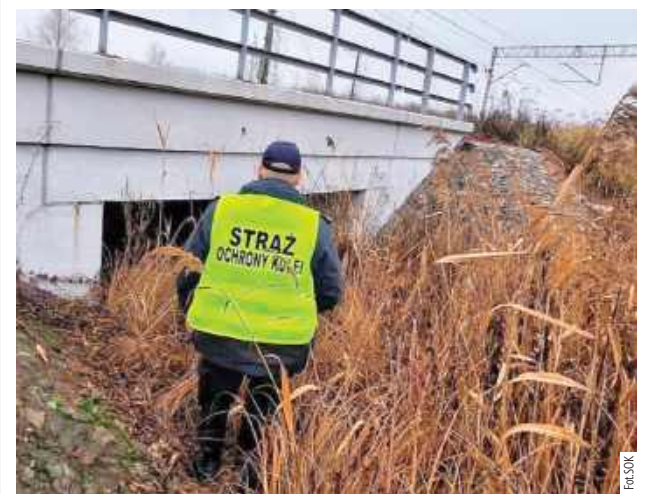
Zgłoszenie wskazywało na obecność osób postronnych w okolicach torów kolejowych, poruszających się samochodem osobowym

W piątek, 12 grudnia funkcjonariusze Straży Ochrony Kolei (SOK) ujęli dwóch mężczyzn na gorącym uczynku podczas nielegalnego opalania kabli przy torowisku w Chełmie. Mieszkańcy miasta, którzy usiłowali odzyskać miedź poprzez spalanie kabli, zostali schwytani dzięki fotoruśce zamontowanej w tym rejonie.