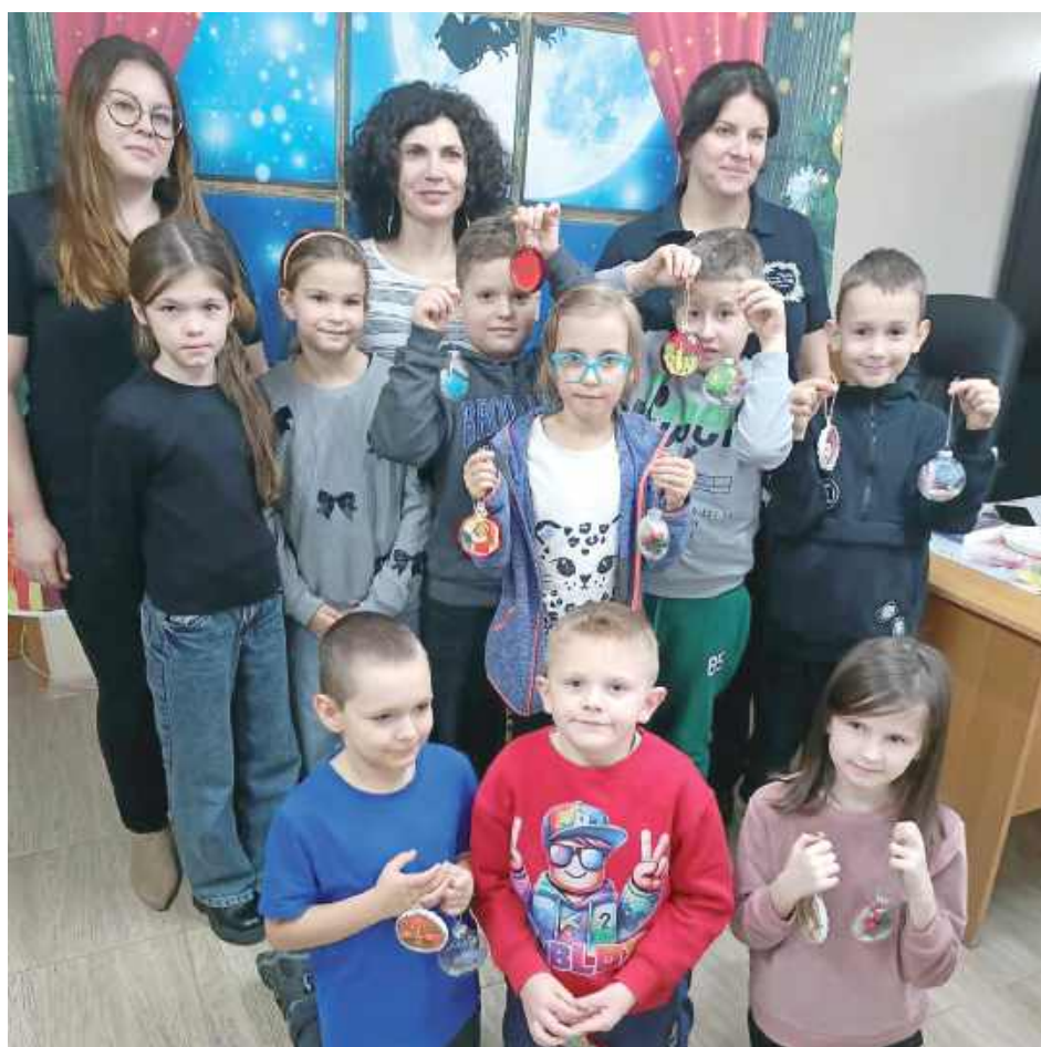
Świąteczna kreatywność w bibliotece w Cycowie

Młodzi uczestnicy z dużym zaangażowaniem tworzyli własne, barwne bombki choinkowe, rozwijając przy tym wyobraźnię i zdolności manualne. Ważnym elementem spotkania była również bajka „Dziewczynka z zapalkami” zaprezentowana w formie teatryku kamishibai, która wprowadziła dzieci w refleksyjny, przedświąteczny nastrój.