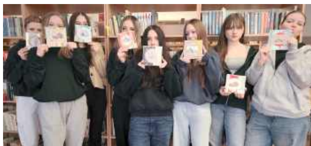
Fot. Zespół Szkół im. Króla Kazimierza Jagiellończyka w Łęcznej