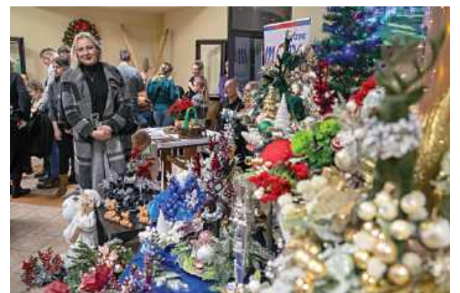
Jarmark Bożonarodzeniowy w Centrum Kultury w Łęcznej