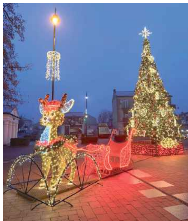
Świąteczna choinka na rynku w Łęcznej