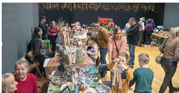
Jarmark Bożonarodzeniowy w Centrum Kultury w Łęcznej