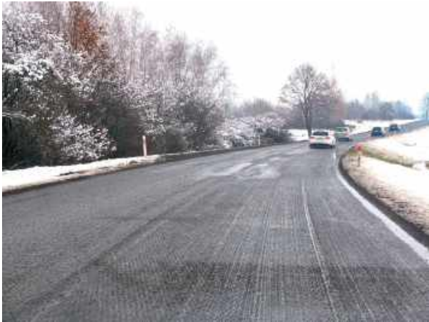
Remont drogi krajowej 82 tuż za Łęczną w kierunku Puchaczowa

Choć droga krajowa nr 82 na odcinku Łęczna - Puchaczów była remontowana stosunkowo niedawno, drogowcy ponownie weszli na plac budowy. Wielu kierowców pytało o powód prac. Dotarliśmy do oficjalnej odpowiedzi Generalnej Dyrekcji Dróg Krajowych i Autostrad, która rozwiewa wątpliwości.