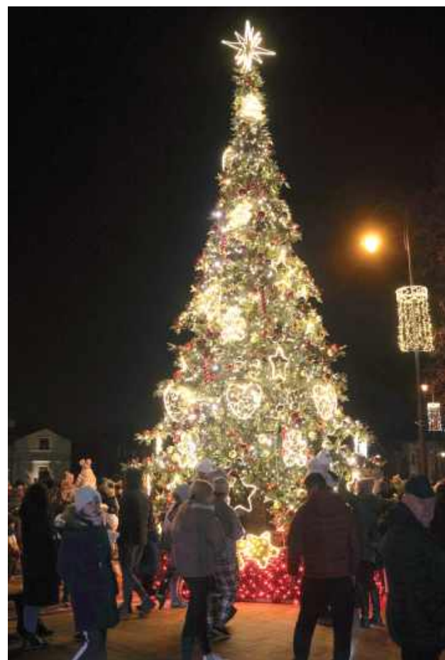
Świąteczna choinka na rynku w Łęcznej