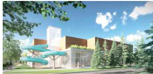
Wizualizacja aquaparku w Łęcznej

powietrzny, fontannę podwodną oraz różne typy masażu karku - zarówno wąskie, jak i szerokie. W strefie tej znajdzie się również ścianka wspinaczkowa nad wodą oraz przestrzeń relaksacyjna z dużymi, wielosobowymi jacuzzi. Drugą co do wielkości atrakcją będzie wodny plac zabaw przeznaczony dla dzieci. Wśród zaprojektowanych urządzeń znalazły się: zjeżdżalnia typu anakonda, zjeżdżalnia rynna, grzybek wodny, armatki wodne oraz kolorowe wodne zwierzątka. Dodatkowo na terenie parteru znajdzie się duża zjeżdżalnia tunelowa/rurowa z osobną klatką schodową, sa-