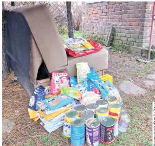
Pomagają tym, którzy pomagają braciom mniejszym

To były Mikołajki inne niż wszystkie, bo pełne prawdziwego dobra. Wolontariuszki Stowarzyszenia Milejów Dla Zwierząt odwiedziły osiem rodzin, które - mimo skromnych warunków - z ogromną troską dbają o swoich czworonożnych podopiecznych. Jak podkreślają członkinie stowarzyszenia, te spotkania po raz kolejny pokazały, że dobro nie zależy od zasobów materialnych, lecz od serca i wrażliwości. Pomoc trafiła tam, gdzie była naprawdę potrzebna, a radość właścicieli i szczęście zwierząt