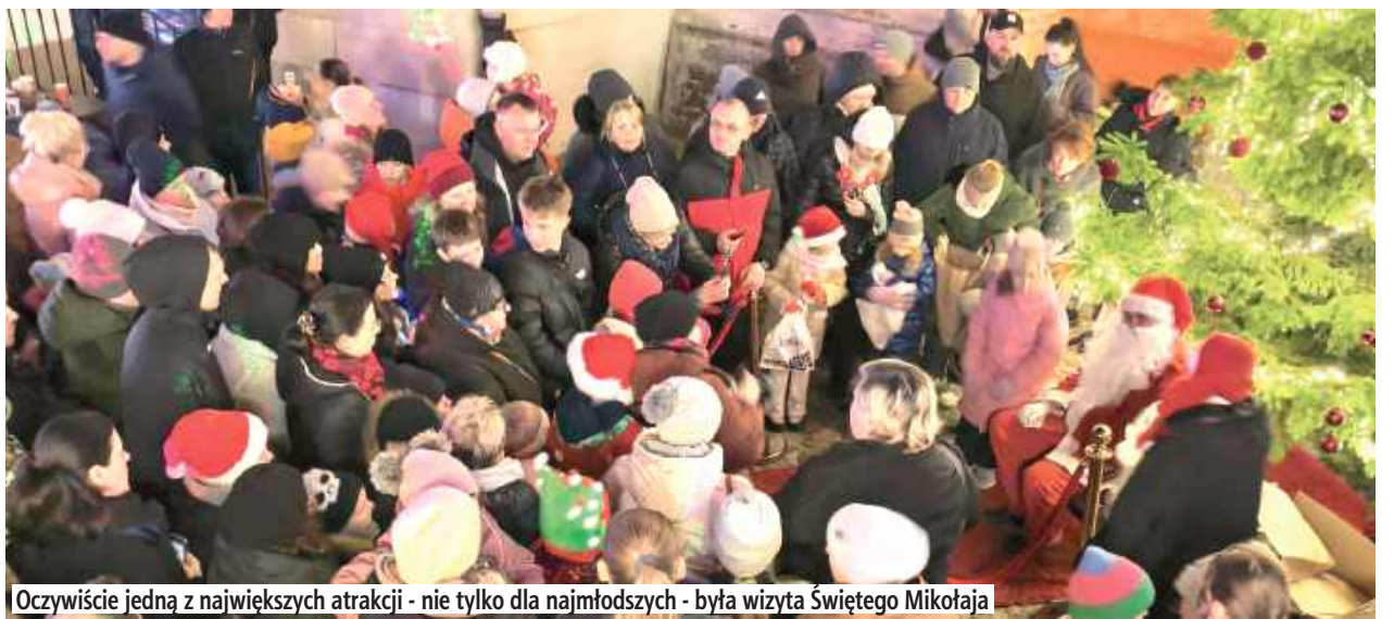
Oczywiście jedną z największych atrakcji - nie tylko dla najmłodszych - była wizyta Świętego Mikołaja