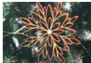
Tradycyjne, nowoczesne - wysyp gwiazdek na milejowskiej choince