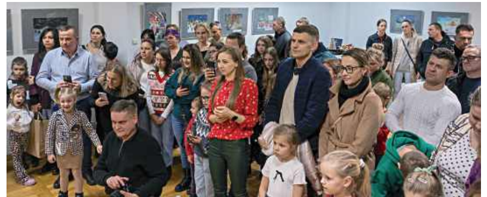
Jarmark Bożonarodzeniowy w Centrum Kultury w Łęcznej

stępy wokalne dzieci i młodzieży, które wprowadziły uczestników w świąteczny nastrój. Nie zabrakło również wizyty Świętego Mikołaja, który spotykał się z najmłodszymi, pozował do zdjęć i rozdawał drobne upominki.