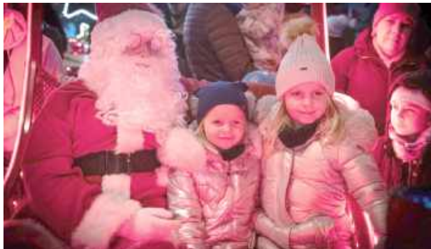
Tłumy na rynku w Łęcznej przyszły spotkać się ze św. Mikołajem i zobaczyć nową choinkę

Atmosfera była wyjątkowa - pełna uśmiechu, ciepła i radosnego wyczekiwania na