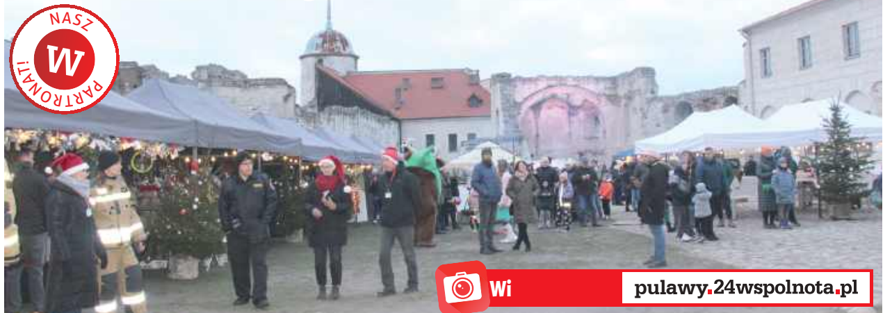
Jarmark Bożonarodzeniowy na zamku to wydarzenie, które na stałe wpisało się w kalendarz najpiękniejszych świątecznych spotkań w regionie