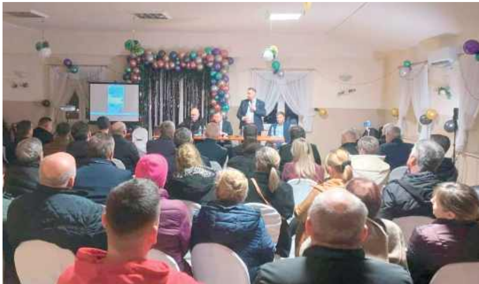
W środę, 10 grudnia w Ratoszynie sala wypełniła się po brzegi mieszkańcami zaniepokojonymi planami budowy 290-metrowych wiatraków oraz dwóch biogazowni

Burza w Chodlu! Gorące spotkanie w Ratoszynie z udziałem polityków, ekspertów i oburzonych mieszkańców. Gmina stała się areną jednego z najostrejszych społecznych sporów ostatnich lat. Mieszkańcy boją się smrodu, hałasu i degradacji środowiska, władze tłumaczą się procedurami, a inwestorzy czekają.