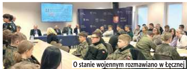
O stanie wojennym rozmawiano w Łęcznej

W przeddzień 44. rocznicy wprowadzenia stanu wojennego w Polsce w Łęcznej odbyło się spotkanie, które stało się ważną lekcją historii dla młodego pokolenia.