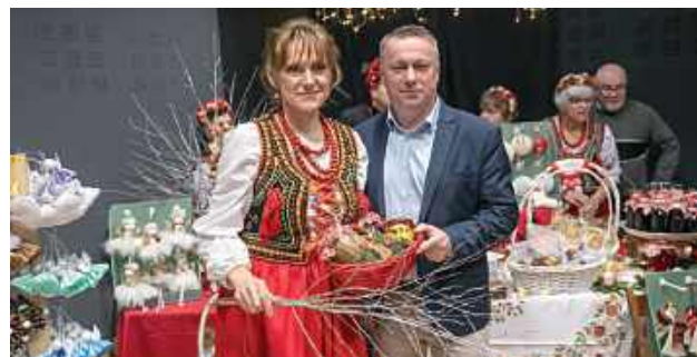
Jarmark Bożonarodzeniowy w Centrum Kultury w Łęcznej