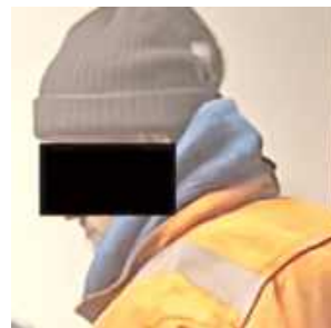
58-latek wykręcał napadniętej kobiecie palce, by ta puściła pasek torebki, którą chciał jej wyrwać. A wszystko działo się w biały dzień

- Policjanci przedstawili 58-latkowi zarzut usiłowania dokonania rozbój na 74-letniej mieszkance gminy Markuszów - informuje nadkom. Ewa Rejn-Kozak, rzecznik prasowy Komendy Powiatowej Policji w Puławach. Sąd go aresztował.