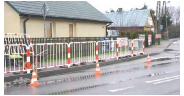
Montaż wykonano zgodnie z decyzją władz gminy, które uznały zabezpieczenie tego odcinka za konieczne w kontekście poprawy bezpieczeństwa ruchu drogowego

Mieszkańcy jednak proszą gminę o więcej. W odpowiedzi pod postem nt. barierki mieszkańcy piszą w komentarzach m.in. „Jeszcze latarni trzeba dostawić”, czy „Wymieńcie te przy straży, bo naprawdę brzydko to wygląda”. Rzeczywiście, temat latarni wpłynął jakiś czas do naszej redakcji. Jednak brak potwierdzonych informacji ze strony gminy nt. ewentualnych inwestycji w tym zakresie.