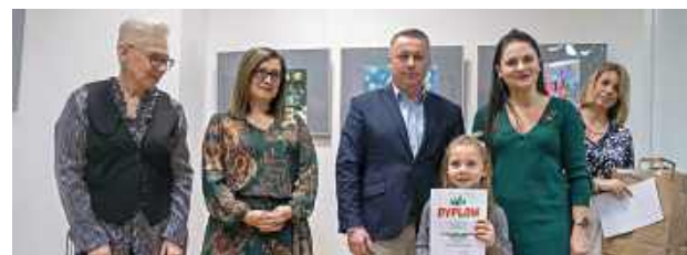
Jarmark Bożonarodzeniowy w Centrum Kultury w Łęcznej