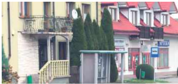
Do zdarzenia doszło na tym przystanku w centrum miasta, w pobliżu apteki i innych punktów handlowo-usługowych

58-latek wykręcał starszej kobiecie palce, chcąc wyrwać jej torebkę. Plany pokrzyżowała mu przypadkowa osoba, która akurat nadeszła i usłyszała krzyki napadniętej staruszki.