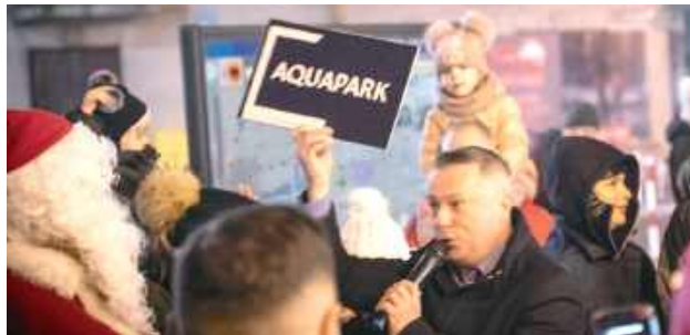
Święty Mikołaj przyniósł burmistrzowi dobre wiadomości

Tymczasem dokumentacja projektowa pokazuje, że planowany Aquapark, który powstanie przy Szkole Podstawowej nr 2, ma być jedną z najbardziej nowoczesnych i wszechstronnych tego typu realizacji w Polsce. Dwukondygnacyjny obiekt w nowoczesnej bryle będzie w pełni przystosowany do osób z niepełnosprawnościami -