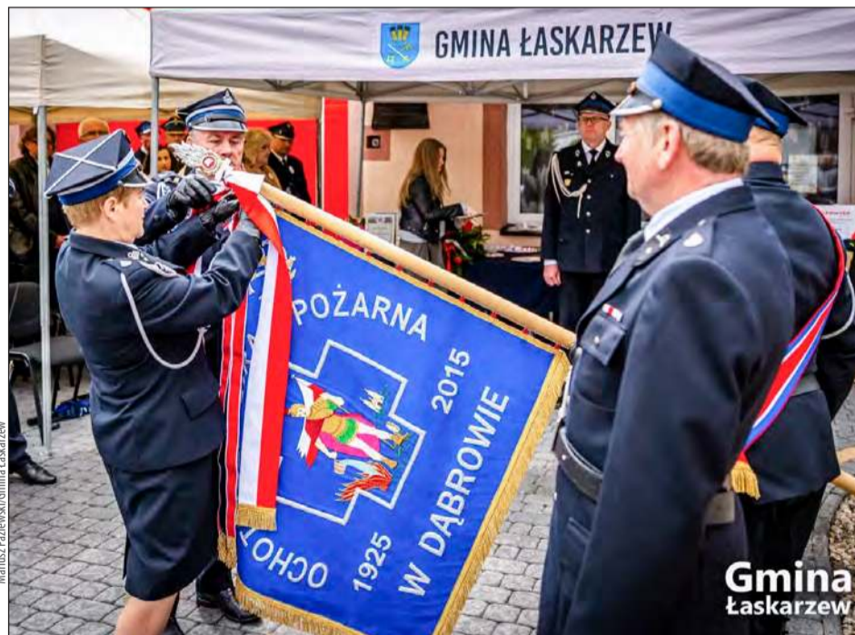
❖ Zarząd Główny ZOSP RP nadał Ochotniczej Straży Pożarnej w Dąbrowie Złoty Znak Związku OSP RP