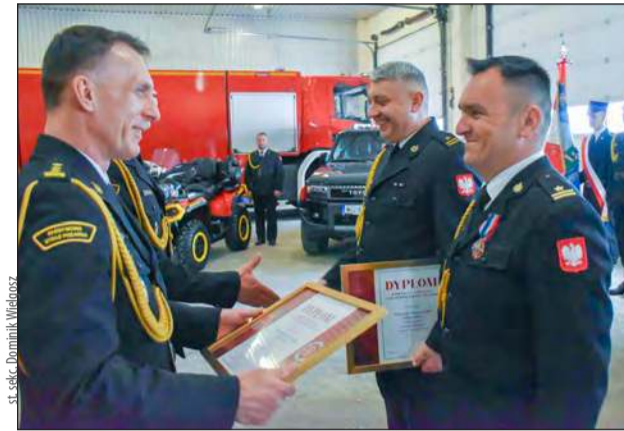
» Z okazji 30-lecia KSRG komendant główny PSP wyróżnił pamiątkowymi dyplomami Komendę Powiatową, Jednostkę Ratowniczo-Gaśniczą oraz jednostki, które działają w strukturach KSRG