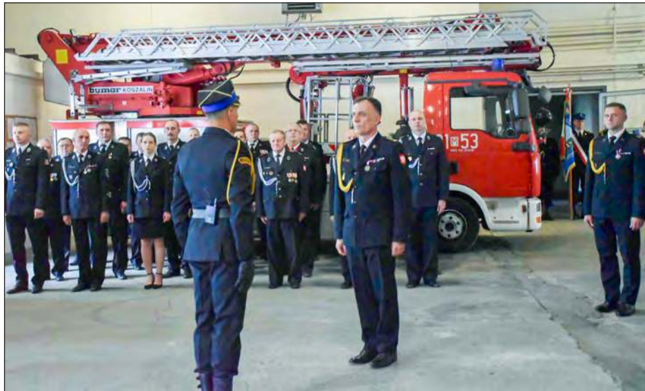
» Siedmiu strażaków z Komendy Powiatowej Państwowej Straży Pożarnej w Garwolinie otrzymało wyższe stopnie służbowe podczas uroczystych obchodów Dnia Strażaka

Uroczystość rozpoczęła się złożeniem meldunku zastępcy mazowieckiego komendanta wojewódzkiego PSP st. bryg.