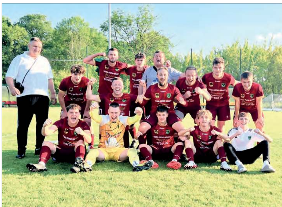
Orzeł Unin wiosną więcej remisuje niż wygrywa. Stosunek zwycięstw do remisów wynosi 4 do 6

Wszystkie nasze zespoły zajmują miejsca w drugiej połowie tabeli siedleckiej okręgówki. Dla Orła Unin był to dziesiąty mecz z rzędu bez porażki. Podopieczni Rafała Głąbickiego wiosną zremisowali sześciokrotnie, w tym wszystkie mecze derbowe z ekipami powiatu garwolińskiego, i cztery razy wygrywali.