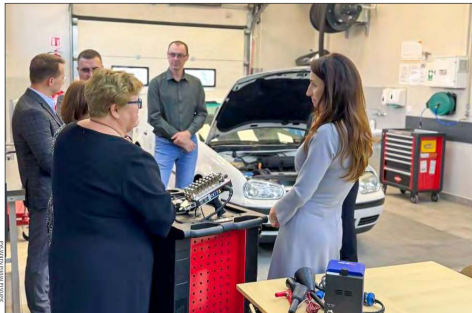
❖ Łączna kwota dofinansowania, wynosząca ponad 5,9 mln zł, z czego 1 042 549 zł pochodzi ze środków własnych powiatu garwolińskiego, pozwoliła na zakup zaawansowanego sprzętu

Investycja objęła wszystkie cztery placówki prowadzące kształcenie zawodowe na terenie naszego powiatu: