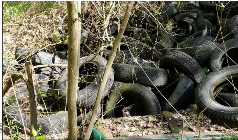
■ Mieszkaniec gminy Parysów natrafił na nielegalne składowisko opon samochodowych

M iędzy Choinami a Słupem, przy tak zwanym Gościńcu, czyli drodze z Parysowa do Garwolina, odkryto nielegalne wysypisko opon. Na ogromną ilość porzuconych odpadów natrafił mieszkaniec gminy Parysów. Opony leżą między torami a drogą, tuż przy linii energetycznej. - Opon jest bardzo dużo. Tylko z samochodów osobowych. Może być ich nawet około 200 - mówi zaniepokojony mieszkaniec. Dodaje, że trudno sobie wyobrazić, by tyle opon pochodziło od zwykłego mieszkańca, przypuszczając, że odpady wyrzuca ktoś, kto zawo-