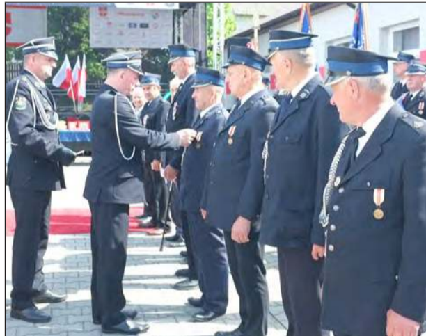
Z okazji jubileuszu odznaczenia przyjęło kilkudziesięciu strażaków