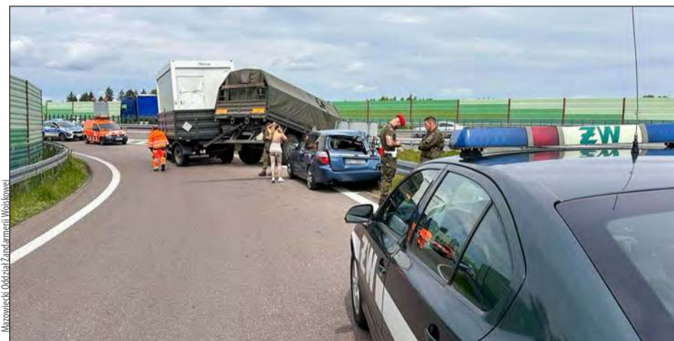
» Kobieta kierująca subaru uderzyła w wojskowego jelcza na drodze S17, na wysokości miejscowości Sulbiny

Kobieta kierująca subaru uderzyła w wojskowego jelcza na drodze S17, na wysokości miejscowości Sulbiny. Na miejscu sprawdzono trzeźwość uczestników kolizji