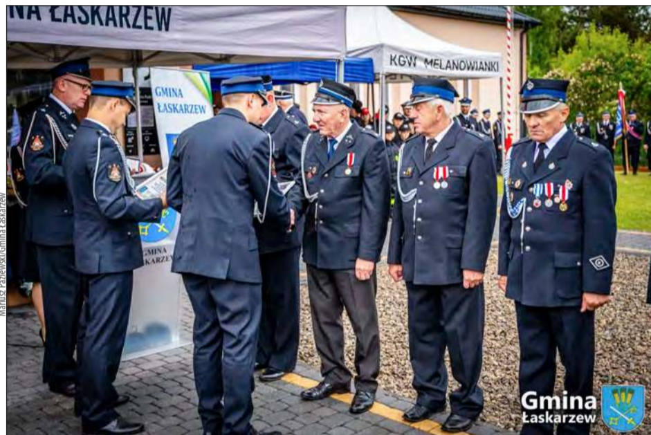
❖ Jubileusz był okazją do podziękowania strażakom za lata ofiarnej służby