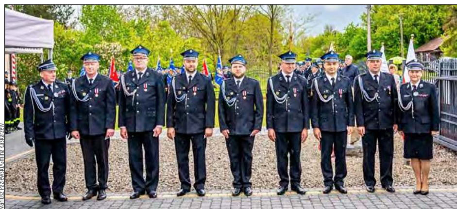
❖ Głównym punktem wydarzenia było wręczenie odznaczeń i medali w podziękowaniu za długoletnią i ofiarną służbę