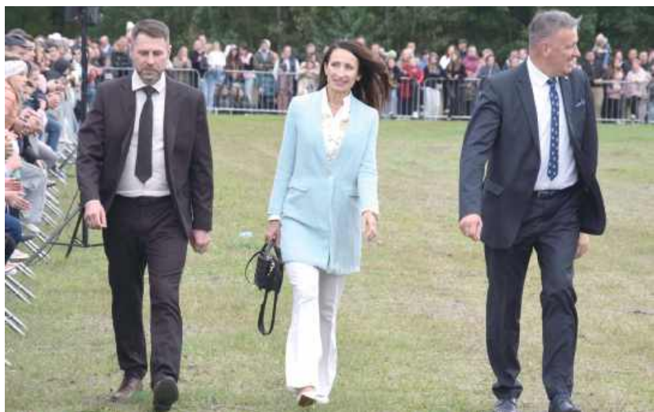
Wydarzenie przyciągnęło przedstawicieli władz samorządowych i państwowych