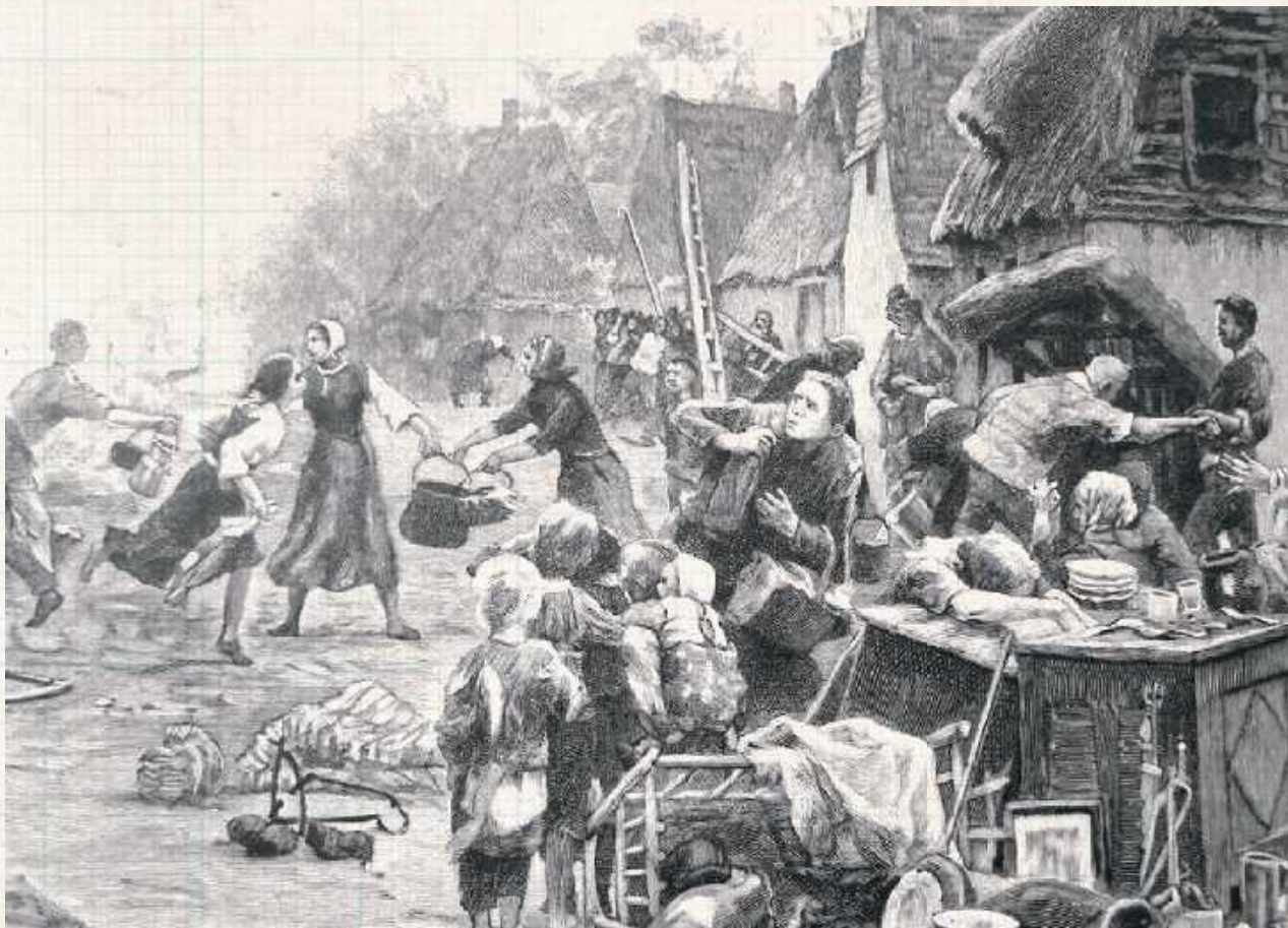
Tak mógł wyglądać pożar Parysowa w latach 1887 i 1888. Pożar wtrącił wielu mieszkańców w nędzę. Znaleźli się wprawdzie dobrzy ludzie, którzy pospieszyli z pomocą, lecz to wszystko było za mało. 30 września 1888 roku, kiedy straty po pożarze nie zostały jeszcze usunięte, Parysów nawiedził kolejny żywioł. Ogień strawił resztę zabudowy oraz te domy, które udało się odbudować (zastawie-netau.net/powiat-lukowski-gore/)

Fragment tekstu: „Ocalał jednak kościół, który był niedawno odnawiany. Zgorzały 142 domy. Nie obeszło się też i bez nieszczęśliwych wypadków z ludźmi. Spaliło się jedno niemowlę dopiero co przybyłe na świat; matka tego biedactwa zaledwie zdołała sama wyczołgać się z płonącego domu. Spalił się także jeden żyd, który wywoził poza miasto rzeczy wyratowane z pożaru. Kilka razy udało mu się obrócić szczęśliwie, więc i ostatni raz zajął śmiało w ulicę, którą już ogień ogarnął, gdy wtem płomienie wionęły na niego, koń padł, a na nim zapaliło się odzienie. Zeskoczył z palącej się już także