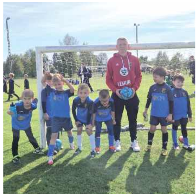
Jedni z najmłodszych reprezentantów AP Wilga Garwolin rywalizowali na turnieju w Karczewie, gdzie pokazali się ze świetnej strony

Jedni z najmłodszych reprezentantów AP Wilga Garwolin rywalizowali na turnieju w Karczewie, gdzie pokazali się ze świetnej strony.