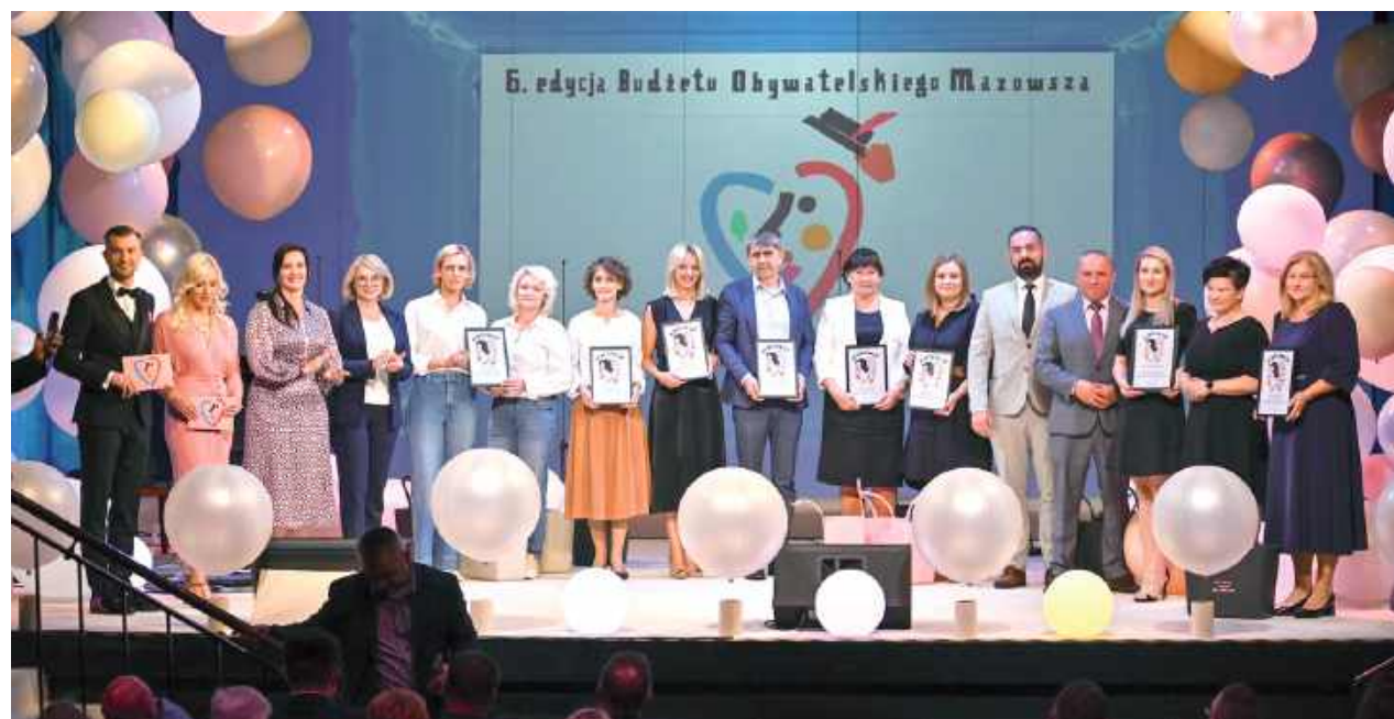
Dzięki oddanym głosom projekt „Z kulturą do ludzi” Centrum Sportu i Kultury w Garwolinie otrzyma dofinansowanie ze środków Budżetu Obywatelskiego Mazowsza

Projekt „Z kulturą do ludzi” ma na celu wyjście z ofertą kulturalną na stronę mieszkańców, przeniesie-