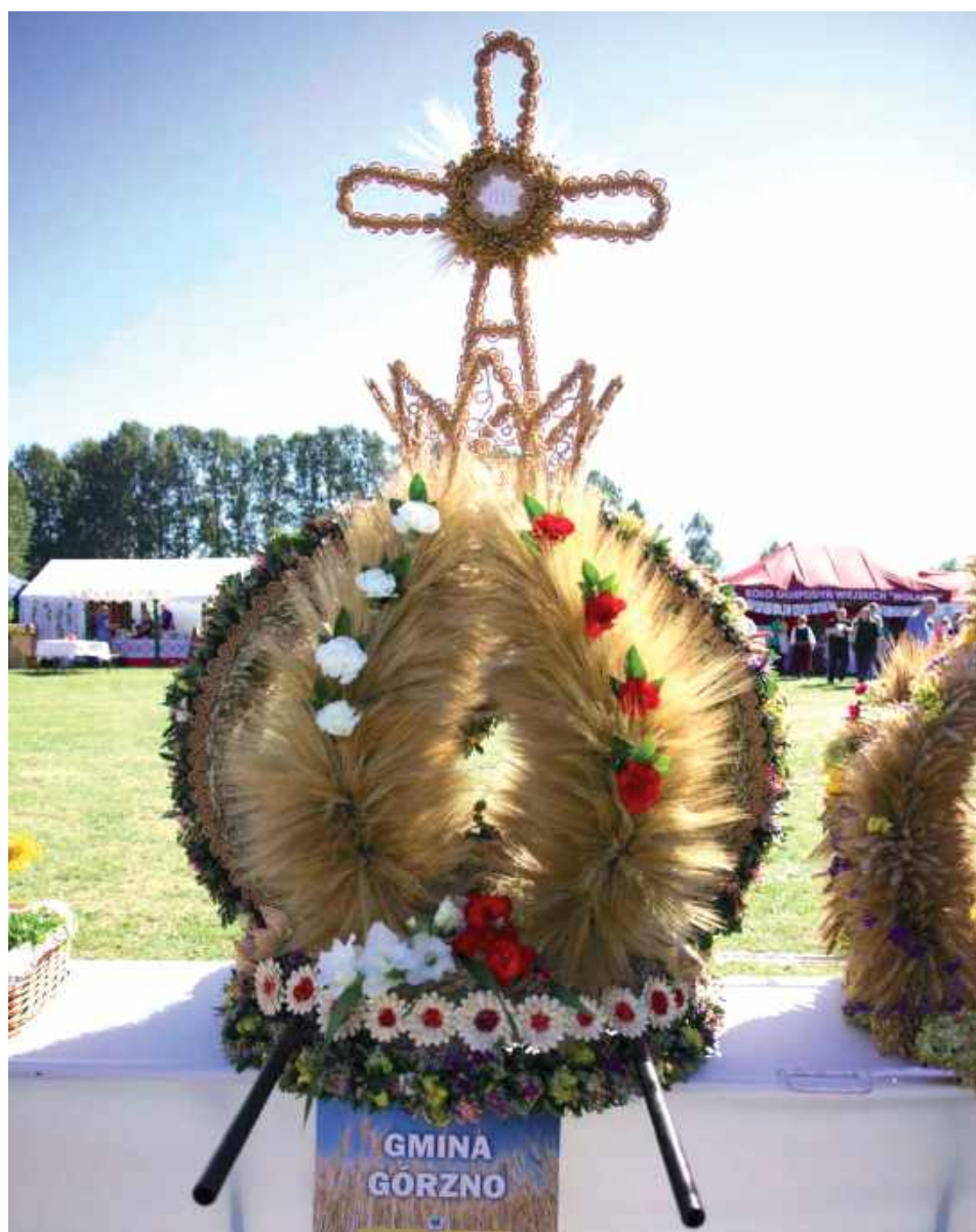
Wieniec dożynkowy sołectwa Łąki