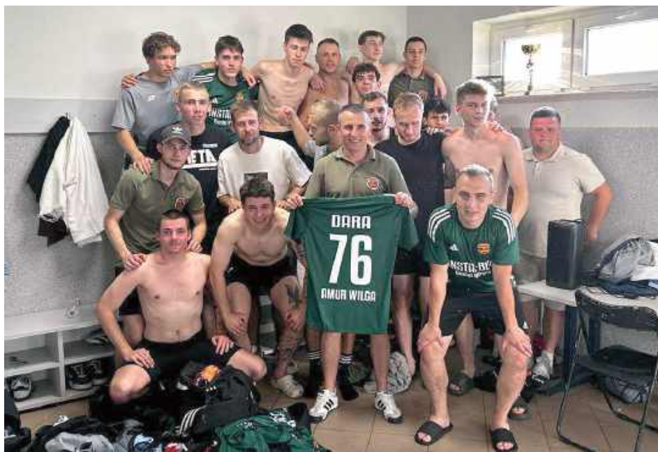
Zespół Amura pokazał prawdziwy charakter. Starty odrobił już do przerwy i pokonał rywali aż 4:1