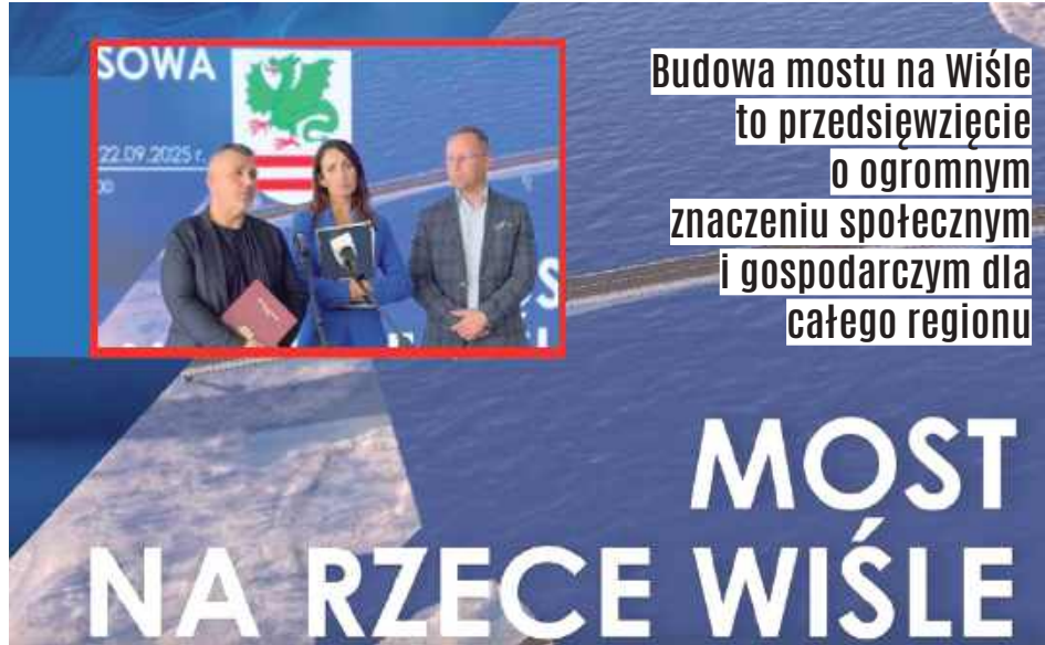
Uzgodnione stanowisko pozwala pogodzić rozwój infrastruktury z troską o środowisko naturalne

Zmiany w harmonogramie finansowym są nieuniknione, co oznacza przesunięcie terminów realizacji. Mimo to, dzięki kon-