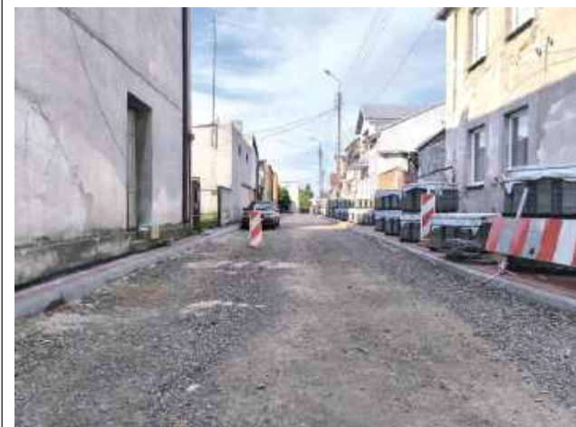
Niektóre drogi pilnie wymagały remontu

Miasto Łaskarzew realizuje kolejne inwestycje infrastrukturalne, obejmujące przebudowę dróg oraz modernizację kompleksu sportowego „Moje Boisko - Orlik 2012” przy Zespole Szkół nr 2 przy ul. Kolejowej.