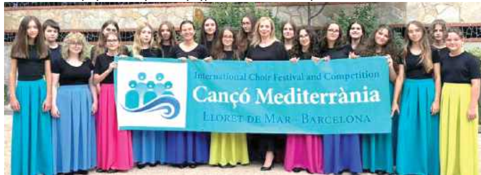
Udział w międzynarodowym festiwalu to dla dziewcząt bardzo cenne doświadczenie