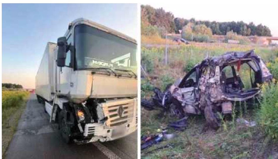
Dramat rozegrał się 15 sierpnia

była całkowicie zablokowana. Trwały szczegółowe czynności mające ustalić przyczynę i przebieg tego tragicznego zdarzenia - przekazała podkomisarz Małgorzata Pychner z Komendy Powiatowej Policji w Garwolinie.