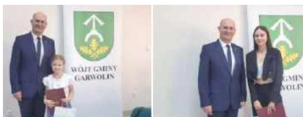
Spotkanie było wyrazem uznania dla młodych talentów

angażowanie młodych mieszkańców, nagroził stypendiami uczniów, którzy wyróżnili się w następujących kategoriach: