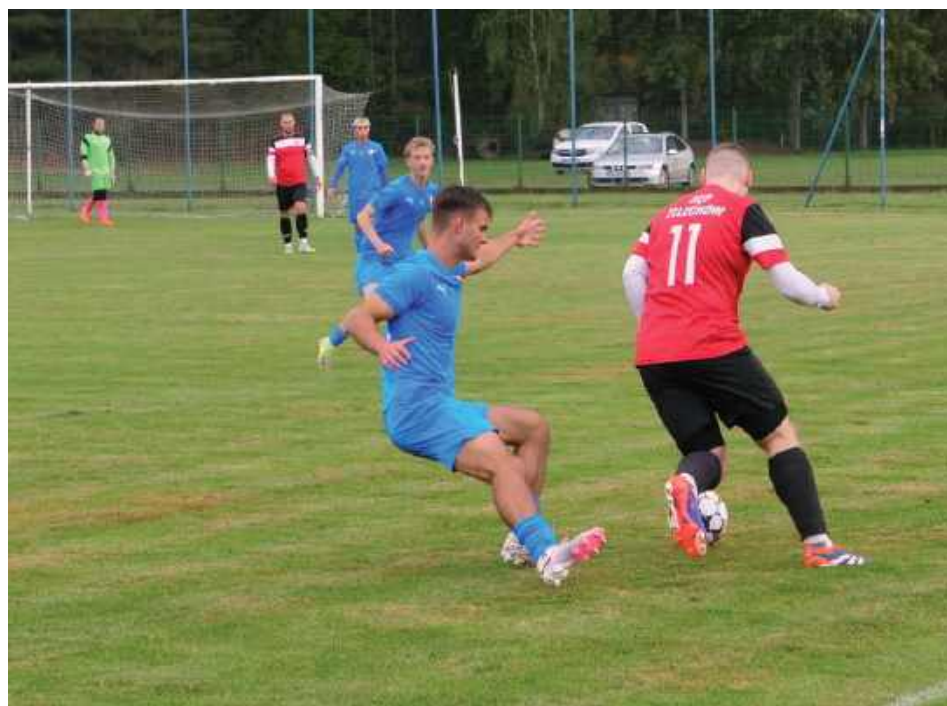
Trzy czerwone kartki nic nie zmieniły. Sęp Żelechów uznał wyższość rezerw Pogoni Siedlce, przegrywając 4:7