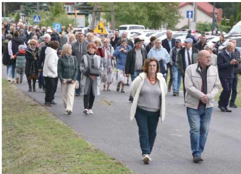
Po nabożeństwie uczestnicy święta przeszli spod Sanktuarium na pobliskie błonia, gdzie rozpoczęły się pokazy konne