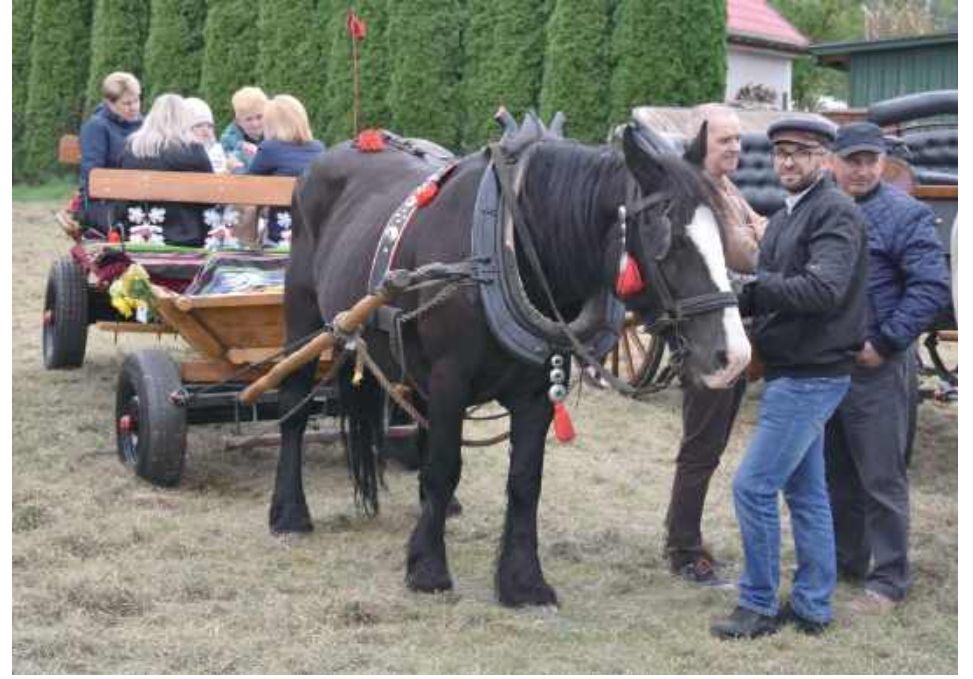
Po nabożeństwie rozpoczęła się prezentacja bryczek i przejazd na błonia