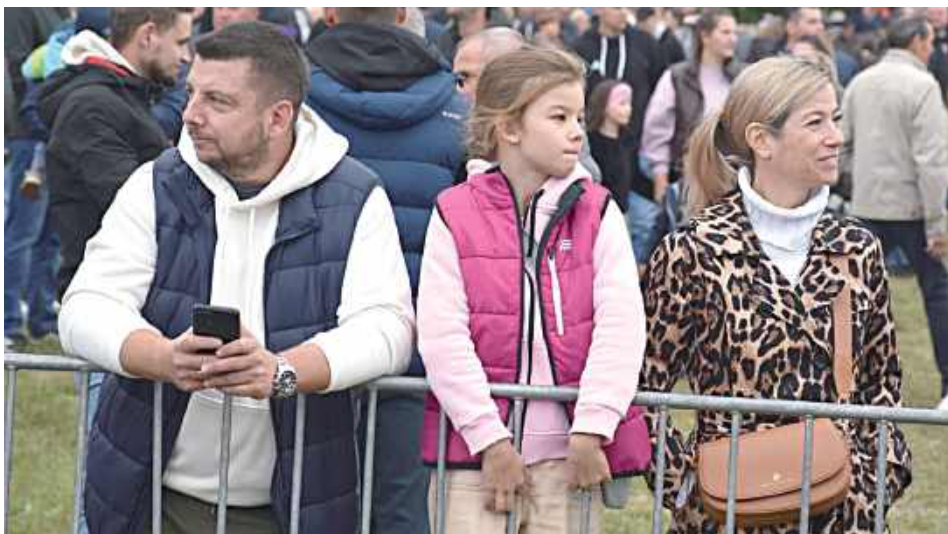
Obchody XIII Regionalnego Święta Hodowców Koni połączone zostały z uroczystościami odpustowymi