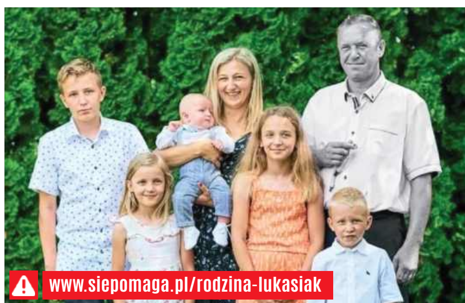
Pomóżmy rodzinie po stracie ukochanego taty i męża