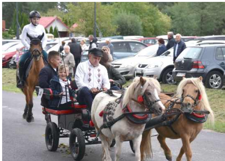
XIII Regionalne Święto Hodowców Koni przyciągnęło młodszych i starszych miłośników zwierząt