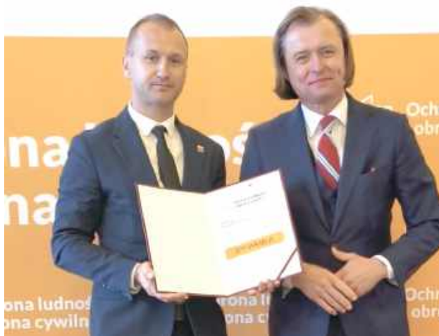
W środę, 24 września, w Mazowieckim Urzędzie Wojewódzkim w Warszawie odbyło się uroczyste podpisanie umów

- Pierwsze umowy z powiatami to ponad 56 mln zł na realizację przez Państwową Straż Pożarną zadań wynikających z Programu Ochrony Ludności i Obrony Cywilnej. Dlaczego zaczynamy od PSP? To straż pożarna jest głównym partnerem dla samorządów