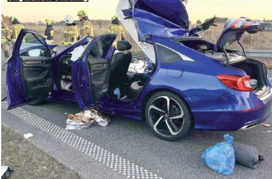
Strażacy musieli użyć narzędzi hydraulicznych, by wydobyć jedną z podróżujących osób

lin wynika, że hondą podróżowali obywatele Ukrainy. O godz. 5.59 kierowca zasnął za kierownicą i wjechał w tył naczepy ciężarówki.