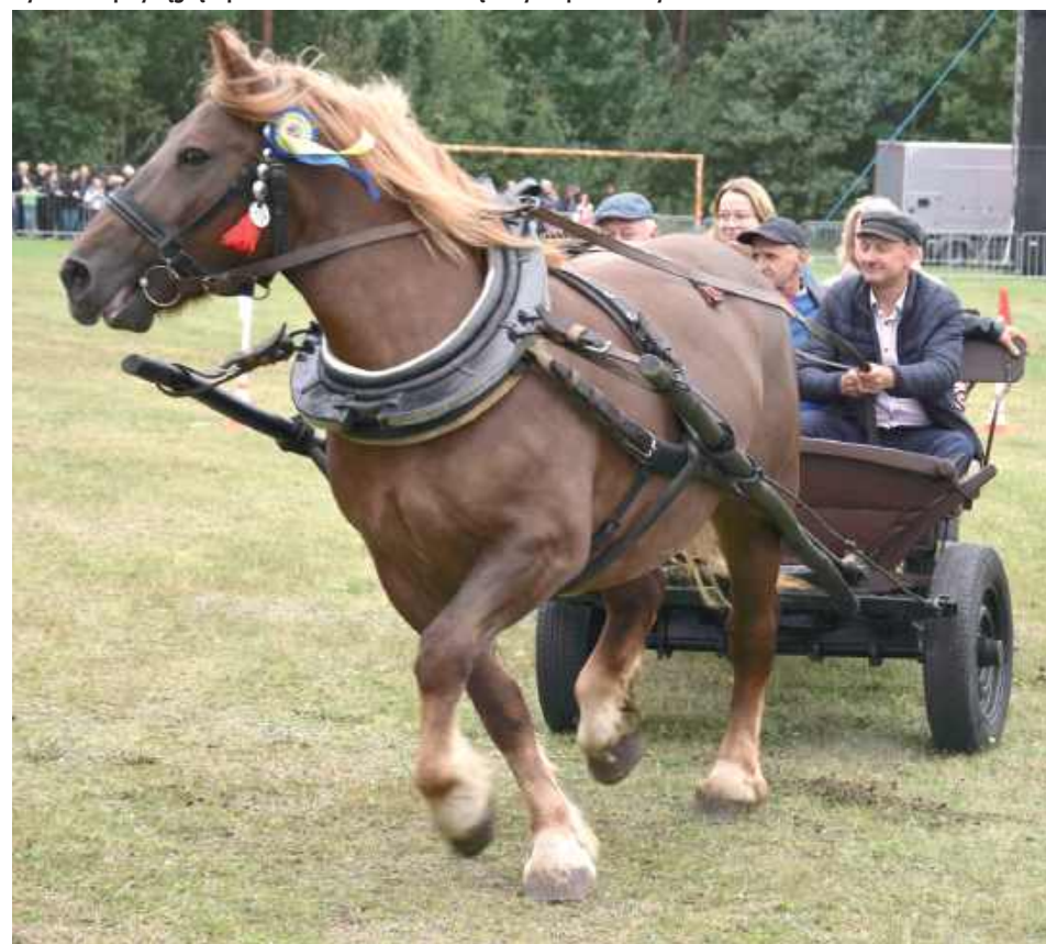
Ważnym punktem programu był wyścig o Puchar Wójta Gminy Garwolin, w czasie którego uczestnicy zmagali się do pokonania specjalnie przygotowaną trasę