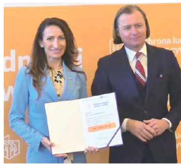
W środę, 24 września, w Mazowieckim Urzędzie Wojewódzkim w Warszawie odbyło się uroczyste podpisanie umów

Powiat Garwoliński otrzymał środki w wysokości 547 800 zł na Ochronę Ludności i Obronę Cywilną.