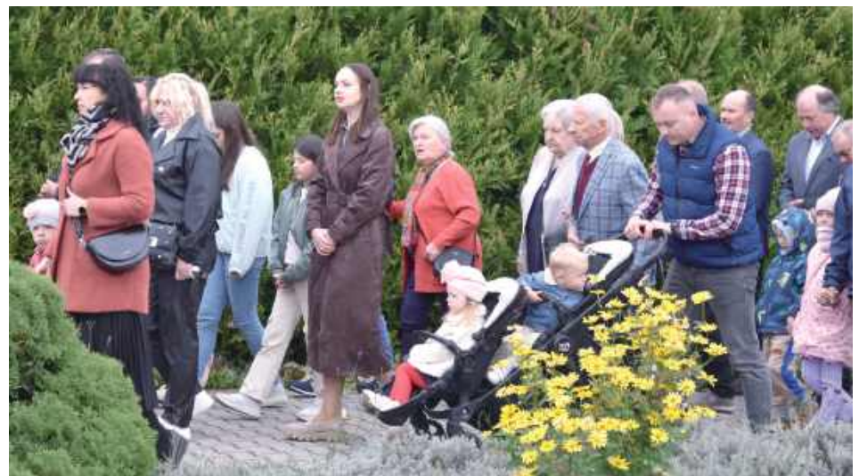
Wierni podążający w procesji wokół Sanktuarium Matki Bożej Fatimskiej w Górkach