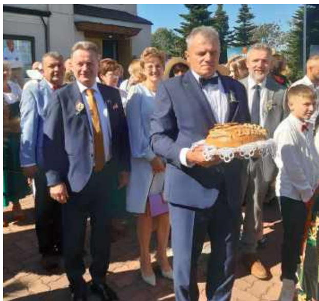
Reprezentacja samorządu gminy Górzno uczestniczyła w Powiatowo-Gminnym Święcie Plonów w Miętmem

W podziękowaniu za tegoroczne plony członkowie sołectwa Łąki zaprezentowa-