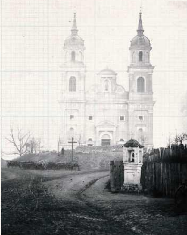
Kościół parafialny pw. Zwiastowania NMP w Żelechowie - z prawej strony kapliczka Świętego Jana Nepomucena. Rok 1894 („Żelechów na starej fotografii. Ocalić od zapomnienia”, Michał Sztelmach. Żelechów 2012)

Autor relacji był mieszkańcem Żelechowa, podpisanym jako „Swój”. Piętnował drobnomieszczańskie zwyczaje współbraci, ich zacofanie, brak jakiegokolwiek