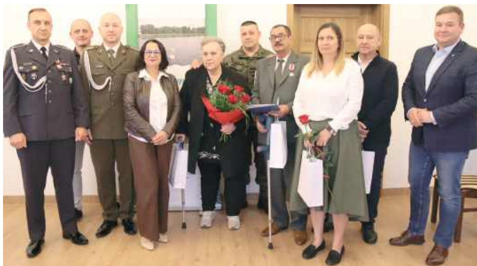
Rodzicom podczas wydarzenia towarzyszyła czwórka dzieci pełniąca służbę w szeregach Wojska Polskiego