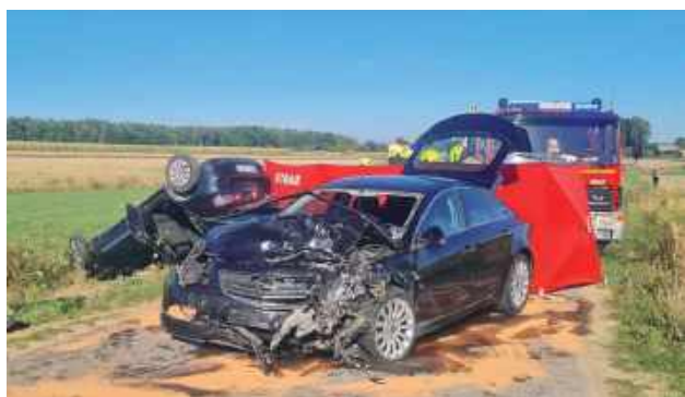
Trwają czynności dotyczące ustalenia co do okoliczności tego tragicznego zdarzenia

Zeszłotygodniowy wypadek w Kaleniu Drugim (gm. Sobolew) zakończył się tragicznie. Śmierć na miejscu poniosła 50-letnia mieszkanka gminy Sobolew, która kierowała jednym z aut. Co dokładnie się wydarzyło?