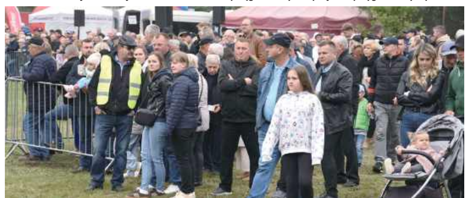
Impreza przyciągnęła hodowców koni oraz miłośników tych szlachetnych - zakorzenionych w polskiej tradycji - zwierząt