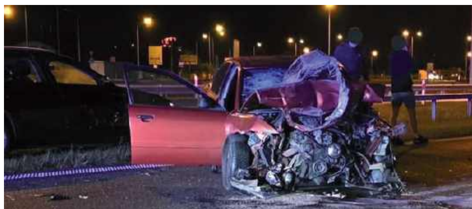
Kierowca stracił panowanie nad pojazdem

- Zgłoszenie do służb wpłynęło o godzinie 2:50. Kierujący pojazdem marki audi nie dostosował prędkości do warunków ruchu, w wyniku