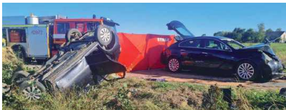
Kierujący opel był trzeźwy. Trafił do szpitala

- Na skrzyżowaniu równorzędnych dróg gminnych doszło do zdarzenia pojazdu opel kierowanego przez mężczyznę z gminy Sobolew (lat 42) i dojeżdżającego z prawej strony pojazdu seat kierowanego przez 50-letnią mieszkankę