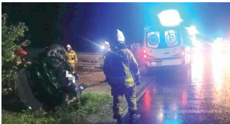
Auto wypadło z drogi