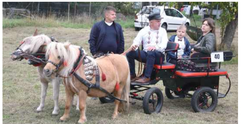
O godzinie 12 odprawiona została uroczysta msza święta polowa w intencji hodowców koni przed Sanktuarium Matki Bożej Fatimskiej w Górkach - konie w zaprzęgach stały na specjalnie przygotowanym placu