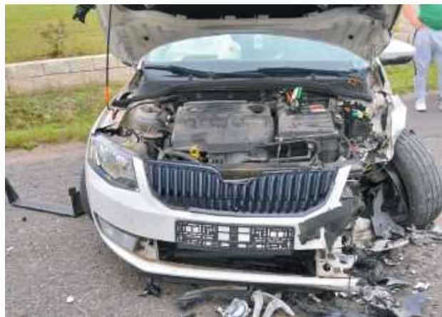
W wyniku zdarzenia lekkich obrażeń doznała 14-letnia pasażerka pojazdu peugeot, którą przewieziono do szpitala dziecięcego w Warszawie

pasażerka pojazdu peugeot, którą przewieziono do szpitala dziecięcego w Warszawie. Obrażenia odnieśli też kierowcy - przewieziono ich do szpitala w Garwolinie - poinformował mł. asp. Michał Paziewski z Wydziału Prewencji Komen-