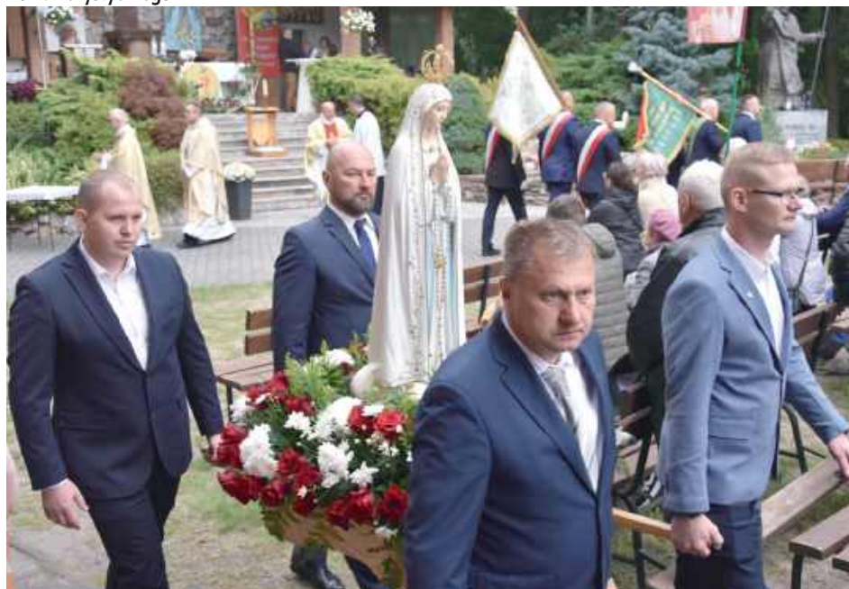
Figura Matki Boskiej Fatimskiej podążająca w procesji wokół Sanktuarium