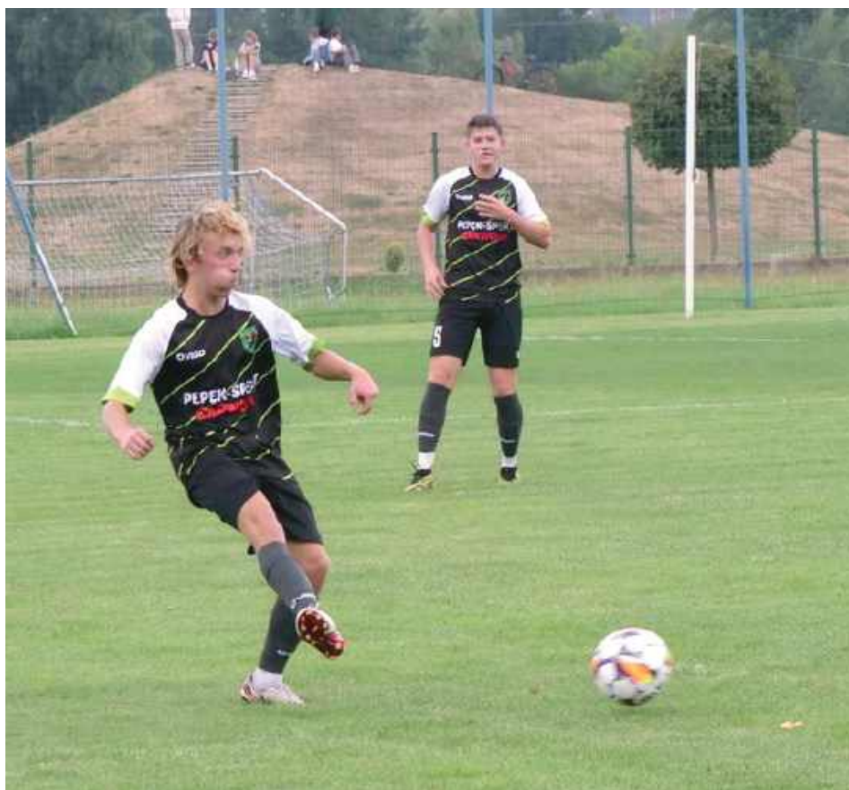
Dwie różne połowy w wykonaniu Orła Unin sprawiły, że tylko zremisował z ŁDK Łosice 1:1