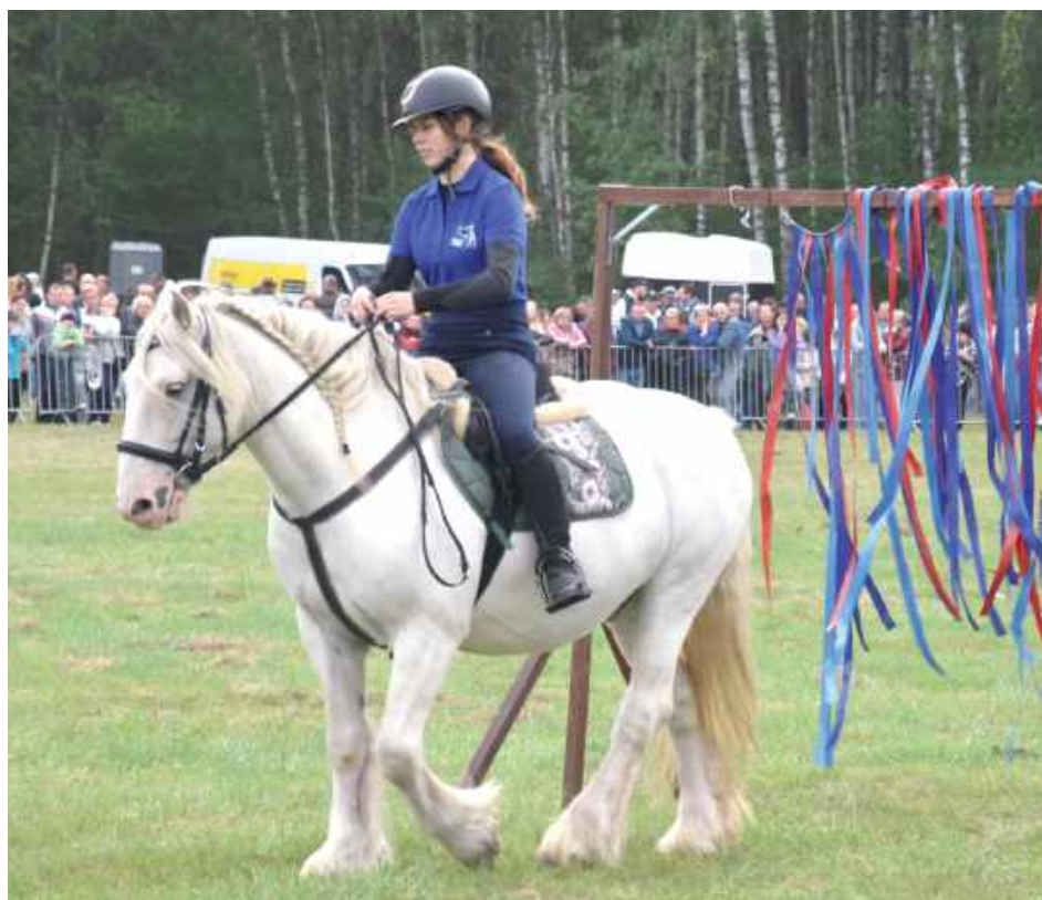
Po wyścigu rozpoczął się pokaz konny TREC „Kolorowe Wzgórze”, będący Wszechstronnym Konkursem Konia Turystycznego