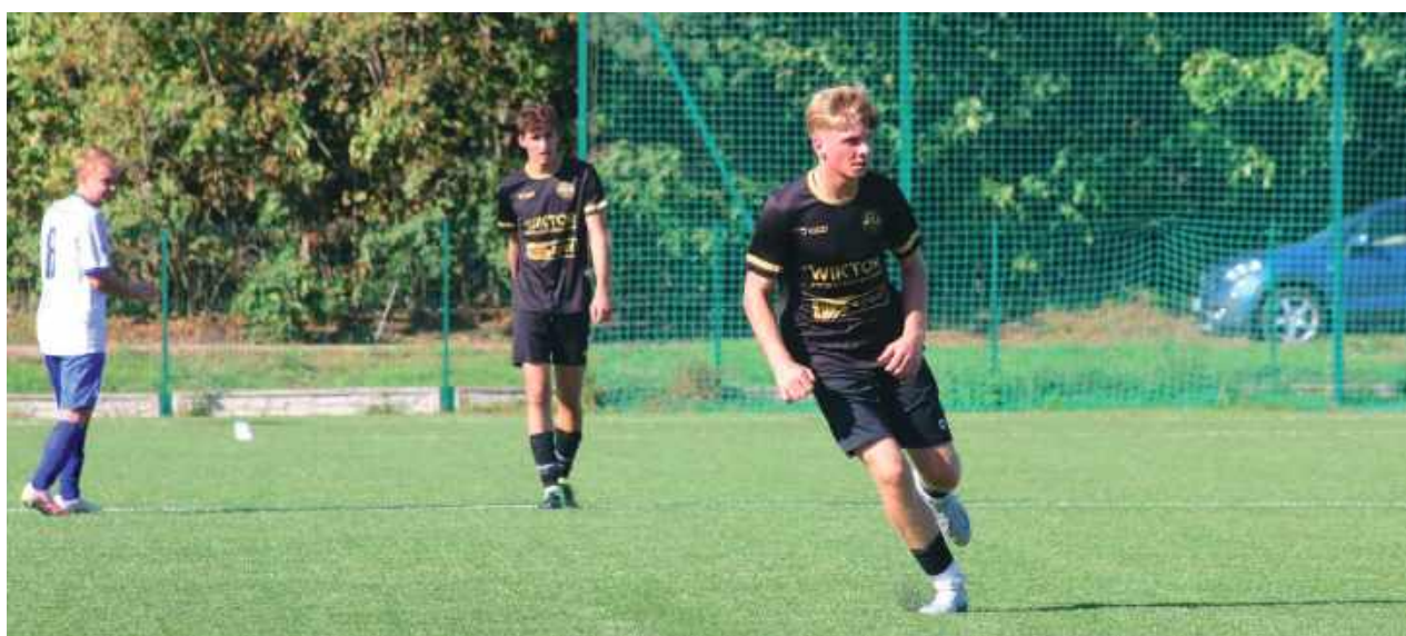
Ambitnie walczyli w pierwszej odsłonie, niestety to było za mało. Promnik wraca z Kałuszyna bez punktów

Zawodnicy Promnika Gończyce ambitnie walczyli w obecnym sezonie na szczeblu siedleckiej klasy „A”. Wydaje się, że po ubiegłorocznych kłopotach z punktowaniem nie ma już śladu i reprezentanci powiatu garwolińskiego raz za razem dopisują kolejne „oczka” do swojego dorobku. O te niezwykle trudno wydawało się w Kałuszynie z miejscową Victorią. Rywale dysponują niezwykle silnym składem kadrowym i wydawali się zdecydowanym faworytem tego meczu, w który dobrze weszli przyjezdni.