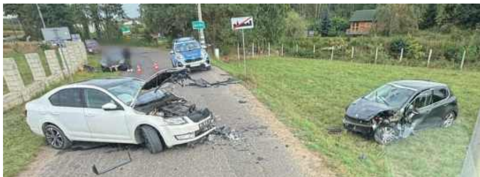
Kierujący w chwili zdarzenia byli trzeźwi

W piątek, 19 września, doszło do groźnego wypadku z udziałem dwóch aut osobowych. Trzy osoby trafiły do szpitala.