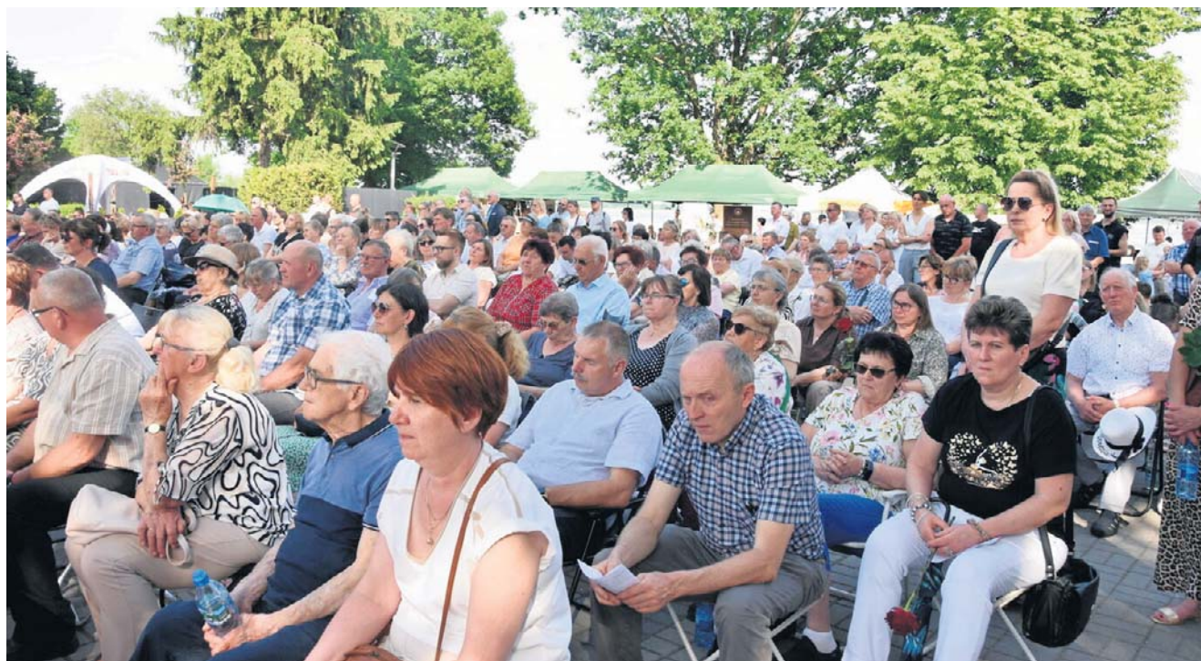
Ludzie odnajdują w niej swoje życie. Widzą kobietę, która mimo dramatów się nie poddała