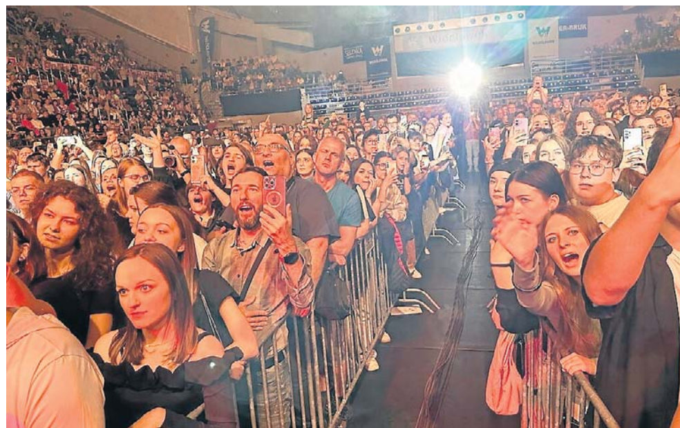
Rok temu koncert Fajansowe Sny zgromadził prawdziwe tłumy w Hali Mistrzów

Koncert „Fajansowe Sny” zdążył już stać się marką samą