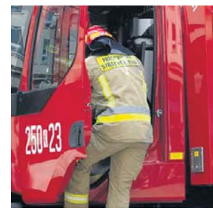
Grupa ratownictwa chemicznego stwierdziła z jaką substancją związane jest ryzyko

Władze uczelni szybko zareagowały, wydając specjalny ko-