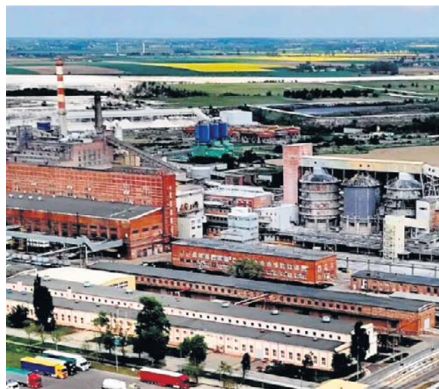
Planowana instalacja ma zostać zlokalizowana na terenach przemysłowych spółki

Produkcja soli, podobnie jak sody, jest działalnością energochłonną, dlatego istotnym elementem przyszłości zakładu ma być budowa nowego źródła energii opartego na odzysku energii z odpadów przemysłowych. Instalacja, którą będzie rozwijać Qemetika w Janikowie w ramach nowego biznesu Resource Reco-