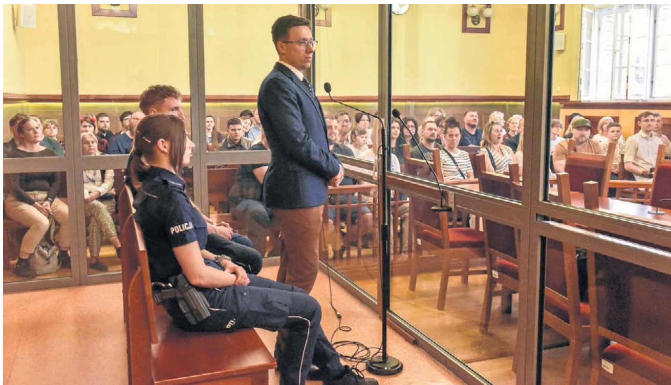
Noc Otwartych Sądów w Sądzie Okręgowym w Toruniu -

Tak to odbiera przeciętny Kowalski czy Nowak, dla którego polityczne boje w sądownictwie już dawno stały się niezrozumiałe. Napięcia, podchody i jawne bitwy o kształt jego poszczególnych izb oraz