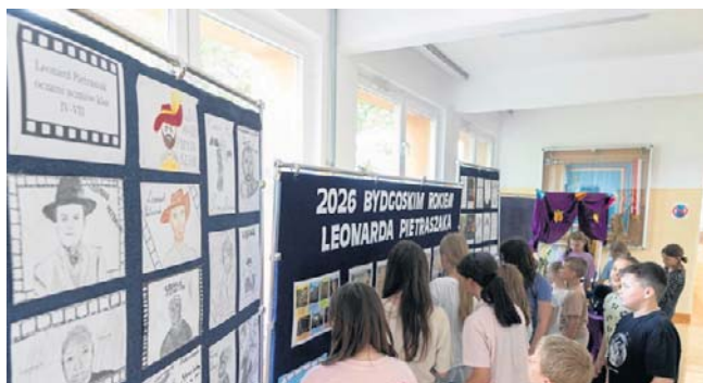
Pierwsza odsłona wystawy odbyła się w SP nr 32

Organizatorem jest Zespół Muzeum Kanału Bydgoskiego im. Sebastiana Malinowskiego. ©