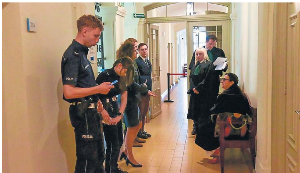
W oczekiwaniu na posiedzenie aresztowe - symulacja

Na przykładzie Torunia i jego regulaminu udostępniania mediom informacji wygląda to tak. Za każdym razem wnioskując o informację dziennikarz pisze maila, załączając skan legitymacji prasowej. Potem czeka na odpowiedź. Jeśli przyjdzie niewyczerpująca, prośbę o doprecyzowanie pisze mailiem (załączając znów skan legitymacji). Potem czeka. I tak dalej. Podobnie sytuacja wygląda w wielu innych miejscowościach. A samo wejście na rozprawę? W „okręgu” dziennikarz zazwyczaj nie musi się anonsować. Ochronie pokazuje legitymację i informuje, jaka rozprawa go do sądu przywiodła. Potem na sali sędzia decyduje czy zezwala na rejestrację obrazu, dźwięku etc. A w „rejonie”? Procedury konkretne. „Jeśli dziennikarz chce złożyć wniosek o rejestrację przebiegu rozprawy przed terminem rozprawy, winien go złożyć na piśmie wraz z kopią ważnej legitymacji dziennikarskiej lub zaświadczeniem wystawionym przez redakcję, potwierdzającym, że dana osoba zajmując się przygotowaniem materiałów prasowych. Wniosek winien zawierać uzasadnienie. W uzasadnieniu należy umotywić wniosek. Ponadto, należy wskazać sposób rejestracji i przedmiot rejestracji. Wniosek taki winien wpłynąć do sądu najpóźniej z chwilą sprawdzenia obecności, po wywołaniu rozprawy, co wynika z art. 381 kpk. Adresatem wniosku jest sąd w znaczeniu składu orzekającego, który orzeka w danej sprawie. Decyzja sądu w formie postanowienia nie jest zaskarżalna” - głosi regulamin wspomnianego już SR Toruń. ©