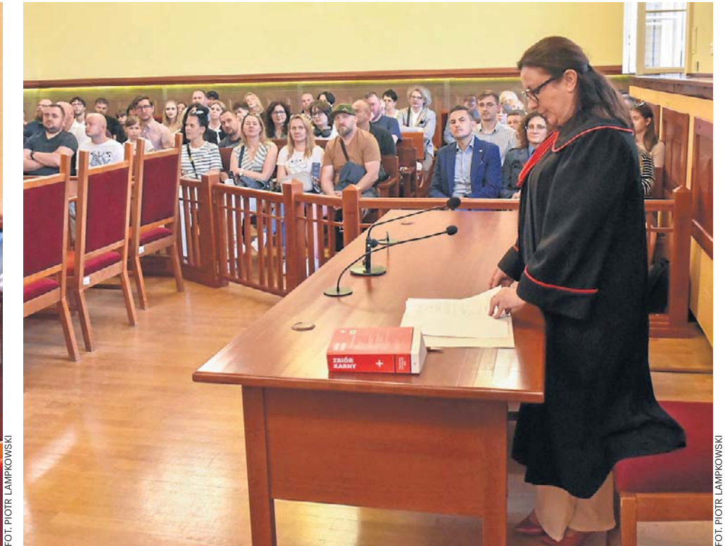
Tak wyglądała 22 maja Noc Otwartych Sądów w Sądzie Okręgowym w Toruniu. Na zdjęciach: symulacja posiedzenia aresztowego przygotowana przez studentów, liczna publiczność (a wśród niej też wiceminister sprawiedliwości Arkadiusz Myrcha)

T uż przed Dniem Wymiaru Sprawiedliwości, 22 maja, polskie sądy chętnie otwierają swoje budynki dla lokalnych społeczności. W tym roku w tej bezsprzecznej cennej akcji wzięła udział w Polsce już setka sądów - także w Kujawsko-Pomorskiem.