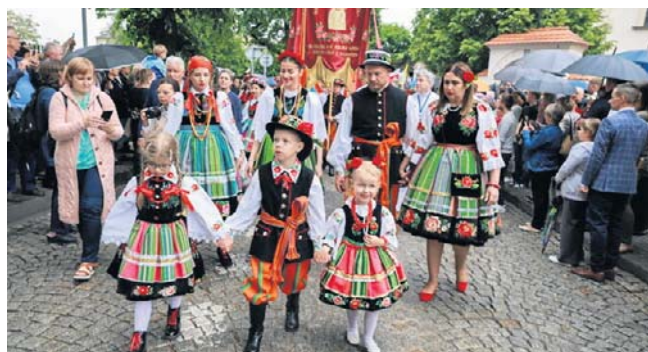
FOT. MARIAN ZUBRZYCKI/PAP

Uroczystość Najświętszego Ciała i Krwi Chrystusa, zwana potocznie Bożym Ciałem, jest świętem ruchomym. W Polsce przypada w czwartek po uroczystości Najświętszej Trójcy. Wczoraj, w całym kraju, ulicami miast i miasteczek przeszły procesje. Na zdjęciu procesja w Łowiczu.