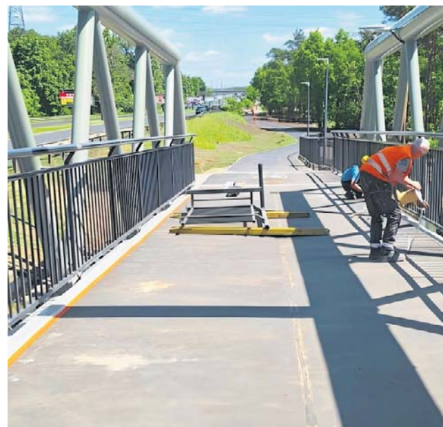
Prace na miejscu budowy kładki rowerowej zakończą się w ciągu kilku dni

Kładka pieszo-rowerowa na wysokości linii kolejowej nr