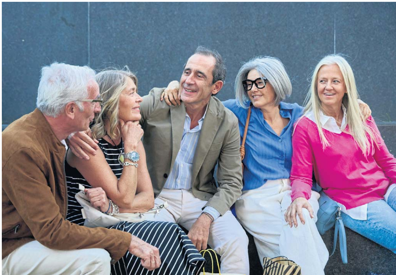
Wszystko, przez co przeszli w zawodowym życiu, sprawia, że lksy często zostają w pracy po godzinach, są przemęczeni