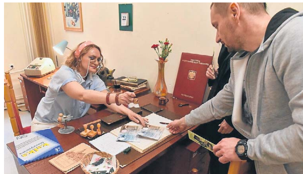
Biuro Obsługi Interesantów przeniesione w czasie do PRL-u