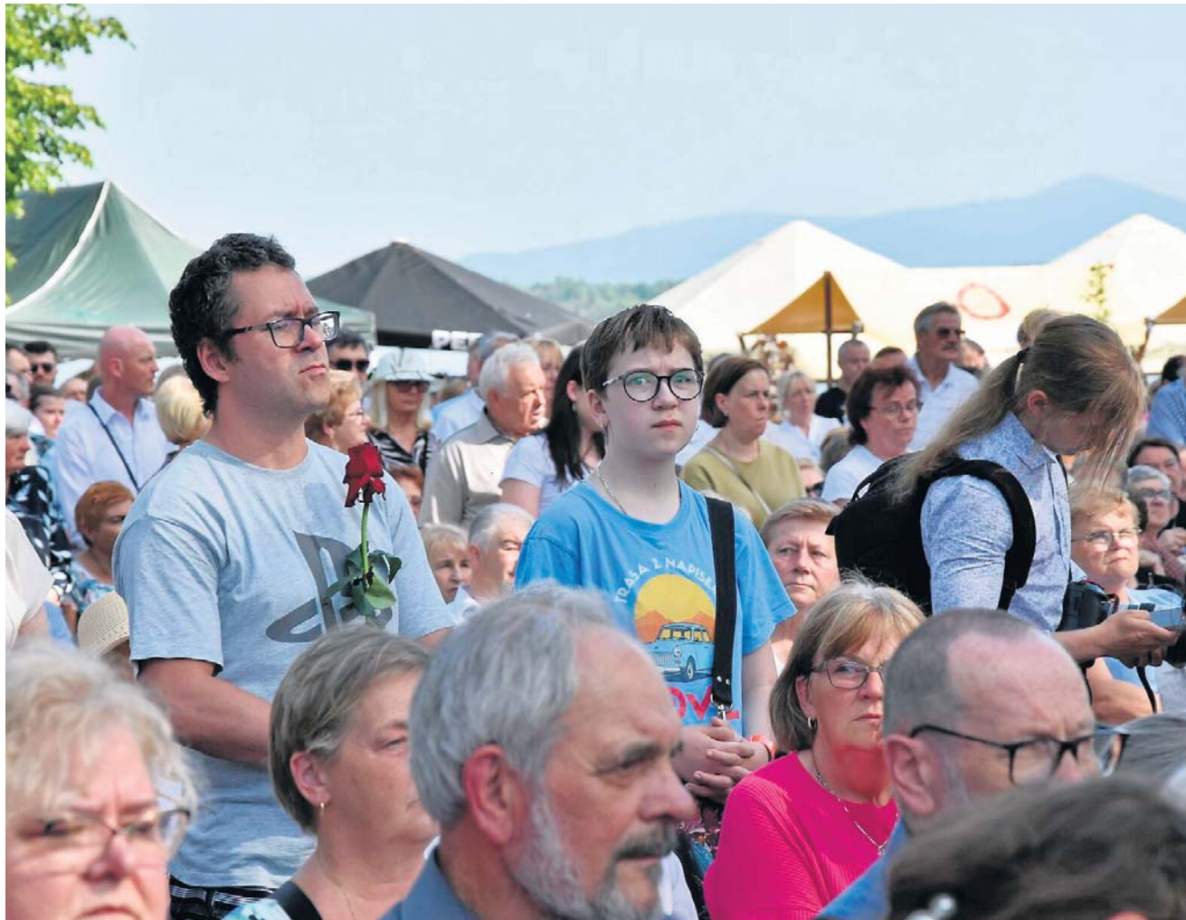
Przyjeżdżają tutaj z tym, czego już nie potrafią udźwignąć sami