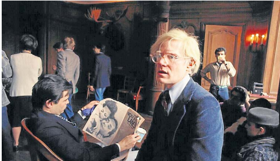
Atelier Warhola stawało się polem do różnych eksperymentów, a jej goście kipieli wulkanem energii. Bawili się, pili, tańczyli, przekraczali „społeczne granice”

Kto nie był w Warhola i choć raz nie oddał mu pokłonu, w tym środowisku ludzi „pięknych” mógł czuć się wykluczony. Na piąte piętro ciągnęły więc artystyczne korowody: bywali tu Mick Jagger i David Bowie, Lou Reed i William S. Burroughs, pofatygowana się Liza Minnelli. A pewnego dnia skrzypiąca winda przywiozła przed oblicze Króla grupę The Velvet Underground w pełnym składzie. Wy-