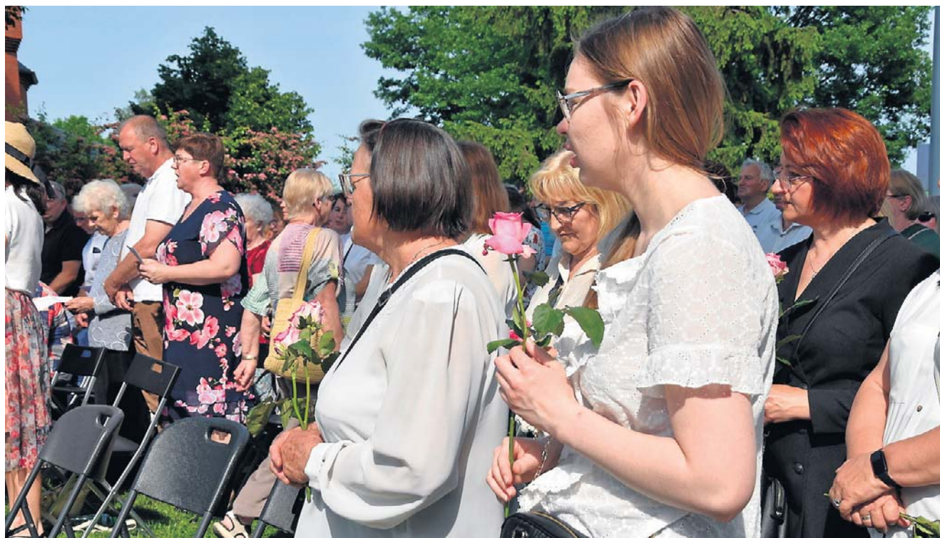
W sanktuarium często mówi się o uzdrowieniach z chorób i narodzinach długo wyczekiwanych dzieci