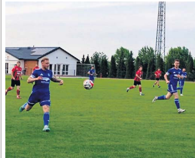
Fragment spotkania Kujawiak Lumac Kowal - Unia Wąbrzeźno

Sobota: Orleń Aleksandrów Kuj. - Łokietek Brześć Kuj. (14:00), Sparta Brodnica - Lech Rypin (14:00), Cuiavia Inowrocław - Chemik Bydgoszcz (16:00), Wisła Dobrzyń - Kujawiak Kowal (11:00), Unia Wąbrzeźno - Start Pruszcz (17:00), Unia Solec Kujawski - Victoria Czernikowo (11:00), Piast Kołodziejewo - Unia Gniewkowo (17:00). Niedziela: Noteć Łabiszyn - Mustang Ostaszewo (13:00)