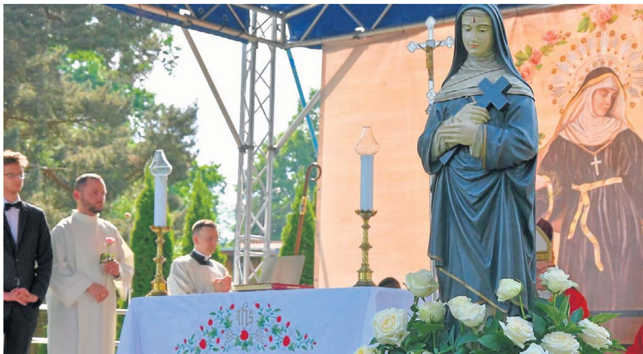
Święta Rita sprawiła, że ta niewielka miejscowość stała się jednym z najważniejszych miejsc jej kultu w Polsce