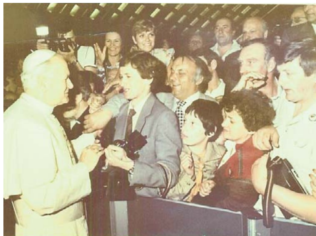
Papież Jan Paweł II podczas pielgrzymki do Polski w 1991 roku odwiedził m. in. Włocławek