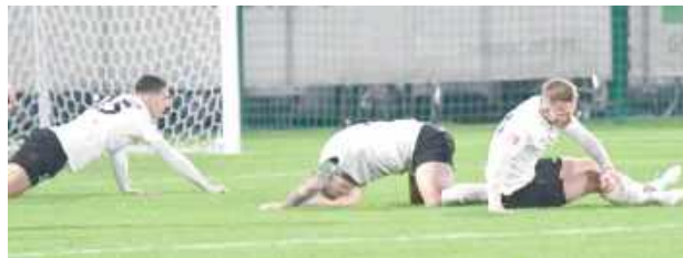
Podlasie na wyjazdach przegrywa mecz za meczem