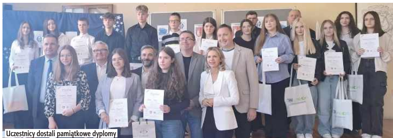
Uczestnicy dostali pamiątkowe dyplomy

Nie zabrakło uczniów Szkoły Podstawowej numer 2 im. Królowej Jadwigi w Parczewie. Szkołę reprezentowało czworo uczniów z klas 8, wyłonionych podczas eliminacji szkolnych.