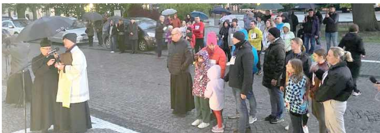
Podczas apelu uczczono pamięć św. Jana Pawła II