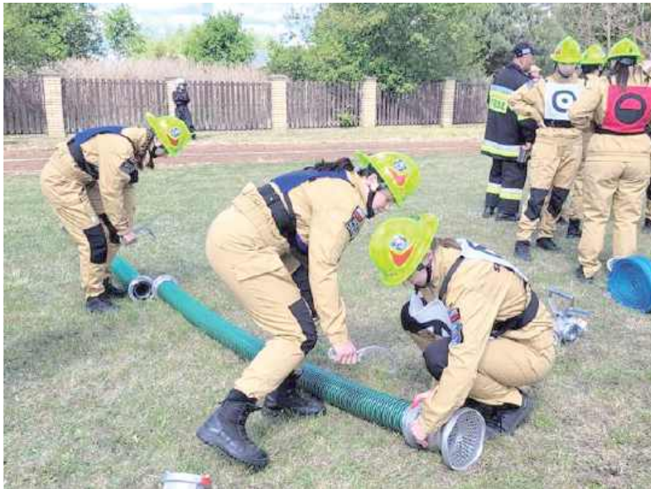
Drużyny z różnych jednostek OSP zmierzyły się w dwóch konkurencjach: ćwiczenie bojowe oraz sztafeta pożarnicza 7 x 50 m z przeszkodami