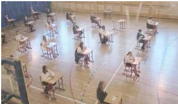
Centralna Komisja Egzaminacyjna dostarczy wyniki w lipcu

Od 13 do 15 maja ósmoklasiści stawali przed pierwszymi poważnymi egzaminami w swoim życiu.