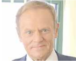
Donald Tusk (PO), premier RP

O bardzo dobrym wyniku może mówić Sławomir Mentzen - według late poll osiągnął wynik 14,5 proc. głosów. Na czwartym miejscu spore zaskoczenie, czyli Grzegorz Braun z rezultatem na poziomie 6,3 proc., a dalej - zdaniem wielu obserwatorów - największy przegrany wyborów Szymon Hołownia z 4,9 proc. głosów. Tuż za nim dwójka lewicowych polityków: Adrian Zandberg - 4,8 proc. oraz Magdalena Biejat - 4,1 proc.