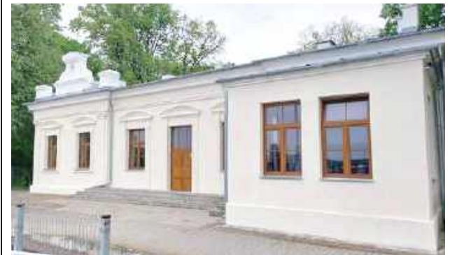
Dworzec pięknieje dla mieszkańców i podróżnych!

Mała zmiana, wielki efekt – dworzec pięknieje dla podróżnych