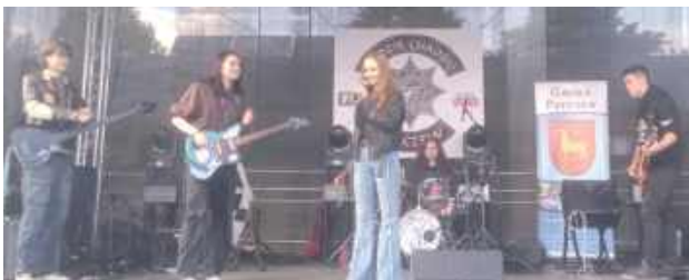
Zespół Forge Me Not to młodzi i wyjątkowo zdolni ludzie z Parczewa. Ich sceniczna przygoda zaczęła się w 2022 roku w Chełmie. Tak o sobie piszą w mediach społecznościowych: Wtedy jeszcze nie wiedzieliśmy, że będziemy się nazywać Forget Me Not, że wspólne granie zostanie z nami na tak długo, nie wiedzieliśmy, że muzyka postawi na naszej drodze tylu cudownych ludzi! Dziękujemy, że z nami jesteście i mamy nadzieję, że do usłyszenia już niebawem!