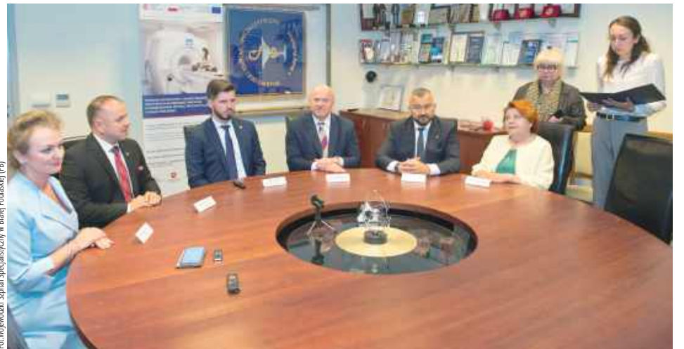
Otwarcie realizacji projektu KPO w białskim szpitalu zgromadziło radnych PiS i urzędników Urzędu Marszałkowskiego Województwa Lubelskiego

W czwartek wieczorem policjanci z Parczewa dwukrotnie interweniowali wobec tego samego 19-letniego mieszkańca