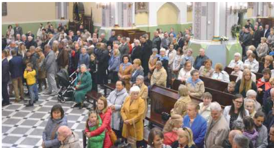
Wydarzenie przyciągnęło tłumy wiernych