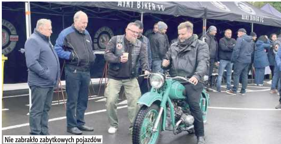
Nie zabrakło zabytkowych pojazdów