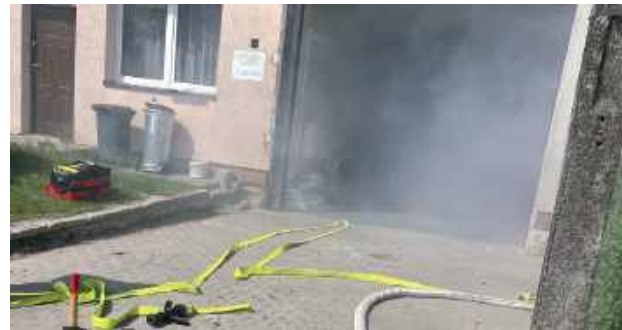
Ratownicy z PSP przygotowali dla druhów założenie dotyczące pożaru wewnętrznego w budynku użyteczności publicznej