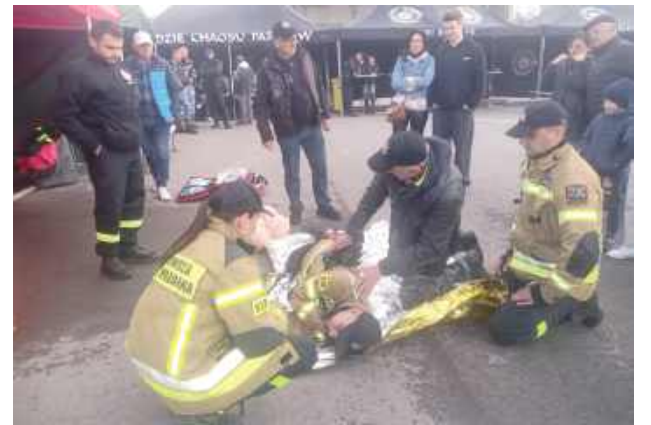
Podczas motopikniku można było sprawdzić swoje umiejętności z układania poszkodowanego w pozycji bocznej bezpiecznej i udzielania pierwszej pomocy. Fachowych porad udzielali strażacy z Ochotniej Straży Pożarnej w Wierzchowinach Starych