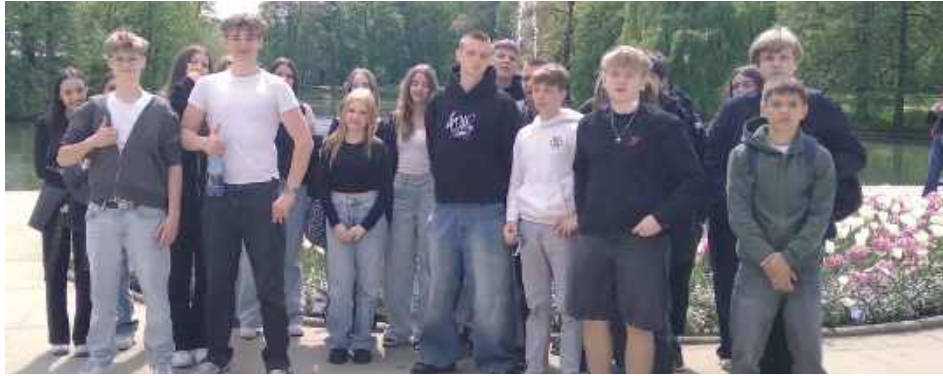
Spacer rozpoczął się przy pomniku Chopina

Klasa 8a ze Szkoły Podstawowej numer 2 im. Królowej Jadwigi w Parczewie pojechała na wycieczkę do Warszawy.