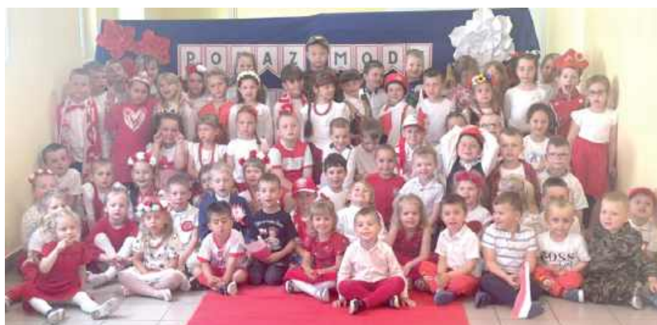
Małe modelki i modele w biało-czerwonych sukienkach, koszulkach, pelerynach, z orzełkami i flagami w dłoniach z dumą prezentowali się na czerwonym dywanie