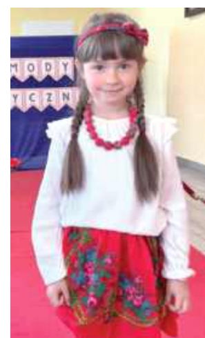
Patriotycznie i na ludowo