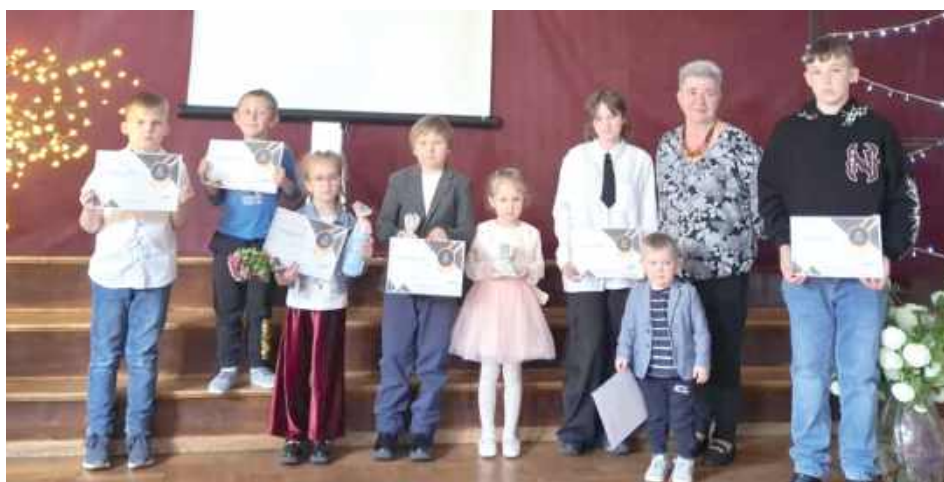
Dzisiejsza biblioteka to nie tylko magazyn dla książek, to jedno z ważniejszych miejsc dla człowieka. Najlepsi czytelnicy w gminie otrzymali pamiątkowe dyplomy

Ale to nie koniec atrakcji jakie zostały przygotowane z okazji Tygodnia Bibliotek. Organizatorzy zaprosili wszystkich mieszkańców na Noc Latających Wierszy. Takiego performansu jeszcze w Milanowie nie było. Wiersze, unoszące się nad głowami, podświetlone migotliwymi diodami-motylami, wprowadzały uczestników w prawdziwe bajkowy nastrój. W centralnym punkcie sali rozbłysło symboliczne, poetyckie drzewo. Poprzedził on rozdanie nagród w konkursie czytelniczym. Przy pomocy światła, dźwięku i poezji udało się przenieść wszystkich uczestników w inny wymiar. W centralnym punkcie sali rozbłysło symboliczne, poetyckie drzewo światła, wokół