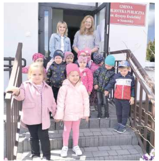
Bibliotekę odwiedziło ok. 10 dzieci

- Dostałyśmy cudne kwiatki, laurkę, czekoladki i masę pozytywnej energii. W zamian zaprosiliśmy dzieci na krótką przygodę z książką i kolorowe warsztaty. A na koniec każdy z uczestników otrzymał babeczkę. Tym razem bananowe babeczki przygotowała Kasia - czytamy.