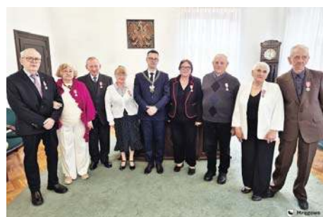
W radościach i smutkach idą razem przez życie |7