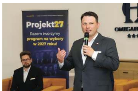
Nowa Nadzieja tworzy program wyborczy |3