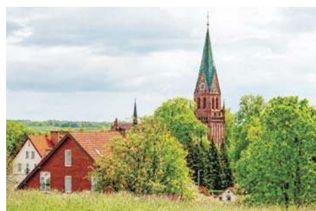
Szykują oblężenie Gietrzwałdu |4