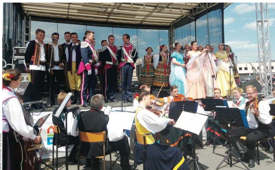
Rada Osiedla Kortowo

Kolejne pismo pochodzi z 21 kwietnia. „W związku ze zgłoszonym przez Państwa zapotrzebowaniem na wypożyczenie sceny na potrzeby wydarzeń organizowanych dla mieszkańców osiedla uprzejmie informuję, iż scena zostanie Państwu użyczona bezpłatnie. Jednocześnie wskazuję, iż koszt usługi rozłożenia i złożenia sceny to 2000,00 zł brutto” – precyzuje prezydent Olsztyna. „W nawiązaniu do pisma z dnia 2 kwietnia