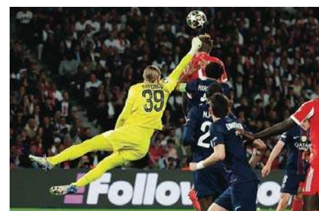
Piłkarska ucztą w Monachium |16