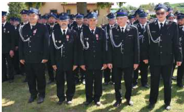
Podczas obchodów wręczono liczne odznaczenia dla strażaków zasłużonych dla pożarnictwa.

W wydarzeniu uczestniczyli druhowie z jednostek OSP z terenu gminy Frampol i sąsiedniej gminy Radecznica, przedstawiciele władz samorządowych, strażacy PSP, zaproszeni goście oraz mieszkańcy.