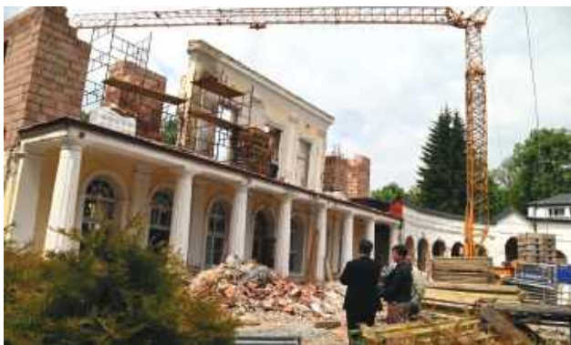
Sanatorium w Krasnobrodzie jest jedyną placówką w kraju prowadzoną przez samorząd powiatowy.

Inwestycja została przygotowana przez Powiat Zamojski, będący organem prowadzącym sanatorium. W proces przygotowania projektu oraz pozyskania środków zewnętrz-