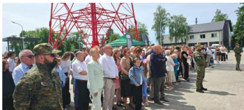
W wydarzeniu udział brali też mieszkańcy gminy Ulhówek i powiatu tomaszowskiego.

Wójt Gminy Rachanie oraz Gminny Ośrodek Kultury w Rachaniach zapraszają na X Gminne Święto Truskawki, które odbędzie się 14 czerwca na placu przy GS w Rachaniach. Uroczyste otwarcie imprezy, połączone z wystąpieniem wójta oraz zaproszonych gości, zaplanowano na godz. 15. Od godz. 15.30 rozpoczną się występy artystyczne, w ramach których zaprezentują się goście z Ukrainy, laureaci konkursów wokalnych, zespoły śpiewacze z terenu gminy, zespół Jawor oraz kapela GOK. Wieczorną część wydarzenia zdominują koncerty gwiazd wieczoru: o godz. 18:30 wystąpi zespół Gdzie Diabeł Nie Może, o godz. 19:30 zespół Tex, o godz. 21 rozpocznie się zabawa plenerowa z zespołem Przymat, a o godz. 22 zabawę poprowadzi DJ Sweetu. Wśród atrakcji towarzyszących zaplanowano konkurs na potrawę z truskawek, truskawkowy kiermasz produktów kulinarnych KGW z terenu gminy Rachanie, stoiska gastronomiczne, rękodzielnicze oraz z zabawkami, a także dmuchane atrakcje dla najmłodszych, lody, watę cukrową i popcorn.