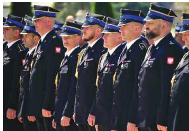
Z pożarem walczyło ponad 3000 osób.

W Łukowej podziękowali tym, którzy walczyli z potężnym pożarem