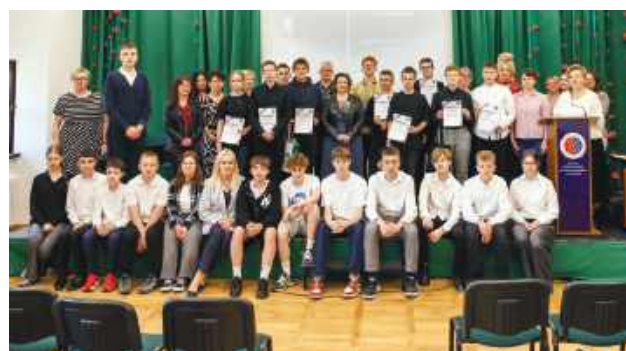
Finały konkursów przedmiotowych z matematyki oraz fizyki odbyły się w I LO w Zamościu.