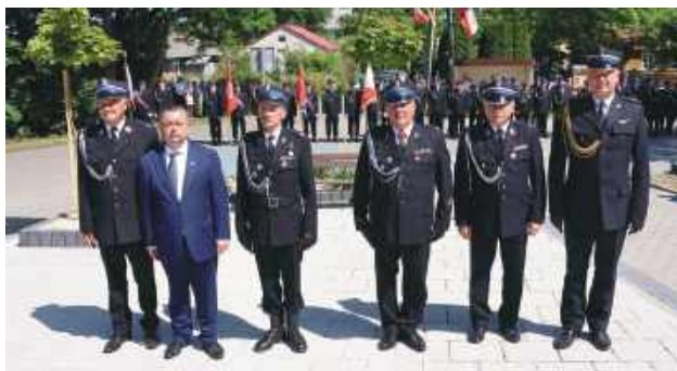
Podczas jubileuszu wręczono również odznaczenia dla najbardziej zasłużonych druhów.