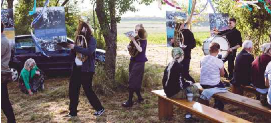
Festiwal Roztrąb organizuje Fundacja Piszczalka.

Orkiestra Dęta Zaburze została założona w 1926 r., w czasach, gdy na weselach dominowały jeszcze kapele skrzypcowe i tradycyjny śpiew wiejski. Pojawienie się orkiestr dętych stało się muzyczną rewolucją na Roztoczu i na stałe wpisało się w krajobraz kulturowy regionu. Podczas festiwalu uczestnicy będą mogli wrócić do atmosfery dawnych zabaw, weselnych przyspiewek i wspólnego muzykowania. Wydarzenie, które odbędzie się na łące naprzeciw remizy OSP w Zaburzu, będzie także okazją do aktywnego poznawania tradycji Roztocza.