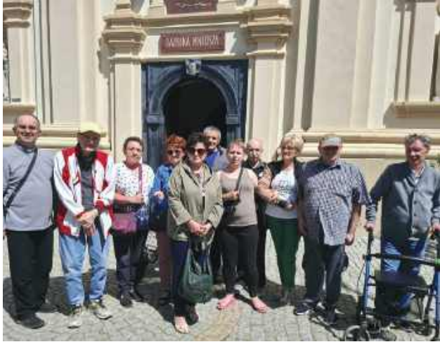
Przedstawiciele domów pomocy społecznej i placówek wsparcia z całego województwa lubelskiego spotkali się w Kodniu podczas XXV Pielgrzymki Środowisk Pomocy Społecznej. W wydarzeniu uczestniczyli również mieszkańcy Domu Pomocy Społecznej w Tyszowcach.

W Sanktuarium Matki Bożej Kodeńskiej Królowej Podlasia – Matki Jedności w Kodniu odbyła się XXV Pielgrzymka Środowisk Pomocy Społecznej województwa lubelskiego. W wydarzeniu uczestniczyli m.in. mieszkańcy Domu Pomocy Społecznej w Tyszowcach.