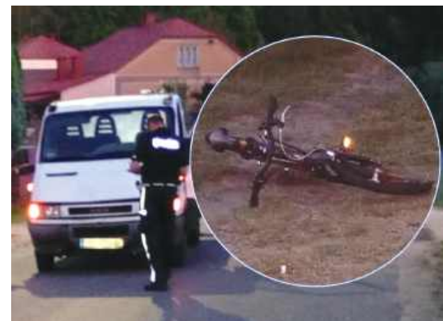
Kierujący Iveco, 48-letni mężczyzna, był trzeźwy. Potwierdziło to badanie przeprowadzone przez policjantów.

– Skierowani na miejsce policjanci wstępnie ustalili, że 10-letnia dziewczynka, która jechała rowerem, z niewyjaśnionych na chwilę obecną przyczyn zjechała