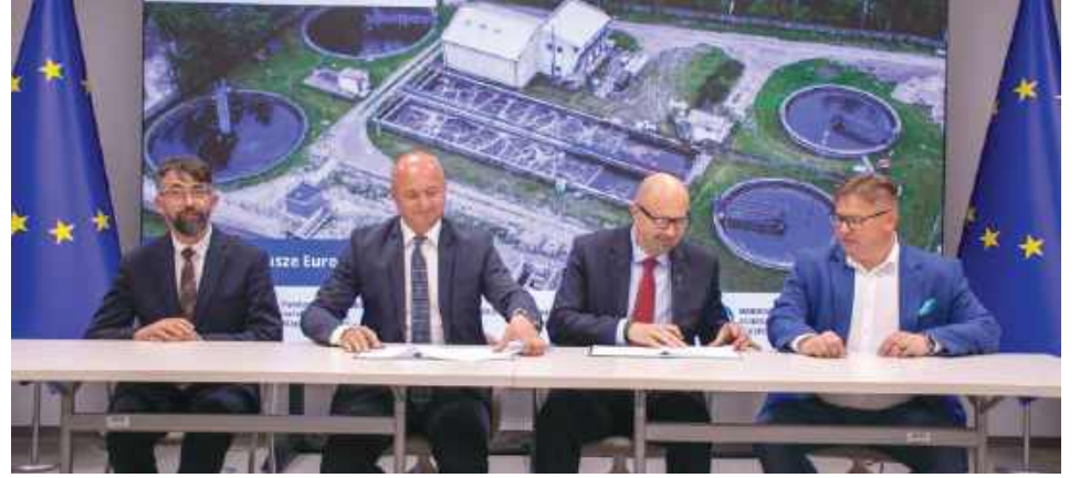
Umowa została podpisana 25 maja w siedzibie Narodowego Funduszu Ochrony Środowiska i Gospodarki Wodnej.