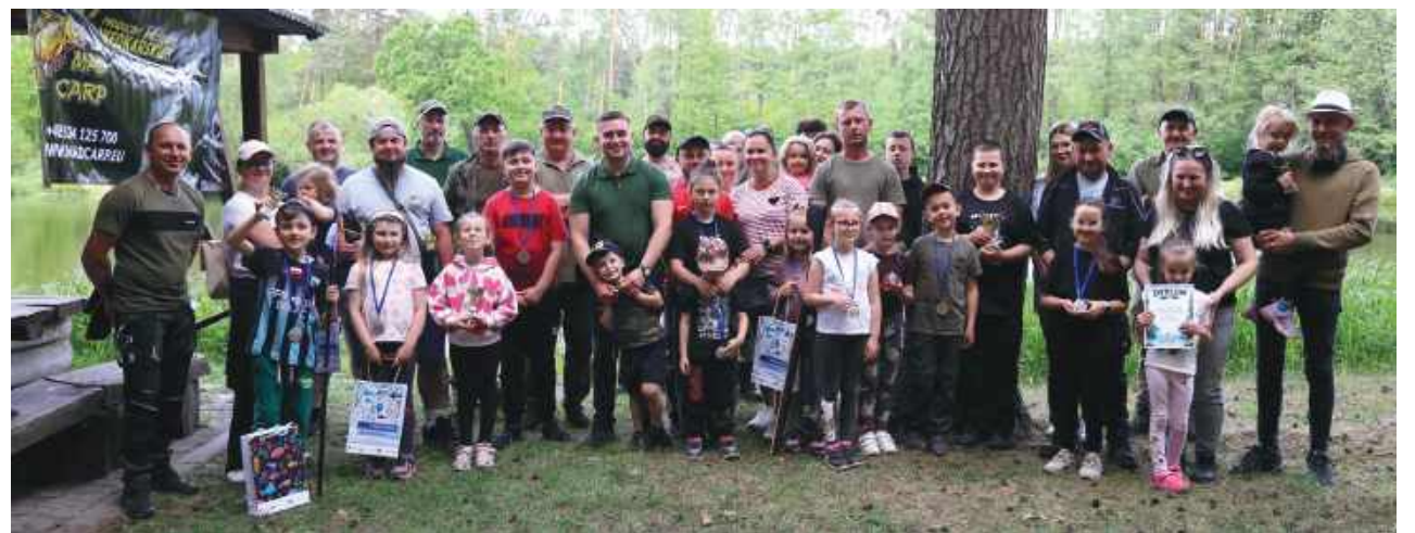
Zawody Wędkarskie o Puchar Wójta Gminy Bełżec z okazji Dnia Dziecka.