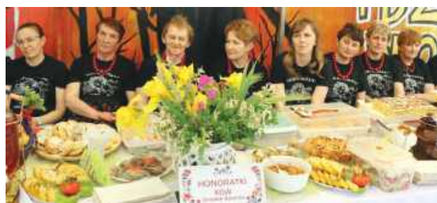
Panie z kół gospodyń przygotowały dla strażaków i gości poczęstunek.