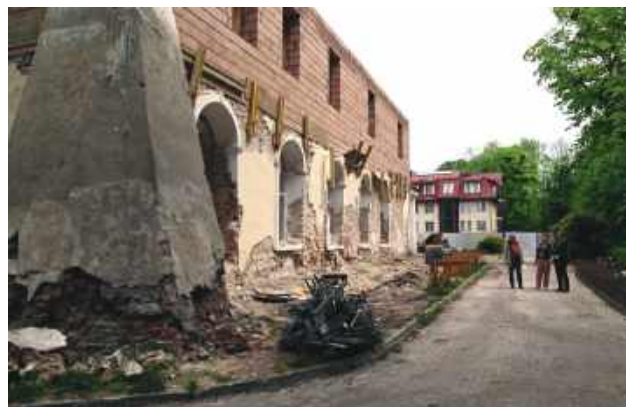
Obecnie prowadzone są prace związane z przebudową zabytkowego pałacu oraz oficyny wraz z galerią i łącznikiem.

Obecnie prowadzone są prace związane z przebudową zabytkowego pałacu oraz oficyny wraz z galerią i łącznikiem. W dawnym pałacu mają powstać sale wystawowe oraz wielofunkcyjne przestrzenie przeznaczone do organizacji spotkań i wydarzeń. Z kolei w oficynie przebudowane zostaną pokoje dla kuracjuszy, powstaną także