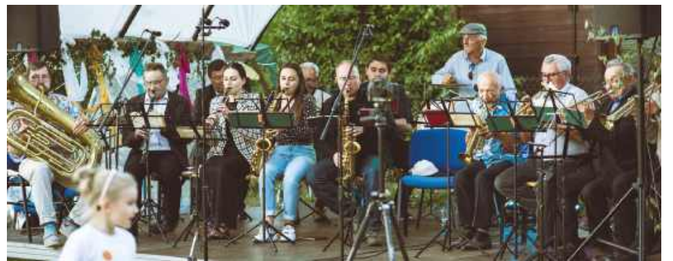
... a tak było w Zaburzu w zeszłym roku.