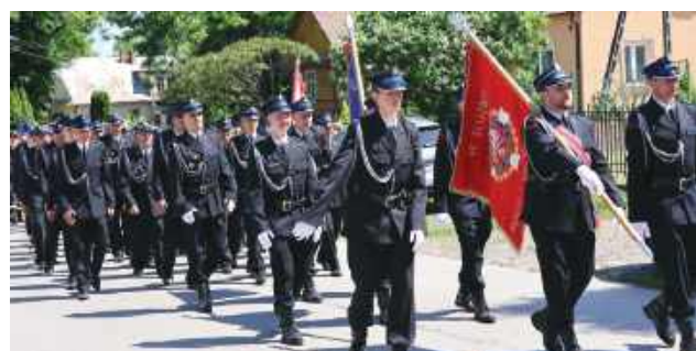
Wydarzenie połączone z Gminnym Dniem Strażaka.