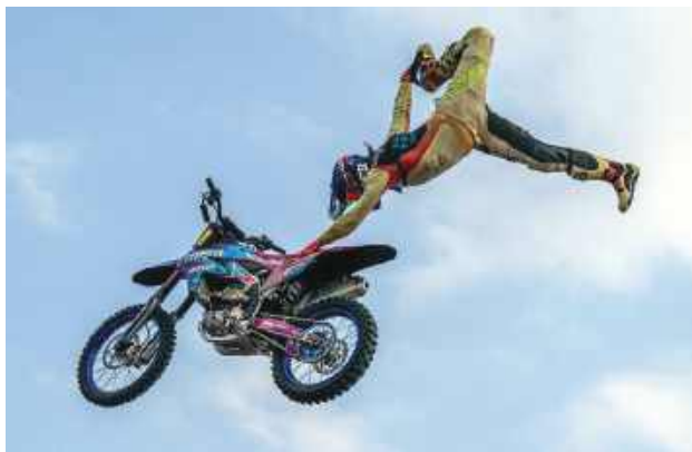
Tegoroczna impreza „Zamość na Okragło” ma się odbyć poza Rynkiem Wielkim.

Punktem kulminacyjnym sesji były słowa prezydenta Za-