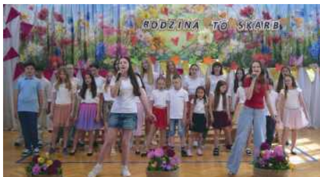
Uczniowie przygotowali bogaty program artystyczny. Każdy występ był wyjątkowy i spotykał się z gorącym aplauzem publiczności.

Było to popołudnie pełne wzruszeń, radości i rodzinnego ciepła, podczas którego dzieci mogły wyrazić swoją miłość i wdzięczność najważniejszą osobą w swoim życiu. Święto Rodziny w Szkole Podstawowej nr 7 z Oddziałami zgromadziło 28 maja wielu rodziców.