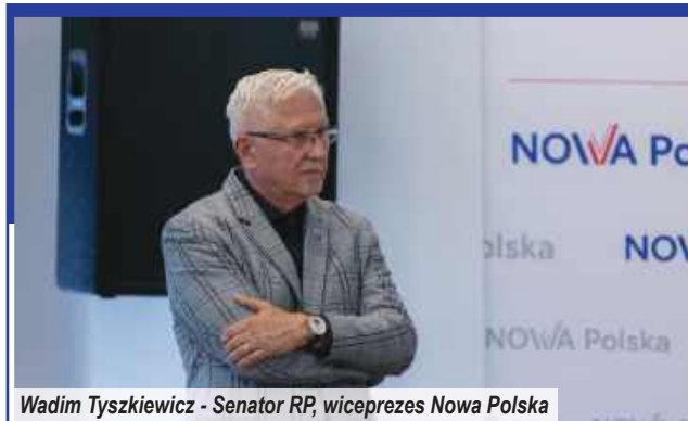
Wadim Tyszkiewicz - Senator RP, wiceprezes Nowa Polska