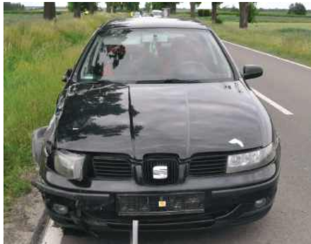
Motocykl uderzył w bok samochodu.

Do zdarzenia doszło w niedzielę, 31 maja, około godziny 15.50 na drodze wojewódzkiej nr 863. Dyżurny Komendy Powiatowej Policji w Biłgoraju otrzymał zgłoszenie o zderzeniu motocykla z samochodem osobowym na trasie Tarnogród-Różaniec.