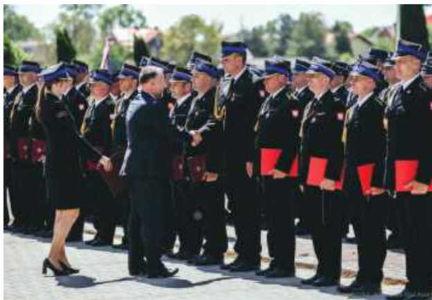
Podziękowania i wyróżnienia wręczał m.in. minister Marcin Kierwiński.