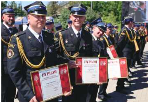
Wielu strażaków otrzymało podziękowania i odznaczenia.