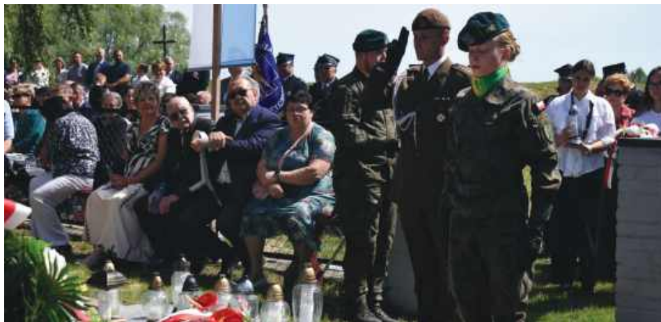
Uroczystości rozpoczęły się od podniesienia flagi państwowej i złożenia kwiatów przed pomnikiem upamiętniającym pomordowanych mieszkańców wsi.

Choć do zbrodni doszło 11 grudnia 1942 r., to jej upamiętnienie obchodzone jest co roku w drugi dzień Zielonych Świątek. 25 maja mieszkańcy, władze samorządowe oraz zaproszeni goście oddali hołd ofiarom pacyfikacji miejscowości Kitów w gminie Sułów.