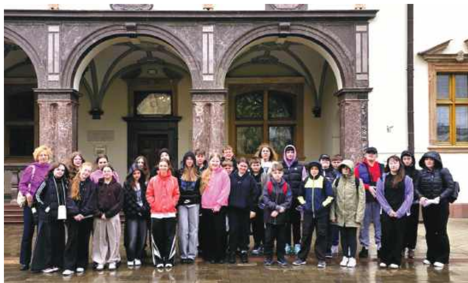
Nagrodą była wycieczka dla uczniów klasy laureatki do wybranego Muzeum Narodowego w Kielcach.