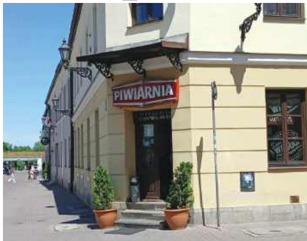
Od 13 lat w lokalu odbywają się imprezy karaoke.

Pan Dariusz od blisko 30 lat prowadzi w tym miejscu lokal,