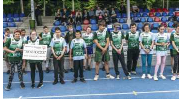
Na starcie spotkali się wyłonieni podczas treningów zawodnicy.