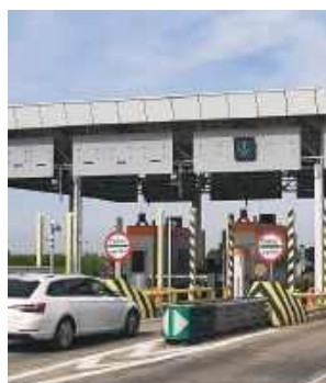
Kontrola została przeprowadzona przez funkcjonariuszy Trzeciego Działu Realizacji w Hrubieszowie na przejściu granicznym w Dołhobyczowie.

Służba Celno-Skarbową przypomina, że opłaty elektroniczne