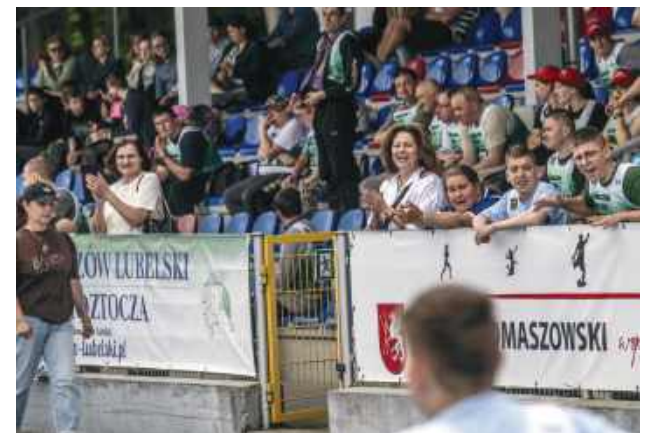
Mityng dostarczył uczestnikom i kibicom niezapomnianych emocji.

Patronat medialny nad Lubelskim Mityngiem Lekkoatletycznym Olimpiad Specjalnych sprawowała redakcja „Kroniki Tygodnia”. wd