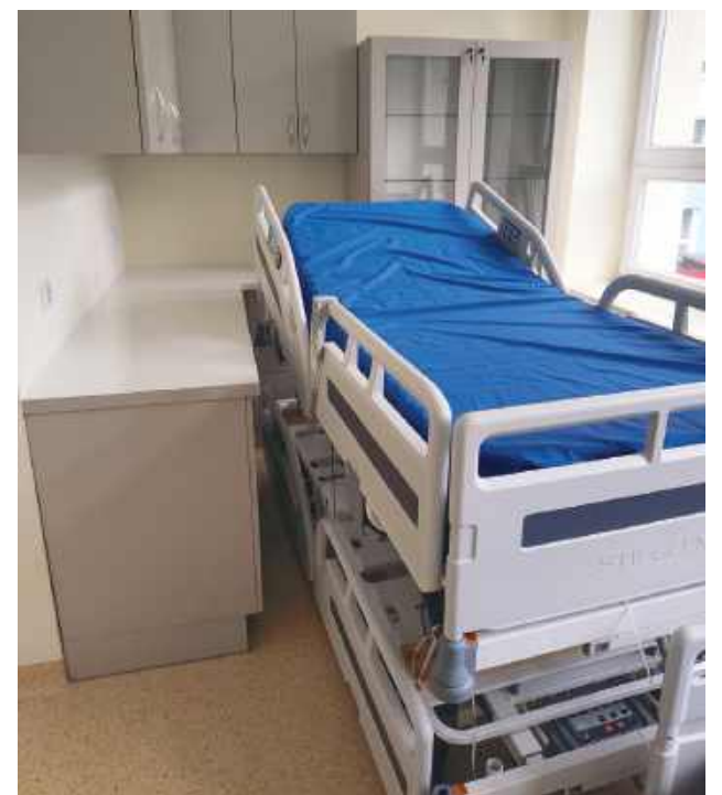
Do placówki trafiły już m.in. aparaty USG, łóżka i wyposażenie sal chorych, sprzęt komputerowy, wózki kuchenne oraz urządzenia do utrzymania czystości.

Do placówki trafiły już m.in. aparaty USG, łóżka i wyposażenie sal chorych, sprzęt komputerowy, wózki kuchenne