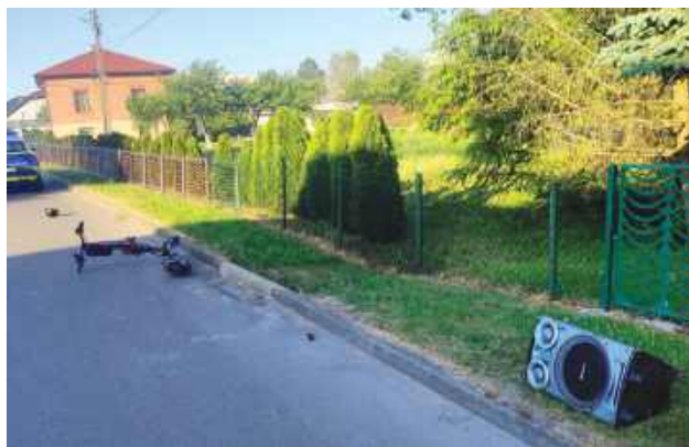
13-latek jechał hulajnogą elektryczną, siedząc na przewożonym głośniku muzycznym.

Pomysłowość niektórych osób nie zna granic. Niestety, tym razem zabrakło ostrożności i przewidywalności. 13-letni kierujący hulajnogą elektryczną ustawił na niej głośnik muzyczny i tak jechał, dopóki nie stracił panowania nad kierownicą. Wówczas uderzył przednim kołem w krawężnik i upadł na jezdnię. Z obrażeniami ciała trafił do szpitala.