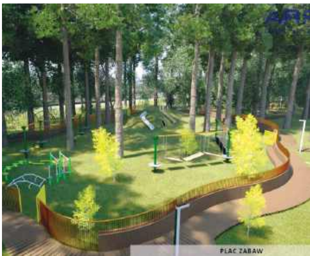
Wizualizacja nowego placu zabaw.

Miasto Biłgoraj zdobyło kolejne dofinansowanie na działania związane z rewitalizacją przestrzeni publicznych. Tym razem środki zostaną przeznaczone na realizację projektu „Utworzenie miejsca integracji i rekreacji w osiedlu Rapy”.