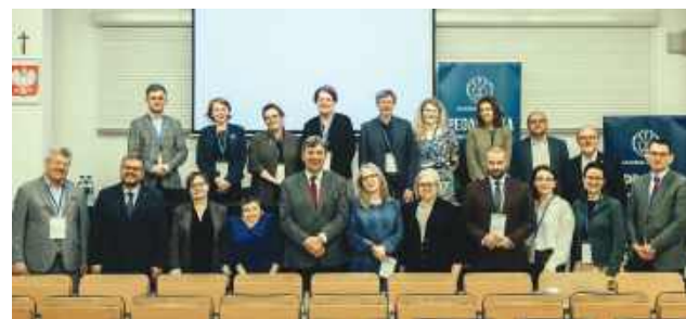
W programie konferencji znalazły się wystąpienia naukowców, badaczy oraz praktyków reprezentujących różne dyscypliny naukowe.