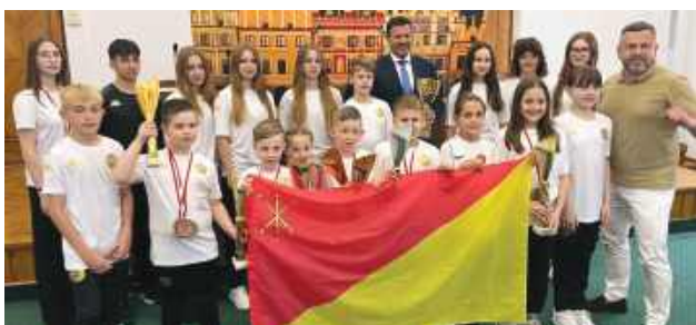
– Dziękuję, że tak ciężko trenujecie, odnosicie sukcesy i rozślawiacie w ten sposób Zamość – zwrócił się do młodych karatekistów prezydent Zamościa.

Na Mistrzostwa Polski w Karate Tradycyjnym pojechało ich dwadzieścioro. Wrócili do Zamościa z dziesięcioma medalami. 27 maja młodzi zawodnicy Roztoczańskiego Klubu Karate Tradycyjnego przyjmowali gratulacje od prezydenta Zamościa.