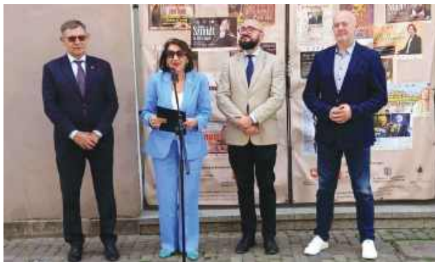
Konferencja odbyła się 29 maja.