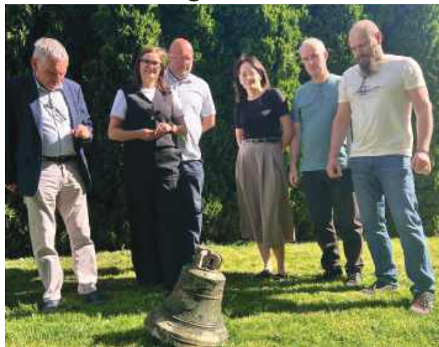
26 maja odbyły się oględziny konserwatorskie miejsca odkrycia.

Dzwon został wydobyty z ziemi w całości i przewieziony do Urzędu Gminy Werbkowice. W miejscu odkrycia czasowo wstrzymano roboty budowlane. O znalezisku poinformowano Wojewódzki Urząd Ochrony Zabytków w Lublinie – Delegaturę w Zamościu.