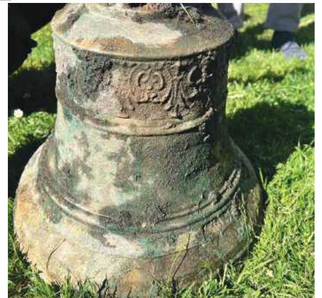
Zabytek ma 43 centymetry średnicy i 41 centymetrów wysokości.

Samorząd gminy planuje, by po zakończeniu procedur konserwatorskich dzwon został