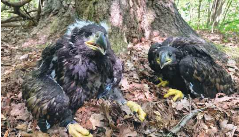
Dzięki współpracy z Lubelskim Towarzystwem Ornitologicznym specjaliści bezpiecznie dotarli do tegorocznego gniazda i zaobrączkowali młode ptaki.