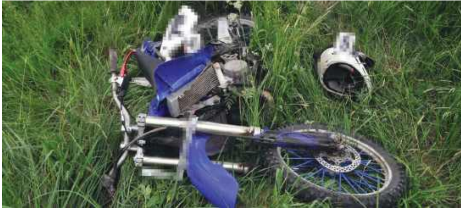
Jednoślad nie był zarejestrowany i nie miał obowiązkowego ubezpieczenia OC.

15-letni motocyklista walczy o zdrowie po poważnym wypadku na trasie Tarnogród-Różaniec. Nastolatek, który wyjechał z drogi podporządkowanej i uderzył w nadjeżdżającego Seata, z ciężkimi obrażeniami został przetransportowany śmigłowcem LPR do szpitala. Jak ustalili policjanci, nie miał uprawnień do kierowania motocyklem, a jego pojazd nie był dopuszczony do ruchu.