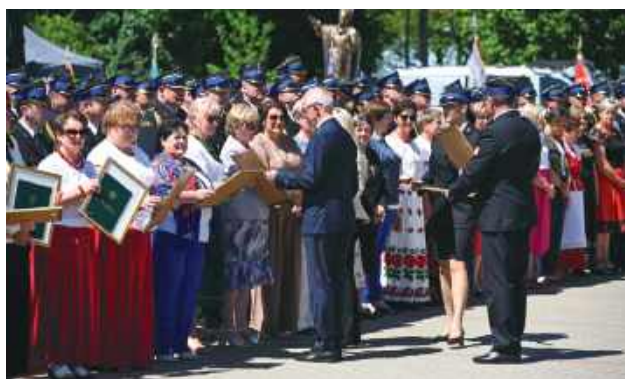
Podziękowania odebrały też m.in. koła gospodyń wiejskich.

Uroczystość rozpoczęła się od podniesienia flagi państwowej i odśpiewania hymnu. Choć okazją było święto patrolne strażaków, wspomnienia wszystkich uczestników wracały do wydarzeń z początku maja.