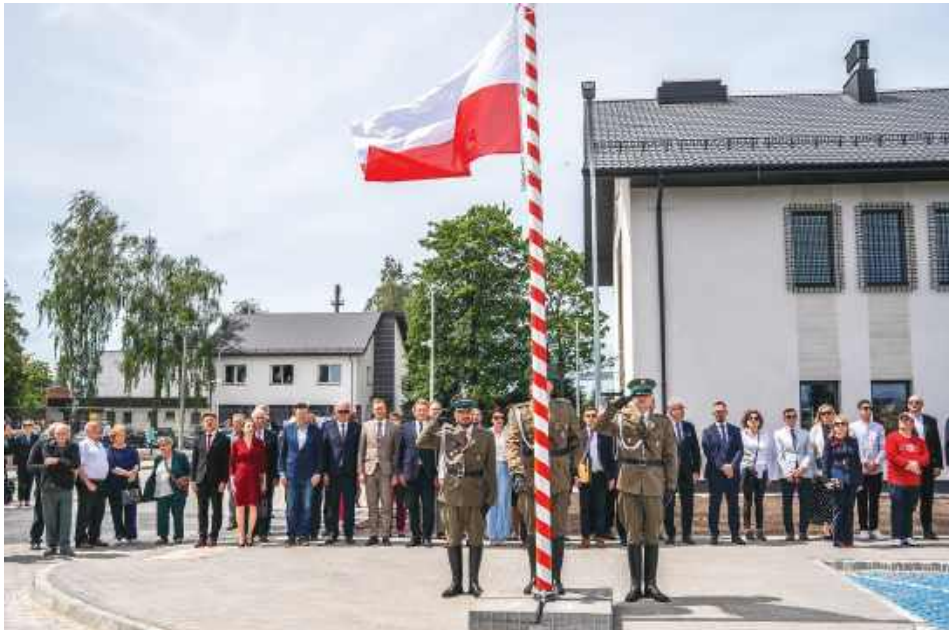
Nowoczesny kompleks Straży Granicznej w Ulhówku został oficjalnie otwarty 25 maja.

Nowoczesny kompleks Straży Granicznej w Ulhówku został oficjalnie otwarty 25 maja. Inwestycja za około 38 mln zł zastąpiła dotychczasową placówkę w Lubyczy Królewskiej i ma wzmocnić ochronę ponad 20-kilometrowego odcinka granicy z Ukrainą. Uroczystość połączono z obchodami 35-lecia Nadbużańskiego Oddziału Straży Granicznej.