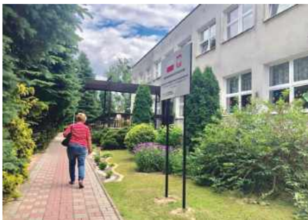
Jednym z najważniejszych elementów przedsięwzięcia będzie gruntowna termomodernizacja PM nr 15 na os. Zamojskiego.

Zakres prac obejmuje m.in. docieplenie ścian zewnętrznych, stropu i stropodachu, a także remont oraz modernizację dachu wraz z obróbką kominów. W bud-