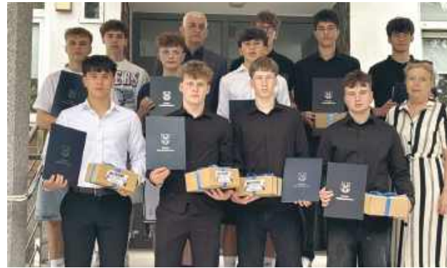
Oni wywalczyli tytuł mistrzów województwa.