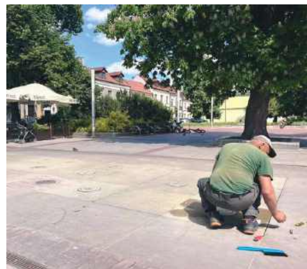
Fontanna na Rynku Wodnym została wybudowana w 2010 r. podczas modernizacji placu. Już po kilku latach zaczęły pojawiać się problemy techniczne.

Podczas kontroli okazało się, że aż 10 z 16 dysz zostało czymś mocno zapchanych. Przeprowadzone czyszczenie nie przyniosło oczekiwanego efektu i system nadal nie działa prawidłowo. – Już kontaktowaliśmy się z producentem, który montował fontannę. Jego serwisanci powinni pojawić się w Zamościu po weekendzie (na początku czerwca – przyp. red.) i przeprowadzić