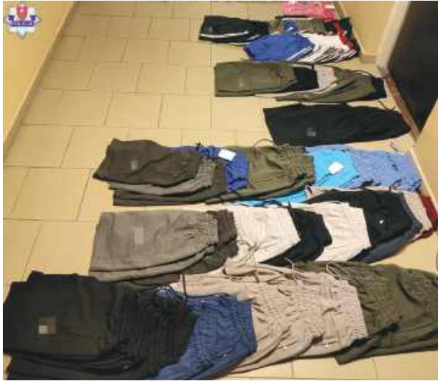
Te rzeczy do sprzedaży już nie trafią.

40-letni Bułgar stanie przed sądem za sprzedaż podróbionej odzieży. W ostatnią niedzielę na giełdzie w Mokrem zamojscy policjanci oraz funkcjonariusze Służby Celno-Skarbowej zatrzymali go i zabezpieczyli ponad 260 sztuk koszulek i spodenek z zastrzeżonymi znakami towarowymi różnych firm.