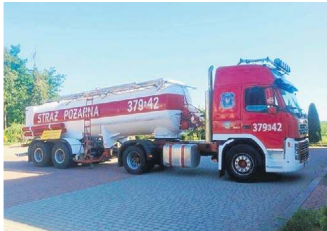
W weekend można było skorzystać z wody ze strażackiej cysterny przy OSP w Nowej Jastrzębce

Z apelem o racjonalne korzystanie z wody wystąpiła gmina Żabno, a także sąsiednia Dąbrowa Tarnowska, w których od kilku dni również notowane są duże spadki ciśnienia w sieci wodociągowej.