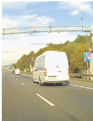
Odcinkowy pomiar prędkości działa od wczoraj