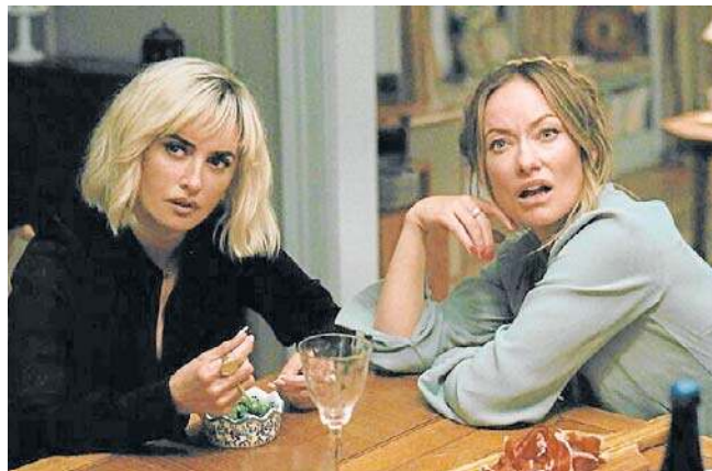
Penelope Cruz i Olivia Wilde w filmie „Zaproszenie”