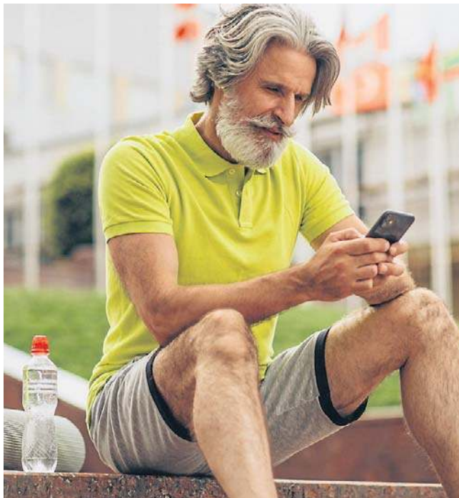
Obserwujemy prawdziwy boom na urządzenia i aplikacje, które na bieżąco monitorują nasze zdrowie

Zegarek nie tylko mierzy tętno czy inne parametry życiowe, ale także analizuje jakość snu i podpowiada, jak ją poprawić. Technologia wchodzi w najbardziej intymne obszary naszego funkcjonowania, a wraz z nią rośnie znaczenie regeneracji. Szybsze tempo życia sprawia, że sen przestaje być luksusem, a staje się fundamentem zdrowia. To właśnie stąd bierze się rosnąca popularność pojęcia, jakim jest snomedycyna - określającego podejście, w którym coraz więcej terapii za-