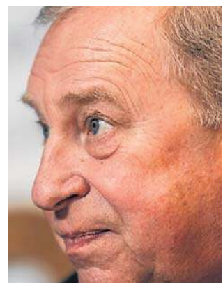
Filmy z Jerzym Stuhrem wracają na ekran

Festiwal Jerzego Stuhra otworzy pokaz komedii, o której można powiedzieć: kultowa - to „Kingsajz” Juliusza Machulskiego. W niecodziennych okolicznościach, bo 125 metrów pod ziemią, w Kopalni Soli w Wieliczce o pracy nad filmem opowiedzą Juliusz Machulski i Katarzyna Figura, a spotkanie poprowadzi Ewa Drzyzga.