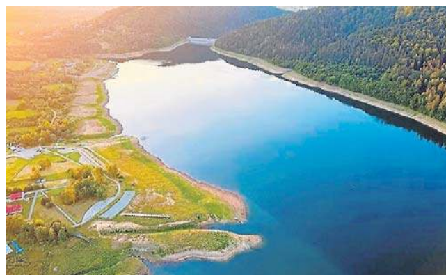
Klimkówka. Zdjęcie zrobione z powietrza dobrze obrazuje zmiany na zalewie