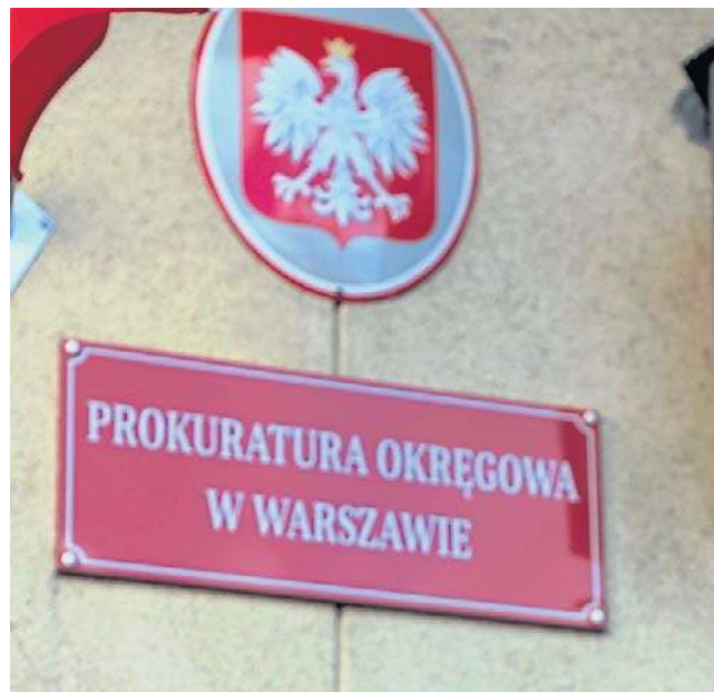
Prokuratura Okręgowa w Warszawie umorzyła śledztwo w sprawie tak zwanych dwóch wież

Jak zaznaczył Skiba, chodziło o wprowadzenie pokrzywdzonego w błąd co do posiadania