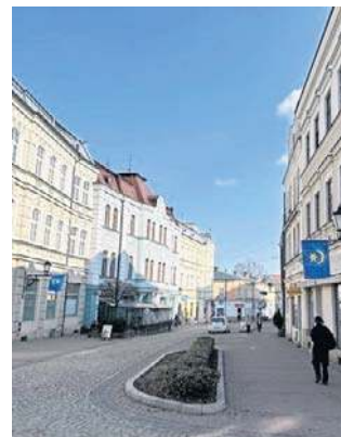
Na ul. Wałowej klomby i ogródki kawiarni zostaną

Na wiosnę magistrat ogłosił wznowienie kursowania autobusów po Wałowej. Pomysł ma tyłu entuzjastów, co przeciwników, ale miasto zdecydowało się na testy w okresie wakacji. Zdeptak nikt nie zamierza z tego powodu