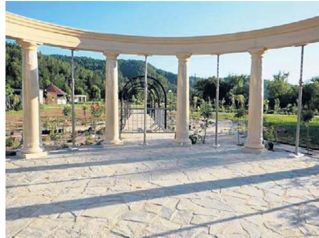
Najważniejszym elementem ogrodu będzie glorieta, miejsce odpowiednie np. na niewielkie koncerty

Całość została zaprojektowana jako przestrzeń do spokojnego wypoczynku. W ogrodzie powstały wygodne alejki,