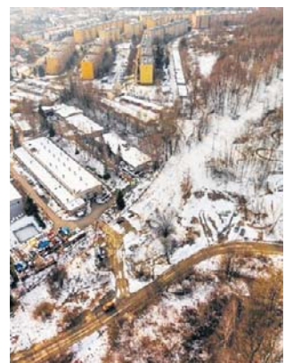
Budowa nowej drogi będzie kosztowała 7 mln zł

Budowa łącznika przede wszystkim poprawi poziom bezpieczeństwa na osiedlu Korczaka. W stanie istniejącym na osiedle prowadzi jedna droga dojazdowa i w przypadku jej zablokowania na początkowym odcinku, wielu mieszkańców może zostać po-