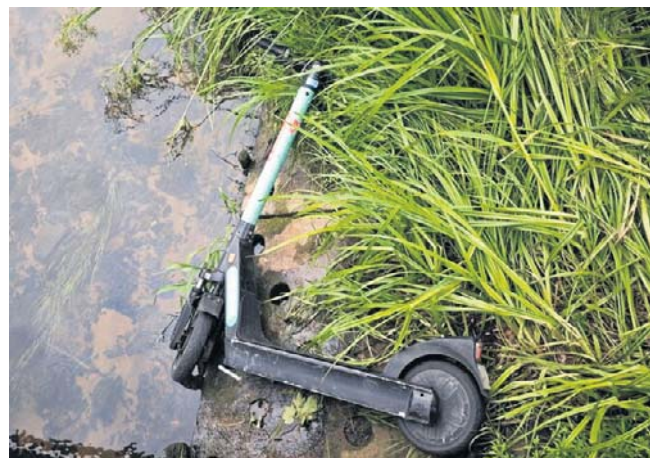
Hulajnoga w potoku. Co będzie następne? Lodówka, rower, ławka? Monitoring terenu powinien ujawnić sprawcę

Nie tylko szpeci to okolicę, ale także generuje koszty, które ostatecznie ponoszą mieszkańcy - płacąc za każdy zniszczony kosz lub prywatne miejsce, które trzeba odzyskać, naprawić lub zastąpić nowym.