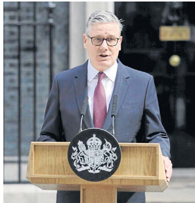
Premier Wielkiej Brytanii Keir Starmer spotkał się z mediami przy Downing Street 10. Oświadczył, że pozostanie szefem rządu do czasu wyłonienia jego następcy

Wcześniej Starmer podsumował swoje osiągnięcia, prze-