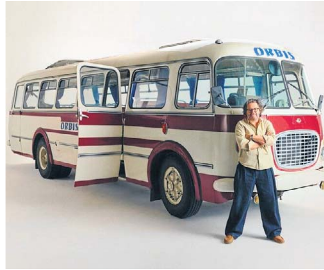
Grzegorz Turnau wyrusza w trasę. Posłuchamy go w Krakowie, Warszawie, Gdańsku, Wrocławiu i Poznaniu

Rok 2025 był kamieniem milowym dla wprowadzenia nowych dźwięków na Letnie Brzmienia. Pomysł koncertu orkiestry symfonicznej na letnim festiwalu zaowocował projektem Edyty Bartosiewicz i Good Taste Orchestra „To jest mój sen”, który pokazał, jak silne emocje może wywołać połączenie piosenek znanych z radiowych playlist z symfonicznym brzmieniem. W tym roku festiwal rozwija ten kieru-