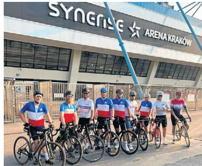
Kibice „Białej Gwiazdy” na 120-lecie krakowskiego klubu przejechali na rowerach symboliczny dystans 190,6 km