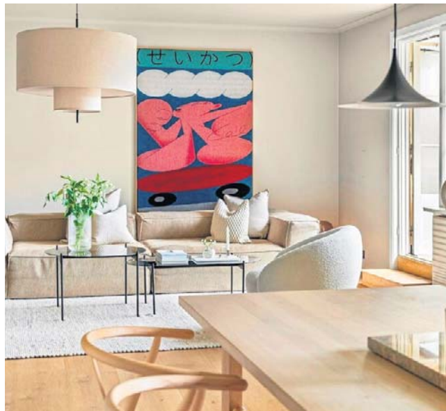
W tym roku królują ciepłe odcienie i kolory zaczerpnięte wprost z natury

Choć biel pozostaje jednym z najpopularniejszych kolorów ścian, jej charakter wyraźnie się zmienił. Projektanci odchodzą od chłodnych, laboratoryjnych