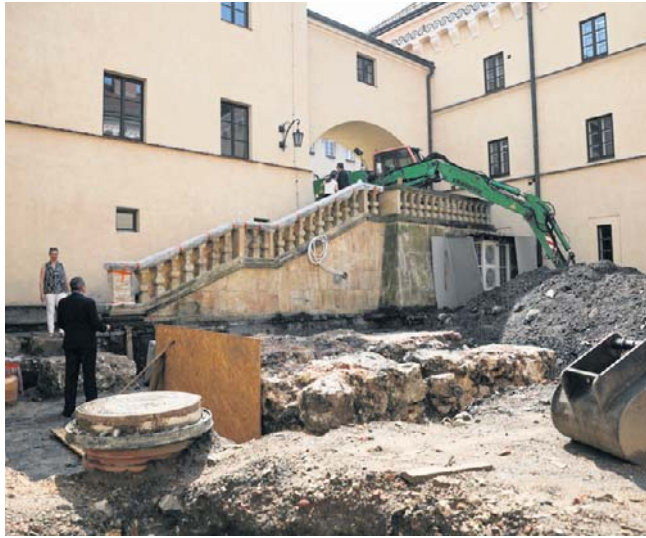
Trwa remont i przebudowa Muzeum Archeologicznego w Krakowie a przy okazji są kolejne ciekawe odkrycia

Anna Piątkowska anna.piatkowska@polskappress.pl