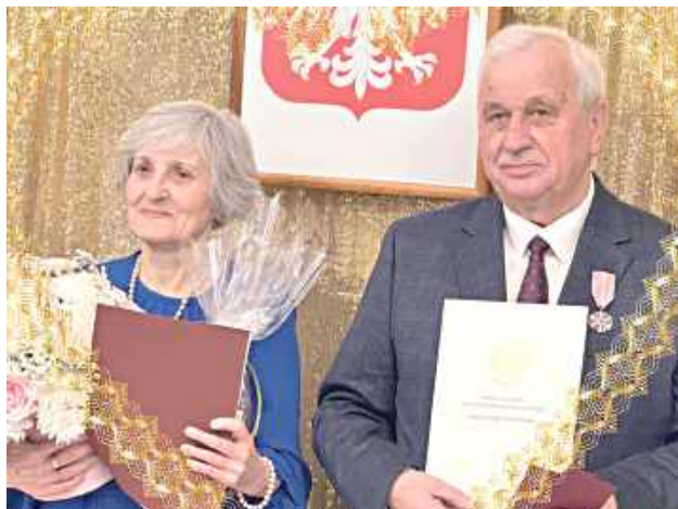
Fot. Starosta Iwona Kurowska / facebook.com