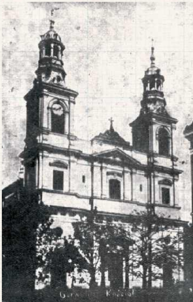
Kościół parafialny Przemienienia Pańskiego w Garwolinie w pierwszych latach XX wieku („Przegląd Katolicki”, 1936)

„Naród – Dodatek Ilustrowany”: „(...) a Misyjonarze mieli pojechać