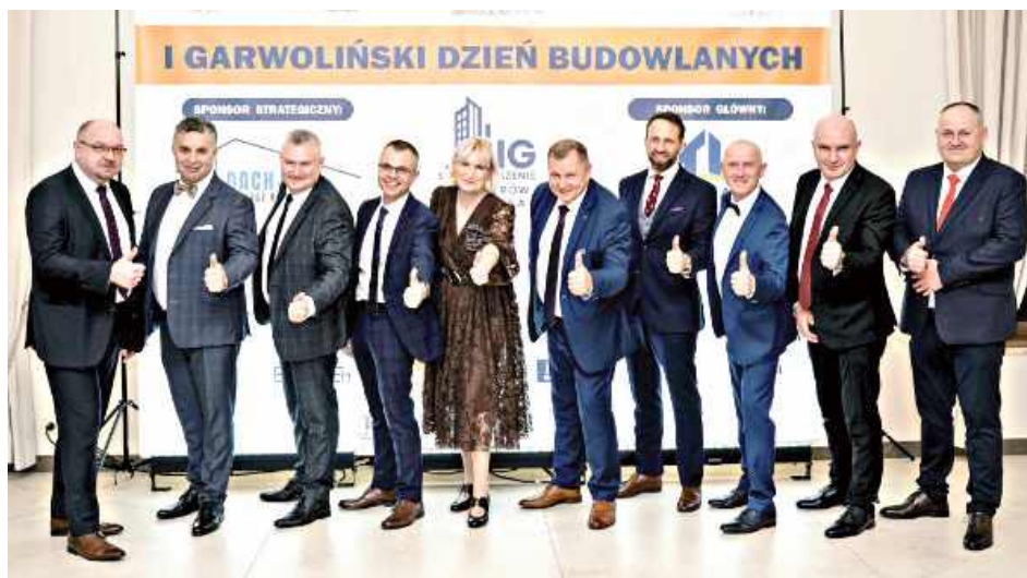
Część oficjalna wydarzenia miała miejsce w Centrum Sportu i Kultury w Garwolinie