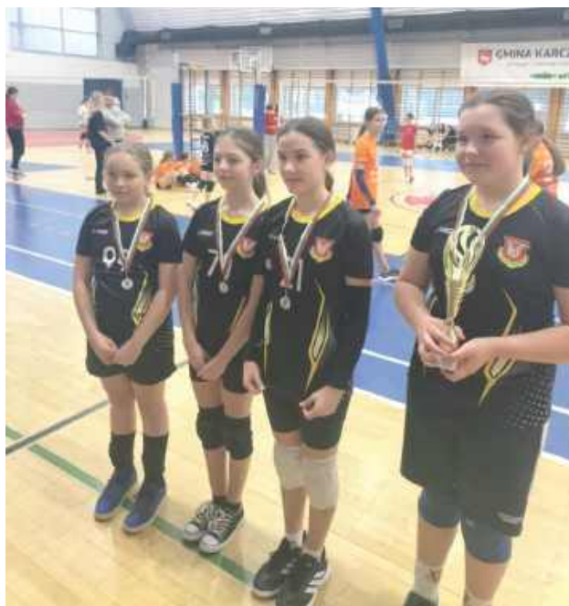
„Snajperki” wracają z Karczewa ze srebrem

Zawodniczki Snajpera Sośninka wybrały się na zawody do Karczewa organizowane przez lokalny zespół Mazura. Wszystko to w kategorii „trójek”. Zawody odbywały się w charakterze fazy grupowa-faza pucharowa. Zmagania w grupie „Snajperki” zaczęły bardzo dobrze. Ostatecznie wyszły ze swojej fazy eliminacyjnej na drugiej lokacie, ulegając tylko rywalkom z Mińska Mazowieckiego. To dało im awans do półfinału, gdzie czekały na nie gospodynie. Bardzo dobra, konsekwentna gra i pewne zwycięstwo z zawodniczkami Mazura pozwoliło pewnie awansować do finału. Tam czekał nas rewanż z przeciwniczkami z Mińska Mazowieckiego. W ostatnim spotkaniu dnia wszystko zaczęło się świetnie dla zespołu z Sośninki, który prowadził 1:0. Kolejne partie należały już jednak do rywali i w ostatecznym rozrachunku Snajperowi przypadło drugie miejsce. Dziewczyny z każdym treningiem i meczem pokazują coraz lepsze umiejętności. - Z treningu na trening,