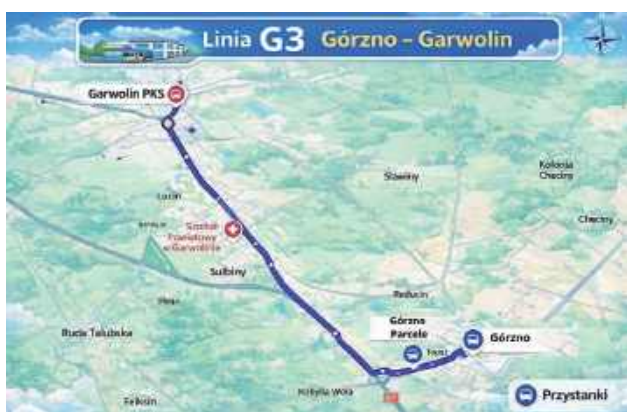
Nowe połączenia to dobra wiadomość dla mieszkańców gminy Górzno, którzy zyskają bardziej dostępny i regularny transport do Garwolina

Z opublikowanego rozkładu jazdy wynika, że autobusy z Górzna do Garwolina będą odjeżdżać o 7.10, 8.10 oraz 15.10. Kursy powrotne z Dworca Autobusowego w Garwolinie do Górzna zaplanowano na 14.40 oraz 15.40. Jak zapowiada urząd gminy, to dopiero początek zmian. Od 1 kwietnia na tej samej trasie mają pojawić się