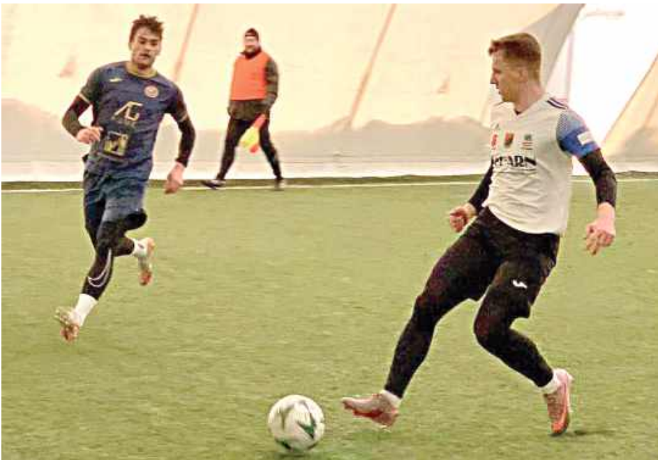
Wilga ma za sobą dwa kolejne sparingi. Obydwa wygrane

Dwa mecze - dwie wygrane. Tak kończy się ten weekend dla Wilgi, który został mocno zmieniony przez kłopoty organizacyjne Świdniczanki Świdnik.