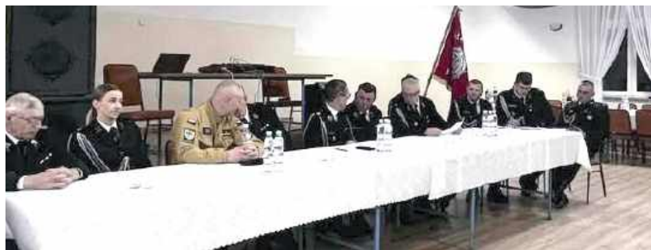
30 stycznia w Ochotniczej Straży Pożarnej w Starym Miastkowie odbyło się Walne Zebranie Sprawozdawczo-Wyborcze

Podczas zebrania członkowie OSP zapoznali się ze sprawozdania-