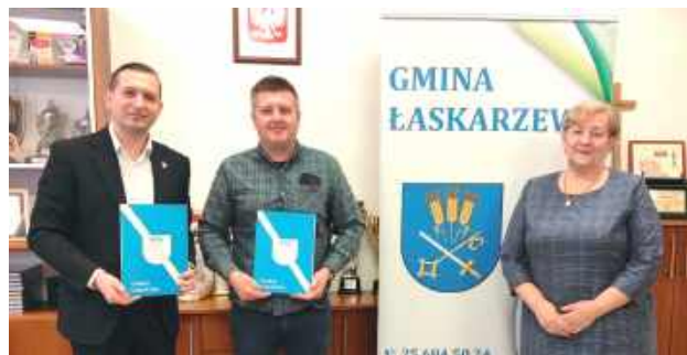
Gmina otrzymała 100 proc. dofinansowania kosztów netto z Krajowego Planu Odbudowy

Wartość inwestycji wynosi 4 457 880,39 zł – gmina otrzymała 100 proc. dofinansowania kosztów netto z Krajowego Planu Odbudowy, w ramach projektu B3.1.1 „Inwestycje w zrównoważoną gospodarkę wodno-ściekową na terenach wiejskich”. Dzięki temu przedsięwzięcie jest w pełni finansowane i nie obciąża budżetu mieszkańców.