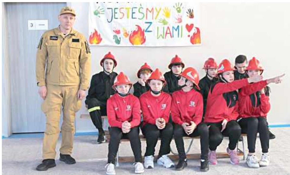
1 lutego hala sportowa przy Szkole Podstawowej w Żelechowie wypełniła się energią i dopingiem licznie zgromadzonych kibiców

1 lutego hala sportowa przy Szkole Podstawowej w Żelechowie wypełniła się energią i dopingiem licznie zgromadzonych kibiców.