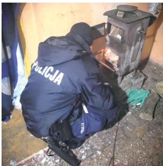
Do Komendy Powiatowej Policji w Mławie wpłynęło anonimowe zgłoszenie dotyczące osoby przebywającej w pustostanie

Do Komendy Powiatowej Policji w Mławie wpłynęło anonimowe zgłoszenie dotyczące osoby przebywającej w pustostanie. Ze względu na skrajnie trudne warunki atmosferyczne