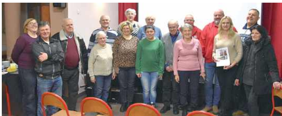
Celem organizacji społecznej Stowarzyszenie „Wołyński Rajd Motocyklowy” jest „pamięć o ofiarach rzezi wołyńskiej w taki sposób, by pozostała w naszej świadomości, ale by nie stała się powodem nienawiści i uprzedzeń - bowiem nie o zemstę, lecz o pamięć wołającą ofiary”

wszystkim „Paczka kresowa” jest dla rodaków. W tym roku wysłaliśmy dwa busy, ponad 200 paczek z produktami, plus jeden bus luzem towarów do Domu Miłosierdzia Bożego w Gródku Podolskim do hospicjum. Staramy się to robić w taki sposób, żeby wszystko dotarło do najbardziej potrzebujących Polaków. Jak widać, mamy uniformy czerwone, zakładamy czerwone czapeczki i już jesteśmy Świętymi Mikołajami. Działamy z miejscowym księdzem, bądź z polskim stowarzyszeniem. Zostawiamy paczki, a resztę przekazujemy księdzu, żebyśmy nie musieli tam spędzać dwóch czy trzech tygodni - mówił pan prezes.