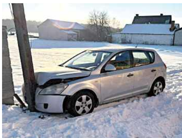
Jak poinformował zespół prasowy KPP Garwolin, mężczyzna był trzeźwy i jechał sam

2 lutego przed godziną 8 w Starym Żabieńcu (gm. Wilga) doszło do groźnie wyglądającego wypadku. Kierowca osobowej Kia prawdopodobnie zasłabł za kierownicą, zjechał na pobocze, pokonał przydrożny rów i zatrzymał się na słupie energetycznym.