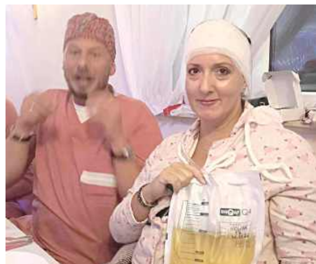
Gdy na jednej sali spotykają się siostry syjamskie, lekarze poza nocnym dyżurem i bohaterowie z zupełnie innych światów, wiadomo, że nie jest to zwykły wieczór