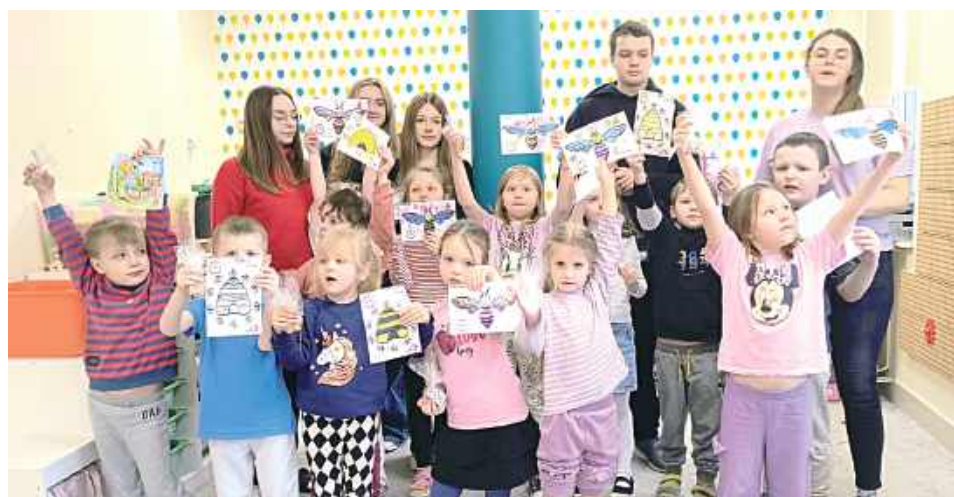
Szczególnym wydarzeniem była wizyta w Przedszkolu „Junioerek” w Garwolinie 13 stycznia

Uczniowie Zespołu Szkół nr 1 im. Bohaterów Westerplatte w Garwolinie realizują projekt edukacyjno-społeczny Bee Quest, którego celem jest zwiększenie świadomości na temat roli pszczół i innych zapylaczy oraz promowanie postaw proekologicznych.