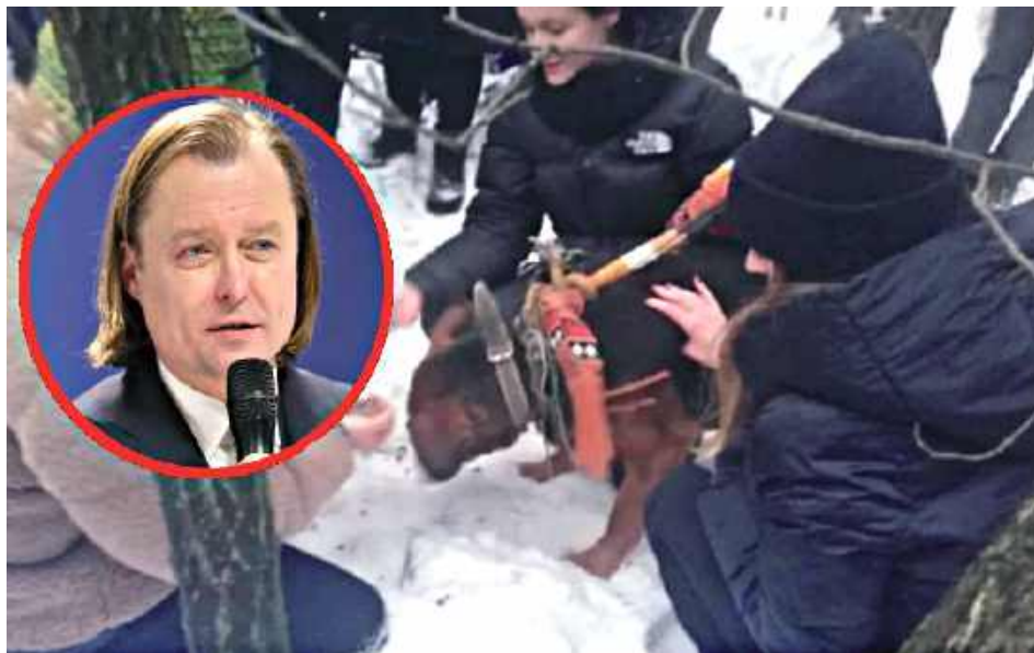
Wojewoda mazowiecki zareagował na sygnały dotyczące schroniska w Sobolewie już pod koniec listopada 2025 r.

W 2025 r., do listopada, wpłynęły dwa sygnały (w czerwcu i lipcu, w tym jeden anonimowy), które zgodnie z kompetencjami zostały niezwłocznie przekierowane do