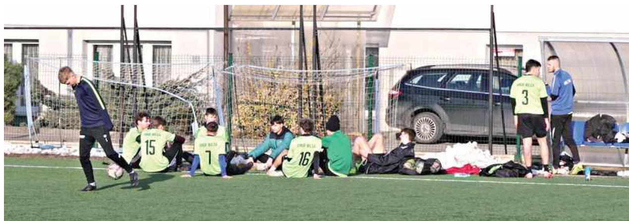
Amur Wilga poniósł pierwszą porażkę tej zimy. Uznał wyższość Mazura II Karczew

Amur Wilga zdecydowanie najszybciej rozpoczął przygotowania do sezonu. W kontrze do rywali ligowych, którzy dopiero wznawiają treningi, oni mają za sobą już trzy sparingi. Pierwsze dwa padły łupem Wilżan, którzy najpierw po hokejowym rezultacie pokonali Płomień Dęba Wielkie, a niedługo później rozprawili się ze Zrywem Sobolew, triumfując 3:1. Kolejny oponentem był Mazur II Karczew, który obecnie okupuje przedostat-