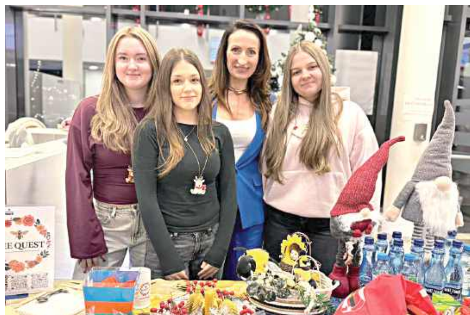
Projekt Bee Quest objęty jest Patronatem Merytorycznym i Instytucjonalnym Pasieki „Zdrowy Miód – Mitura”

Projekt aktywnie uczestniczył także w życiu miasta – członkowie Bee Quest wzięli udział w rozświetleniu choinki przed Starostwem Powiatowym w Garwolinie oraz w spotkaniu mikołajkowym dla