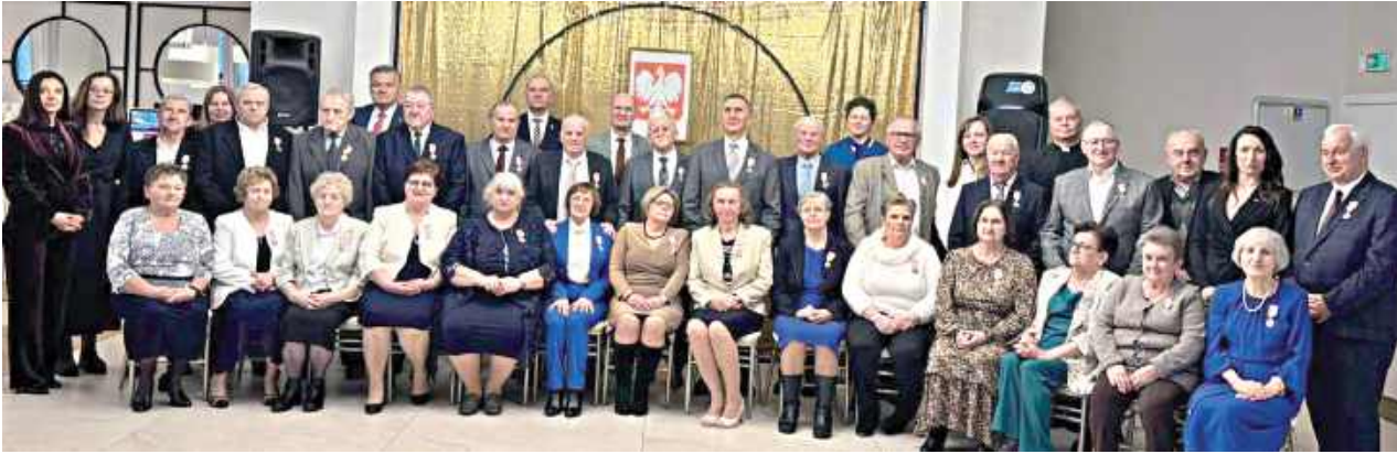
4 lutego w Gminie Garwolin odbyła się niezwykła uroczystość – 14 par małżeńskich świętowało Złote Gody

4 lutego w gminie Garwolin odbyła się niezwykła uroczystość – 14 par małżeńskich świętowało Złote Gody, czyli pół wieku wspólnego życia pełnego miłości, wytrwałości i wzajemnego szacunku. To wyjątkowe spotkanie pełne wzruszeń, radości i wspomnień przypomniało wszystkim, że prawdziwa miłość to codzienna troska, rozmowa i oddanie – a pięćdziesiąt lat razem to świadectwo siły uczuć, które przetrwają każdą próbę czasu.