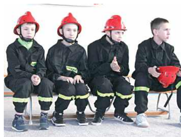
Młodzi zawodnicy rywalizowali na wymagającym torze sprawnościowym, pokazując nie tylko doskonałą kondycję fizyczną, ale także wiedzę, precyzję i umiejętność współpracy