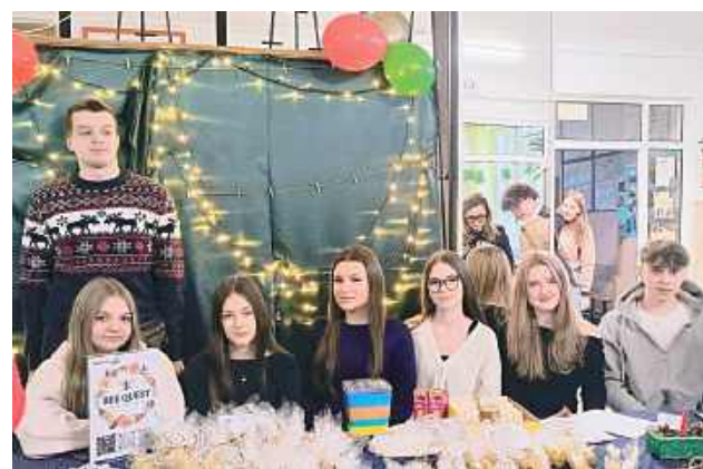
Projekt aktywnie uczestniczył także w życiu miasta