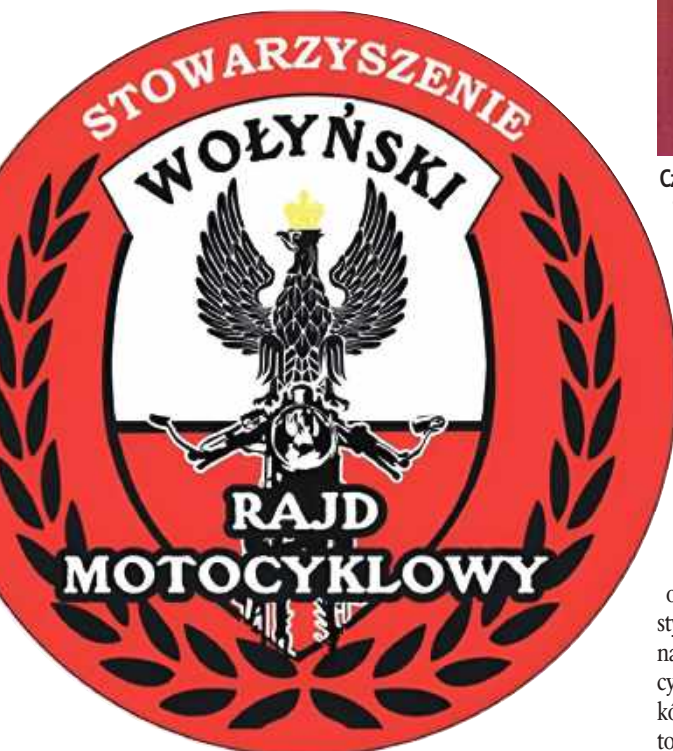
Członkowie Stowarzyszenia zabiegają, aby wydarzenia sprzed lat nie zostały zapomniane. Otaczają także opieką naszych rodaków, którzy do dziś mieszkają na Wołyniu, posługują się ojczystą mową i nierzadko żyją w skrajnym ubóstwie

Paczki stanowią bardzo istotną formę zapomogi dla kresowiaków. Są one bardzo konkretne, gdyż każda z nich zawiera niemal 10 kilogramów produktów żywnościowych. Nasi rodacy na Wołyniu oprócz tego, że spotykają się z polskością, to otrzymują solidne wsparcie, gdyż na Ukrainie emerytura wynosi - w przeliczeniu