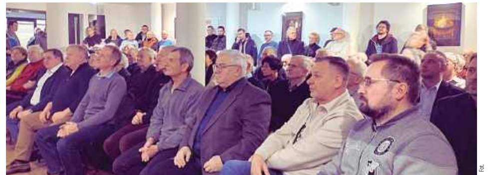
W wydarzeniu, zorganizowanym przez Klub Gazety Polskiej w Garwolinie, wzięło udział około 200 mieszkańców miasta i regionu