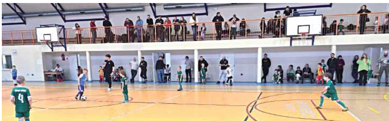
Amur Wilga wystawił dwa zespoły swoich skrzatów

W Woli Łaskarzewskiej odbył się fantastyczny turniej dla chłopców i dziewczynek z roczników 2019 i 2020. Doskonale znany z organizacji turniejów Snajper Sośninka kolejny raz stanął na wysokości zadania. Zmagania podzielono na grupę zieloną, grającą od 8 do 11.45 oraz czerwoną, która grała od 12 do 14. Komplet uczestników prezentował się następująco: Grupa zielona: Snajper Sośninka, Grom Trojanów, Sęp Żelechów, Sokół Kołbiel, Promnik Łaskarzew, Orzeł Parysów Grupa czerwona: Snajper Sośninka, Progres Garwolin, Amur Wilga Zieloni, Amur Wilga Czerwoni,