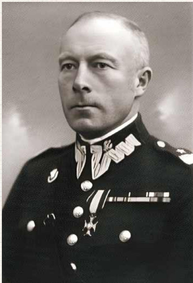
Gen. bryg. Kazimierz Łukoski był więźniem sowieckiego obozu w Starobielsku. Przyszedł na świat 13 września 1890 roku w majątku Sokół w powiecie garwolińskim

Od 22 marca 1917 roku służył w 2. pułku piechoty. 3 czerwca tego samego roku otrzymał skierowanie na stanowisko adiutanta gen. Feliksa von Bartha w Inspekcji Wyszukania Polskiej Siły Zbrojnej. W 1917 roku przydzielony do Polskiego Korpusu Posiłkowego oraz II Korpusu Polskiego w Rosji.