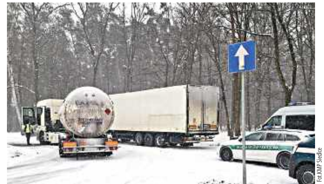
Celem prowadzonych działań jest kontrola przewozu drogowego materiałów niebezpiecznych, w tym towarów podlegających rejestracji w systemie SENT

W środę, 4 lutego na terenie Siedlec i powiatu siedleckiego policjant Komendy Miejskiej Policji w Siedlcach przeprowadza kontrole pojazdów transportujących towary niebezpieczne, działając wspólnie