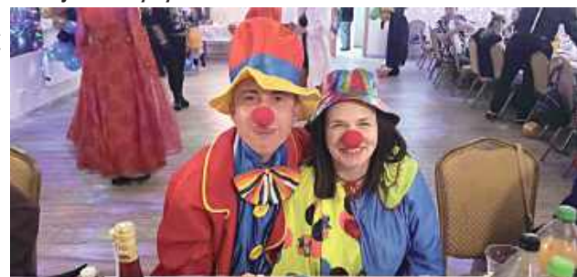
Na parkiecie pojawiły się m.in. księżniczki z bajkowych królestw, piraci rodem z Karaibów, szejki z Emiratów Arabskich, a także klauni