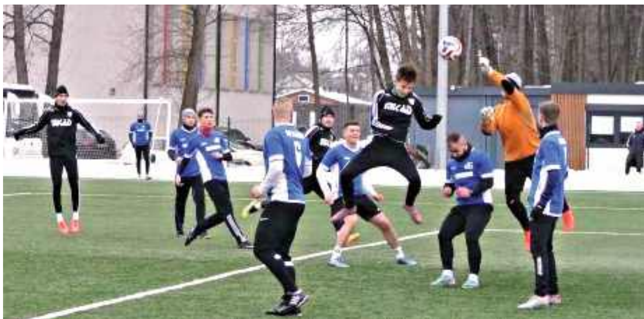
To był sparing dwóch różnych potęg. W pierwszej dominował Ruch, w drugiej Sęp