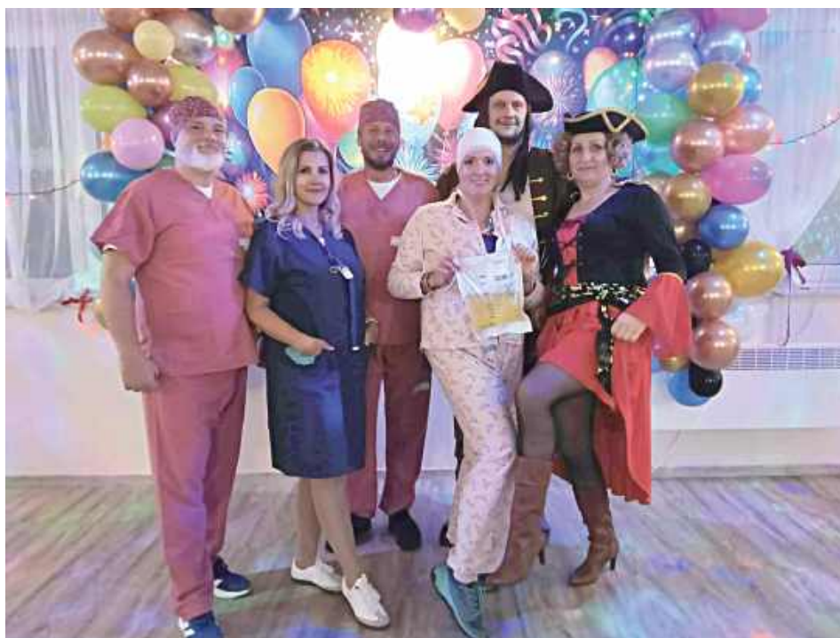
To był niezapomniany wieczór!

Motywy przewodnim balu były stroje karnawałowe, a goście z dużym zaangażowaniem podjęli wyzwanie wcielenia się w rozmaite postaci. Na parkiecie pojawiły się m.in. księżniczki z bajkowych królestw, piraci rodem z Karaibów, szejki z Emiratów Arabskich, a także klauni, którzy – jak żartobliwie podkreślali uczestnicy – „uciekli z przejeżdżającego przez miejscowość cyrku”. Nie zabrakło również humorystycznych akcentów nawiązujących do codziennych tematów. Na balu