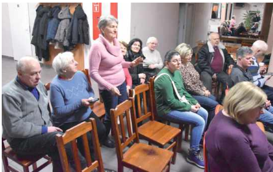
W piątek, 6 lutego o godzinie 18.30 w Domu Pracy Twórczej „Bajka” w Łaskarzewie odbyło się spotkanie miłośników Kresów przybliżające działalność Stowarzyszenia „Wołyński Rajd Motocyklowy”

- My działamy czternaście lat. Ideą Stowarzyszenia, jeżeli chodzi o paczki, jest to, aby dotarły do właściwych odbiorców. Przede