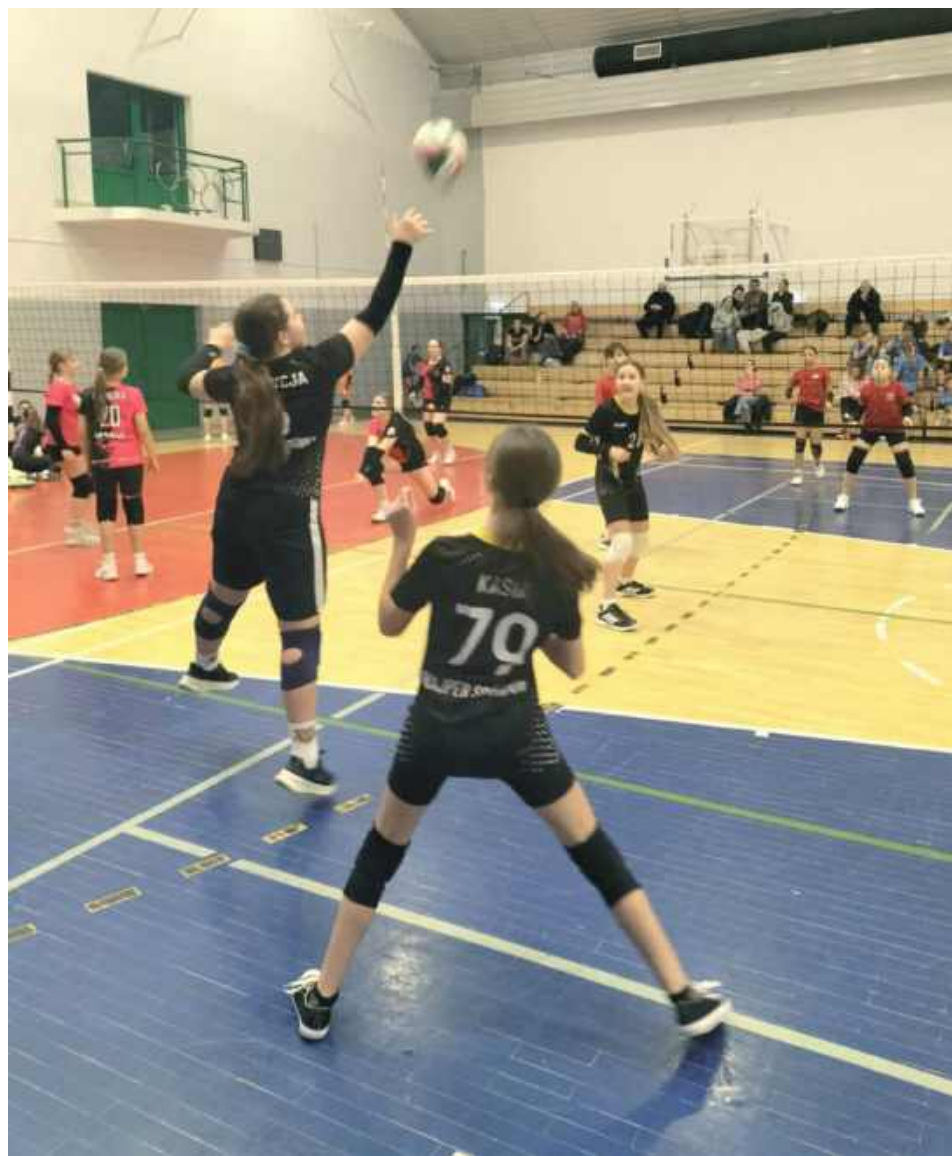
Młode siatkarki z Sośninki nie tylko zdobyły srebro, ale także pokazują coraz lepszą grę