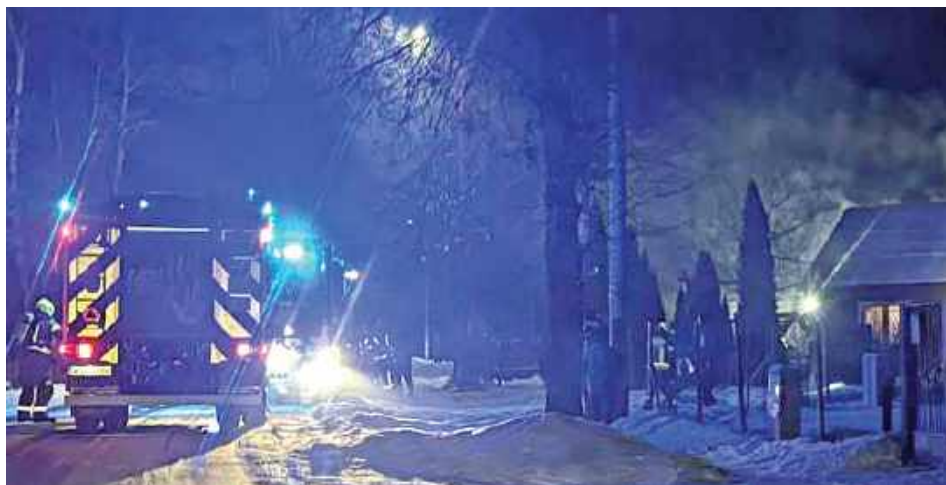
Akacja gaśnicza trwała około dwóch godzin. W działaniach brały udział cztery zastępy straży pożarnej

Działania strażaków polegały na zabezpieczeniu oraz oświetleniu miejsca zdarzenia, a następnie podaniu jednego prądu wody, co doprowadziło