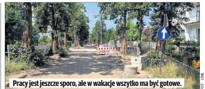
Pracy jest jeszcze sporo, ale w wakacje wszystko ma być gotowe.

Na wyremontowanej ul. Biegańskiego zaprojektowano wyniesione skrzyżowania, które przez to, że są wyżej niż przylegające jezdnie, zwiększą bezpieczeństwo ruchu zmuszając kierowców do zwol-