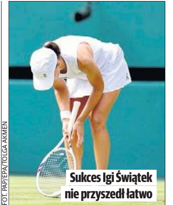
Sukces Igi Świątek nie przyszedł łatwo

Piotrkowianin Kamil Majchrzak wygrał z rozstawionym z numerem 30. chilijskim teni-