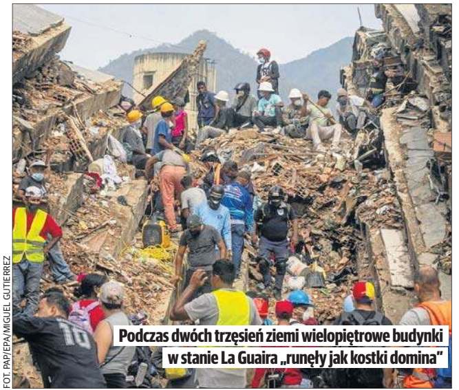
Podczas dwóch trzęsień ziemi wielopiętrowe budynki w stanie La Guaira „runęły jak kostki domina”

Oficjalny bilans ofiar śmiertelnych trzęsień ziemi z 24 czerwca przekroczył we wtorek 1,9 tys., a ponad 10,5 tys. osób jest rannych. Eksperti oceniają, że liczba zabitych może znacznie wzrosnąć. ONZ szacowała liczbę zaginionych na ponad 50 tysięcy.