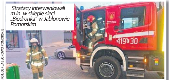
Strażacy interweniowali m.in. w sklepie sieci „Biedronka” w Jabłonowie Pomorskim

Jeśli takie objawy pojawiają się w mieszkaniu, zwłaszcza