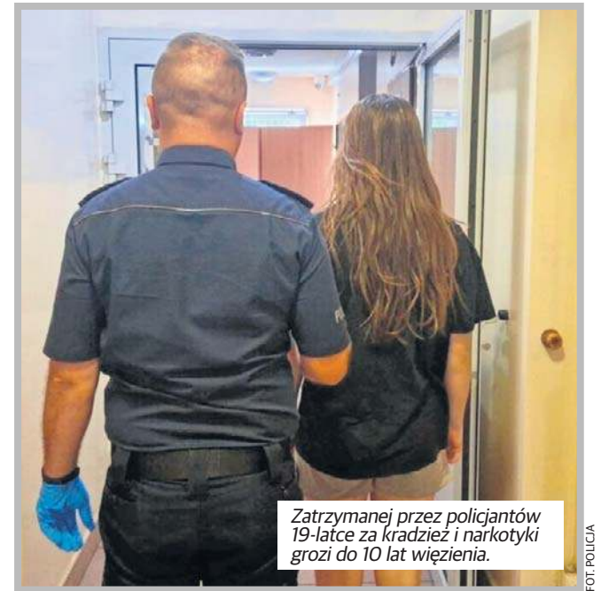
Zatrzymanej przez policjantów 19-latkę za kradzież i narkotyki grozi do 10 lat więzienia.

Wprawdzie 25-latek uciekł, ale nie zdołał skutecznie się ukryć. Policjanci złapali go 26 czerwca na ul. Zgierskiej w Konstancynowie. Był zaskoczony i nie stawiał oporu. Ratusiom z Biedronki za kradzież grozi do 5 lat więzienia. Jednak nastolatka wpadła w znacznie większe tarapaty, bo posiadanie znacznych ilości narkotyków zagrożone jest karą do 10 lat pozbawienia wolności. Dlatego wobec niej prokurator zastosował dozór policyjny i zakaz opuszczania kraju.