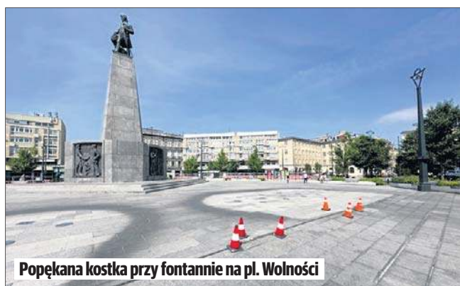
Popękana kostka przy fontannie na pl. Wolności