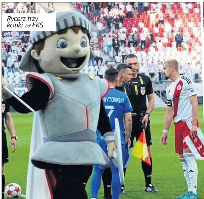
Ryccerz trzy kciuki za ŁKS