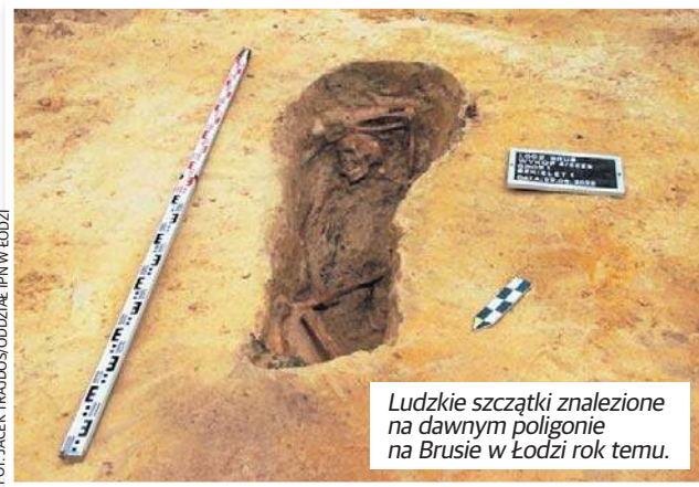
Ludzkie szczątki znalezione na dawnym poligonie na Brusie w Łodzi rok temu.