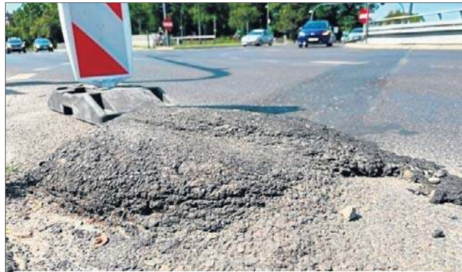
Urzednicy zapewniają, że groźna asfaltowa czapa zostanie usunięta.