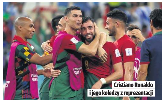
Cristiano Ronaldo i jego koledzy z reprezentacji