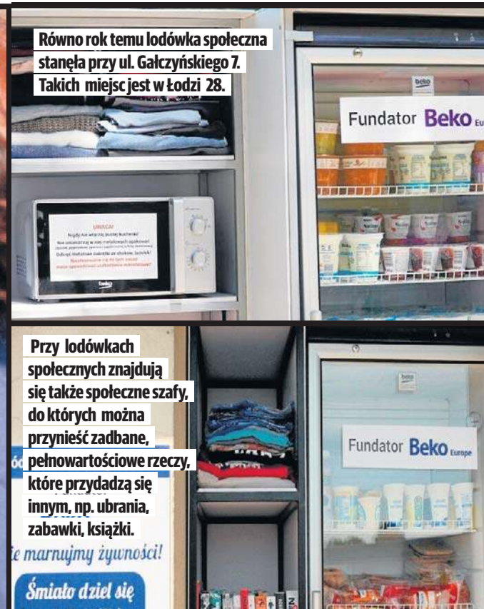
Równo rok temu lodówka społeczna stanęła przy ul. Galczyńskiego 7. Takich miejsc jest w Łodzi 28.