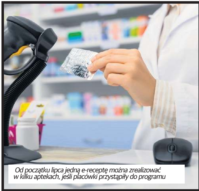
Od początku lipca jedną e-receptę można zrealizować w kilku aptekach, jeśli placówki przystąpiły do programu

Jak poinformowała wiceszefowa Ministerstwa Zdrowia, już w pierwszym dniu zainteresowanie nowym narzędziem jest ogromne.