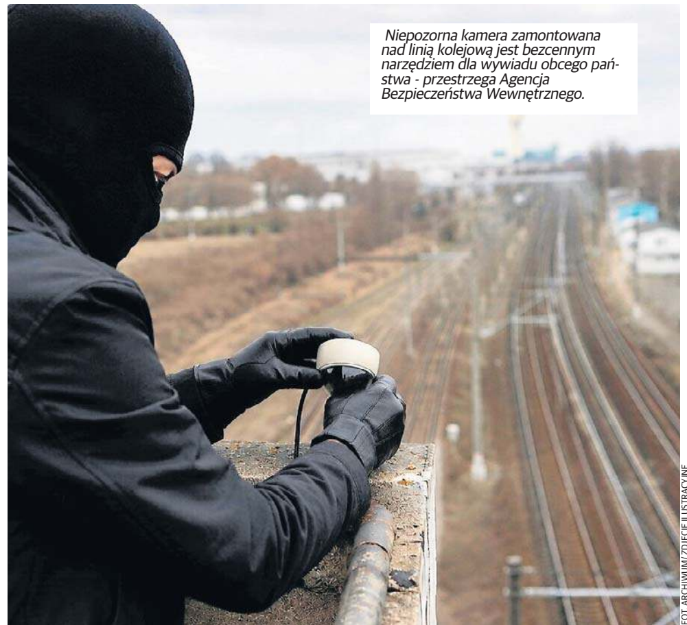
Niepozorna kamera zamontowana nad linią kolejową jest bezcennym narzędziem dla wywiadu obcego państwa - przestrzega Agencja Bezpieczeństwa Wewnętrznego.

Raportowane przez media dane pokazują skalę problemu. W ciągu dwóch lat 2024-2025 wszczęto w Polsce tyle postępowań kontrwywiadowczych dotyczących działalności Rosji i Białorusi, ile wcześniej przez ponad trzy dekady. To sygnał, że zagrożenie przestało być teoretyczne.