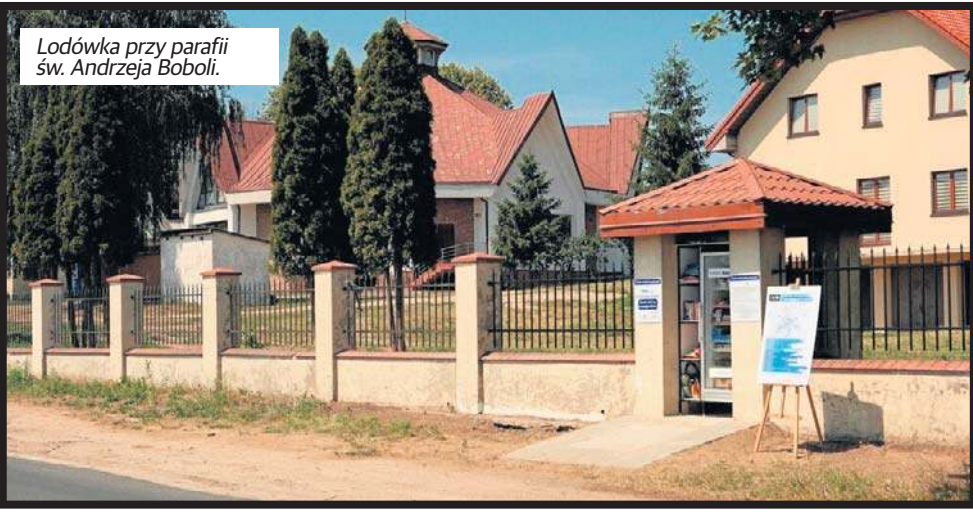
Lodówka przy parafii św. Andrzeja Boboli.

Do lodówek społecznych i jadłodzielni nie powinny trafić m.in. artykuły z jakimikolwiek oznakami zepsucia, np. nadgnicia, pleśni czy nietypowego zapachu, a powinny być to produkty, które osoba dzieląca się nimi chciałaby zjeść. Niewskazane są ponadto wszystkie potrawy zawierające w swoim składzie surowe mięso, np. tatar lub surowe jajka, np. domowy majonez, ciasto z kremem.