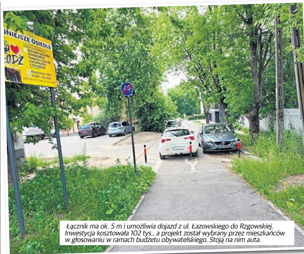
Łącznik ma ok. 5 m i umożliwia dojazd z ul. Łazowskiej do Rzgowskiej. Inwestycja kosztowała 102 tys., a projekt został wybrany przez mieszkańców w głosowaniu w ramach budżetu obywatelskiego. Stoją na nim auta.