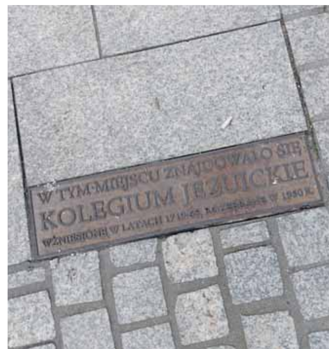
Tabliczka upamiętniająca Kolegium Jezuickie przy ul. Zamkowej