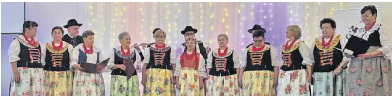
Zespół folklorystyczny Brynica świętował jubileusz 45-lecia działalności