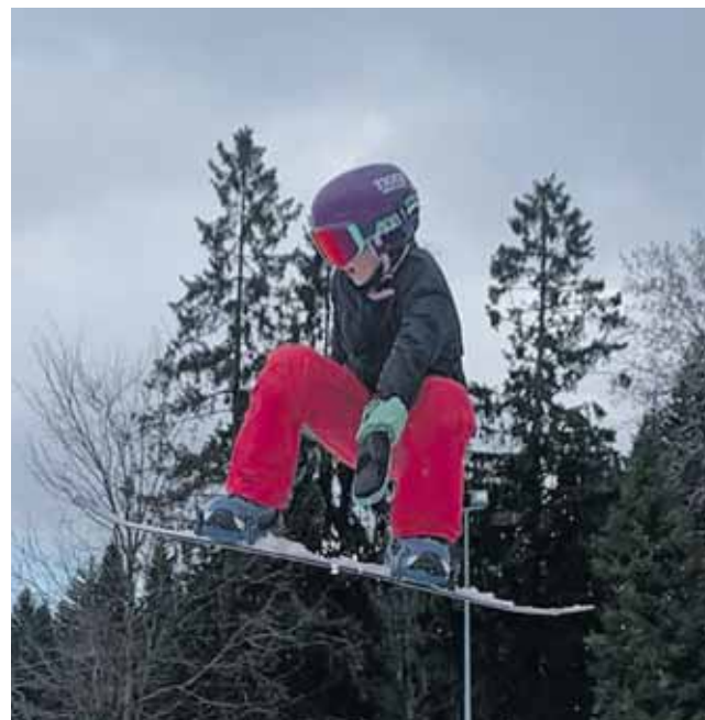
Życzymy dalszych sukcesów i odwagi w robieniu coraz trudniejszych tricków