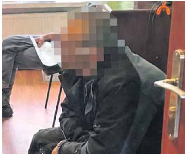
Początkowo podejrzany nie przyznawał się pracodawcy do kradzieży

43-latek został zatrzymany i usłyszał zarzut kradzieży. Mężczyzna przyznał się do popełnienia przestępstwa.