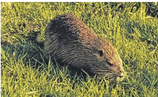
Żyjące w stawach w Zielonej nutrie są gatunkiem inwazyjnym, zagrażającym rodzimej florz i faunie