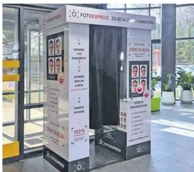
Lokalni fotografowie obawiali się utraty klientów i dlatego starostwo zrezygnowało z fotobudki

Sprawa wywołuje jednak dyskusję wśród mieszkańców. Do redakcji trafił list zwracający uwagę, że foto-