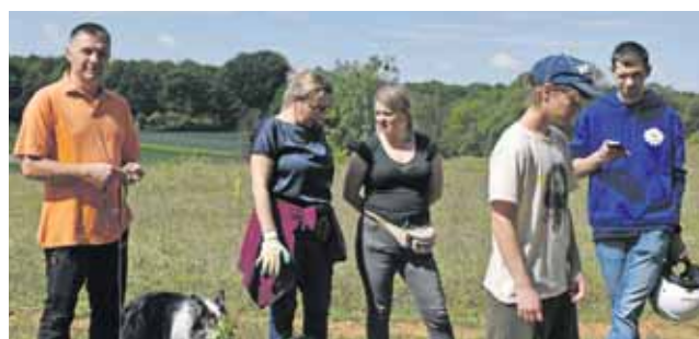
Było trochę przekazywania wiedzy, a potem praca

Oprócz popularyzacji wiedzy o murawie galmanowej