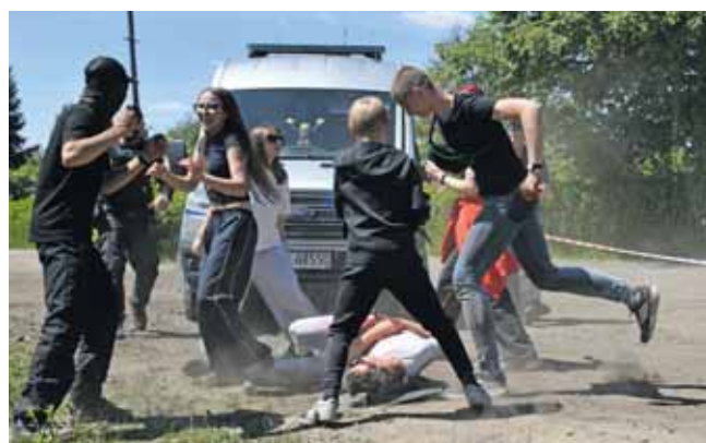
Bójka kibiców niedaleko przystanku kolei wąskotorowej

Do bardzo poważnego wypadku doszło na rynku w Tarnowskich Górach. Zderzyły się autobus miejski i śmieciarka. Było wielu rannych, niektóre osoby nie dawały oznak życia. Do tego w auto-