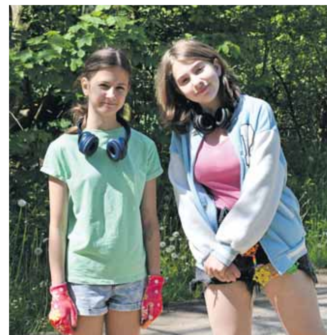
W akcji wzięło udział sporo młodych ludzi