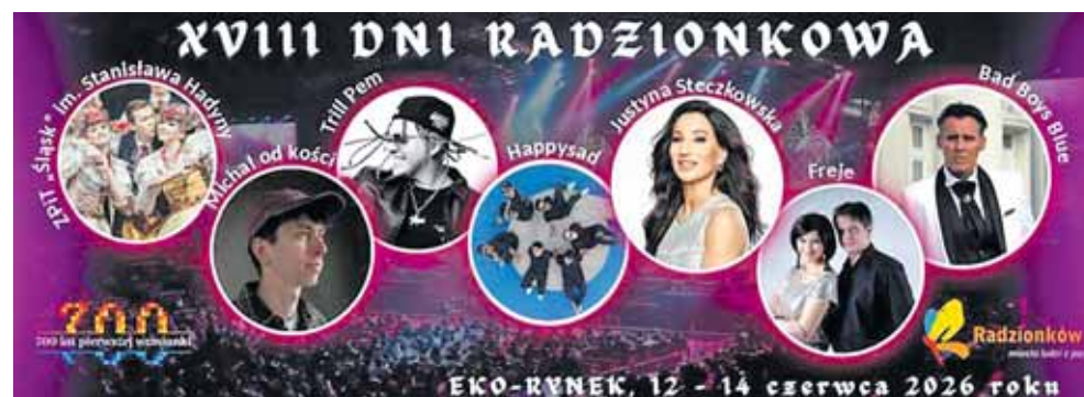
Śląsk, Steczkowska, Happysad i inni wystąpią w nadchodzący weekend w Radzionkowie

O godz. 17 zaplanowano koncert Michała od Kości. Chwilę później na scenie pojawi się Trill Pem – raper i autor tekstów, który łączy hip-hop z melodyjnymi i emocjonalnymi brzmieniami. Gwiazdą sobotniego wieczoru będzie zespół Happysad.