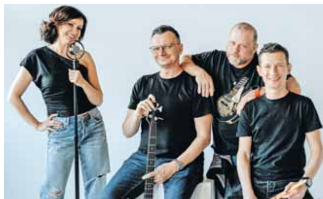
Organizatorzy zapraszają na zabawę taneczną z zespołem The Neighbors

21.30 – Zabawa taneczna z zespołem The Neighbors.