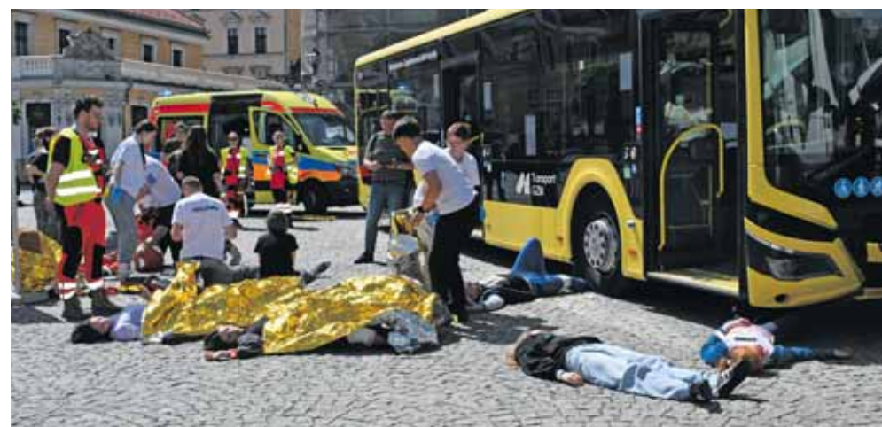
Na rynku była scenka wypadku masowego, zderzenia autobusu miejskiego ze śmieciarką

W parku kamiliańskim kobieta szukała syna, którego tylko na chwilę straciła z oczu. Była w panice. Do akcji ruszył