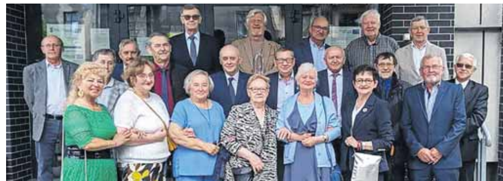
Złoci maturzyści to absolwenci klasy V tm – technik mechanik o specjalności obróbka skrawaniem

Złoci maturzyści to absolwenci klasy V tm – technik mechanik o specjalności obróbka skrawaniem. Egzamin dojrzałości zdawali w 1976 r.