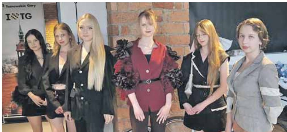
Finalistki konkursu dla młodych projektantów

Motywy przewodnim były industrialne przestrzenie Tarnowskich Gór oraz kolorystyka nawiązująca do historii miasta. Dominowały odcienie brązu i szarości, obowiązkowy element projektowanych kreacji. Projekty łączyły nowoczesne spojrzenie na modę z inspiracjami zaczerpniętymi z przemysłowego charakteru regionu.