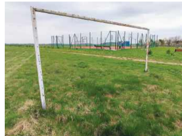
Teren po dawnym boisku w Książcach został częściowo zagospodarowany i powstał tam nowoczesny plac sportowo-rekreacyjny (widoczny w głębi), na którym często można spotkać lokalną młodzież

Potwierdzeniem tego, że historia lokalnych klubów była bogata świadczyć mogą stare, przeważnie nieczynne boiska. Przed kilkoma dekadami były one niemal w każdej wsi. Nawet jak nie było w niej klubu, to było często boisko, na którym młodzież kopała piłkę. Dziś więk-