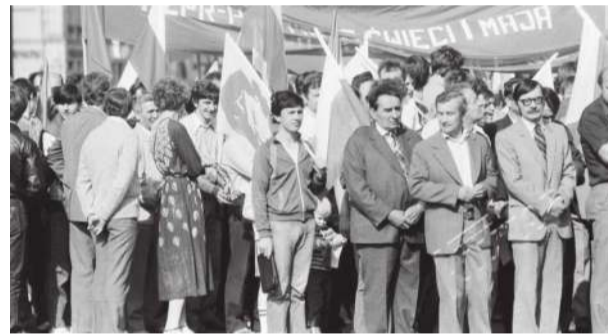
Mieszkańcy z nostalgią wspominają pochody pierwszomajowe.

– Pochody mi się podobały. Tym bardziej, że płacono za udział w uroczystościach. Przykładowo za trzymanie flagi z Leninem lub Marksem w parku dostawało się pięćdziesiąt złotych. Dziś