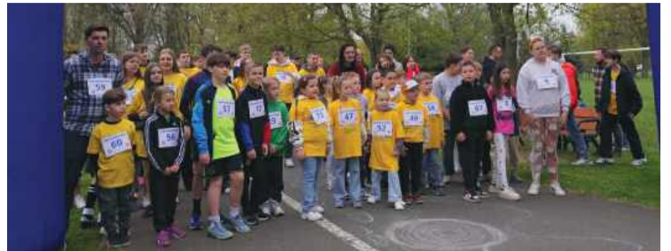
W biegu charytatywnym udział wzięło ponad 80 uczestników

więcej, ale coraz więcej osób jest chorych i coraz większe są potrzeby – dodała prezes Wanda Łuźna.