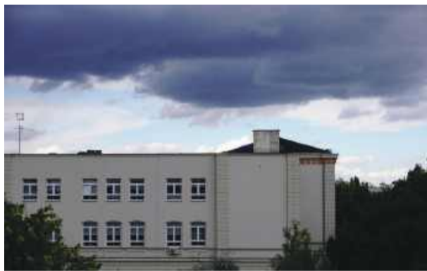
Budynek strzeleńskiego liceum podczas remontu dachu. sierpień 2025 r.

mowy z wykonawcą i spór z jego ubezpieczycielem. Pierwotnie firma nie chciała wypłacić środków z tego ty-