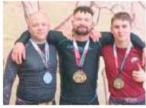
Zawodnicy Boi Team Strzelin