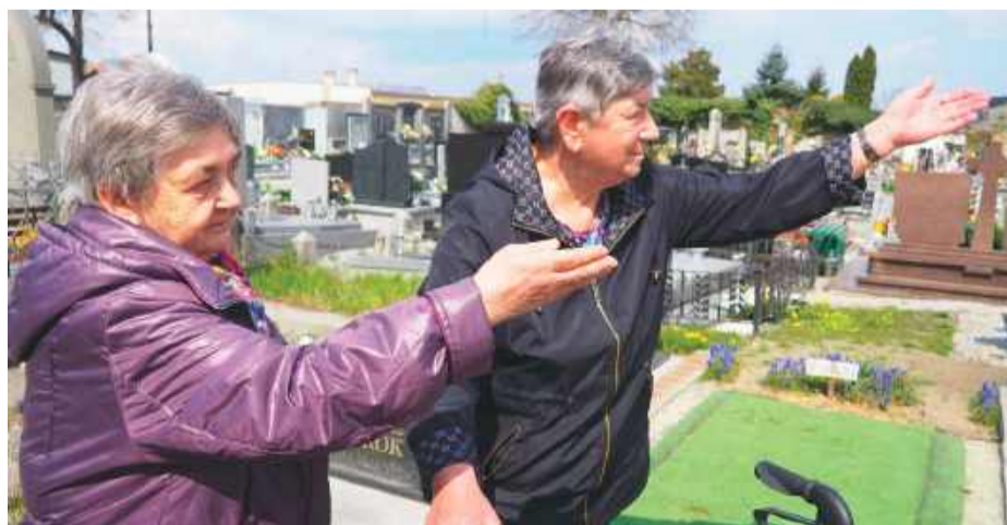
Seniorzy pokazują maszt z kamerami, który znajduje się na środku cmentarza