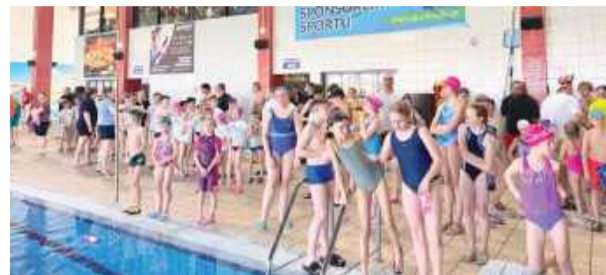
Dla wielu młodych pływaków był to pierwszy start w życiu