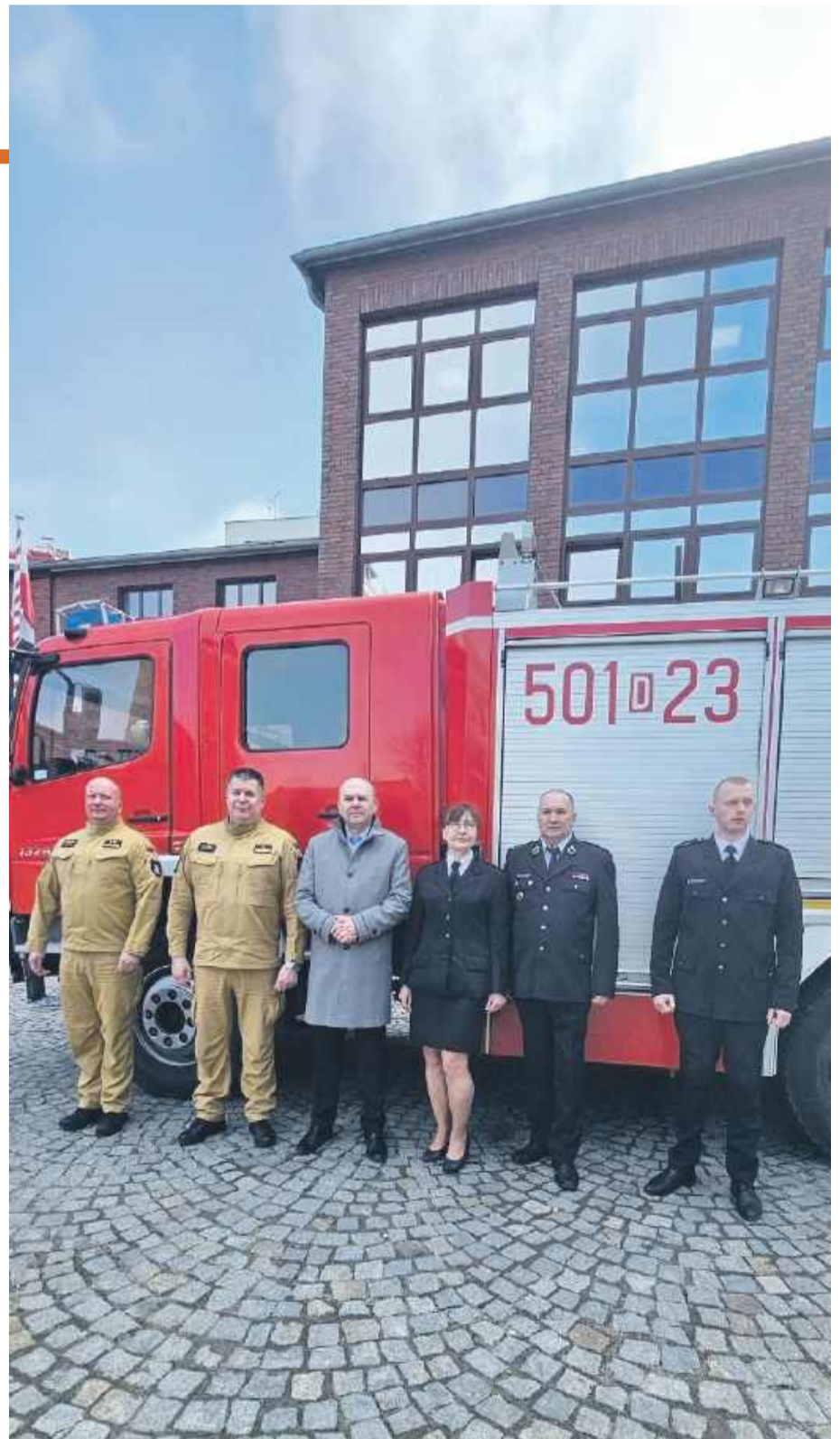
Uroczyste przekazanie kluczyków odbyło się w siedzibie Komendy Wojewódzkiej Straży Pożarnej we Wrocławiu