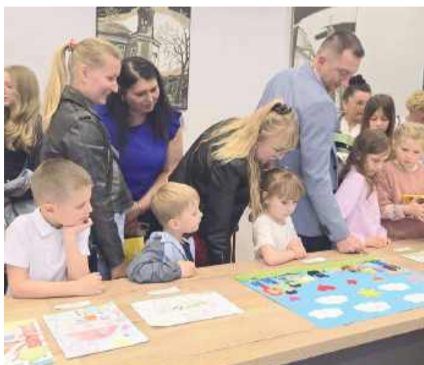
Podczas finału, w którym uczestniczyły dzieci wraz z rodzicami i najbliższymi, można było oglądać nadesłane prace.