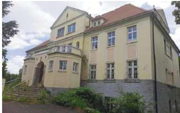
Pałac w Górcu. lipiec 2020 r.

w tym momencie jest tam zamontowany monitoring. Padła też informacja, że Powiatowy Zarząd Dróg będzie działał w nowym wyremontowanym obiekcie już od 1 maja. Maszyny i sprzęt będą stały w gara-