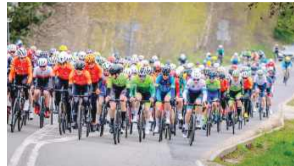
Kolarski peleton przejechał przez nasz region

trasie prowadzącej przez Podgaj, Karczyn, Kondratowice, Prusy, Czerwień, Kowalskie oraz Żelowice. Na trasie nie zabrakło kibiców, którzy dopingowali zawodników, tworząc świetną atmosferę. Nad bezpieczeństwem czuwali strażacy z jednostek OSP, zabezpieczając przejazd