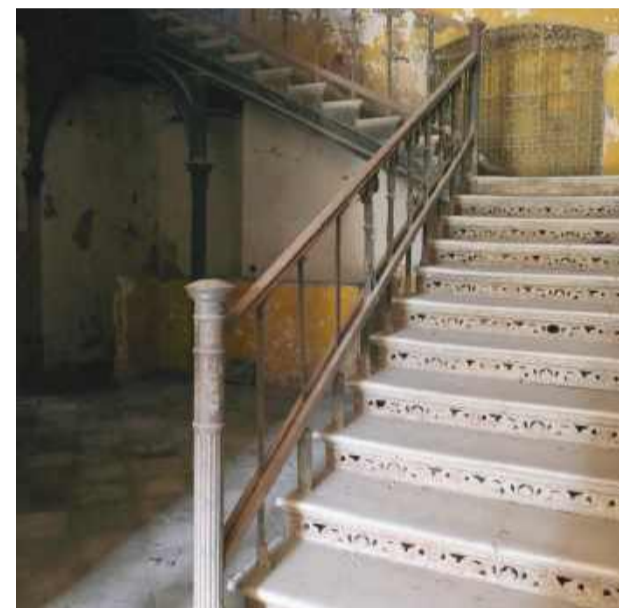
Klatka schodowa, która pamięta czasy dawnej świetności tego miejsca