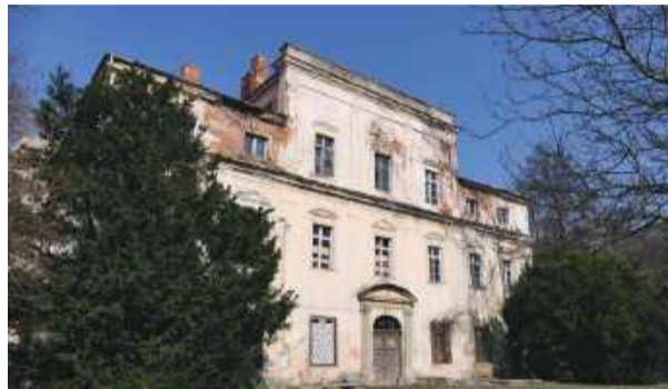
Pałac w Żelowicach szuka nowego właściciela

w pałac. Od północy dobudowano dwukondygnacyjny trakt z drewnianą werandą, zwieńczony dwiema charakterystycznymi cylindrycznymi wieżami mieszczącymi klatki schodowe. Pałac nabrał wówczas najbardziej malownicze-