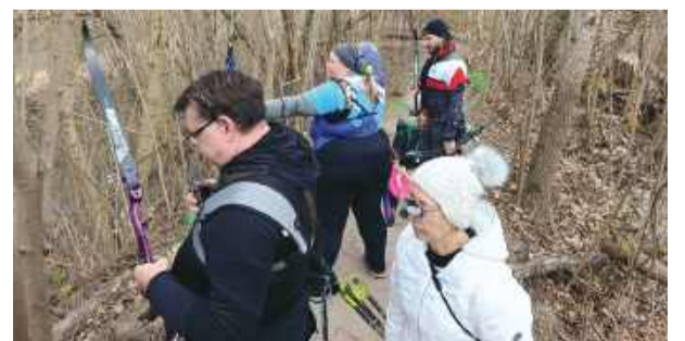
Zawody odbywały się w trudnym terenie