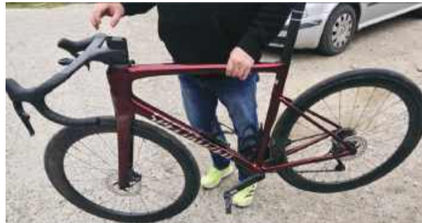
Zarówno rower, jak i nawigacja szybko wróciły do właściciela

Na zawodach kolarskich 20-latek ukradł rower. Uciekając przed radiowozem, prześcignął peleton. Złodziej jechał tak szybko, że wyprzedził główną grupę kolarzy i przez moment znajdował się w ścisłej czołówce. – Niemal stanął na podium – skomentowali to ironicznie policjanci.