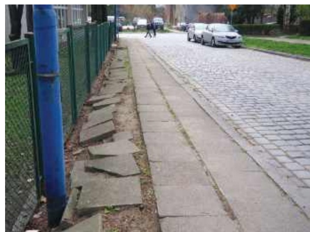
Zniszczony chodnik przy ul. Michała Archaniola w Strzelinie