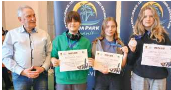
Najlepsze zawodniczki jednej z kategorii wiekowych

W dniach 14–15 kwietnia w Strzelinie rozegrano 8. turniej IV Międzyszkolnej Ligi Szachowej Powiatu Strzeńskiego. Wydarzenie zgromadziło młodych pasjonatów