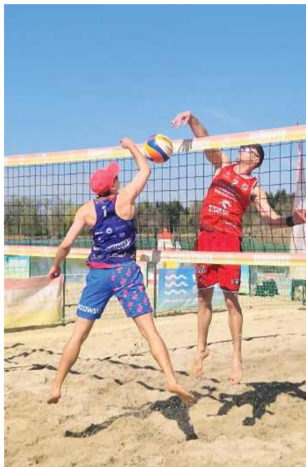
Siatkarze wrócili do Białego Kościoła

kę odbędzie się w Białym Kościele w dniach 2-3 maja. Wszystko wskazuje na to, że sezon siatkówki plażowej w powiecie strzelińskim