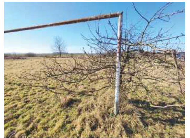
W Starym Wiązowie były nawet dwa boiska. Pozostałości jednego z nich widoczne są po lewej stronie, jadąc w kierunku Kowalowa. Dziś na bramce zamiast bramkarza stoi dzika jabłonka

szość tych obiektów to bardziej pastwiska (bez krów) niż miejsca, gdzie można pobiegać. Wymieniać można byłoby takie miejscowości bez końca. Zajrzyjmy choćby do gminy Wiązów, gdzie stare bramki znaleźć można (lub