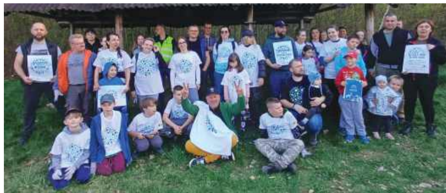
Pamiątkowe zdjęcie uczestników przy wiacie przy ul. Leśnej.

Jak podkreślają inicjatorzy, wydarzenie pokazało zaangażowanie mieszkańców i potwierdziło, że wspólne działania przynoszą wymierne efekty.