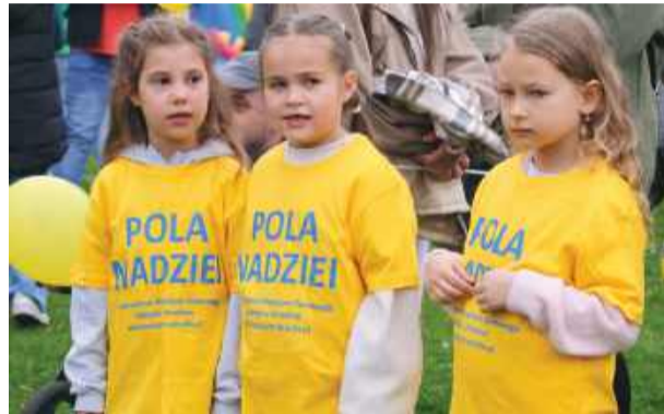
W akcję zaangażowali się także najmłodszy

Od lat wydarzenie gromadzi wielu uczestników, którzy chętnie niosą pomoc osobom potrzebującym i objętym opieką hospicyjną. Zebrane