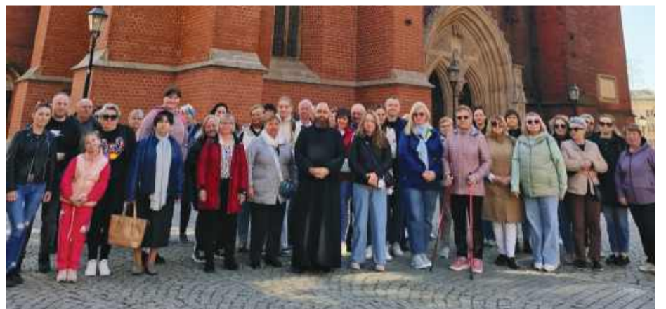
W pielgrzymce do Legnicy i Wrocławia uczestniczyło blisko 50 osób z parafii w Witowicach.

spodzianka. Grupa udała się do Wrocławia, gdzie zwiedziła Ostrów Tumski oraz katedrę. Uczestnicy mieli możliwość zobaczenia bocznych i tylnych kaplic