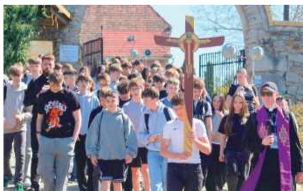
Pielgrzymi wyruszyli z kościoła parafialnego w Białym Kościele.

– Wydarzenie dla większości osób rozpoczęło się już na dworcu w Białym Kościele,