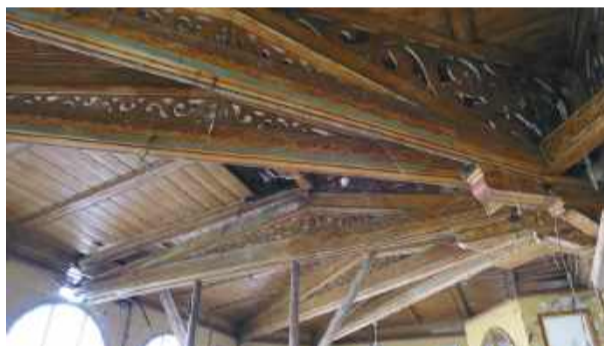
Bogato zdobiony drewniany sufit nad werandą