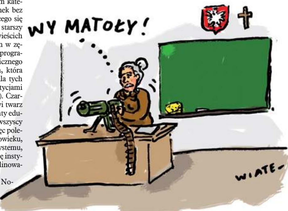
Rys. TOMASZ WIATER