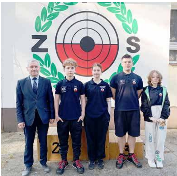
Zawodnicy TARCZY Goleniów z trenerem