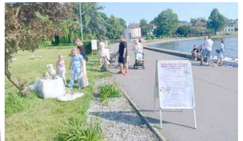
Mieszkańcy miasta bardzo chętnie zaglądali na wystawę Dwojaczka