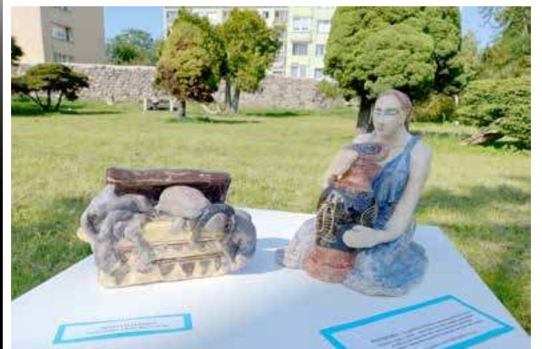
Mityczna Pandora i puszka, z której uwolniły się nieszczęścia