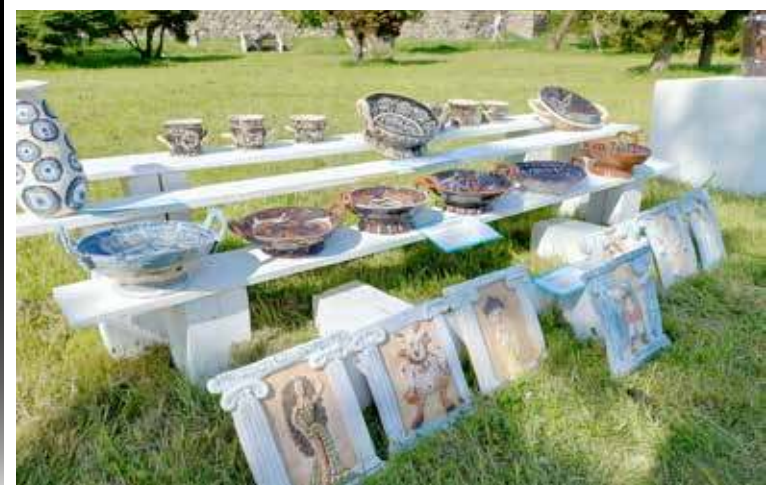
Naczynia w stylu greckim jak również prezentacja bóstw inspirowanych bajką Disneya