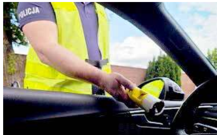
24-latek zanim zasiadł na miejscu kierowcy w pożyczonym samochodzie wypił aż 12 piw

- Zanim jednak funkcjonariusze dojechali w wskazane miejsce, niebezpieczną jazdę 24-latek przerwali czujni mieszkańcy, którzy uniemożliwili mu dalsze kierowanie pojazdem. Gdy patrol Policji przyjechał na miejsce, mężczyzna nie próbował uciekać ani zaprzeczać. Od razu się przyznał – podał swoje dane, oświadczył że to on kierował pojazdem, wcześniej wypił 12 piw i nie ma uprawnień do kierowania. Badanie alkoholem wykazało u niego 0,98