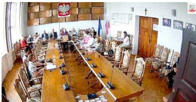
Ponad połowa miejsc przeznaczonych dla radnych w środę o godz. 9.00 pozostała pusta. To nieprzypadkowa sytuacja

Czym spowodowana była absencja części radnych? Nie da się