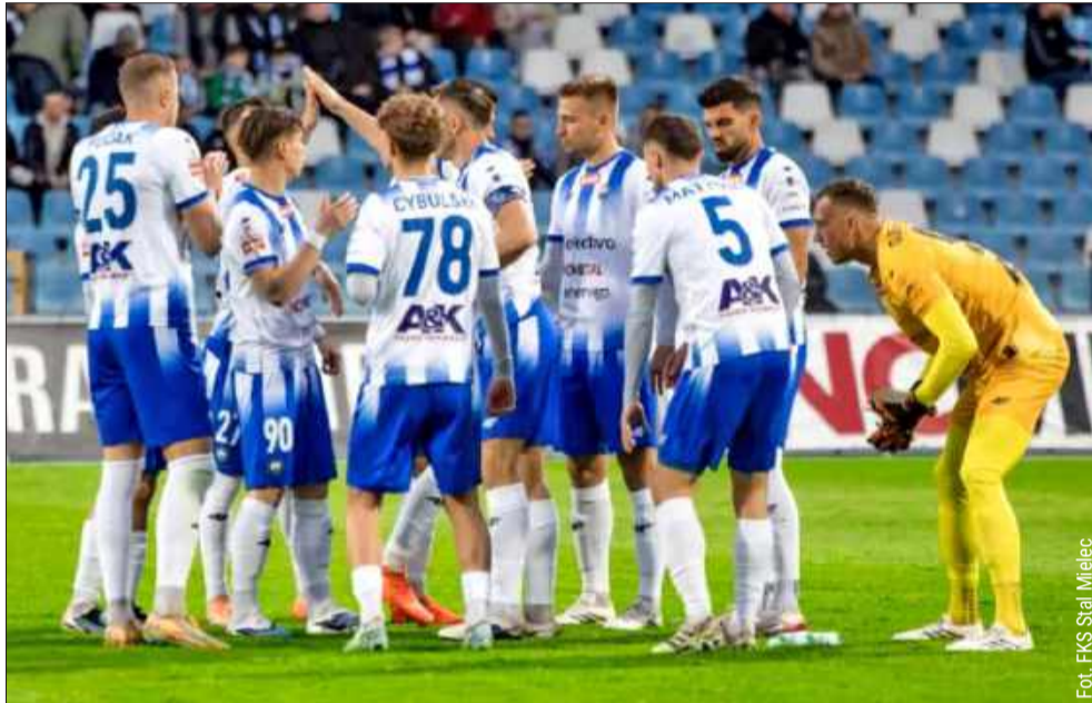
Mielczanie wygrali w Siedlcach.