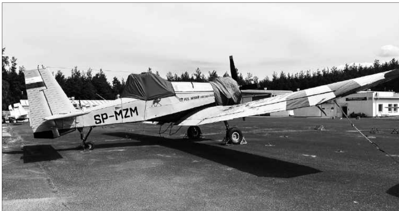
Taką maszyną latał zmarły pilot

Trzeba też pamiętać o ciężarze wody. Zrzut tak zwanej bomby wodnej oznacza wyrzucenie w ciągu około dwóch sekund mniej więcej połowy masy sa-