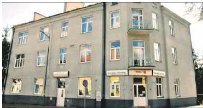
Dawna Bursa przy ul. Kościuszki.

Odpowiedź starosty Kazimierza Gacka pokazuje, że rozmowy na razie utknęły w miejscu. Z pism, które otrzymało mieleckie starostwo, wynika, że cała procedura została na ten moment wstrzymana na szczeblu ministerialnym.