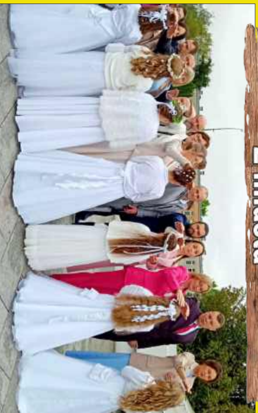
Pierwsza komunia św. dzieci z parafii pw. Duchła św.