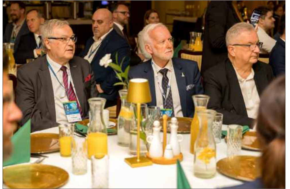
Uczestnicy gali mieli okazję zapoznać się z projektami przygotowanymi przez studenckie koła naukowe.