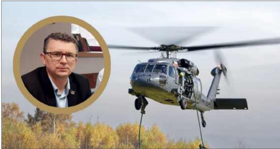
Sprawa SAFE jest szczególnie istotna dla Mielca, bo PZL od dekad jest jednym z najważniejszych tutejszych zakładów przemysłowych.

Sprawa jest szczególnie istotna dla Mielca, gdzie PZL od dekad są jednym z najważniejszych