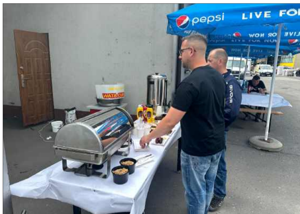
Atmosfera była gorąca!