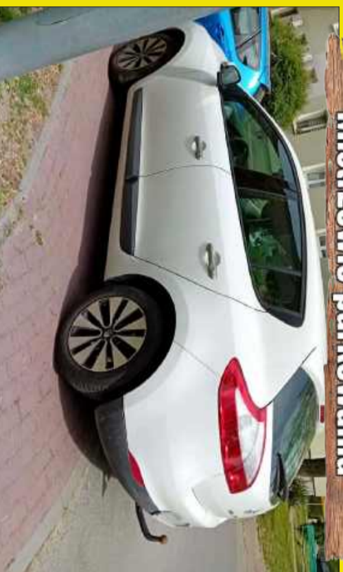
„Za zakrętem stali...”