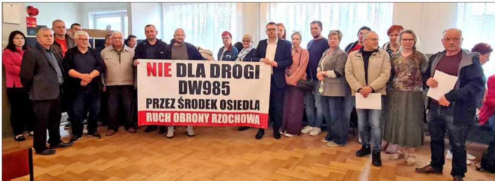
Trwa zbieranie podpisów wśród mieszkańców przeciw projektowi DW 985.

„Jako mieszkańcy tej części Mielca jesteśmy przerażeni, że wschodnia część Rzochowa,