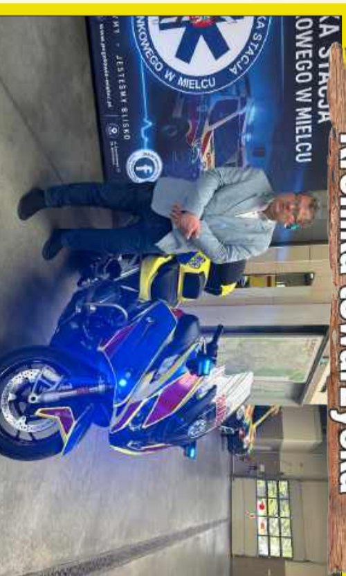
Starosta na drodze do naprawy służby zdrowia.