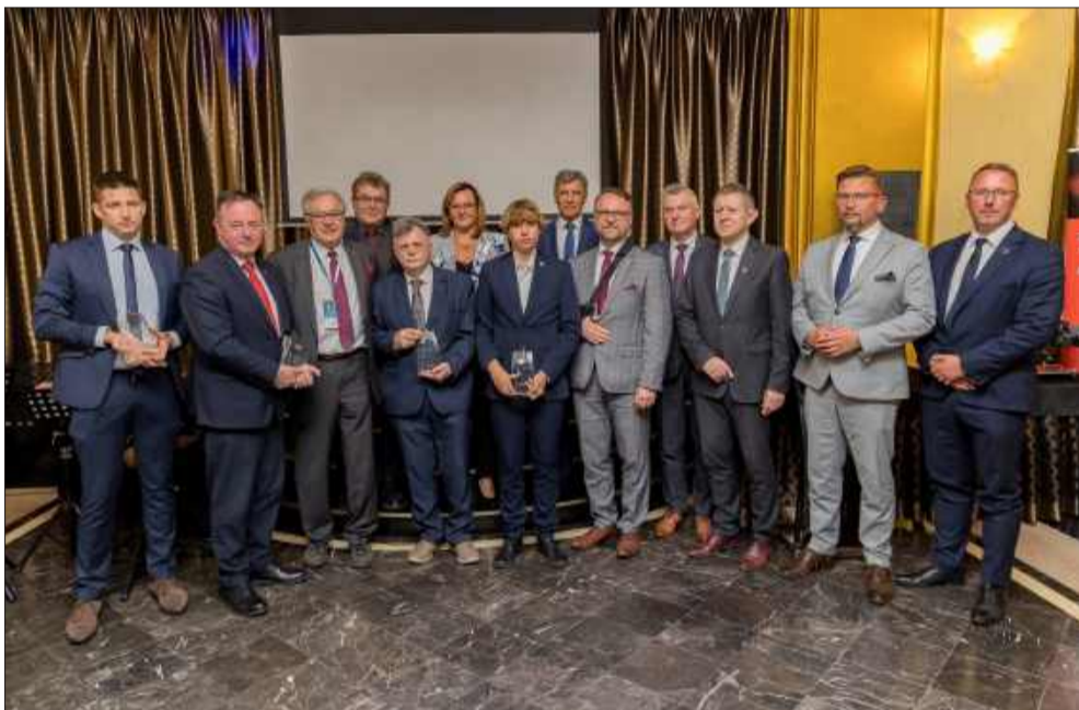
W tegorocznej edycji statuetki Leonardo przyznano w czterech kategoriach