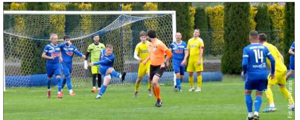
Radomyślanka (żółte stroje) okazała się lepsza od drużyny z Czermina.