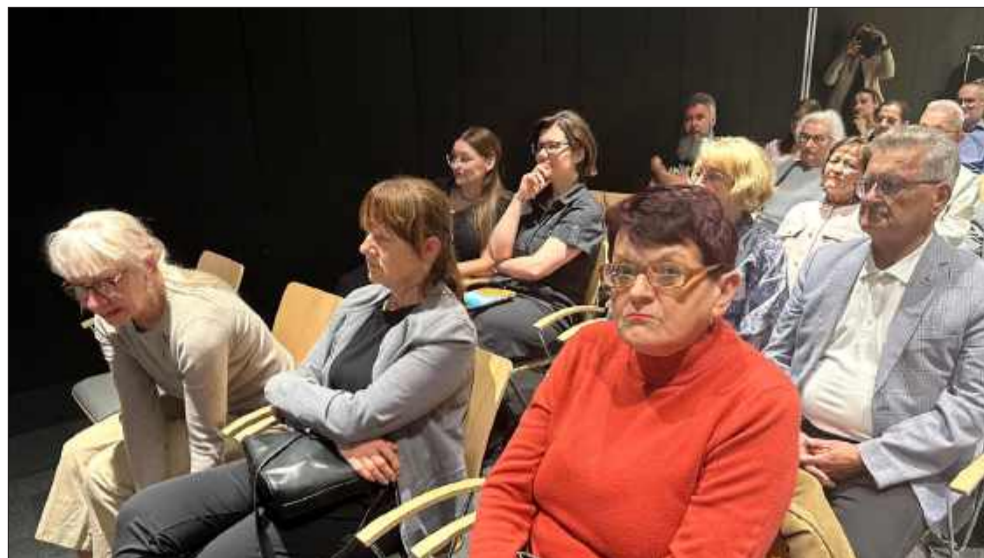
Widownia słuchała z zapartym tchem.

Spotkanie było nie tylko lekcją historii, ale też przykładem tego, jak można mówić o przeszłości w sposób ciekawy, żywy i przystępny. Widać było, że prelegent naprawdę kocha to, czym się zajmuje. To prawdziwy pasjonat, który potrafi zarazić słuchaczy zainteresowaniem historią - a takich wykładawców oby było jak najwięcej.