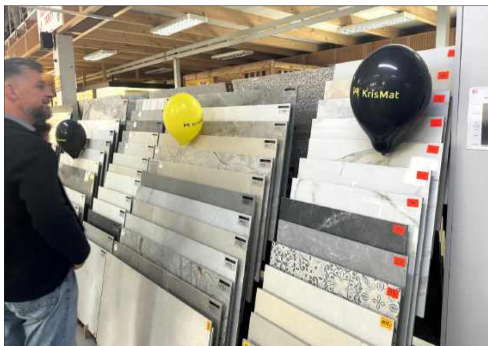
Który odcień wybrać?

cie sprzedaży domów. Goście mogli więc połączyć przyjemne z pożytecznym - skorzystać z poczęstunku, porozmawiać i przy okazji obejrzeć propozycje wyposażenia wnętrz. gj