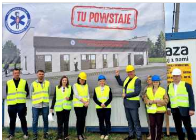
W ramach wizyty przedstawiciele ministerstwa zwiedzali podstację należącą do Podkarpackiej Stacji Pogotowia Ratunkowego.

W Podkarpackiej Stacji Pogotowia Ratunkowego w Mielcu odbyła się wizyta przedstawicieli Ministerstwa Zdrowia. Do Mielca przyjechały wiceminister zdro-