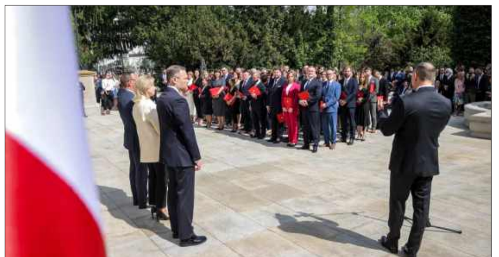
Prezydent Karol Nawrocki wręcza nominacje sędziowskie.