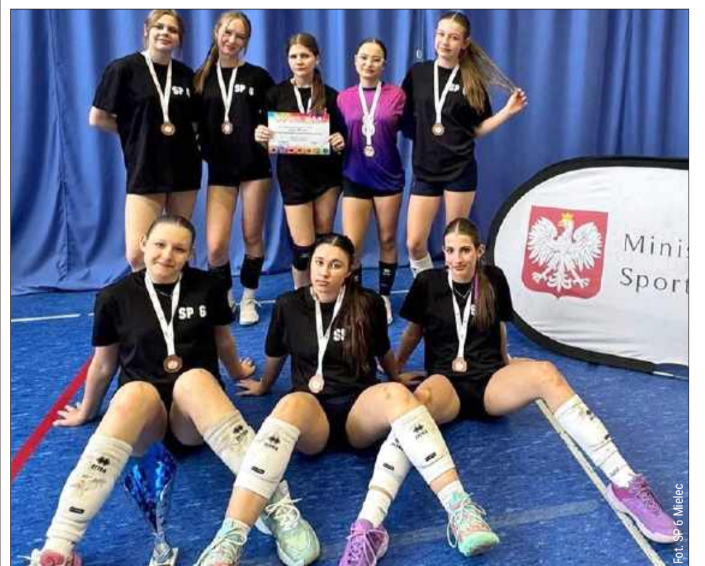
Siatkarki ze SP6 stanęły na podium turnieju wojewódzkiego.

Wojewódzki turniej mistrzowski dostarczył kibicom ogromnych emocji. Poziom tegorocznych zawodów na Podkarpaciu był niezwykle wysoki,