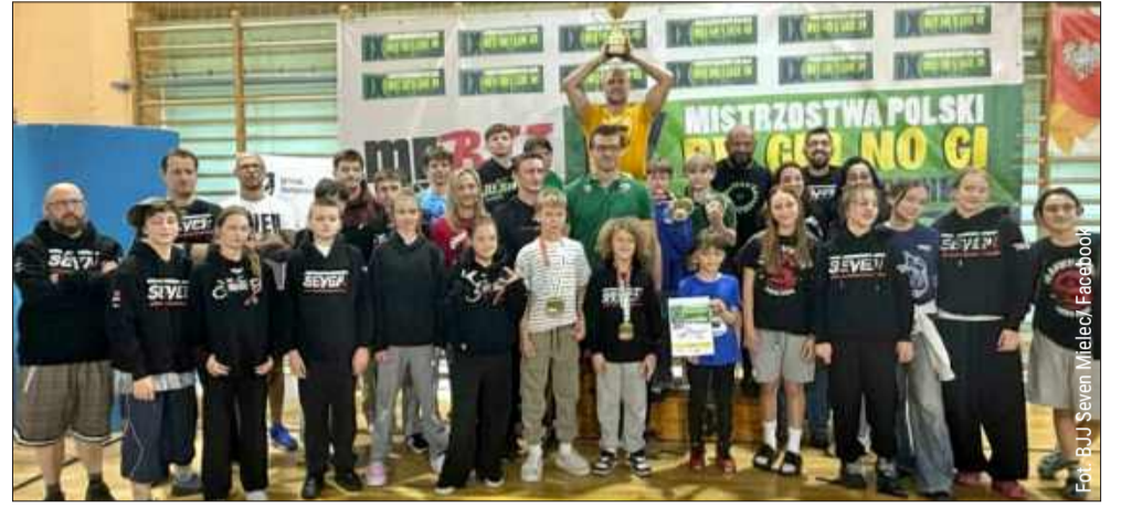
Zawodnicy BJJ Seven Mielec wystartowali w Mińsku Mazowieckim.

Zawodnicy BJJ Seven Mielec wzięli udział w IX Mistrzostwach Polski Brazylijskiego Jiu-Jitsu Dzieci i Młodzieży Gi & No Gi, które odbyły się w Mińsku Mazowieckim. Mielecka ekipa zakończyła zawody z dorobkiem 25 medali, a także istotnym wkładem w wysokie miejsce drużyny Dragon's Den Fight Club w klasyfikacji generalnej.