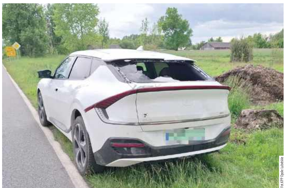
Cyklista nie zachował bezpiecznej odległości i najechał na tył osobówki, uderzając głową w tylną szybę i ją rozbijając

POWIAT OPOLSKI: 43-letni rowerzysta miał wielkie szczęście. Mężczyzna najechał na tył jadącej przed nim osobówki i głową uderzył w tylną szybę, rozbijając ją.