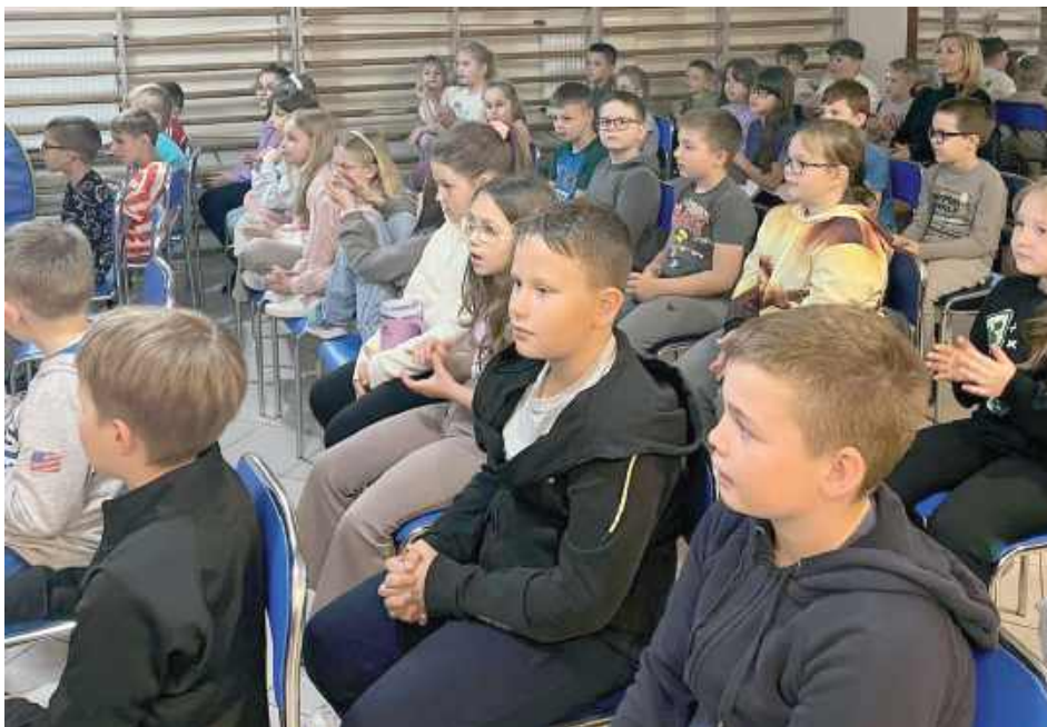
GR Podczas występu nie zabrakło dobrej zabawy i elementów humorystycznych

Podczas występu nie zabrakło dobrej zabawy i elementów humorystycznych, co pozwoliło dzieciom z klas I-II i grup przedszkolnych lepiej zapamiętać ważne treści. Spektakl odbył się w ramach Programu Profilaktyki Uzależnień „Wsparcie na Startie” - relacjonują przedstawiciele szkoły.