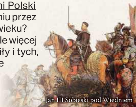
Jan III Sobieski pod Wiedniem

Odbierz książkę i poznaj o wiele więcej prorocत्व, które już się spełniły i tych, które na wypełnienie jeszcze czekają. Dowiedz się, jak odpowiedzieć na Boże wezwanie!