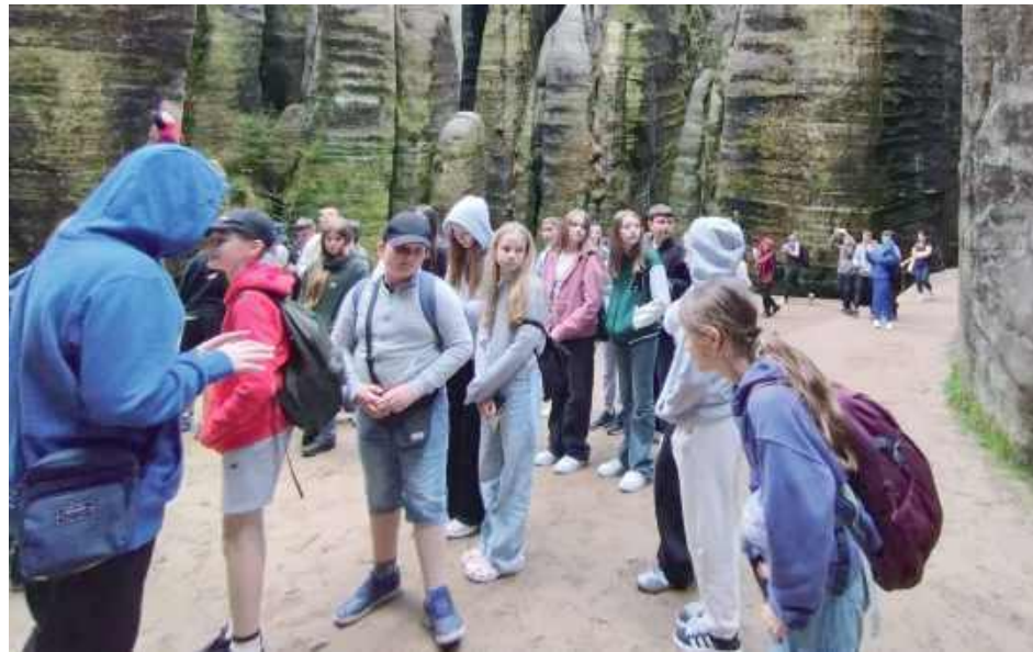
Trzeci dzień to wyjazd ADRŠPAŠKO-TEPLICKICH SKAŁ, czyli popularnego Skalnego Miasta

Pod przewodnictwem lokalnego eksperta odkrywaliśmy perły czeskiej stolicy. Podziwiliśmy Katedrę Świętego Wita na Hradczanach, spacerowaliśmy po słynnym Moście Karola, z którego rozpościerały się piękne widoki na Wełtawę i panoramę miasta. Nasz przewodnik zabrał nas również na Rynek Staromiejski z jego słyn-