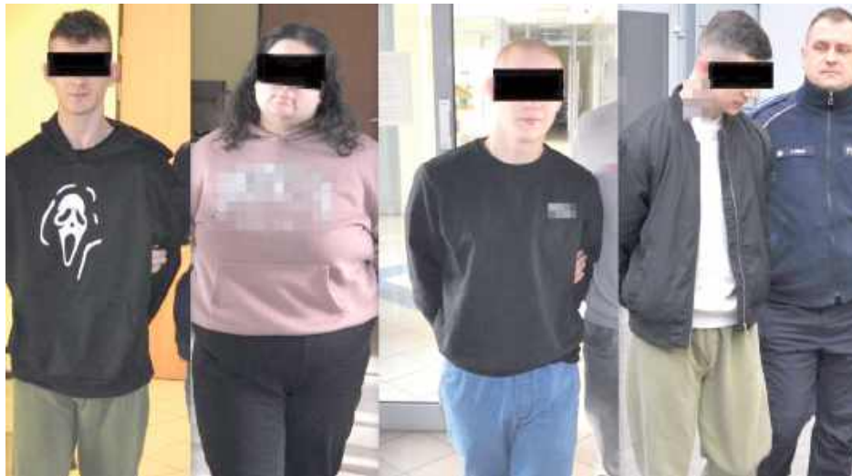
Aresztowane zostały zatrzymane cztery młode osoby w wieku od 18 do 25-lat

Policjanci ujawnili narkotyki. Dodatkowo ustalili, że z mieszkania pary wywieźli je dwaj ich koledzy w wieku 18 i 21-lat. Na terenie gminy Wołyń zatrzymali osobowe Renault. W jego wnętrzu ujawnili środki odurzające. Zabezpieczyli łącznie ponad