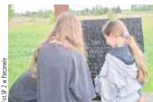
Żołnierz poległ w walce z okupantem niemieckim 28 czerwca 1944 r. w Parczewie

- Przy pomniku upamiętniającym jego postać zapaliliśmy znicze i uczciliśmy jego pamięć chwilą ciszy. To ważne, aby pielęgnować pamięć o tych, którzy