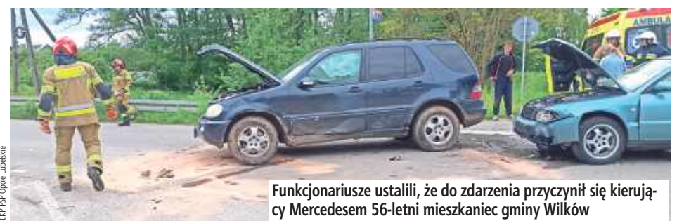
Funkcjonariusze ustalili, że do zdarzenia przyczynił się kierujący Mercedesem 56-letni mieszkaniec gminy Wilków

Funkcjonariusze ustalili, że do zdarzenia przyczynił się kierujący Mercedesem 56-letni mieszkaniec gminy Wilków. Mężczyzna, skręcając w lewo na skrzyżowaniu oznaczonym znakami określającymi pierwszeństwo przejazdu, nie ustąpił pierwszeństwa przejazdu i wjechał na skrzyżowanie