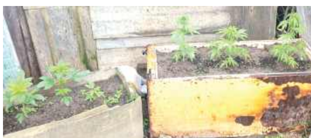
Funkcjonariusze zatrzymali 25-letniego mieszkańca powiatu zwoleńskiego. Trafił on do policyjnego aresztu, a następnie usłyszał zarzut popełnienia przestępstwa uprawy konopi indyjskich

Konopie były w różnych fazach rozwojowych, a najwyższe osiągały wysokość blisko 50 centymetrów.