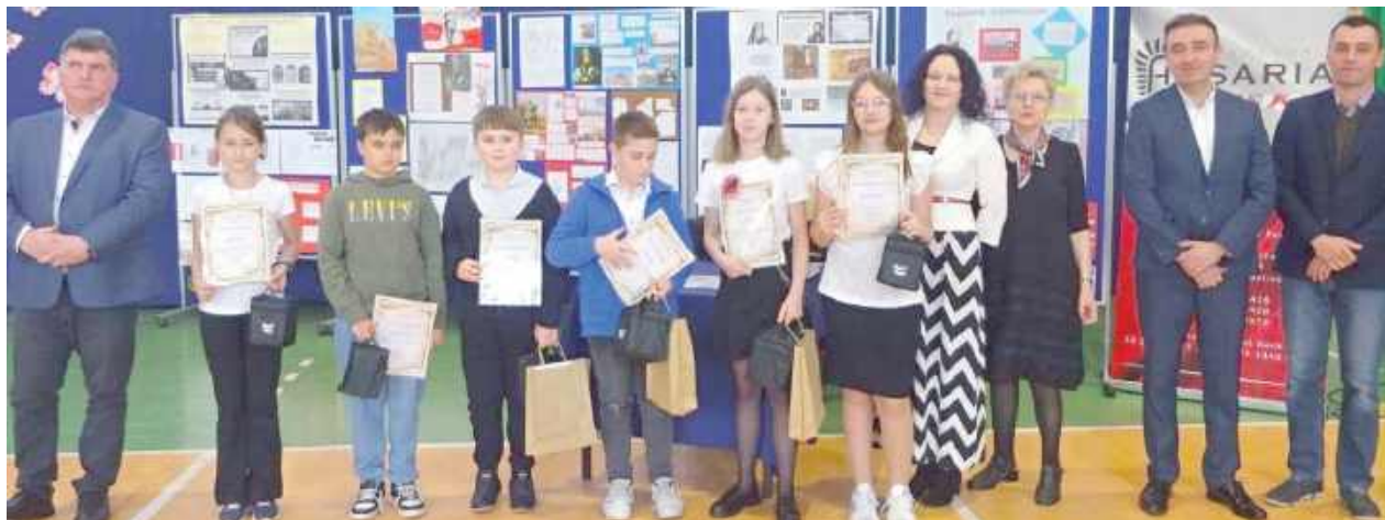
Najlepsi dostali dyplomy i drobne upominki

W SP1 w Parczewie miało miejsce rozstrzygnięcie konkursu plastyczno-historycznego „Tadeusz Kościuszko i jego czasy”.