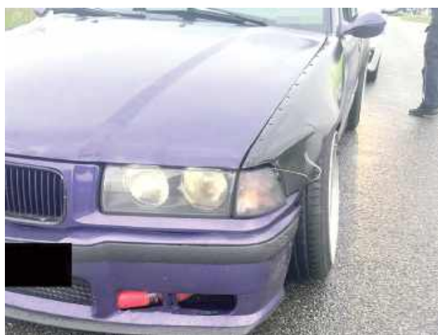
Policjanci zatrzymali dowód rejestracyjny pojazdu za zły stan techniczny. Ponadto kierujący został ukarany wysokim mandatem karnym w kwocie 3000 złotych, a także zakazano mu dalszej jazdy i dlatego pojazd dalszą podróż kontynuował na lawecie

- Przypuszczenia policjantów się potwierdziły. Podczas kontroli ujawnili liczne nieprawidłowości dotyczące stanu technicznego pojazdu. W samochodzie dokonano kilku zmian konstrukcyjnych w tym elementów nadwozia, układu wydechowego, układu zawieszenia oraz pasów bezpieczeństwa - informuje aspirant Łukasz Filipek, oficer prasowy KPP w Rykach.