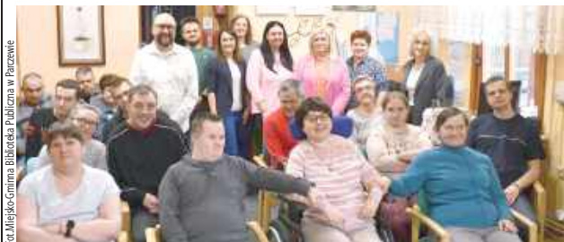
Parczew: Biblioterapia pod hasłem „Wielki Maj” została zorganizowana w Warsztacie Terapii Zajęciowej CARITAS w Parczewie.