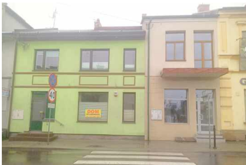
Ul. Warszawska w Parczewie: w zielonym budynku był sklep z odzieżą damską, w tym środkowym z obuwiem, natomiast w tym na rogu była moda męska

Z dokumentu dowiadujemy się, gdzie występują niekorzystne zjawiska społeczne. Teren został nazwany mianem „obszaru zdegradowanego”.