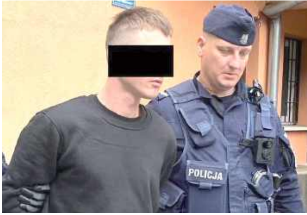
27-latek usłyszał już zarzuty, ale może być ich więcej, bo sprawa jest rozwojowa

Tuż przed świętami Wielkanocnymi mieszkańcy powiatu puławskiego zaczęli odbierać dziwne telefony, z których wynikało, że ktoś z ich bliskich spowodował poważny wypadek i konieczne jest wpłacenie kaucji. Do komendy policji w Puławach zaczęły napływać sygnały o próbach oszustwa. Tego dnia przestępcy zadzwonili również do mieszkanki Puław.