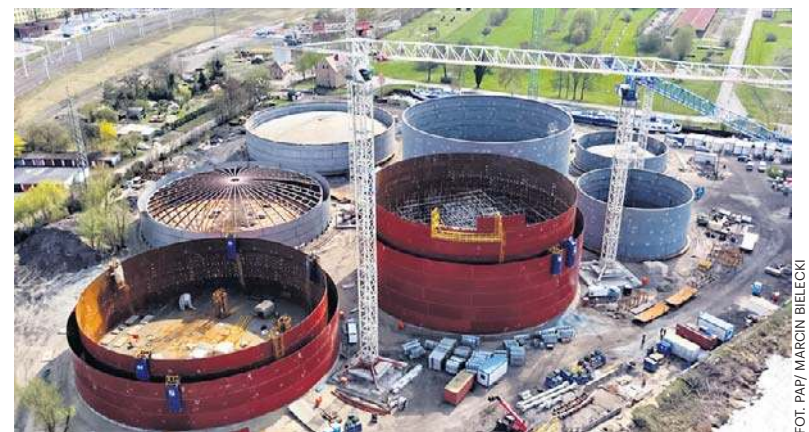
Plac budowy bazy paliw w szczecińskich Podjuchach – inwestycja wzbudza ogromne kontrowersje i sprzeciw mieszkańców