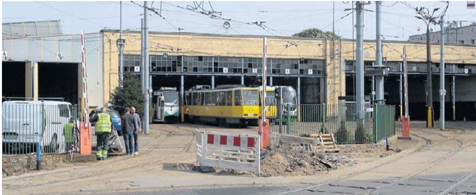
Zajezdnia Gołecin - to m.in. tego miejsca dotyczą skargi pracowników i doniesienia o napiętej atmosferze w Tramwajach Szczecińskich

W Głosie Szczecińskim jedna z motorniczych skarżyła się na trudną atmosferę pracy. Wskazywała m.in. na stres, drwiny ze strony współpracowników oraz - jej zdaniem - niewystarczające wsparcie ze strony przełożonych. W mate-