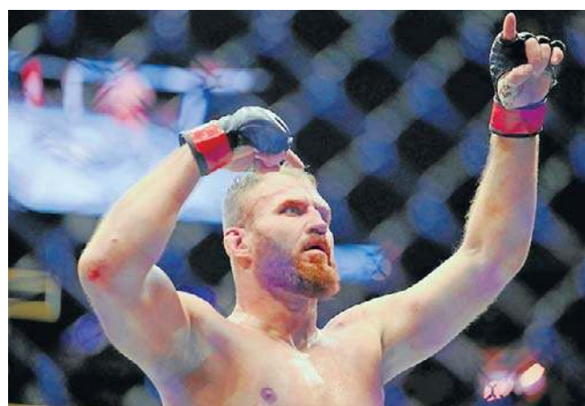
Jedyny polski mistrz UFC w historii - Jan Błachowicz wsparł fundację Cancer Fighters i... zgolił włosy

- Operacja za nami. Teraz czas na rehabilitację i wracam na matę - poinformował Jan