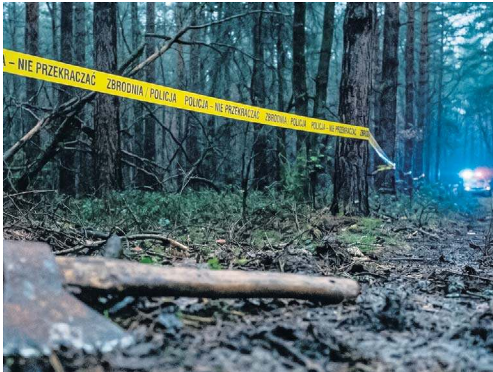
Mordercy ucięli swojej ofierze siekierą głowę i dłonie. Sąd właśnie wydał na nich wyrok