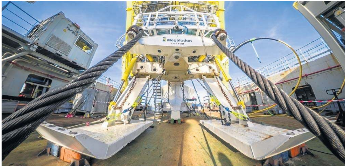
Specjalistyczny statek Boka Falcon wytyczył trasy kablowe na farmie Baltica 2

Zakończenie prac na trasach kabli wewnętrznych oznacza, że zamykamy kluczowy etap przygotowania dna pod połączenia między turbinami. To ważny kamień milowy, ponieważ jakość wyko-