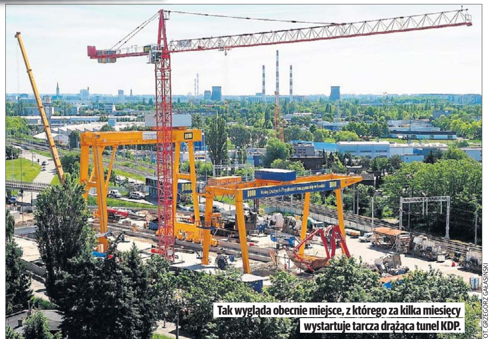
Tak wygląda obecnie miejsce, z którego za kilka miesięcy wystartuje tarcza drążąca tunel KDP.