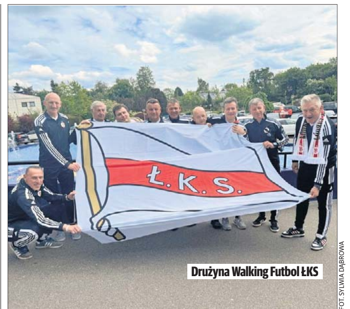
Drużyna Walking Futbol ŁKS