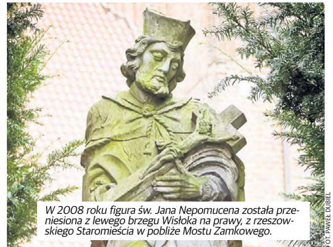
W 2008 roku figura św. Jana Nepomucena została przeniesiona z lewego brzegu Wisłoka na prawy, z rzeszowskiego Staromieścia w pobliżu Mostu Zamkowego.

Bardzo możliwe, że książę poszukiwał pieniędzy na swoje zbyt krótkie życie i pożyczął je właśnie u Żydów. Potem - jak to zwykle bywa - trudno mu było pożyczone kwoty oddać, w dodatku z wysokimi odsetkami. Ponoć przez kilka lat książę Franciszek chorował