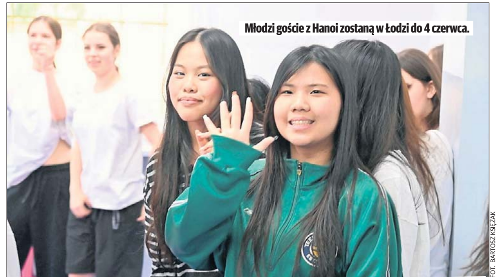
Młodzi goście z Hanoi zostaną w Łodzi do 4 czerwca.

Goście odwiedzą także najważniejsze miejsca w Łodzi - m.in. Pałac Poznańskiego i Muzeum Miasta Łodzi, Manufakturę, Księży Młyn i Uniwersytet Łódzki. W programie jest