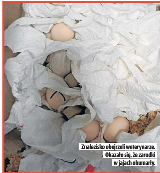
Znalezisko obejrżeli weterynarze. Okazało się, że zarodki w jajach obumarły.

Wezwani weterynarze orzekli, że to prawdopodobnie jaja chronionych gadów - kajmana i żółwia. Niestety, z powodu skrajnie warunków przewozu, zarodki w jajach były martwe.