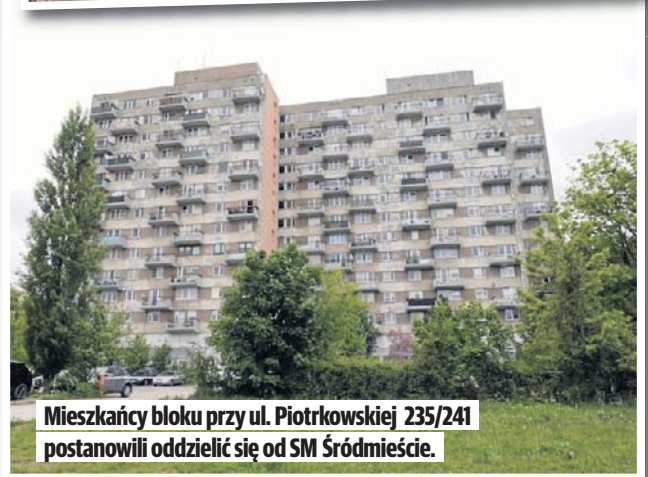
Mieszkańcy bloku przy ul. Piotrkowskiej 235/241 postanowili oddzielić się od SM Śródmieście.

dla owadów, nowe ławeczki i ścieżki. Przydałoby się także dosypać dobrej ziemi, bo na terenie spółdzielni pod cienką warstwą ziemi jest glina.