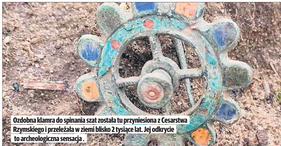
Ozdobna klamra do spinania szat została tu przyniesiona z Cesarstwa Rzymskiego i przeleżała w ziemi blisko 2 tysiące lat. Jej odkrycie to archeologiczna sensacja.

Ekspozycję można oglądać w budynku archeologii Muzeum Okręgowego na Wyspie Młyńskiej, ul. Mennica 2 w Bydgoszczy do końca czerwca.