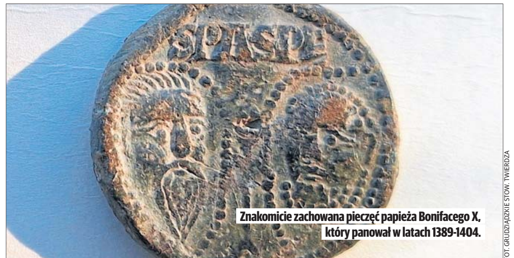
Znakomicie zachowana pieczęć papieża Bonifacego X, który panował w latach 1389-1404.