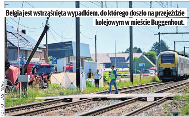
Belgia jest wstrząśnięta wypadkiem, do którego doszło na przejeździe kolejowym w mieście Buggenhout.

- Ramy współpracy Quad w sferze minerałów krytycznych będą pomagały nam wykorzystywać narzędzia polityki ekonomicznej i koordynować inwestycje, aby wzmocnić łańcuchy dostaw minerałów krytycznych, łącznie z ich wydobyciem i przetwarzaniem, a także recyklingiem - oświadczył Rubio.