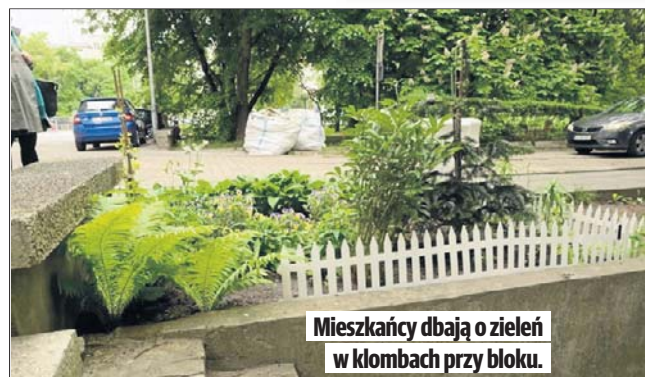
Mieszkańcy dbają o zieleni w klombach przy bloku.

Mieszkańcy wieżowca przy ul. Piotrkowskiej 235/241 uchwałą o wydzieleniu się ze SM Śródmieście podjęli w 2020 r. Ale na sfinalizowanie sprawy czekali do lipca ubiegłego roku. Wydzielili się, bo - choć płacili bardzo wysokie czynsze - mieli poczucie, że ich blok był traktowany przez Spółdzielnię Mieszkaniową Śródmieście po macoszemu. Po wydzieleniu się czynszu nie obniżyli, bo chcą zainwestować w remonty. Dlatego ogród robiony jest po gospodarsku - przez ochotników i bez wydawania pieniędzy ze wspólnej kasy.