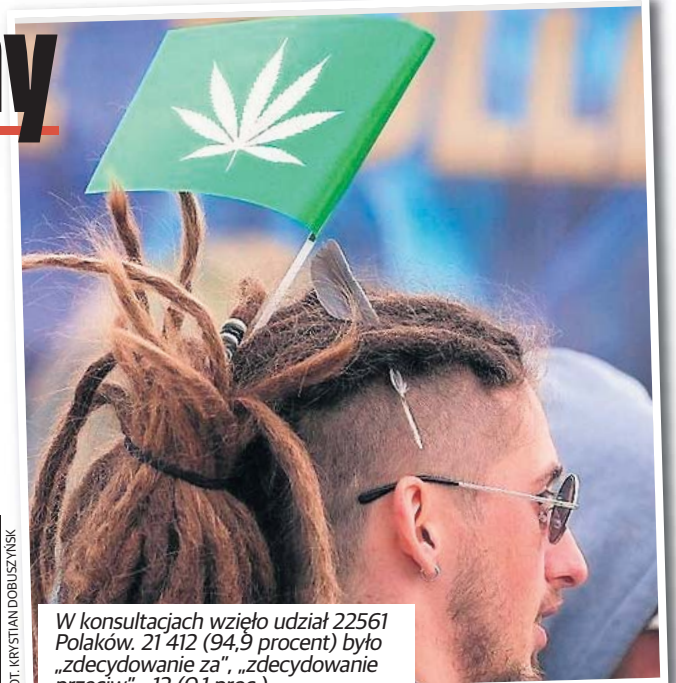
W konsultacjach wzięło udział 22561 Polaków. 21 412 (94,9 procent) było „zdecydowanie za”, „zdecydowanie przeciw” - 12 (0,1 proc.).

„Mo-del represyjny skutkuje stygmatyzacją, utrudnieniami na rynku pracy (wpisy