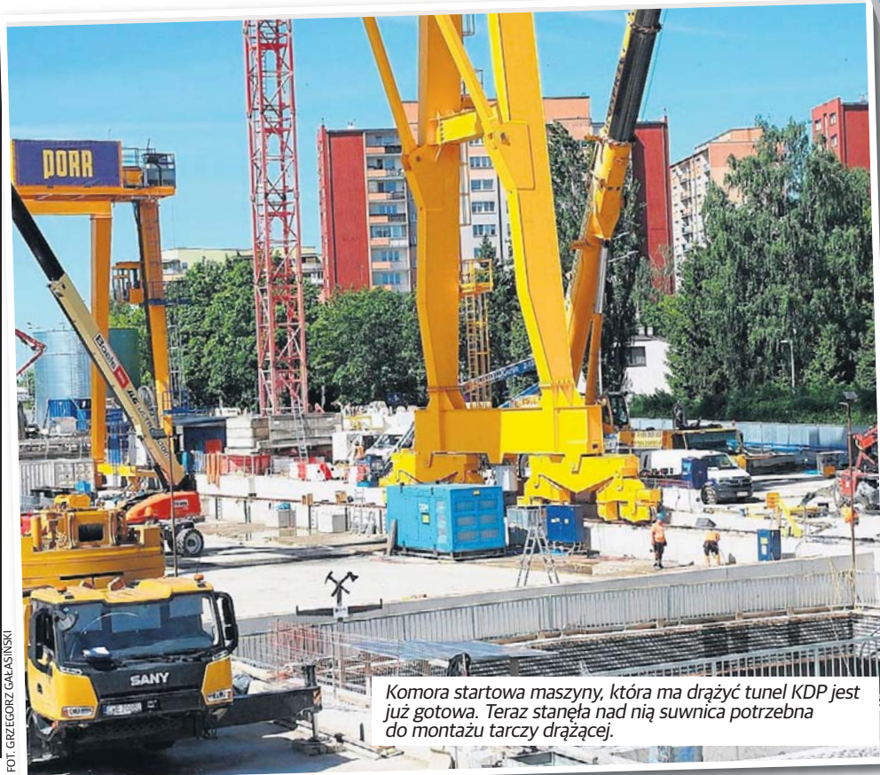
Komora startowa maszyny, która ma drążyć tunel KDP jest już gotowa. Teraz stanęła nad nią suwnica potrzebna do montażu tarczy drążącej.