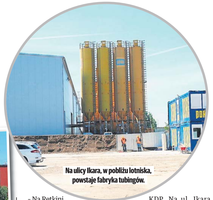
Na ulicy Ikara, w pobliżu lotniska, powstaje fabryka tubingów.

- Na Retkini została ustawiona suwnica, która będzie przenosiła ciężkie, ważące nawet do 450 ton elementy tarczy i opuszczała je do komory, w której będzie montowana maszyna drążąca tunel - wyjaśnia Dagmara Zawadzka. - Obecnie ok. 90 proc. części jest już na placu budowy, kolejne będą sukcesywnie dostarczane. Montaż maszyny rozpocznie się na przełomie czerwca i lipca, a gotowa do pracy będzie pod koniec bieżącego roku. Rozpoczęcie drążenia tunelu planujemy na początek 2027 roku.