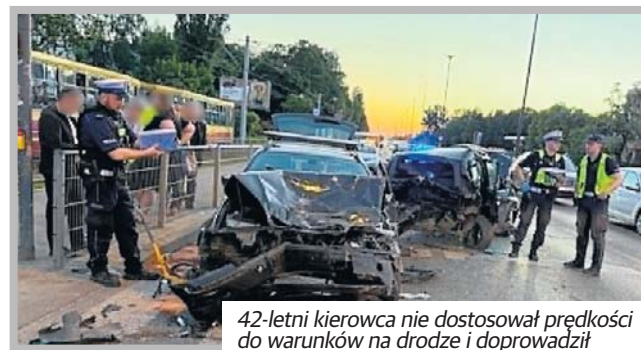
42-letni kierowca nie dostosował prędkości do warunków na drodze i doprowadził do zderzenia siedmiu aut.

Ubezpieczyciel wypłaci odszkodowania wszystkim właścicielom 6 uszkodzonych aut oraz pokryje koszty leczenia rannych, jednak z racji stanu nietrzeźwości sprawcy, zwróci się do niego z żądaniem całkowitego zwrotu wypłaconych środków. Przy karambolu aż 7 aut kwoty te mogą sięgać setek tysięcy złotych.