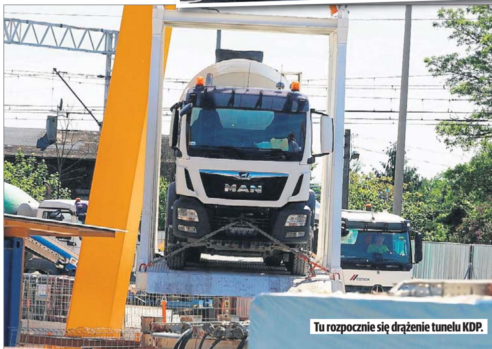
Tu rozpocznie się drążenie tunelu KDP.

Tubingi stabilizują grunt, zabezpieczają też tunel przed zawaleniem. Muszą więc być bardzo wytrzymałe. Tubingi pozostają w tunelu „na zawsze” stanowiąc jego ściany, strop i spąg jednocześnie. Na kilometr tunelu dwutorowego wchodzi średnio 4500 tubingów, łatwo więc wyliczyć że na całą jego długość będzie potrzebne ok. 20 tys. tych betonowych elementów.