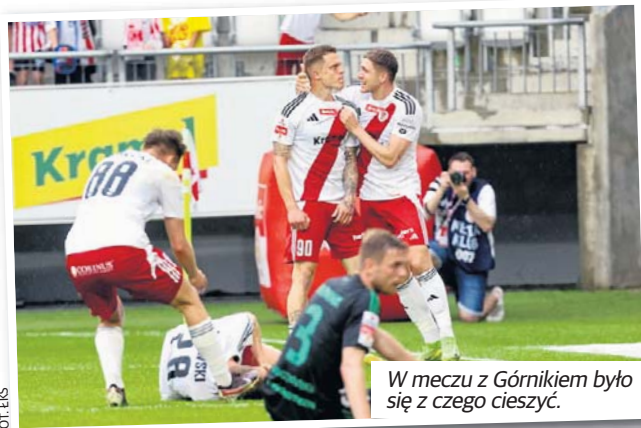
W meczu z Górnikiem było się z czego cieszyć.