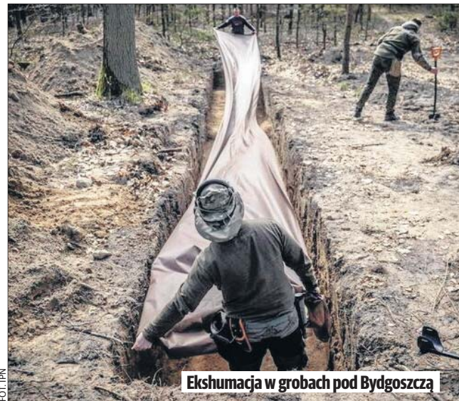
Ekshumacja w grobach pod Bydgoszczą

Za mogiły posłużyły polskie umocnienia polowe, które Wojsko Polskie na tym terenie