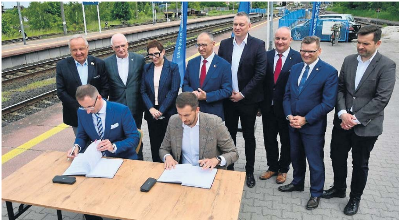
Podpisana umowa dotyczy opracowania projektu wraz z pozwoleniem na budowę dwóch łącznic

LUBUSKIE CHODZI O DUŻE PIENIĄDZE I OGROMNĄ INWESTYCJĘ