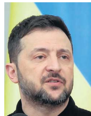
Zelenski sprzeciwia się niemieckiej propozycji

List został skierowany w piątek do przewodniczącego Rady Europejskiej Antonia Costy, przewodniczącej Komisji Europejskiej Ursuli von der Leyen i pre-