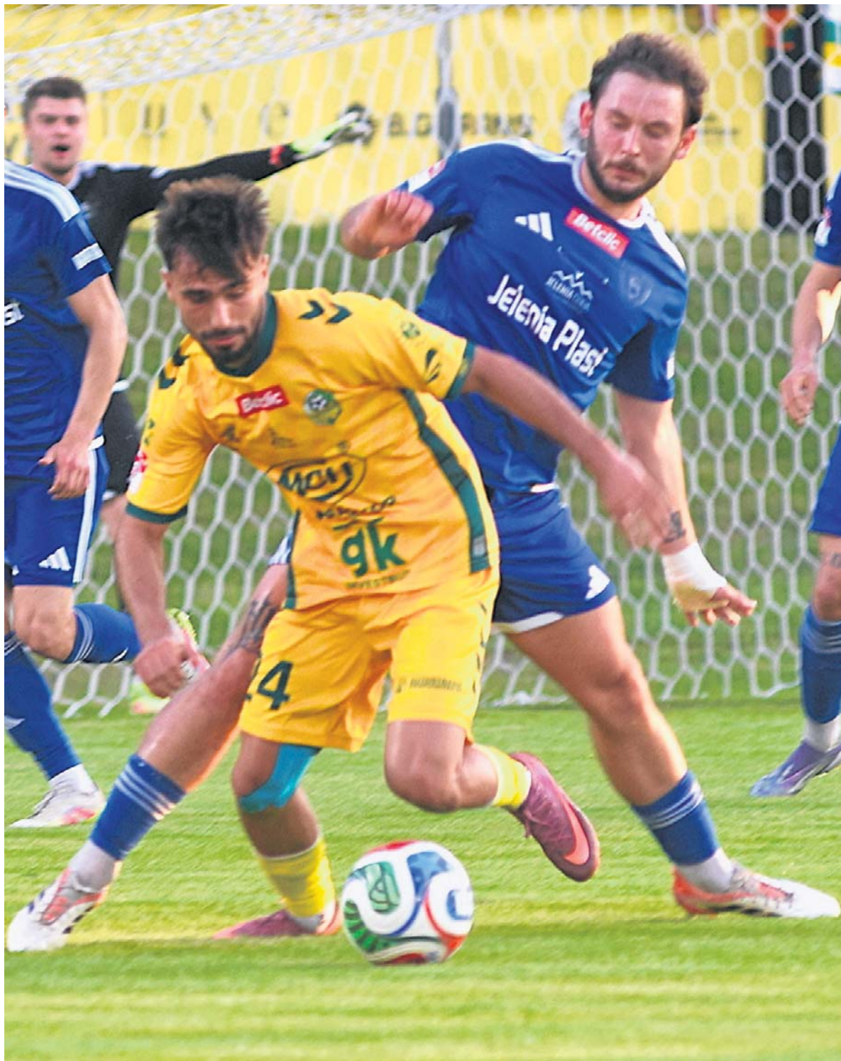
FOT. MARIUSZ KAPALA

Piłkarze Lechii Zielona Góra już pukają do bram II ligi. Awans mają w garści. Sukces najpewniej przypieczętują w najbliższą sobotę STR. 17