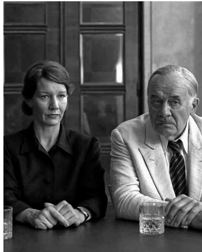
W głównych rolach wystąpili niemieccy aktorzy: Sandra Hüller i Hanns Zischler

Choć akcja filmu toczy się w powojennych Niemczech, zdecydowana większość zdjęć powstała w Polsce. Filmowe plany ulokowano we Wrocławiu, Legnicy, Wałbrzychu i Zgorzelcu, Bielsku-Białej i Cieszynie, a także w Sławikowie, małej wiosce w gminie Rudnik.