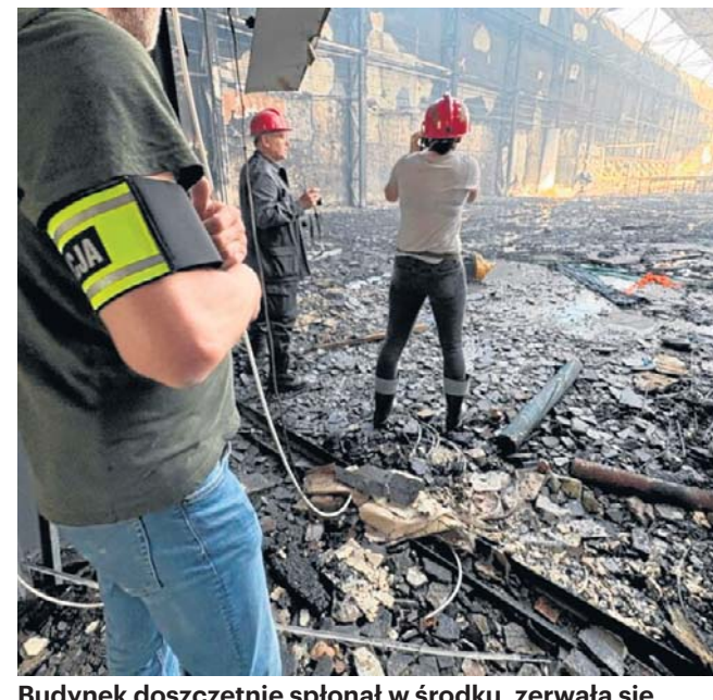
Budynek doszczętnie spłonął w środku, zerwała się także część jego dachu

Straży Pożarnej wydała pilny apel do mieszkańców pobliskich osiedli o bezwzględne pozamykanie okien i ograniczenie wychodzenia