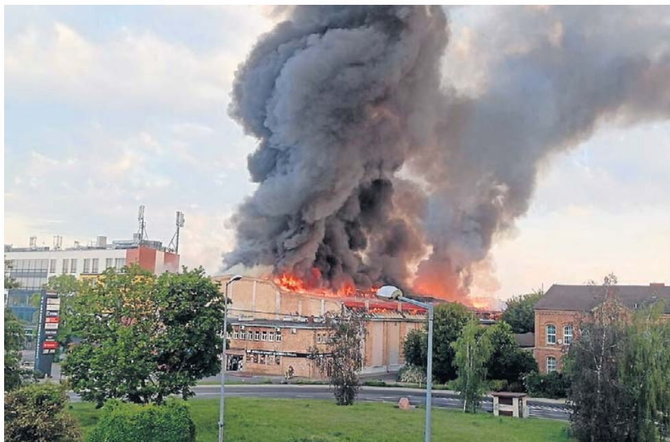
Wielki słup dymu widoczny był kilka kilometrów od Gorzowa

- Pierwsi strażacy zastali w pełni rozwinęty pożar. Ogień