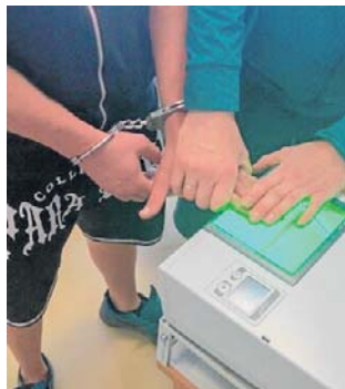
Mężczyźni z narkotykami zostali zatrzymani

Całej trójce grozi kara do 3 lat więzienia.