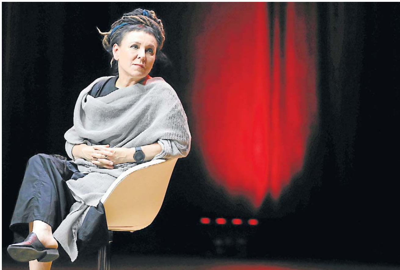
Olga Tokarczuk już raz podpadła opinii publicznej twierdząc, że „Literatura nie jest dla idiotów. Żeby czytać książki, trzeba mieć jakąś kompetencję, trzeba mieć pewną wrażliwość, pewne rozeznanie w kulturze”