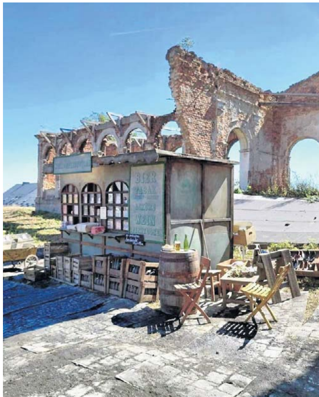
Ruiny pałacu w Sławikowie w powiecie raciborskim latem ubiegłego roku były planem filmu „Fatherland”

„Fatherland” jest jednym z 22 filmów, które znalazły się w tegorocznym konkursie festiwalu filmowego w Cannes. Po projekcji nagrodzono go 6-minutową owacją na stojąco. Obraz Pawlikowskiego od razu został okrzyknięty jednym z fa-