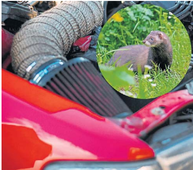
Zwierzęta coraz śmiej pojawiają się na osiedlowych parkingach

Choć kuna domowa wygląda niepozornie, dla właścicieli aut może być prawdziwym utrapieniem. Zwierzęta najczęściej przegryzają przewody zapłonowe, kable elektryczne i gumowe węże znajdujące się