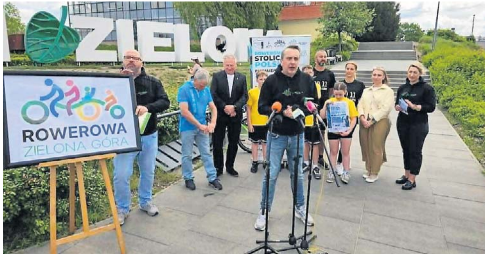
Rok temu Zielona Góra zajęła drugie miejsce wśród miast 100-200-tysięcznych

- Zachęcam wszystkich mieszkańców do pobrania aplikacji Aktywne Miasta i włącze-