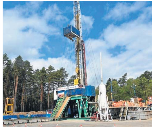
6 maja spółka zorganizowała spotkanie z okazji rozpoczęcia następnego etapu wierceń

Komisja Nadzoru Finansowego postanawia, co następuje: zatwierdza się prospekt w formie jednolitego dokumentu Lumina Metals Corp. z siedzibą w Vancouver, Kolumbia Brytyjska, Kanada, sporządzony w związku z zamiarem ubiegania się o dopuszczenie do obrotu na rynku regulowanym 107 820 274 istniejących akcji zwykłych bez wartości nominalnej oraz do 4 874 550 akcji zwy-