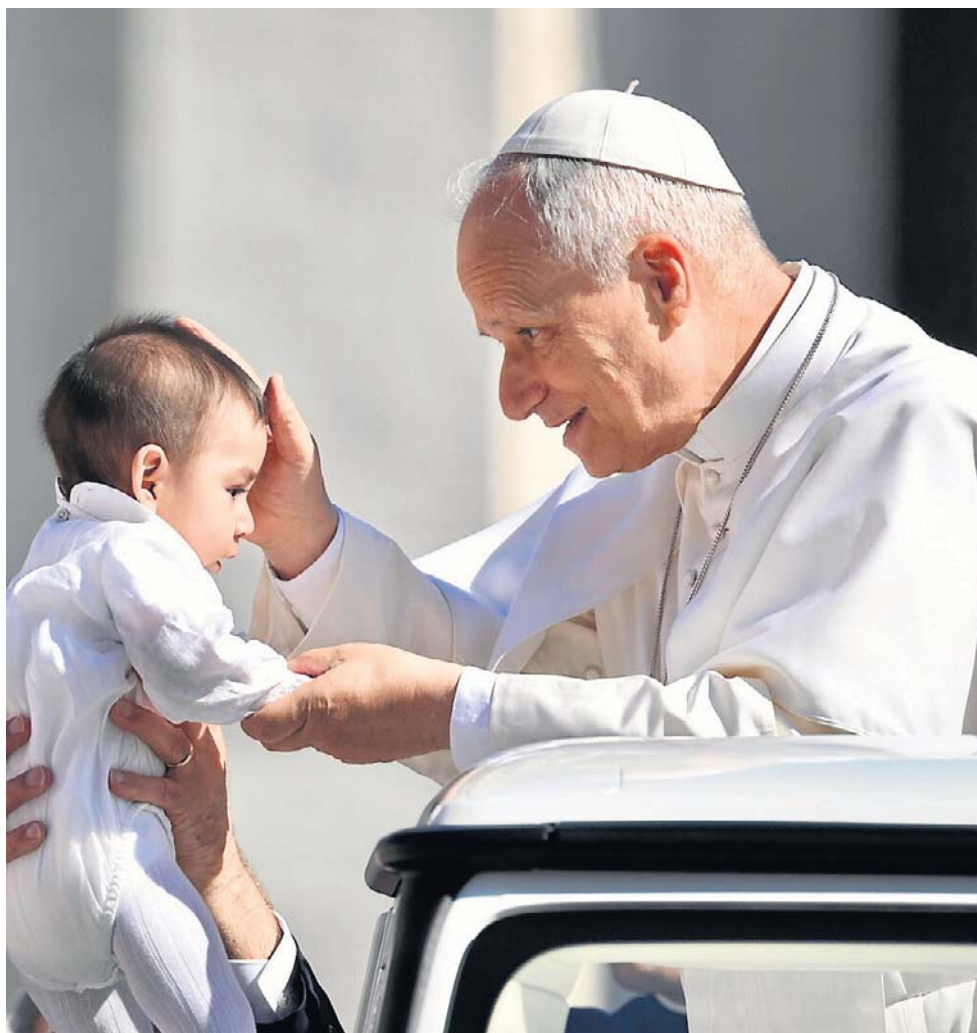
Kulminacją pobytu w Baarcelonie będzie msza św. w bazylice Sagrada Familia, połączona z inauguracją wieży Jezusa Chrystusa

Nawiązuje do tego logo wizyty Ojca Świętego w Hiszpanii: