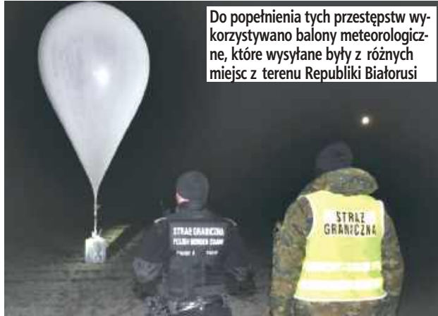
Do popełnienia tych przestępstw wykorzystywano balony meteorologiczne, które wysyłane były z różnych miejsc z terenu Republiki Białorusi

Na terenie powiatu bialskiego działała zorganizowana grupa przestępcza, która zajmowała się przemytem papierosów z terytorium Białorusi do Polski przy wykorzystaniu balonów meteorologicznych. Sąd zastosował wobec pięciu podejrzanych tymczasowe aresztowanie.