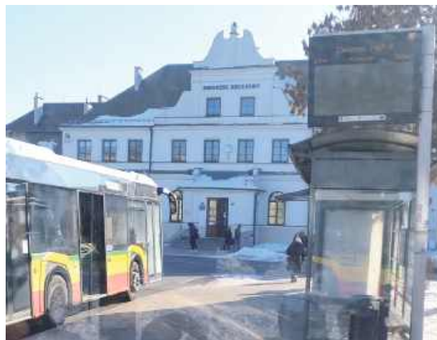
Po wprowadzeniu autobusów elektrycznych wskazane byłoby także zadbanie o informację elektroniczną w Białej Podlaskiej

Chłodny umysł jest dobry u ludzi. Elektronika jednak fiksuje na mrozie. Tablice elektroniczne na białskich przystankach najczęściej nie wyświetlały żadnych danych. Na jednej