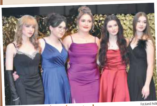
Panie prezentowały się olśniewająco!