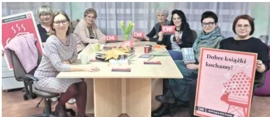
Biblioteka już zapowiada kolejne spotkanie – w lutym Dyskusyjny Klub Książki poświęcony będzie twórczości Sylwii Kubik

Uczestniczki zgodnie podkreślały, że jego książki wciągają od pierwszych stron i nie pozwalają przejść obojętnie obok trudnych tematów. Podczas rozmów zwrócono uwagę na to, jak sprawnie Moss łączy wartką akcję z aktualnymi problemami społecznymi: samotnością, przemocą, hejtem, presją otoczenia czy mechanizmami manipulacji.