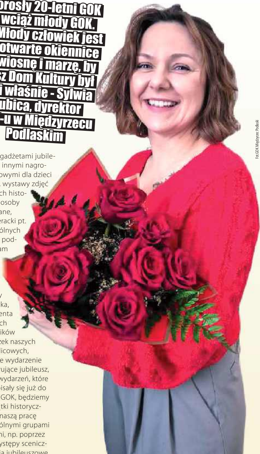
Fac.GOK Międzyrzec Podlaski

konkursy z gadżetami jubileuszowymi i innymi nagrodami rzeczowymi dla dzieci i dorosłych, wystawy zdjęć obrazujących historię GOK-u i osoby z nią związane, konkurs literacki pt. „20 lat wspólnych opowieści”, podcast, program grantowy dla młodzieży, urodzinowy dzień dziecka, bal absolwenta dla dorosłych już uczestników i uczestniczek naszych zajęć świetlicowych, listopadowe wydarzenie podsumowujące jubileusz, a podczas wydarzeń, które na stałe wpisały się już do kalendarza GOK, będziemy wplatać wątki historyczne i łączyć naszą pracę z poszczególnymi grupami społecznymi, np. poprzez wspólne występy sceniczne. Działania jubileuszowe