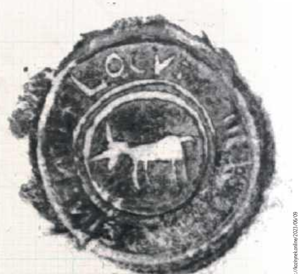
Pieczęć Radzyna z XVIII wieku