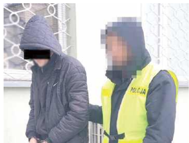
Amatorom cudzego mienia grozi kara do 5 lat pozbawienia wolności

- Kierowca samochodu marki BMW zatankował auto, po tym odjechał, nie uiszczając opłaty. Sytuacja powtórzyła się po kilku dniach na tej samej stacji.